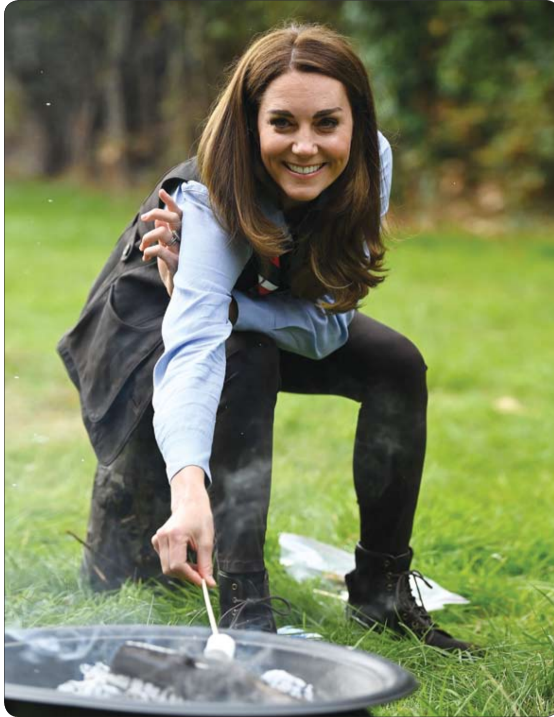
كاثرين دوقة كامبريدج، تحمص أعشاب من الفصيلة الخبازية أثناء زيارتها لمجموعة ساكوت في نورثولت، شمال غرب لندن.

وتضيف الدكتورة مارينا ماكيشا أن البكتيريا المعوية تنتج الدوبامين والسيروتونين، لذلك غالبا ما يؤدي الخلل في توازن البكتيريا المعوية، إلى الكآبة. لذلك يجب أن يحتوي النظام الغذائي على كمية جيدة من الخضروات المحتوية على الألياف الغذائية والبكتين.