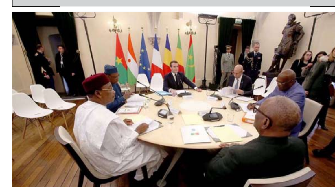
قمة باو استراتيجية واسئلة