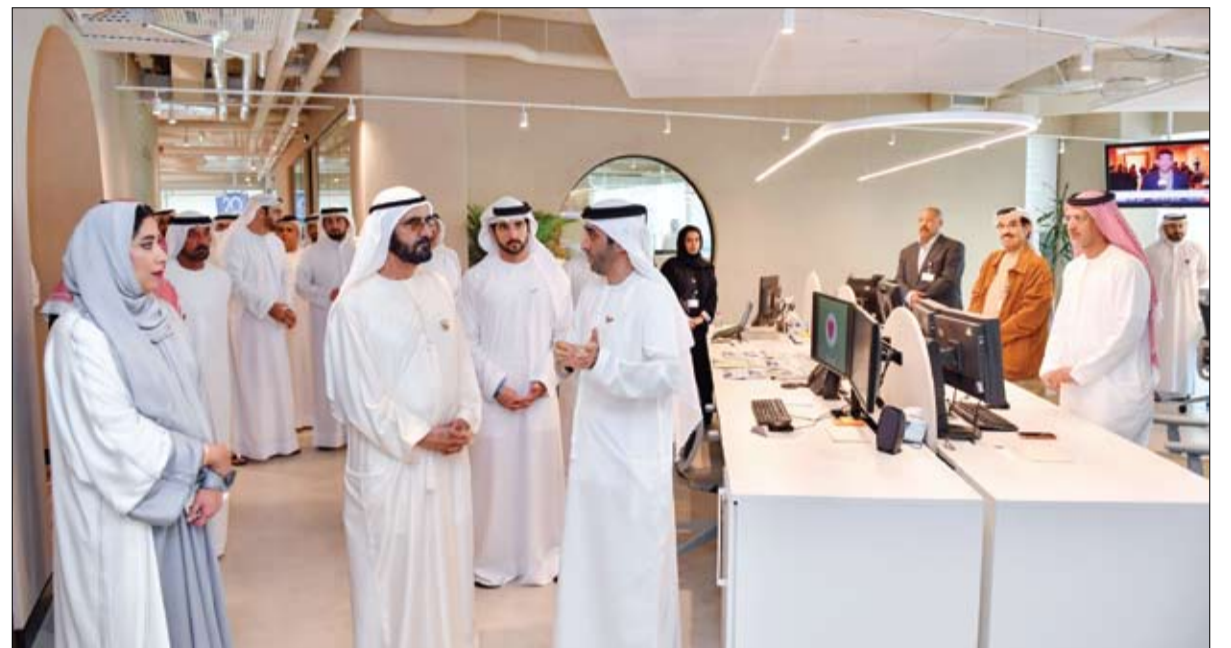
محمد بن راشد خلال تفقده المقر الجديد للمكتب الإعلامي لحكومة دبي