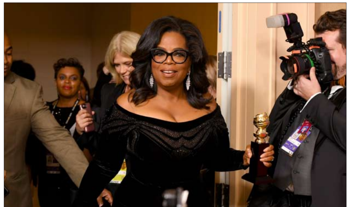
دافعت عنهما أيضاً أوبرا وينفري