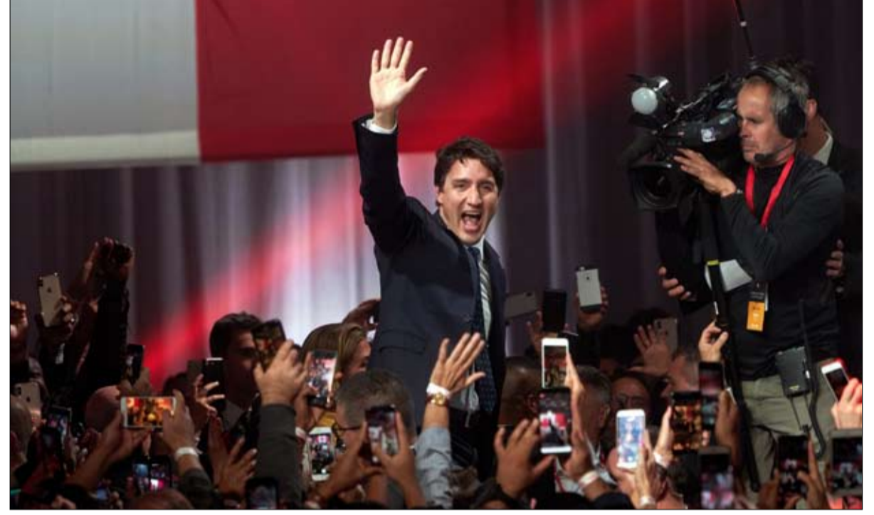
جاستن ترودو يرحب بهما