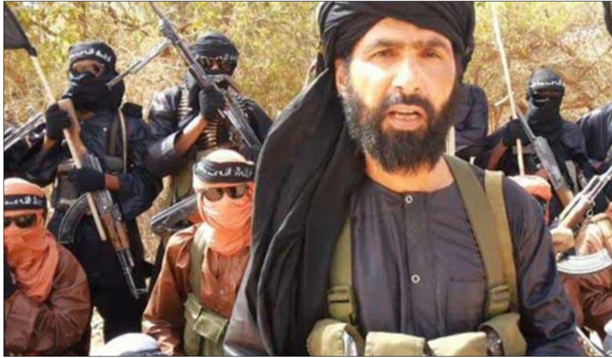
الصحراوي مطلوب حيا أو ميتا

ويتابع كاتب المقال أن الحرب العراقية وفرت - في خلع صدام فضلا عن تفكيك مؤسسات حكمه- فرصة لمجموعات وأحزاب مسلحة كي تستولي ببطء على العراق. وترأس عددا من المجموعات الناشئة شيعة يرتبطون بعلاقات مع إيران وفقوها خلال الحرب الإيرانية - العراقية، وأصبح لهم سلطات رسمية أو شبه رسمية في الحكومة العراقية.