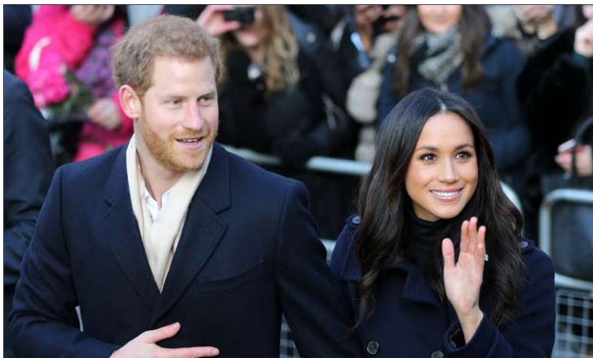
هاري وميغان موسم الهجرة الى كندا