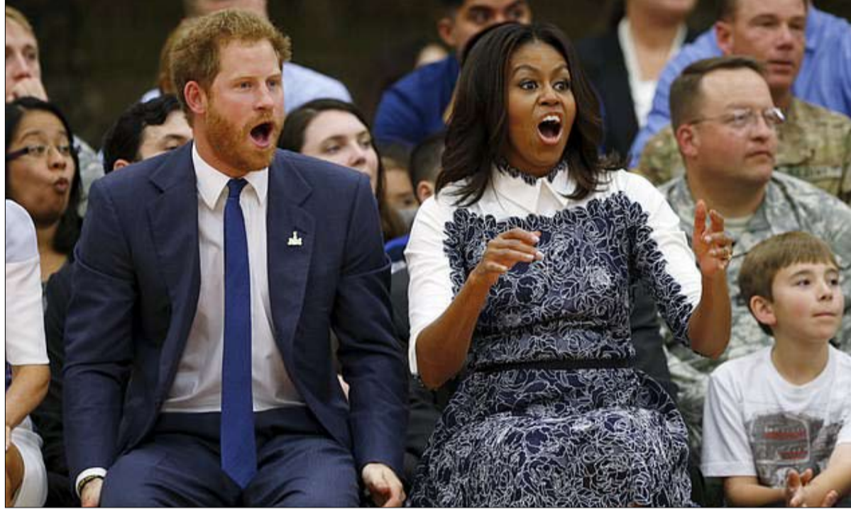
ال اوياما نموذج للدوق والدوقة

أين سيستقر ميغان وهاري خلال إقامتهما في كندا؟ هذا هو السؤال الكبير الذي يثير صخب شبكات