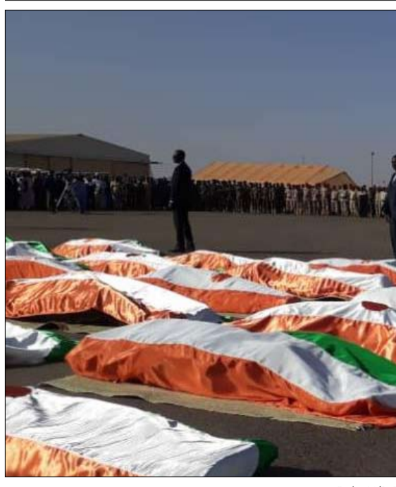
تكتفت الجازر الارهابية في المنطقة