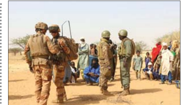
الجيش مطالب بمطالبة بتنازل سريعة

أعلنت السلطات اللبنانية، أمس، إصابة 47 عنصرا من قوى الأمن الداخلي من بينهم أربعة ضباط، فيما جرى توقيف 59 شخصا في الصدامات التي استمرت لخمس ساعات، وسط العاصمة بيروت. وشهدت منطقة الحمرا في بيروت، قرب المصرف المركزي ووزارة الداخلية، صدامات عنيفة استمرت حتى ساعات الفجر بين المتظاهرين وقوة من أفراد مكافحة الشغب. وأوضحت قوى الأمن أن المتمركزين أمام المصرف المركزي قاموا برمي الحجارة والمفرقات على العناصر الأمنية، كما أزالوا العوائق الخشبية وكسروا غرفة الحراسة أمام المصرف المركزي، محاولين الدخول باتجاه المصرف،