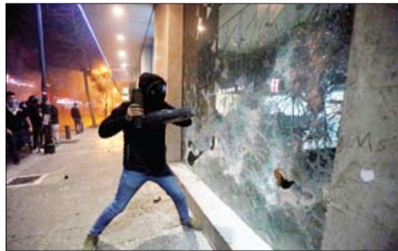
متظاهر يحطم واجهة أحد البنوك في بيروت

سياسيا، قال مسؤول كبير بالأمم المتحدة في لبنان أمس إن السياسيين في لبنان في موقف المتفرح بينما ينهار الاقتصاد وانتقد بشدة النخبة السياسية التي فشلت في تشكيل حكومة في بلد ينزلق أكثر نحو أزمة اقتصادية ومالية.