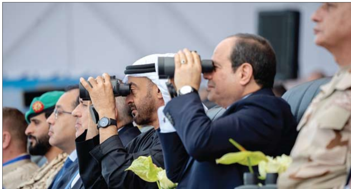
محمد بن زايد والرئيس المصري يشهدان افتتاح قاعدة برئيس العسكرية