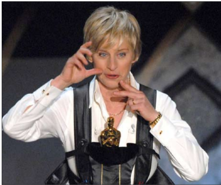
إيلين ديجينيريس تعزى بصدقتهما