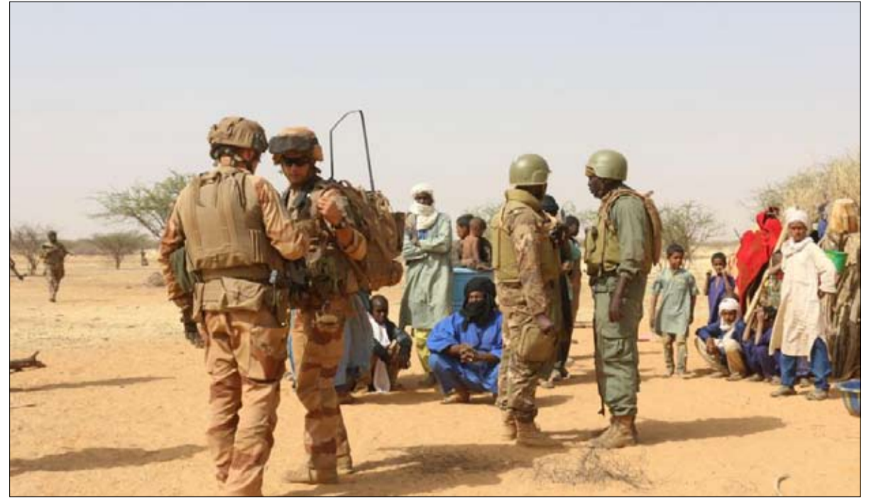
الجيش مطالبة بنتائج سريعة

الإرهابية التي تنشط منذ سبع سنوات في نفس المنطقة، وكان ضحاياها من جميع الجيوش، بما في ذلك الامريكان حيث تذكر منهم الأربعة الذين قتلوا الى جانب الجنود النيجيريين عام 2017.