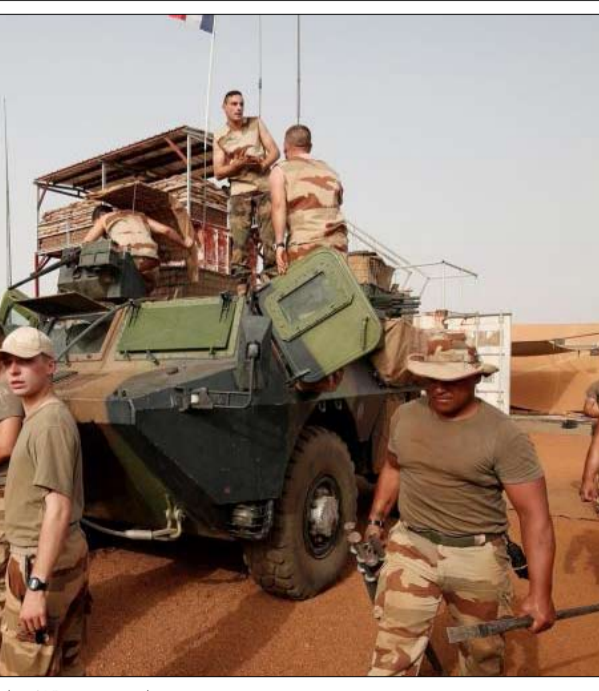
برخان محدودية النجاعة