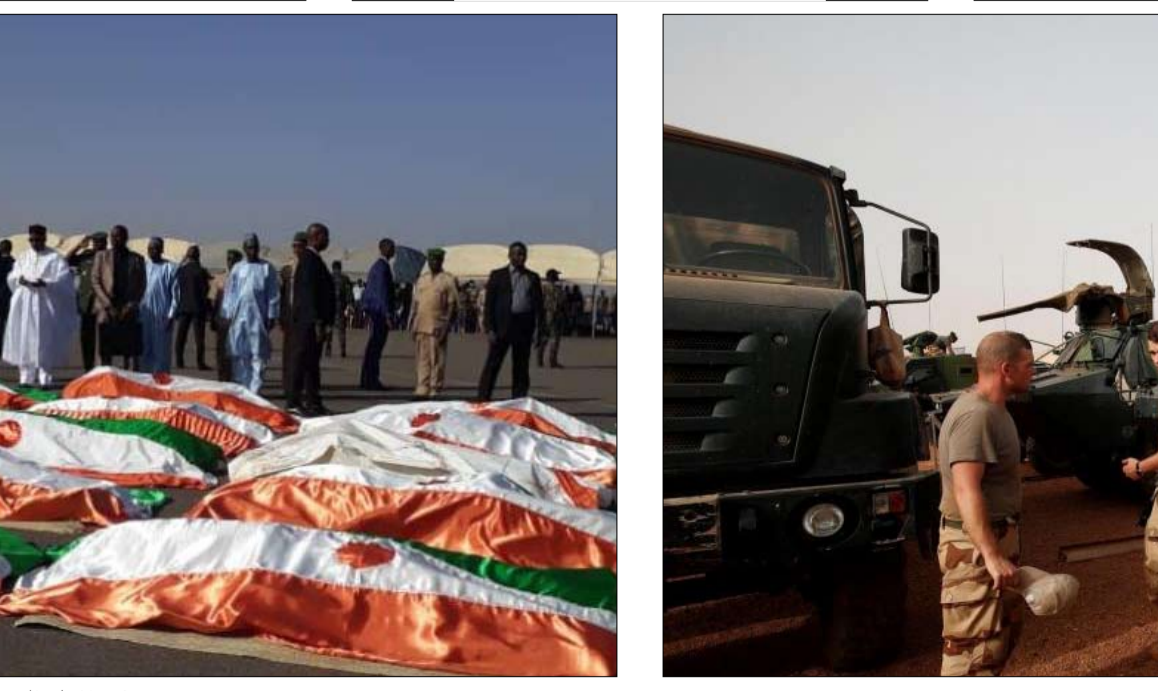
تكتفت الجازر الارهابية في المنطقة