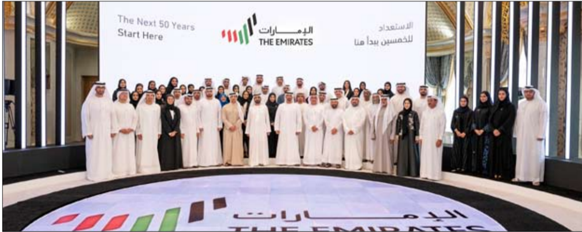
إطلاق الموقع الإلكتروني الجديد للهوية الإعلامية المرئية www.nationbrand.ae

بدأ مكتب الهوية الإعلامية المرئية لدولة الإمارات التابع لمكتب الدبلوماسية العامة في وزارة شؤون مجلس الوزراء والمستقبل مهامه الساعية إلى توحيد وتنسيق نقل قصة الإمارات للعالم، حيث أعلن عن إطلاق الدليل الإرشادي الخاص باستخدام الهوية الإعلامية المرئية للدولة، وإطلاق الموقع الإلكتروني الجديد للدولة www.nationbrand.ae . وعقد شراكات استراتيجية مع الأطراف والجهات ذات الاختصاص وتعزيز التعاون مع القطاع الخاص في دولة الإمارات لتعزيز سمعة الدولة، بالإضافة إلى إدارة وتنفيذ الحملات الإعلامية والترويجية للهوية الموحدة للدولة، والتأكد من اتساق رسالة الهوية الموحدة مع الإمارات السبع.