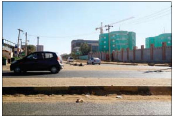
الهدوء يعود إلى مقر جهاز المخابرات السوداني (ا ف ب)

وكشفت في تسجيل مصور نشرته وكالة الأنباء السودانية على يوتيوب، الأربعة، تفاصيل جديدة عن أحداث الليل، وقال إن مجموعة مسلحة من هيئة العمليات دخلت منطقة حقول حديد وسفيان غرب منطقة الفولة.