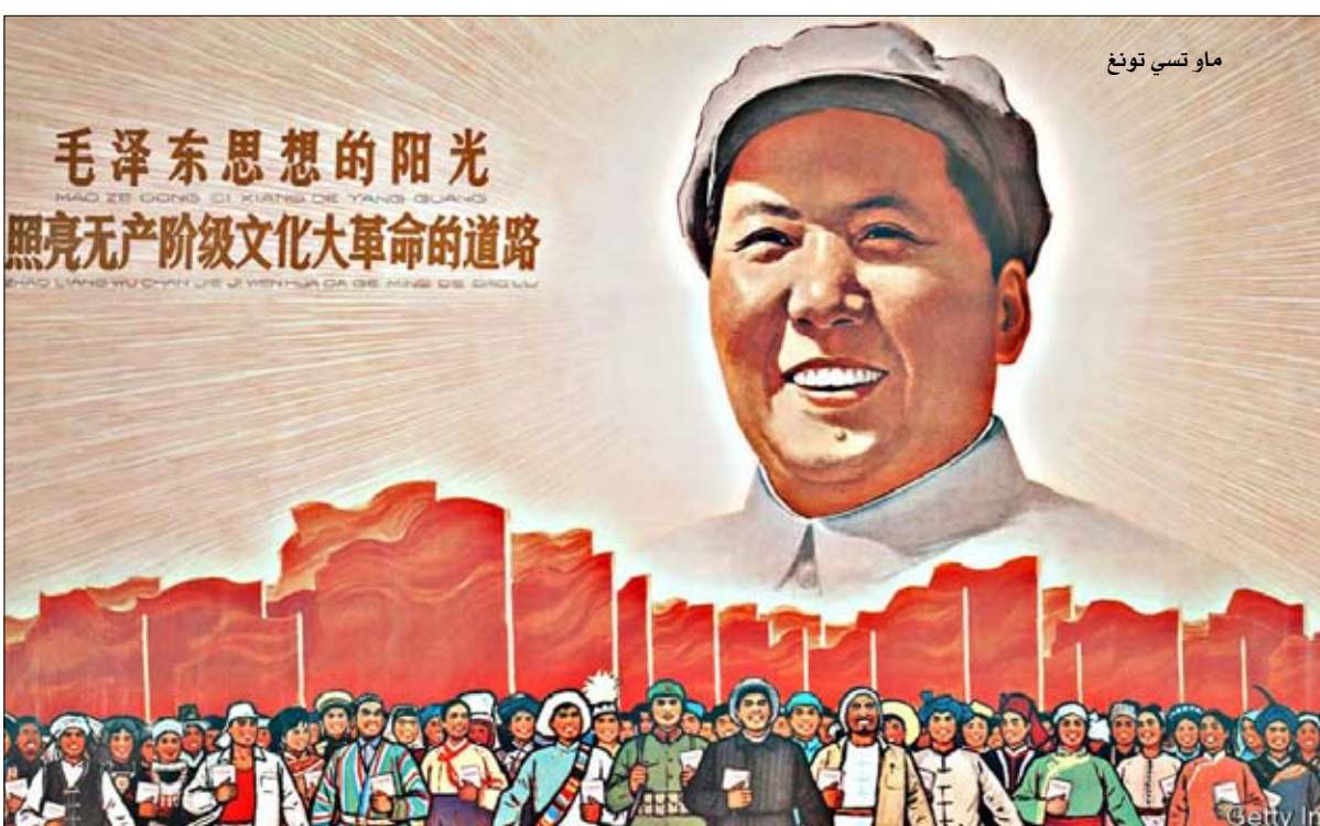
ماو تسي تونغ

هناك ما يحفز السياسيين الجدد على بناء برامج يمكن أن تعري مرة أخرى الناخبين الذين حشدتهم ترامب