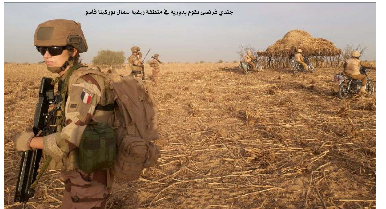
جندي فرنسي يقوم بدورية في منطقة ريفية شمال بوركينا فاسو