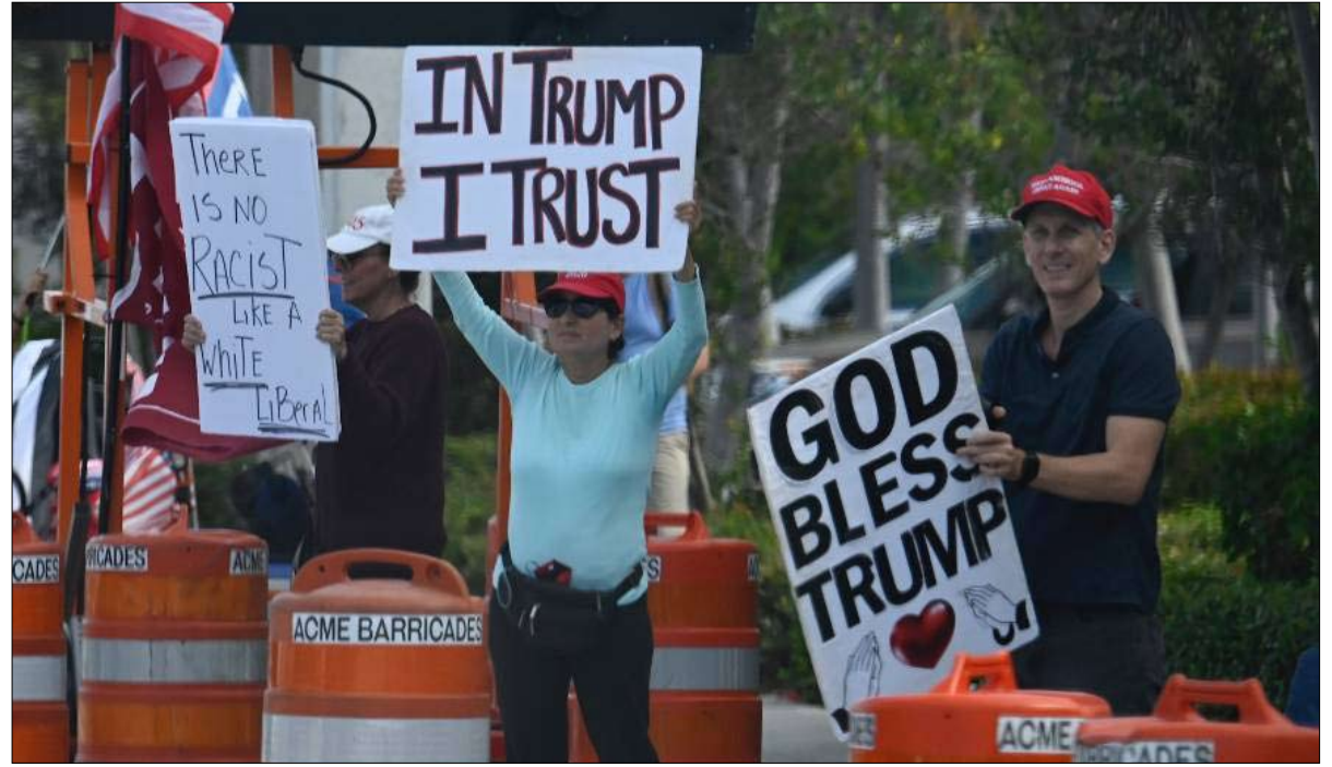
اتباع ترامب المتعصبين

كما حدث في الصين، تبدأ بتدمير هذا الحزب قبل أن تنقذه. وخلاف ذلك، يمكنها تقسيم أصوار الحزب الجمهوري وجذب الترامبيين إلى حزب جديد.