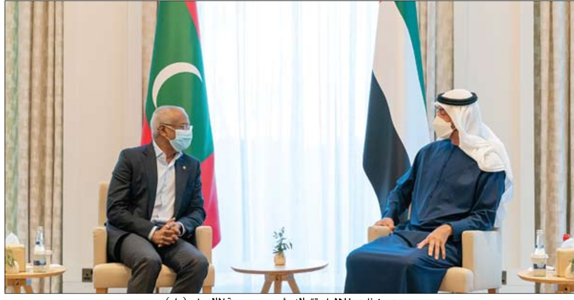
محمد بن زايد خلال استقباله رئيس جمهورية المالديف

التربية: فتح باب التسجيل للالتحاق بمؤسسات التعليم العالي والبعثات الخارجية أعلنت وزارة التربية والتعليم فتح باب التسجيل لطلبة الصف الثاني عشر للعام الدراسي 2020-2021 في جميع مدارس الدولة وكذلك الطلبة المواطنين الدارسين خارج الدولة للالتحاق بمؤسسات التعليم العالي والبعثات الخارجية للعام الجامعي 2021 - 2022. وأوضحت الوزارة أن فتح باب التسجيل للالتحاق بمؤسسات التعليم العالي والبعثات الخارجية يمتد حتى 27 أبريل 2021. أجرت 116.687 فحصا كشفت عن 1.501 إصابة (الصحة) تغلن شفاء 1.746 حالة جديدة من كورونا أبوظبي - وام: