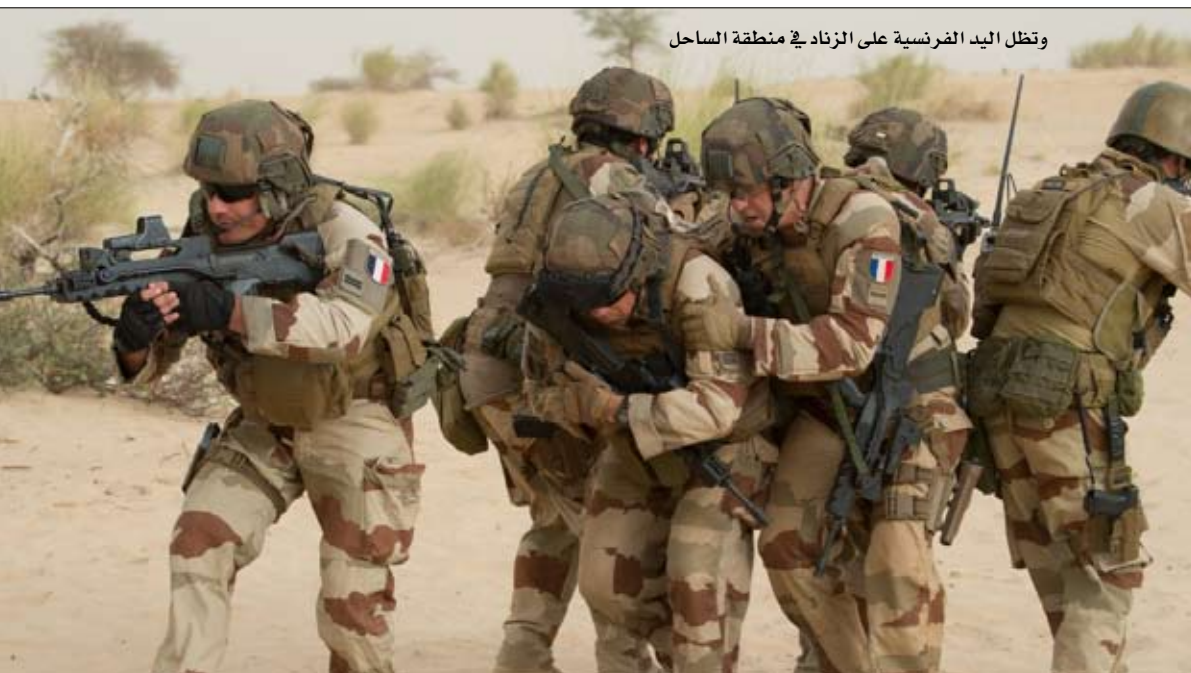
وتظل اليد الفرنسية على الزناد في منطقة الساحل

في انتظار تطوير قوة عسكرية محلية فعالة، فإنه محكوم على فرنسا الاضطرار بمعظم العمليات في المنطقة