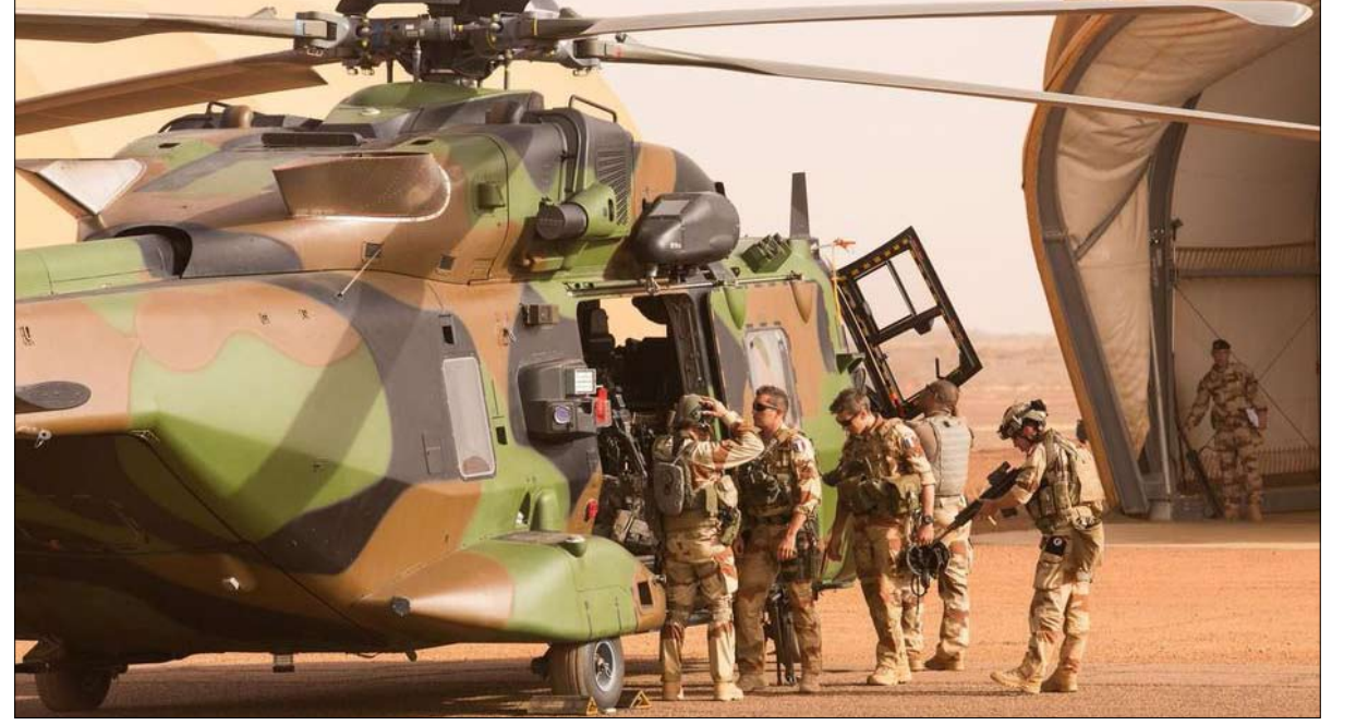
الى متى ستستمر عملية برخان؟

إن تقييم حصاد تعزيز برخان بإرسال 600 جندي إضافي في فبراير الماضي سيتم في 13 يناير، خلال الذكرى الأولى لقمّة باو، بهدف بدء انسحاب القوات الفرنسية. ولكن في انتظار تطوير قوة عسكرية محلية فعالة بما فيه الكفاية، فإنه محكوم على فرنسا الاضطرار بمعظم العمليات في المنطقة لأن العدو لا ينسحب. قُتل أكثر من 175 جنديًا ماليًا على أيدي الجماعات الإرهابية