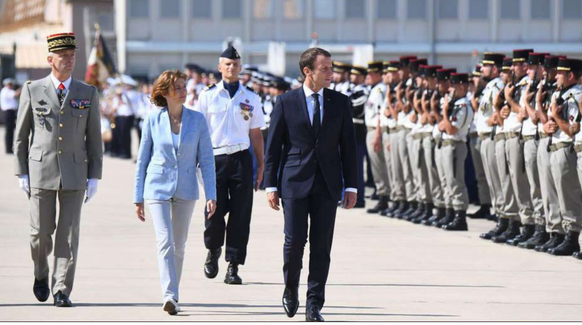
ماكرون مع وزيرة الدفاع فلورنس بارلي، ورئيس الأركان فرانسوا لوكوانتر