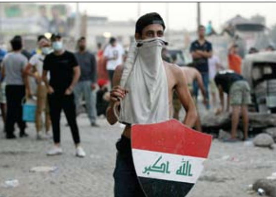
عراقيون يتظاهرون في العاصمة بغداد

وتابع: «هتحننا التحقيق في كل ملامسات ما حدث أمس في ساحة التحرير، وطلبت تقديم الحقائق أمامي خلال 72 ساعة. وكانت بغداد ومدن عدة شهدت احتجاجات غاضبة سقط فيها قتيلان وعُدد من الجرحى، على إثر أزمة انقطاع التيار الكهربائي التي تعاني منها محافظات العراق، وتصل ساعات انقطاع التيار الكهربائي في بعض المحافظات إلى 16 ساعة يومياً، كما في حالة محافظة النجف.