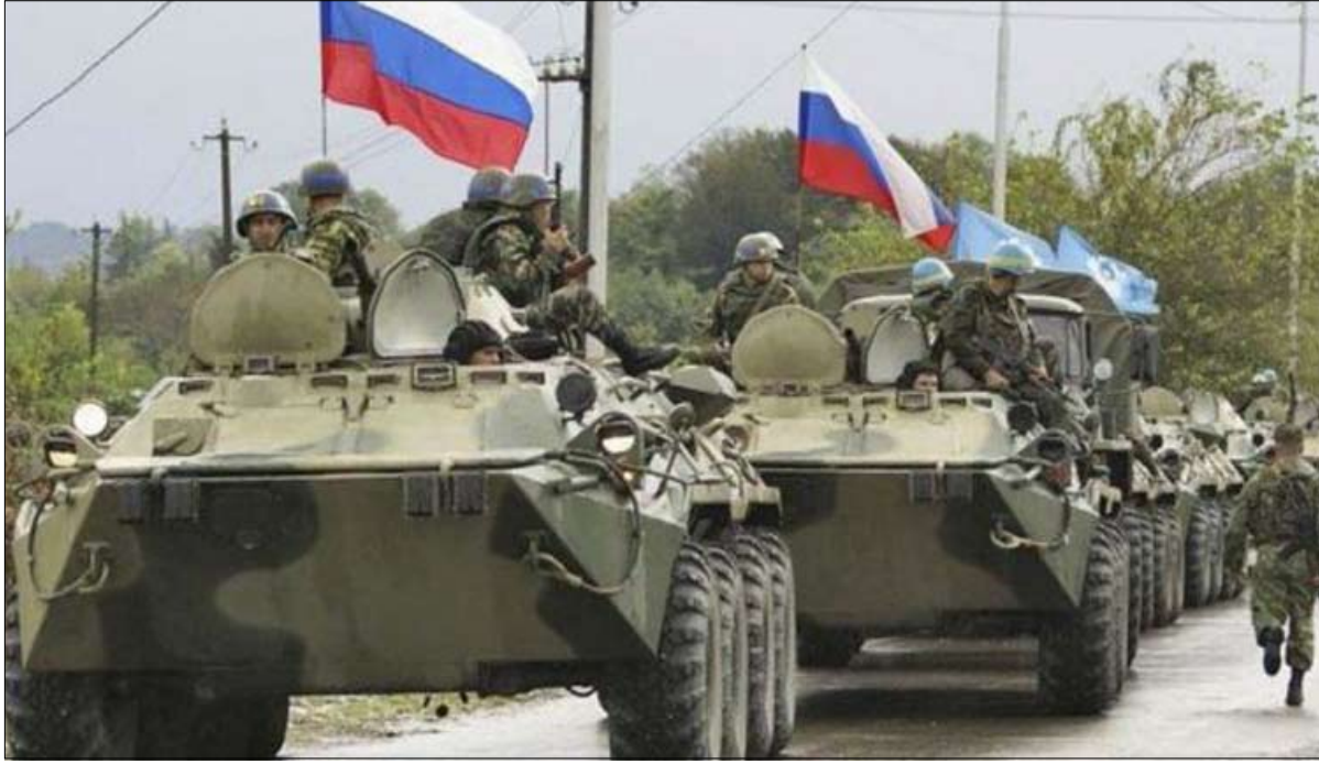
إيرانيين في سوريا، خاصة أفراد الميليشيات التابعة لها. إلى ذلك، ووفقاً للمعطيات الراهنة، فإن إنهاء الوجود الإيراني في سوريا أصبح مطلباً دولياً وإقليمياً. وتتوقع المعلومات أن يؤدي تكرار استهداف القوات الإيرانية لطالب القوى الدولية.

خصوصاً في شمال غربي البلاد، وخطط تعزيز التعاون العسكري والأمني بين طهران ونظام الأسد، ولجوء طهران لتجنيس