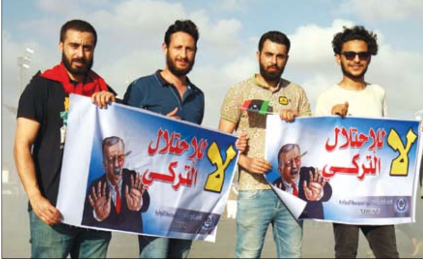
شبان ليبيون في بنغازي يحملون لافتات رفضاً للاحتفال التركي

وأوضحت المصادر، أن المخطط التركي يقضي بتصدير التنظيم الإرهابي للواجهة في ليبيا من جديد وتبنيه عمليات دموية في ليبيا، لقطع الطريق على المسألة الدولية لأردوغان وفانز السراج بسبب جرائم الحرب التي يرتكبها أتباعهما في ليبيا. وأكد مراقبون أن تنظيم داعش الإرهابي عاد لإعلان النشاط في