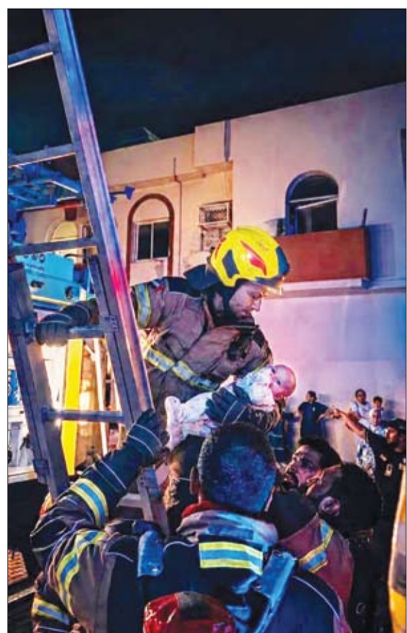
لاي مخاطر. وفي تلك الأثناء كانت الفرق تراقب تطور الحريق لحظة

على طرق الإخلاء المستخدمة لإنقاذ السكان. واستخدمت فرق الإنقاذ السلام الخاصة للوصول إلى الشقة وإجلاء أفراد الأسرة المحاصرين. ونجح أبطال الدفاع المدني في إنزال رب الأسرة والدته إلى خارج المبنى بأمان، قبل أن تتجه الأنظار إلى أصغر أفراد العائلة، وهي طفلة حديثة الولادة كانت داخل الشقة وسط الظروف الطارئة. وبغياة كبيرة وحذر شديد، تمكّن رجال الإنقاذ من إخراج الطفلة ونقلها إلى مكان آمن بعيداً عن الخطر. كانت لحظة مؤثرة بكل تفاصيلها، فبين أيدي أبطال الدفاع المدني كانت حياة صغيرة تنتظر فرصة جديدة لمواصلة بدايتها الأولى، فيما كانت عيون أسرتها تتابع المشهد بقلق وترقب وأمل، وبينما كانت الأسرة تستعيد أنفاسها خارج المبنى، واصلت فرق الإطفاء عملها داخل الموقع حتى تمكّن من السيطرة الكاملة على الحريق. وبعد احتواء مصدر النيران، ركزت الفرق على منع امتدادها إلى الوحدات السكنية المجاورة، حفاظاً على سلامة بقية السكان والممتلكات. كما جرى تنفيذ