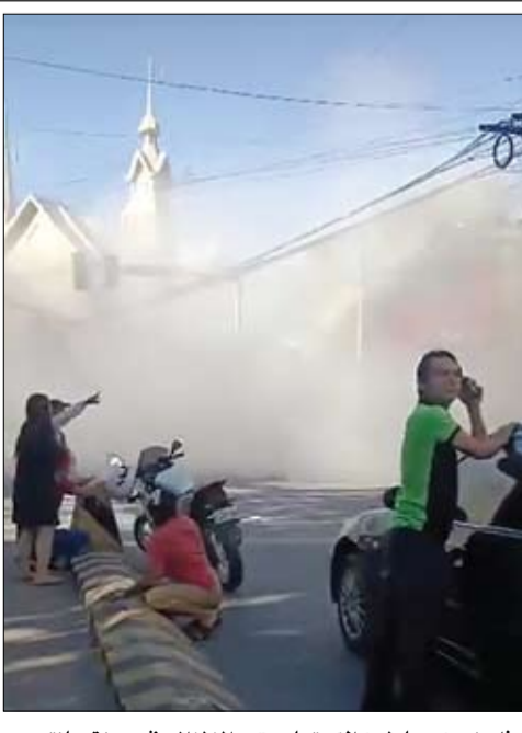
فلبينيون يحاولون إخماد عقب الزلزال في مدينة سانتوس.

قال رئيس الوزراء اللبناني نواف سلام أمس إن إسرائيل نفذت ما يقرب من 3500 غارة جوية على لبنان ومئات التفجيرات الحكومية منذ أن أعلنت الولايات المتحدة وقف إطلاق النار في 16 أبريل نيسان. كما قال وزير الدفاع اللبناني ميشال منسى أمس الاثنين إن إسرائيل نفذت ما يقرب من 3500 غارة جوية على لبنان منذ وقف إطلاق النار. ودخل وقف إطلاق النار الذي توسطت فيه الولايات المتحدة حيز التنفيذ بعد منتصف الليل في 17 أبريل نيسان، بينما لا تزال القوات الإسرائيلية متمركرة في عمق جنوب لبنان. ورغم أن الهدنة أوقفت إلى حد كبير الغارات الجوية على بيروت وضواحيها، فإنها لم توقف القتال في جنوب لبنان بين إسرائيل ومليشيا حزب الله المدعومة من إيران.