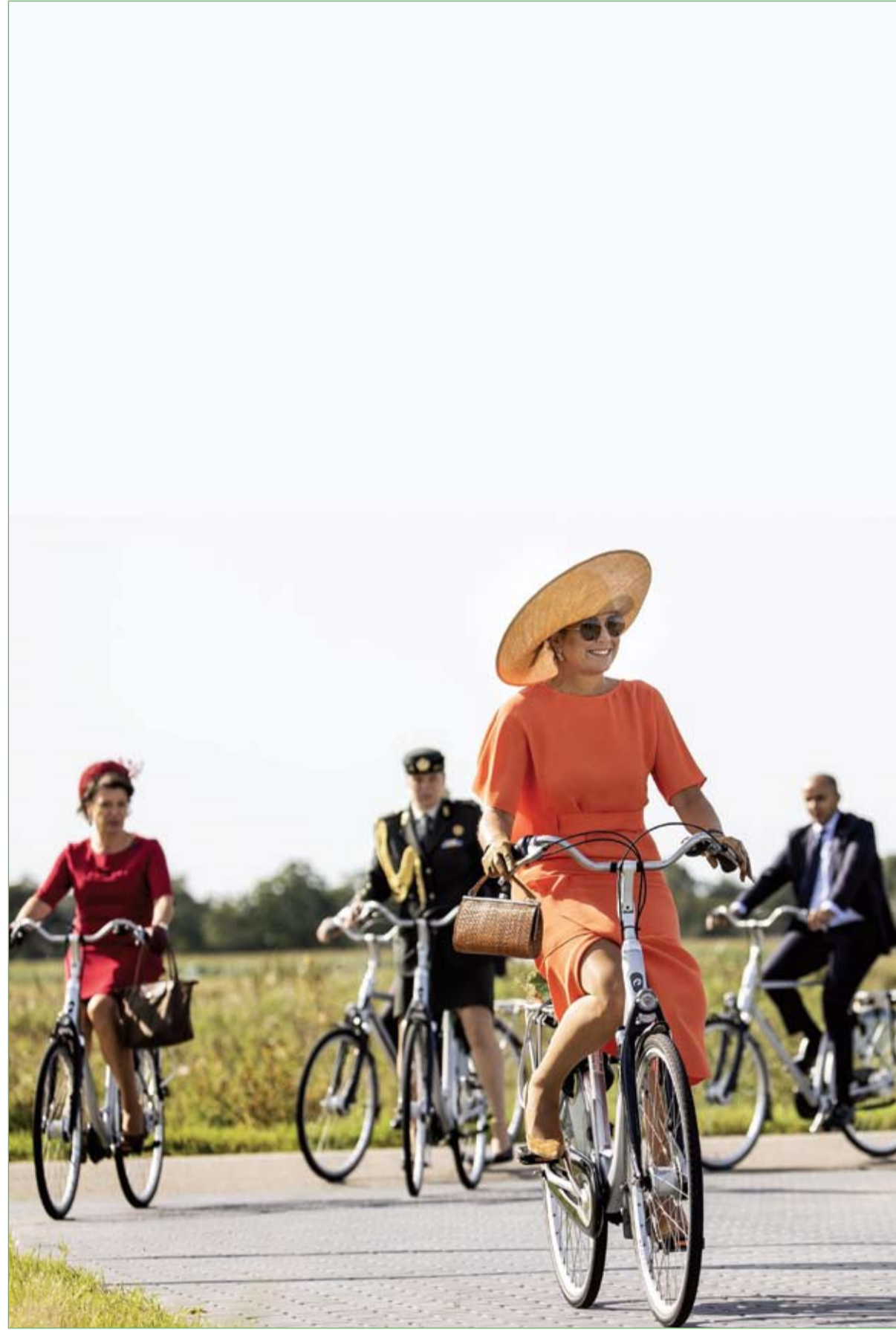
الملكة ماكسيما ملكة هولندا مع بعض المسؤولين وهي تركب دراجة خلال زيارتها مقاطعة فريزلاند. ١٠

أثار نفوق بطريق بعد ابتلاعه قناع "إن 95" الطبي في البرازيل قلق النشطاء البيئيين في ظل زيادة مخلفات وباء كورونا المستجد، والتي تمثل تهديداً جديداً على حياة الكائنات البحرية المعرضة للخطر. وتم العثور على البطريق نافقاً منذ أسبوع في شاطئ (جوكيهي) وتم تشريحه من قبل معهد أرجوناوتا للحفاظ على الحياة الساحلية والبحرية، والمتخصص في إعادة تأهيل الكائنات البحرية المتضررة من المخلفات الملقاة في البحر. وأوضح المعهد أنه خلال عملية التشريح تم العثور على قناع "إن 95" أسود اللون داخل معدة البطريق.