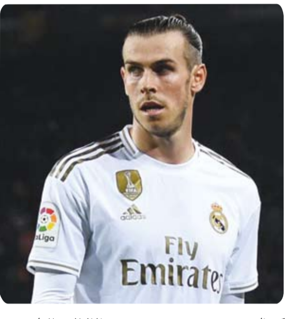
مورييل خلال الموسم الجاري، بعدما واقترب بيل من الرحيل عن ريال كورونا.

حدث وكيل أعمال اللاعب ماريو بالوتيلي، مينورايولا، عن مستقبل لاعبه في الموسم الكروي الجديد 2020-2021. زعم الوكيل مينورايولا أن هناك دائماً حل لماريو بالوتيلي، وأكد أن اللاعب الدولي الإيطالي السابق سيبقي في أوروبا. والتقى راويلا مع إانتز لمناقشة عودة أندريا بينامونتي من جنوى اليوم، وتحدث إلى موقع توتو ميركاتو بعد المفاوضات. وقال راويلا فيما يتعلق بعودة بينامونتي إلى سان سيرو: "من أجل الاتفاق