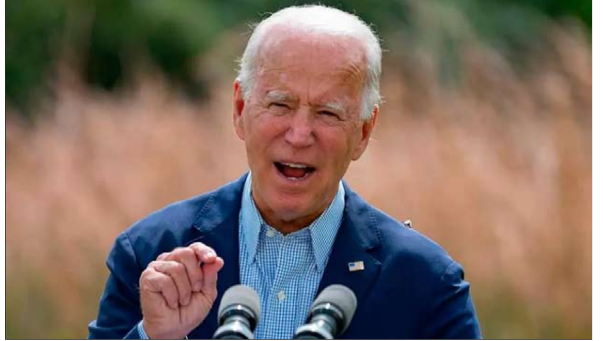
هل يعرف بايدن مصير هيلاري

في اللعب الجماعي. العلاقة مع روسيا هي أيضا موضع تساؤل، وفقا لسيليا بيلين، هل سيتمكن دونالد ترامب أخيرا من التعامل مباشرة مع فلاديمير بوتين؟ نحن نعلم أن هذا شيء آزاده، لكنه لم يكن قادرا حقا على فعله لأسباب انتخابية. وبمجرد إعادة انتخابه، ستكون يديه حرة. ويصل خيال البعض، من حاشية ترامب، لتحالف محتمل مع روسيا ضد الصين، إلا ان هذا لا يزال نقطة استفهام كبيرة.