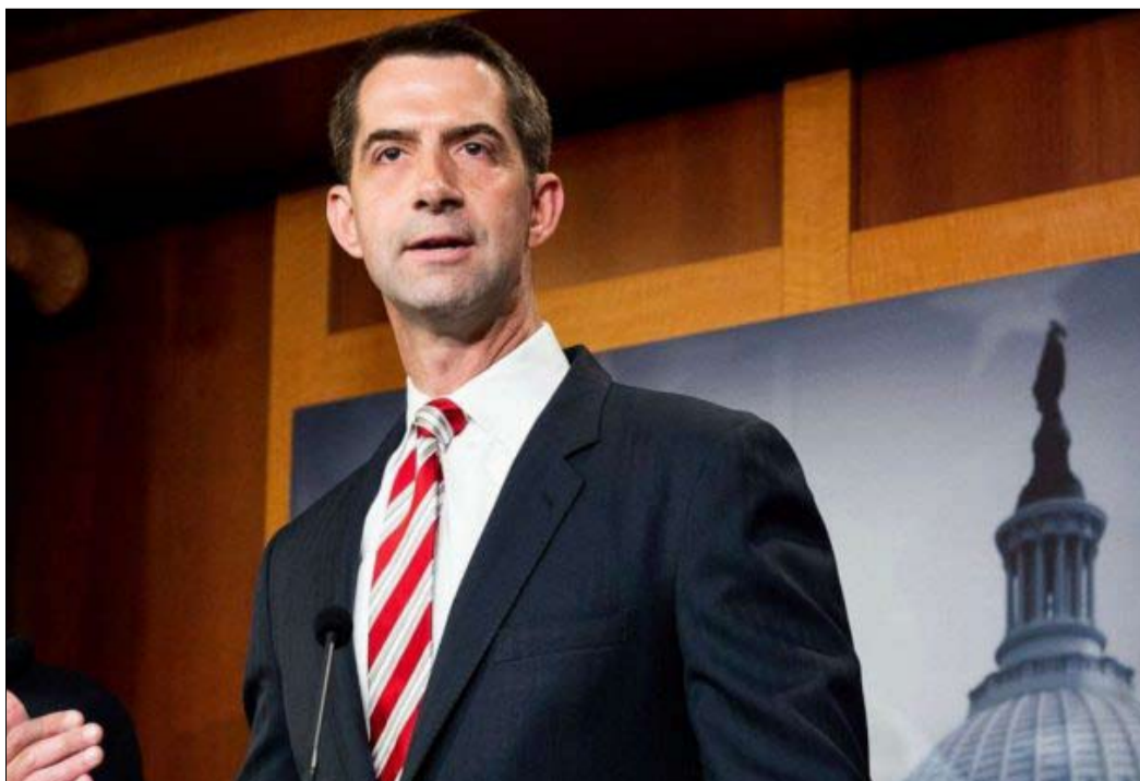
توم كوتون... محافظ في خدمة ترامب الثاني