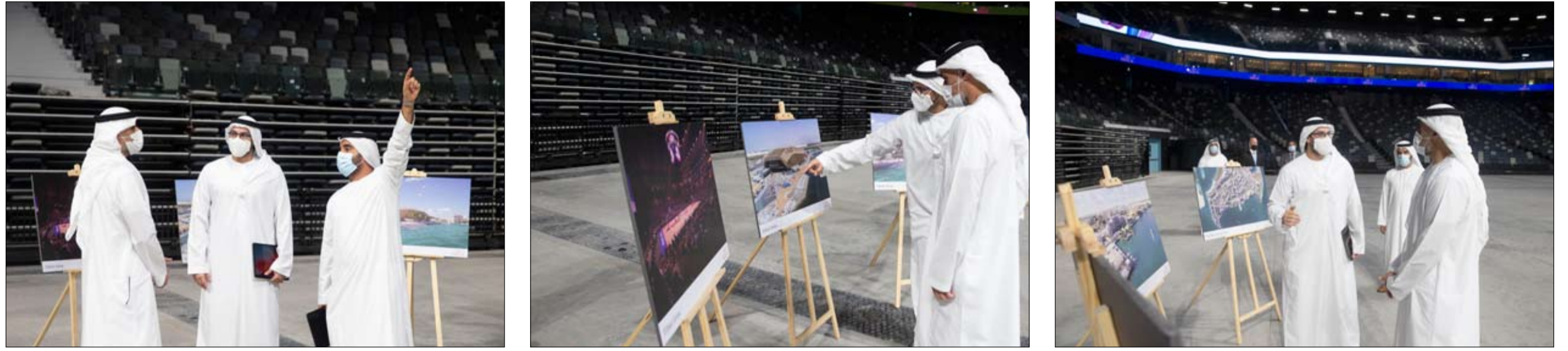
اطلع على أبرز المعالم والمرافق في الواجهة البحرية التي يتم تطويرها ضمن المشروع

وكان سوقا أبوظبي ودبي الماليين قد أطلقا خلال السنوات الماضية مبادرات إلكترونية ابتكارية لتوزيع الأرباح على المساهمين نيابة عن الشركات المدرجة، الأمر الذي سهل عملية الحصول عليها من قبل المستحقين وخفف العبء على الشركات نفسها. وتقسيلًا تظهر الإحصائيات الصادرة عن سوق أبوظبي للأوراق المالية أن قيمة الأرباح النقدية التي تولى توزيعها على المساهمين نيابة عن الشركات المدرجة وصلت إلى 22.5 مليار درهم عن السنة المالية 2019. وعلى مستوى سوق دبي المالي فقد بلغت قيمة الأرباح النقدية التي وزعتها نيابة عن الشركات المدرجة نحو 20.63 مليار