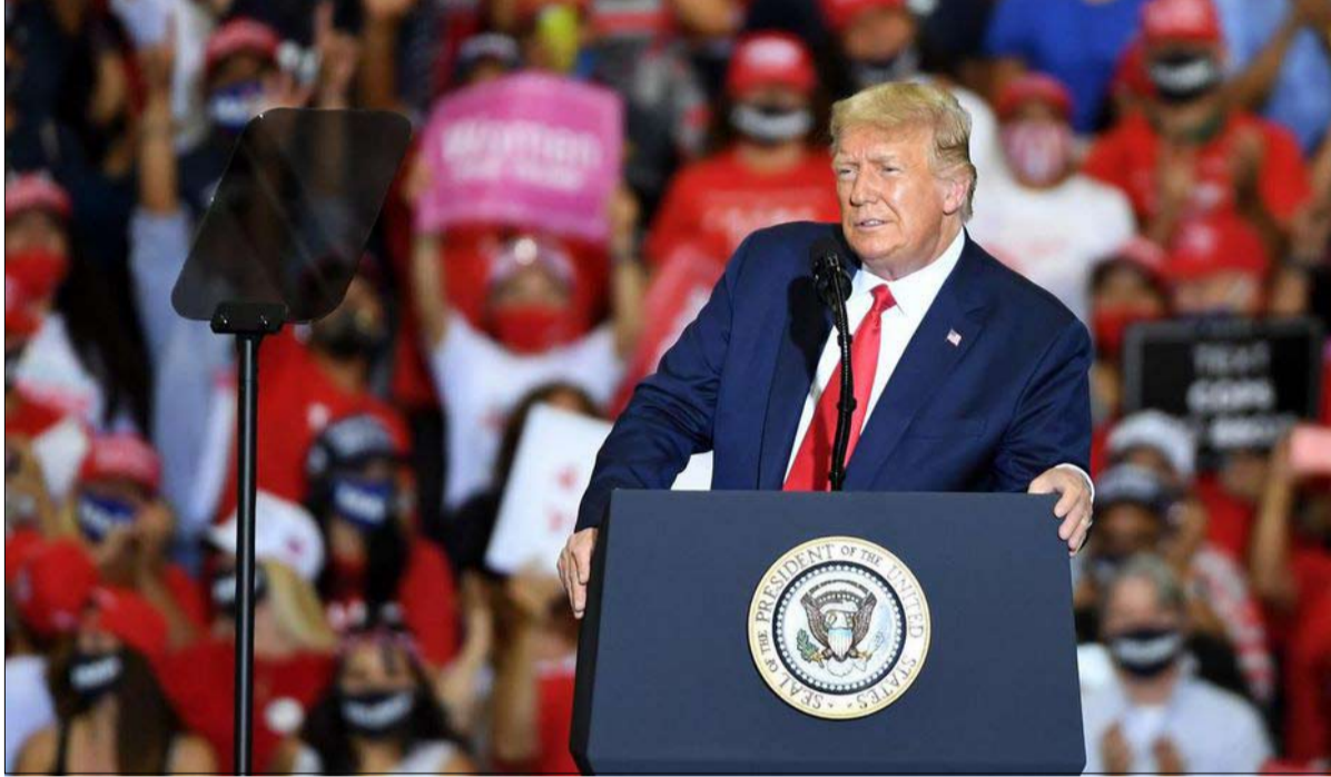
ترامب... ولاية ثانية بلا اغلال