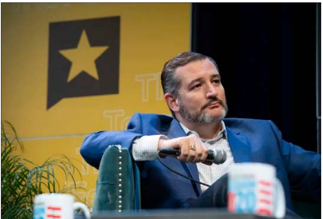
تيد كروز مرشح ترامب للمحكمة العليا

ويحاول دونالد ترامب أيضا قضم أصوات مجموعة السود، الحاسمة لنائب الرئيس السابق باراك أوباما. أن "جو بايدن يحصل حاليًا على 81 بالمانا من أصوات السود مقابل 14 بالمانا لترامب"، يلاحظ جون زغبي. لكن هذه النسبة يجب أن تكون 90 بالمانا، فحتى نسبة 89 بالمانا التي حصلت عليها هيلاري كلينتون عام 2016 لم تكن كافية، خاصة في ولايات مثل بنسلفانيا وميشيغان وويسكونسن وكارولينا الشمالية.