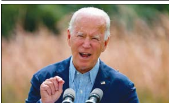
هل يعرف بايدن مصير هيلاري؟

ويحسب ما نقل موقع تينيزي نيميريك عن مصادر مقربة من حركة النهضة في أغسطس الماضي، فإن الانقسام حصل بين من يريد تأييد حكومة المشيشي، على نحو حذر، ومن منطلق الانحياز للمعاصرة وإدراكا لصعوبة الوضع، وبين من يرفض تأييد الحكومة المقبلة لأن الحركة ستخرج خاوية الوفاض. وأضاف المصدر أن الدافعين عن تأييد مساعي المشيشي شكوا أغلبية تقارب 80 في المئة، ويقول هؤلاء إنه لا ضير في معاداة السلطة، بشكل مؤقت، من أجل العودة بقوة في وقت لاحق.