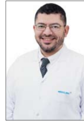
استشاري جراحة الأوعية الدموية في ميديكلينيك مستشفى شارع

المطار: تم تطوير هذه التقنية الفريدة من خلال تقنية علاج حصوات الكلى حيث تقوم التقنية الجديدة حالياً بتحقيق نتائج سريرية إيجابية للمرضى الذين يعانون من الانسداد شديد في الشرايين، خاصة عند علاج بعض الشرايين التي تقع في مناطق عالية الخطورة مثل الورك، وأضاف الدكتور ماهر: "هذه التكنولوجيا الجديدة التي تم تطويرها لتبسيط مثل هذه الإجراءات المعقدة، تقدم مجموعة من الفوائد والمزايا التي تلغي