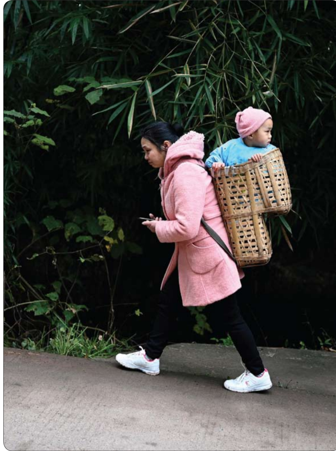
امرأة تحمل طفلاً في سلة على طول شارع بالقرب من جزيرة تشونغبا الصغيرة بالقرب من مدينة تشونغتشينغ الصينية.

يتركز فيتامين (د) في صفار البيض. لذا تأكد من تناول البيض كله وليس بياضه فقط. ويحتوي صفار البيض الواحد على 41 وحدة دولية، أي 10% من قيمتك اليومية، وفقاً للمعاهد الوطنية للصحة. وقال أوز: "يمكن أن يكون البيض (وصفار البيض) جزءاً من خطة الأكل الصحي كل يوم، خاصة عند استبدال الأطعمة التي تحتوي على نسبة عالية من الكوليسترول مثل اللحوم".