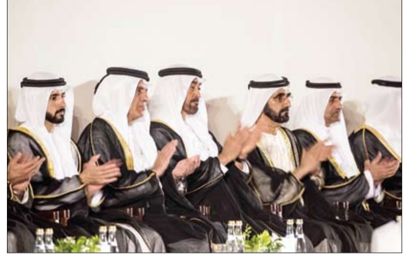
تحت رعاية رئيس الدولة