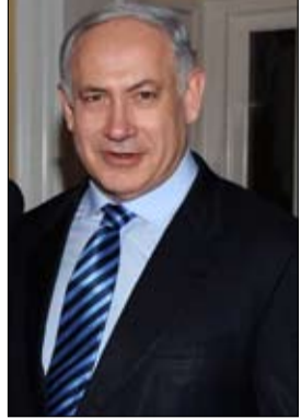
وزير الدفاع الإسرائيلي يواف غلانت

مضيقاً أن تلك الزيارة قد تتبناها التي تواجه حملات من جانب الجمهوريين لإظهارها على أنها غير ودية تجاه إسرائيل، في إطار الاستعدادات للانتخابات الرئاسية في عام 2024، حسبما أفاد موقع "تايمز أوف إسرائيل". ويرى الموقع أن الحكومة الجديدة في إسرائيل "تؤثر سلباً على توجهات الأمن القومي الأمريكي؛ إذ تريد إدارة بايدن تحويل الانتباه عن ملف الشرق الأوسط وتركيزه صوب منافسيها أمثال الصين وروسيا". وكشفت أن الرئيس الأمريكي بصدد إيفاد مستشاره للأمن القومي، جيك سوليفان، إلى إسرائيل بمنصف قانون الثاني-يناير الجاري، ضمن محاولة لحل الخلافات مع حكومة نتياهو،