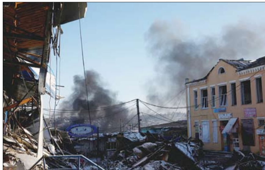
أمدة الدخان تتصاعد بعد غارة روسية على مدينة باخموت في دونباس بأوكرانيا

أوكرانيا، فيعد ساعات من وقت الهدنة العلنية من طرف واحد من قبل موسكو في أوكرانيا، استأنفت القوات الروسية قصفها بصواريخ غراد على نقاط عسكرية في مدينة أفديفكا المتاخمة لدونيتسك، بحسب مع أعلنته مصادر محلية في المدينة. وأعلن الجيش الأوكراني أن قواته الجوية والصاروخية استهدفت 26 موقعا روسيا خلال 24 ساعة، فيما قالت سلطات دونيتسك الانفصالية إن القوات الأوكرانية استخدمت صاروخ توشكا-أو في ضربات الأحد. من جهتها، قالت وزارة الدفاع البريطانية إن القوات الروسية تعزز دفاعاتها في منطقتي زابوريجيا ولوغانسك أوبلاست بأوكرانيا تحسبا لهجوم كبير من قوات كييف، ورجحت الوزارة، في تقريرها اليومي حول تطورات الحرب الأوكرانية الروسية، أن يشكل تحقيق القوات الأوكرانية لتقدم كبير في زابوريجيا تحديا للحرس البري الروسي الذي يربط