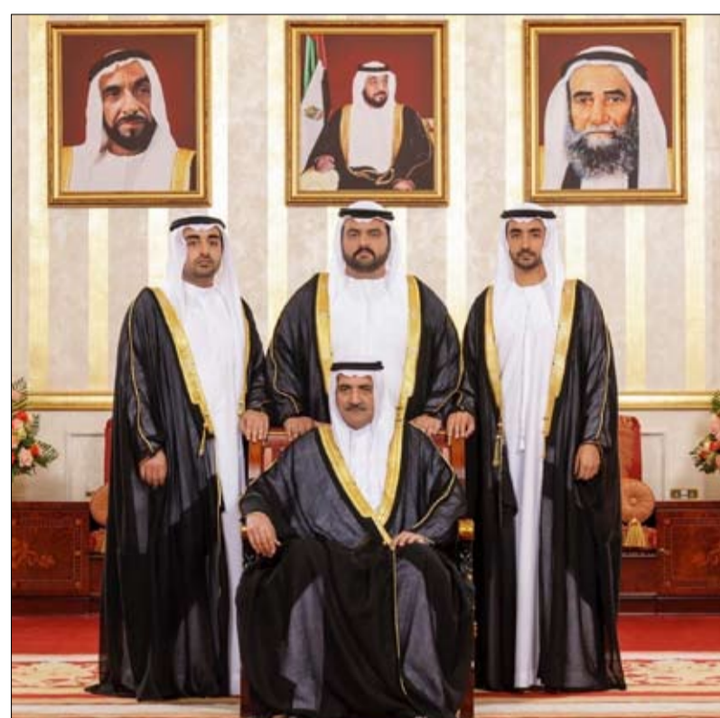
وتحفظ مقدراتها الثمينة ومنجزاتها الوطنية المستدامة التي ترتقي بمكانة دولة الإمارات

ويواصل سمو الشيخ محمد بن حمد بن محمد الشرقي ولي عهد الفجيرة، مسيرة