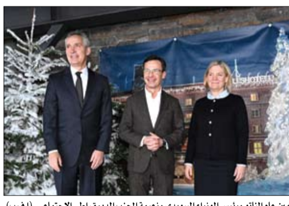
أمين عام الناو ورئيس الوزراء السويدي وزعيمة الحزب الديمقراطي الاجتماعي