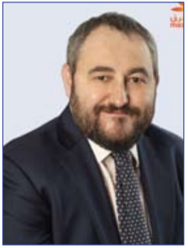
الشرق يعين رادو توبليشيانو رئيساً للمشرق نيو والخدمات المصرفية الشخصية

الطلبة المدارس في الدولة لقاء أوقات صباحية مليئة بالنشاط والحيوية، والتعرف على ثقافات وتقاليد مختلفة حول العالم من خلال متحف ريبليز صدق أو لا تصدق!، الأول من نوعه في المنطقة، والذي يقدم لضيوفه ما يزيد على 260 معروضة غربية