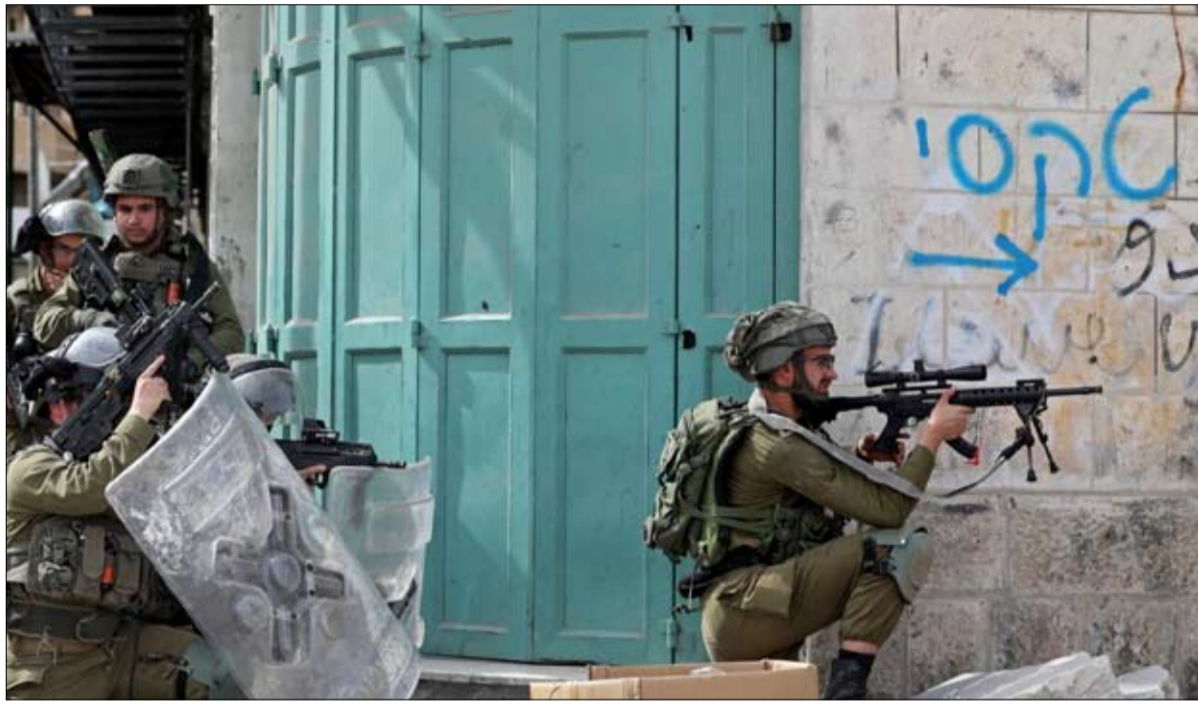
مضيقاً أن تلك الزيارة قد تتبناها التي تواجه حملات من جانب الجمهوريين لإظهارها على أنها غير ودية تجاه إسرائيل، في إطار الاستعدادات للانتخابات الرئاسية في عام 2024، حسبما أفاد موقع "تايمز أوف إسرائيل".

وتعتقد السياسات الإسرائيلية التي تنتهجها حكومة اليمين