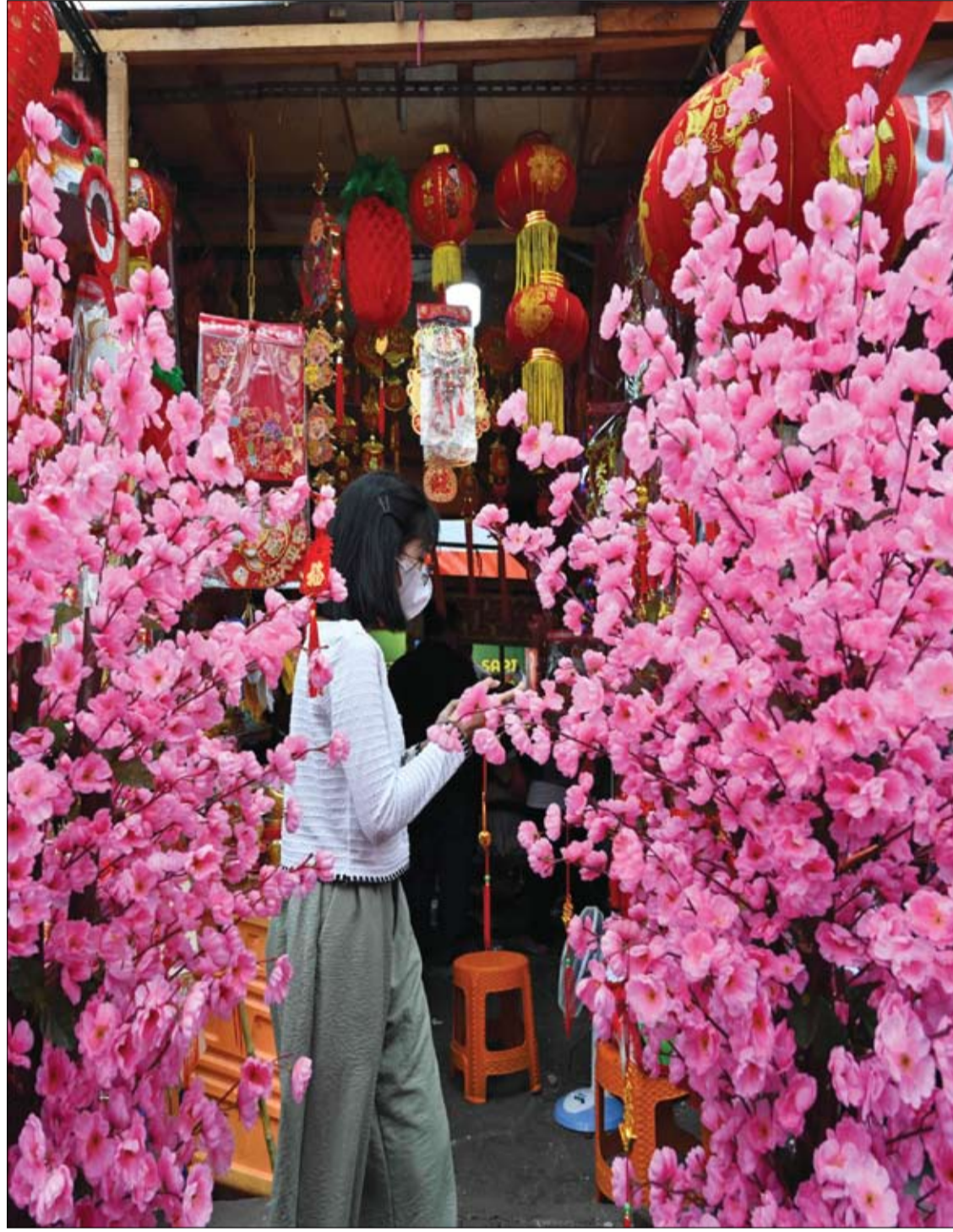
امرأة تمشي وسط الورود بينما يتسوق الناس لشراء الحلي والأطعمة الصينية في جاكرتا، قبل رأس السنة الصينية الجديدة في 22 يناير

ونبه الطبيب إلى المكسرات فقال إن "المكسرات مصدر للبروتين والدهون والألياف والعديد من المعادن الضرورية لعمل المخ بشكل كامل".