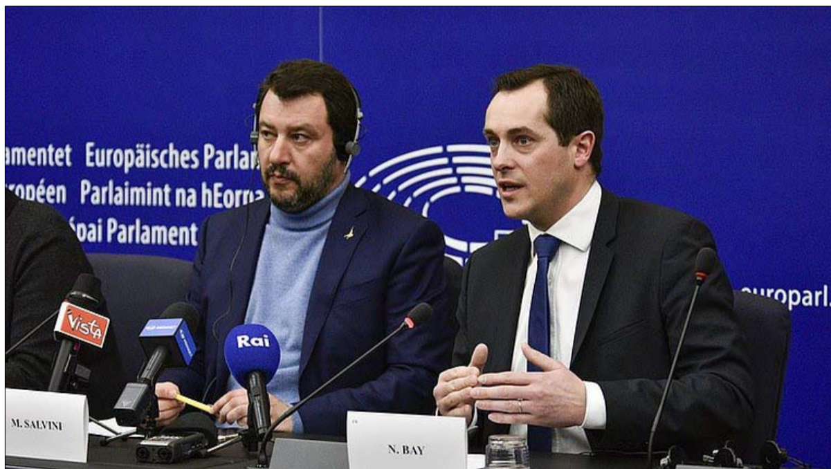
هل تلتحق رابطة سالفيني بحزب الشعب الاوروبي؟