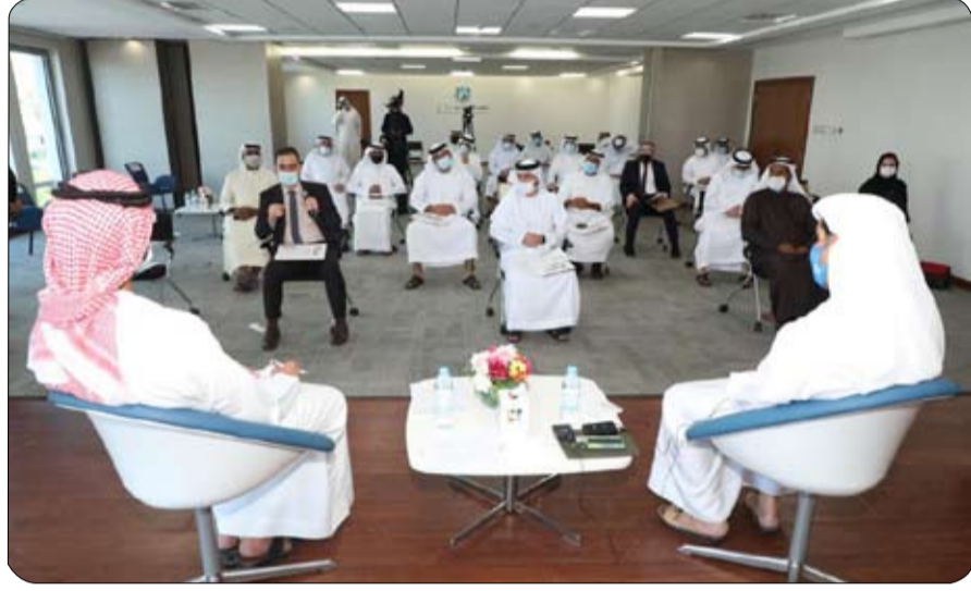
بما يسهم في قيام الجميع بأدوارهم على أفضل نحو ممكن، كما تم والإداري لعام 2020. الاطلاع على التقريرين المالي والتحكيم ورؤساء الغرف التحكيمية، وأطراف النزاعات وأعضاء هيئات

ومعايير مهمة يتم تطبيقها في كل المجالات والقطاعات والقطاعات بدولة الإمارات، ومما لا شك فيه أن تخريج أول دفعة من المحكّمين يبشر ببناء أجيال جديدة لخدمة رياضة الإمارات في هذا الجانب المهم الذي يقضي بإعطاء كل ذي حق حقه لتنتعز رياضاتنا بمزيد من الاستقرار والتميز والازدهار». وشهد اجتماع مجلس إدارة المركز مناقشة التقرير السنوي عن سير عمل المنازعات الرياضية حتى تاريخ 28 فبراير الماضي، والخطوات والإجراءات المتبعة التي اتخذت حيال