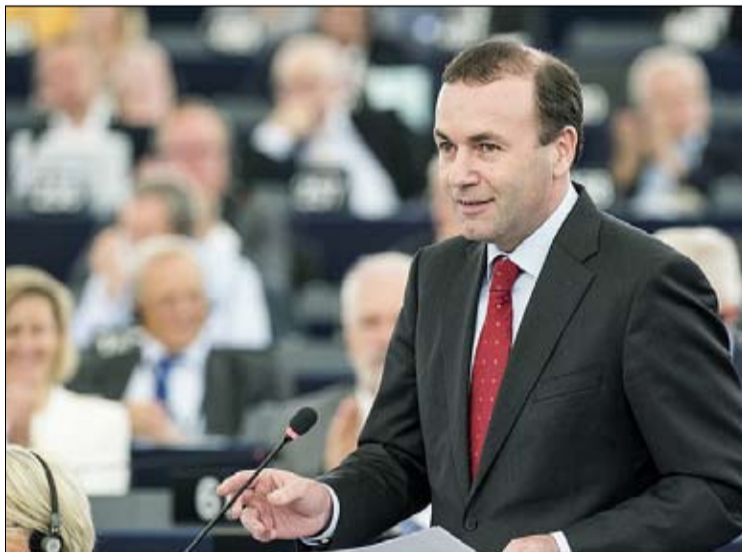
مقارنة مانفريد ويبير بالنازي مثلت نقطة اللاعودة

وأكدت عدة مصادر داخل البرلمان لمجلة لأكسبريس، اهتمام فيدس بهذا الخيار الثاني. إلا أن البرلمانيين في مجموعة المحافظين والإصلاحيين الأوروبيين قد ينضرون جراً السبعة السبعة للنظام الحزبي، المتهمة باختلاس الإعانات الأوروبية لصالح المقربين من السلطة التنفيذية، والذين يعتبرون الأكثر سلطوية في الاتحاد الأوروبي. لا يخفي فيكتور أوربان إعجابيه بالقيادة الثميرين للجدل مثل شي جين بينغ أو فلاديمير بوتين. وقد يشكل عقده للروس أزمة