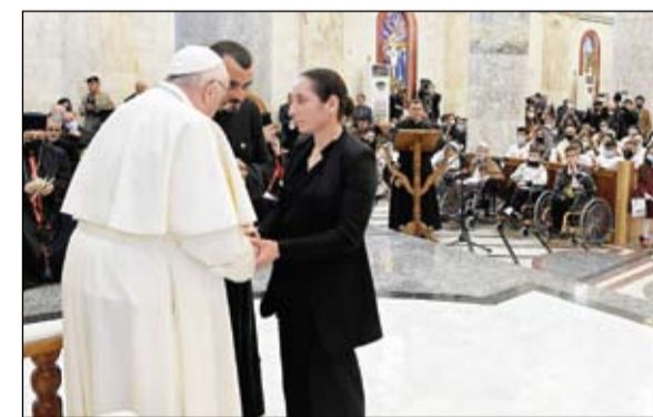
الابا فرنسيس يستمع الى ماسي العراقيين في الموصل

وأظهرت صور بالأقمار الاصطناعية لشركة بلانيت لابز، حللتها وكالة أوسشيدت برس الأحد، حريقا اندلع في منطقة بالقرب من جرابلس بين يومي الجمعة والسبت صباحا. وأظهرت صور سابقة مئات الشاحنات الصهرجية متجمعة في المنطقة.