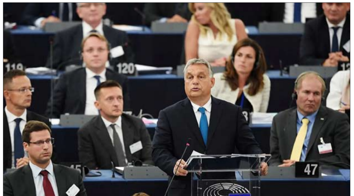
أوربان امام البرلمان الاوروبي

الاتحاد المسيحي الاجتماعي، حتى تتمكن "الليغا" قريباً من الانضمام