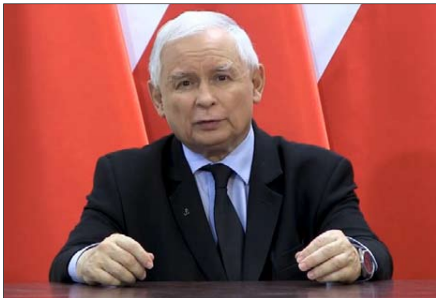
هل يقبل ياروسلاف كاتشينسكي بانضمام فيدس الى كتلته؟

التحضيرية بين قادة حزب الشعب الأوروبي قبل الجلسات الأوروبية. بالإضافة إلى ذلك، اكتمل طلاقه الآن مع اليمين الأوروبي، ويمكنه أن يكرس نفسه أكثر لأوليائه للأشهر القادمة: الجبهة الداخلية، حيث تتأكل قبضته. خلال الانتخابات البلدية في أكتوبر 2019، افتتحت المعارضة عشر مدن من أصل 23 مدينة كبرى في المجر، منها العاصمة بودابست، التي احتلها جيرجيلي كاراكسوني، من الخضر، ومن المتوقع أن يقود هذا الأخير الحملة ضد أوربان في الانتخابات التشريعية لعام 2022.