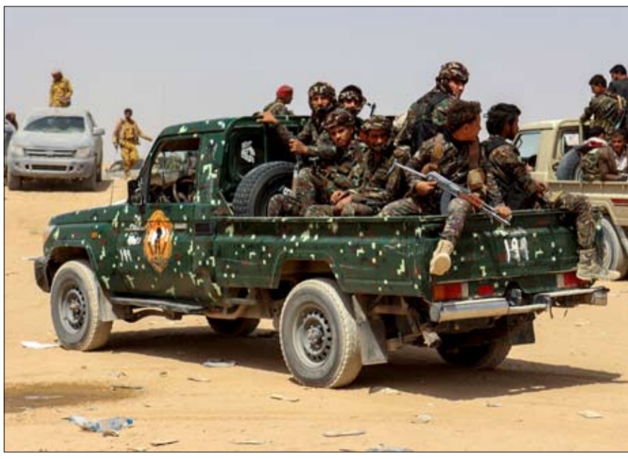
مقاتلو الحوثيين يسيرون في شاحنة عسكرية في صنعاء، اليمن، في 12 فبراير 2015.

عشرات الملايين من الدولارات سنوياً" يقول ريدل، مرجحاً أنه "ربما لا يسيطر الإيرانيون على الحوثيين تماماً، لكنهم يتمتعون بنفوذ كبير". عملية سياسية مغرية وقال ريدل: "حتى تنتهي الحرب، تحتاج إدارة بايدن إلى إيجاد عملية سياسية تحرق الحوثيين بوقت إطلاق النار. أهداف الحكومة في صنعاء. ويُنظر إلى إنهاء الحصار كبادرة حسن نية، وبالتالي