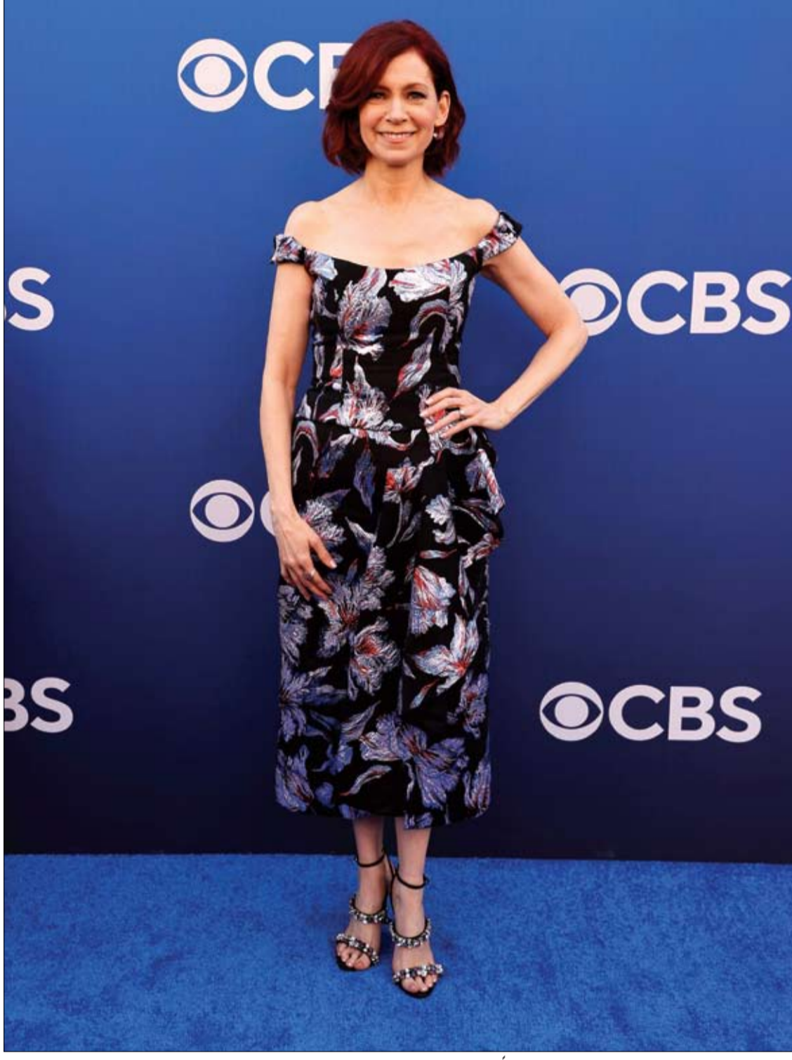
الممثلة الأمريكية كاري بريستون عند حضورها احتفالا بالإعلان عن جدول الخريف لشبكة سي بي إس في استوديوهات باراماونت بهوليوود. (أ ف ب)