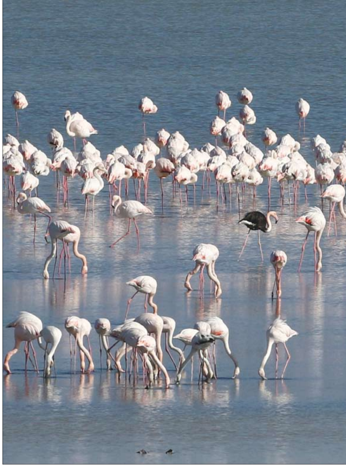
طيور الفلامنغو في بحيرة مالحة في لارتكا، قبرص.

اتبعي قاعدة أربي ابنتي على أنها تحبني لا على أنها تخاف مني حيث يؤكد هارون أن هذا هو مفتاح النجاح للعلاقة بين الأم وابنتها، وليس اتباع أسلوب الاستجواب والمراقبة، فهي أساليب خاطئة في ظل الانفتاح الذي يعيشه أولادنا اليوم.