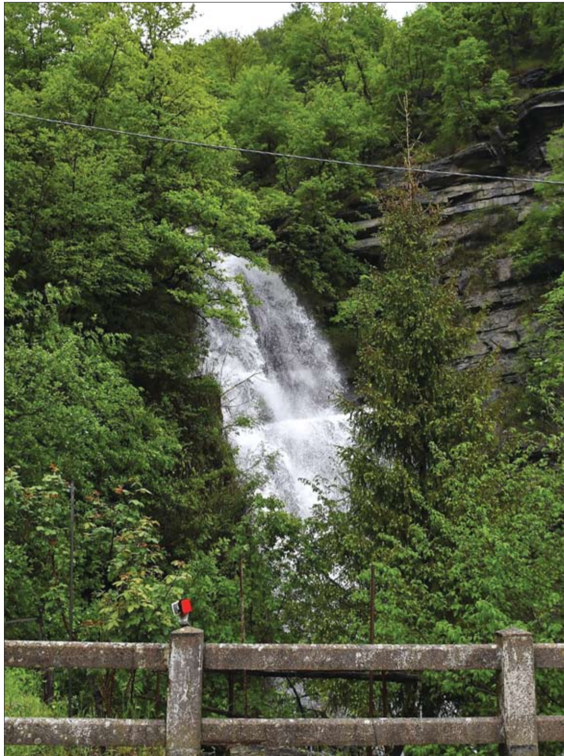
منظر لشلال في فيورنوزولا بإيطاليا بينما تتعرض منطقة إميليا رومانيا بشمال إيطاليا لأمطار غزيرة.

وأفادت Science أنهم يشهدون تحسينات مماثلة.