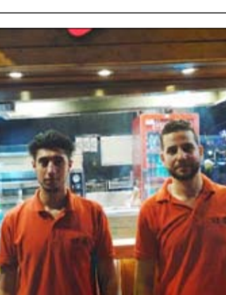
•• دبي - سمير السعدي:

وأوضحت المحرزي أن من بين مبادرات الشهر الفضيل المجتمعية، رعاية النسخة التامة من حملة «رمضان أمان» التي تهدف لحد من الحوادث المرورية والسرعة الزائدة تحت شعار «معاً رمضان بلا حوادث»، تستهدف سائقي المركبات المستخدمة في الدراجات الهوائية ومستخدمي السكوتر الكهربائي، والمشاة، من خلال توزيع وجبات إفطار خفيفة على السائقين عند