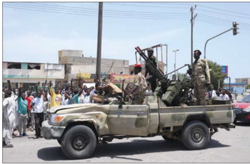
سودانيون يستقبلون جنود الجيش الموالي للبرهان في مدينة بورتسودان.

نض الجيش السوداني ما أعلنته قوات الدعم السريع بشأن إسقاط طائرة سوخوي، ونض صحة لحصار المتمردون لمقر القيادة العامة، مشيراً إلى تعرض برج القوات البحرية للحريق نتيجة الاشتباكات الصباحية وتمت السيطرة عليه دون إصابات، وأعلن أن قوات تابعة للدعم السريع قامت بتسليم نفسها وعتاها للقوات المسلحة. بدورها نفت قوات الدعم السريع مقتل قائديها العسكريين في شمال وغرب دارفور، وأعلنت قواته تصدى قوات الدعم البحرية بالقيادة العامة، وأعلنت إسقاط طائرة سوخوي تابعة للجيش السوداني، فيما أعلنت تعرض قواتها في بورتسودان لقصف جوي من قبل قوات أنجبية.