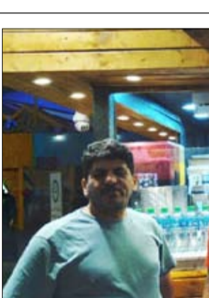
•• دبي - سمير السعدي:

وأوضحت أن الهيئة قدمت الرعاية الفضية لمبادرة "جمعية الإمارات لرعاية ويزر الوالدين"، حيث تم توزيع المير الرمضاني وإفطار صائم وتوزيع عدد 108 بطاقة نول بقيمة 500 درهم لكل بطاقة، لكبار السن والأسر من ذوي الدخل المحدود، وكذلك دعم مشروع جمعية بيت الخير "إفطار صائم والعينية بتوفير خيمة بمنطقة محيصنة، ويتم فيها توزيع وجبات الإفطار