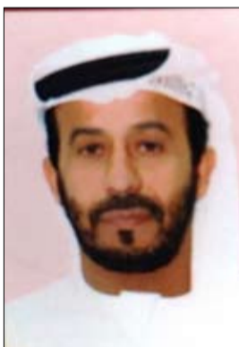
•• دبي - سمير السعدي:

أكدت المحرزي، أن المبادرات حظيت بدعم ورعاية من قبل العديد من الجهات الحكومية والقطاع الخاص التي تحرص دائماً على التعاون ومشاركة الهيئة في تقديم أنشطتها ومبادراتها من خلال الدعم المادي والمعنوي لها من الإعداد والتجهيز والتنسيق ومن بينها: دائرة الشؤون الإسلامية والعمل الخيري بدبي، وجمعية بيت الخير، هيئة الهلال الأحمر الإماراتي، واللجنة الدائمة لشؤون العمال في دبي، وشركة "كيوليس ام اتش أي"، وشركة بتترول الإمارات الوطنية "اينوك"، بالإضافة لمشاركة شركة طوكيو مارين للتأمين البحري، ودبي للاستثمار.