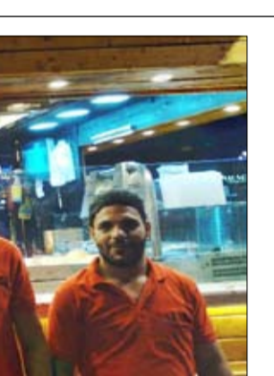
•• دبي