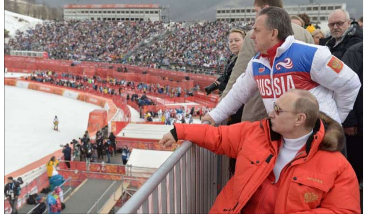
بوتين الرياضة في خدمة السياسة