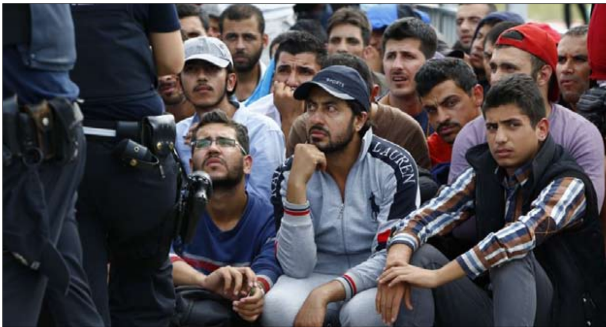
الهجرة جزء من المعادلة..

في هذا المناخ، أعلن وزراء داخلية إيطاليا وألمانيا والنمسا يوم الأربعاء، عن إنشاء "محور التطوعين" ضد الهجرة غير الشرعية.. ألا يُزعج هذا...؟