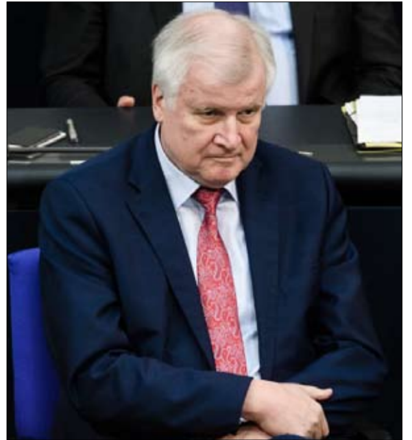
هذا الرجل يهدد عرش المستشار