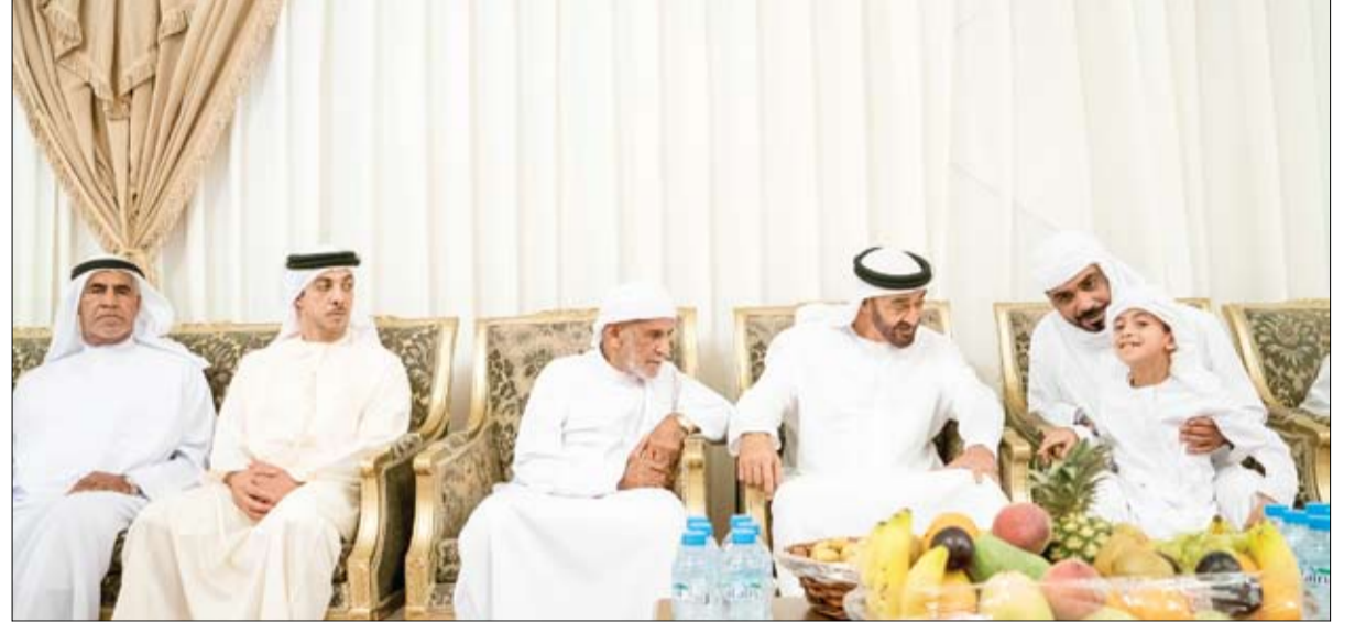
قدم واجب العزاء إلى ذوي شهداء الوطن الأبرار