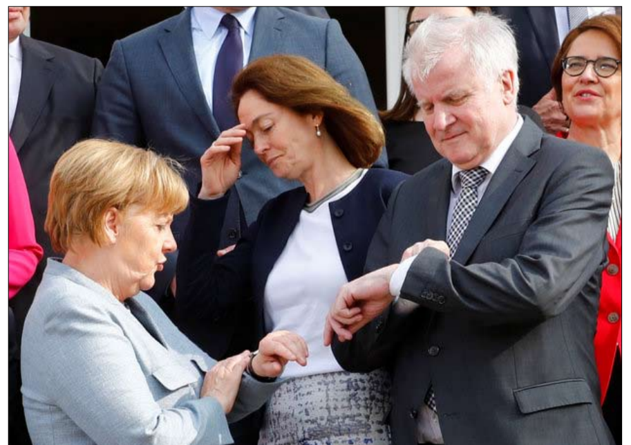
ميركل حانت ساعة الحقيقة