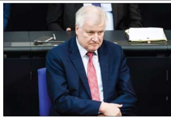
هذا الرجل يهدد عرش المستشار

.. كابول - وكالات: أسفر تفجير انتحاري في شرق أفغانستان، أمس الأحد، عن مقتل 14 شخصاً على الأقل وإصابة 45، في ثاني هجوم تشهده المنطقة خلال يومين في ظل هدنة غير مسبوقة بين الحكومة وطالبان. ووقع التفجير، خارج مكتب محافظ ولاية ننگرهار، وفق المتحدث باسمه، وأكد مصدر أمني أفغاني وقوع التفجير وحصوله القتلى، وذلك بحسب وكالة رويترز. وكان انتحاري ينتمي لتنظيم داعش فجر نفسه بنفس في الولاية في حشد يضم عناصر من طالبان وقوات الأمن ومدنيين كانوا يحتفلون بوقف غير مسبوق لإطلاق النار في أفغانستان، السبت، مما أسفر عن مقتل أكثر من 30 شخصاً.