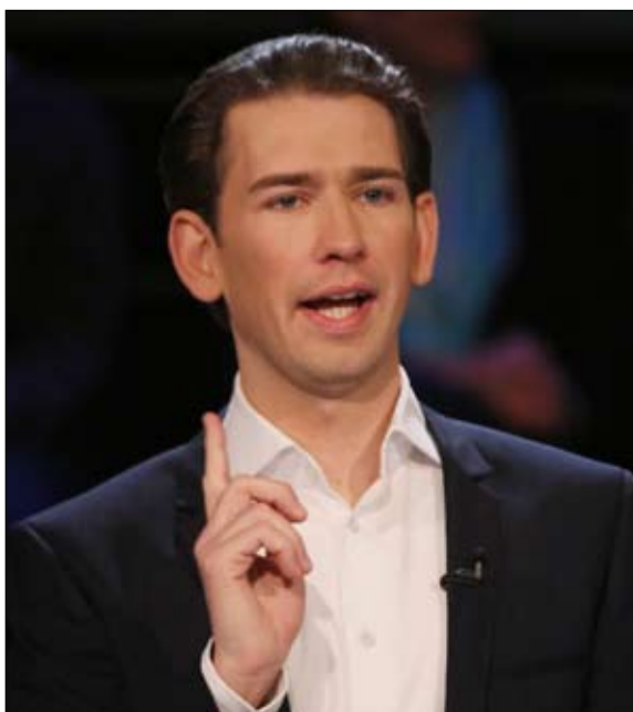
النمسا تستعيد محورها

بعد ثلاثة أشهر من المخاض الصعب والولادة القيصرية، يمكن للاتلاف الألماني أن يتدثر اليوم الاثنين، ولن يكون شريكه الاشتراكي الأقليمي (الحزب الاشتراكي الديموقراطي) هو المسؤول عن ذلك، ولكن الاتحاد المسيحي الاجتماعي البافاري، الشقيق الاصغر المتمرد للاتحاد المسيحي الديموقراطي المحافظ، وفي النهاية، ستم اراحة أنجيلا ميركل ليس على يد اليسار، وإنما من جانب اليمين البافاري المتشدد. وفي حال إجراء انتخابات جديدة، يمكن لنفس هذا اليمين المتشدد أن يتحالف هذه المرة مع اليمين المتطرف، فحزب البديل من أجل ألمانيا في طريقه إلى أن يصبح ثاني حزب في ألمانيا، وفقاً لآخر استطلاعات الرأي. وهكذا، بعد الانتصارات الأخيرة للأحزاب القومية في النمسا