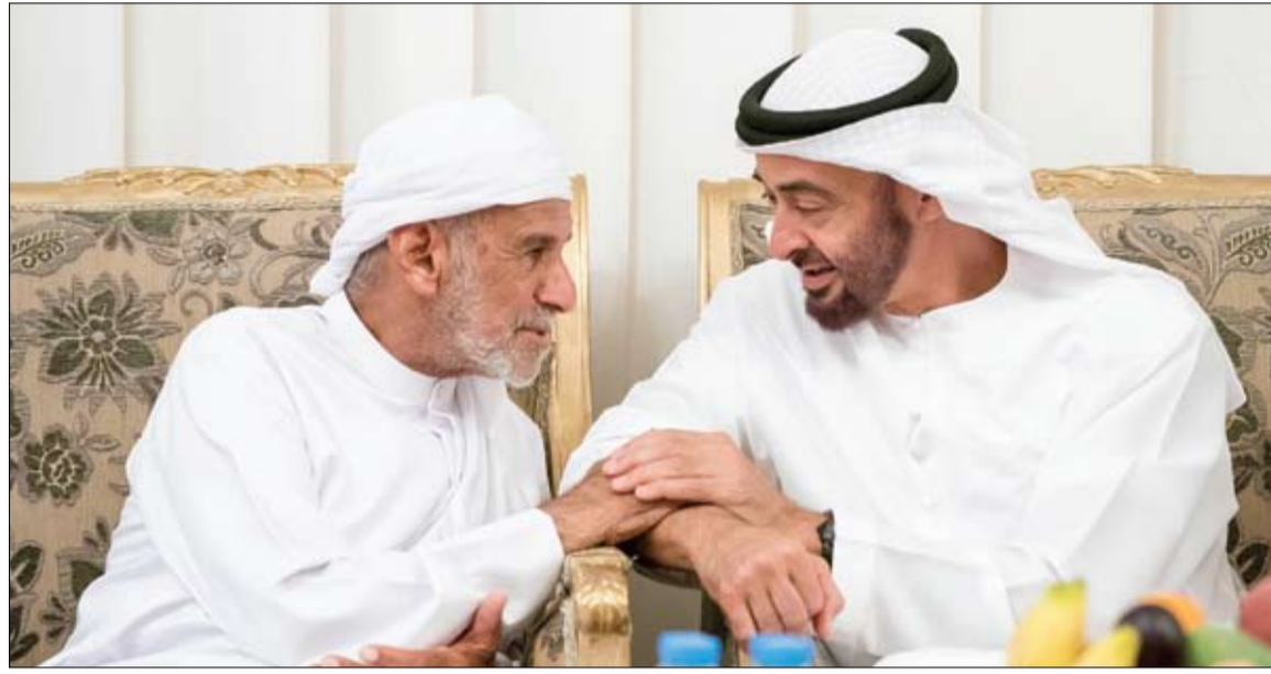
محمد بن زايد خلال تقديمه واجب العزاء إلى أسرة الشهيد عبدالله خميس الزويدي (وام)

الإمارات ترحب بمبادرة الرئيس الأفغاني بشأن تهدئة الهدنة مع طالبان .. أبو ظبي - وام: رحبت دولة الإمارات بإعلان الرئيس الأفغاني أشرف غني بتمديد فترة وقف إطلاق النار مع حركة "طالبان". وذكر بيان صادر عن وزارة الخارجية والتعاون الدولي أمس أن الإمارات العربية المتحدة تدعم إعلان الرئيس الأفغاني أشرف غني الذي صدر يوم أمس الأول السبت بتمديد وقف إطلاق النار مع طالبان واقتراحه بدء محادثات سلام. وأضاف البيان أن وقف إطلاق النار مع طالبان يمثل خطوة أساسية على سبيل تثبيت دعائم الأمن والاستقرار في جمهورية أفغانستان الإسلامية.. مشيداً بمبادرة الرئيس الأفغاني واصفاً إياها بأنها قرار شجاع من شأنه أن يمهد الطريق لمفاوضات السلام بين الطرفين. وأشار البيان إلى أن الإمارات ترحب بمبادرات الرئيس الأفغاني المستمرة لدعم الحلول السياسية والحوار بين الأفغان ونريد العنف وهو المنهج الصحيح والضروري للوصول إلى مصالحة وطنية شاملة تقي أفغانستان وشعبها العنف والإرهاب والصراع. تخلي محمد بن راشد لاستيطان الفضاء بحلول 36 بحثاً علمياً .. دبي - وام: أعلن تحدي محمد بن راشد لاستيطان الفضاء - الذي أطلقه مركز محمد بن راشد لأبحاث المستقبل التابع لمؤسسة دبي للمستقبل - اختيار 36 بحثاً علمياً لتمويلها. شارك في التحدي - الذي نظمه المركز بالتعاون مع "جوانا" منصة الأبحاث العلمية الرائدة عالمياً - فرق عمل أكثر من 200 جامعة من 55 دولة حول العالم قدمت 260 مقترحاً بحثياً وسيحصل أصحاب الأبحاث الـ 36 التي تم اختيارها على تمويل لبدء العمل في تنفيذ أبحاثهم. (التفاصيل 3)