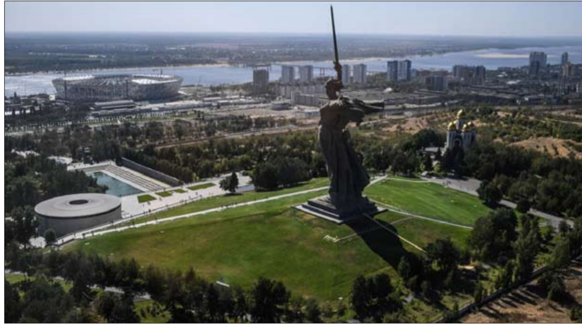
مع فولغوغراد الفكرة هي تحية الماضي السوفياتي للبلاد