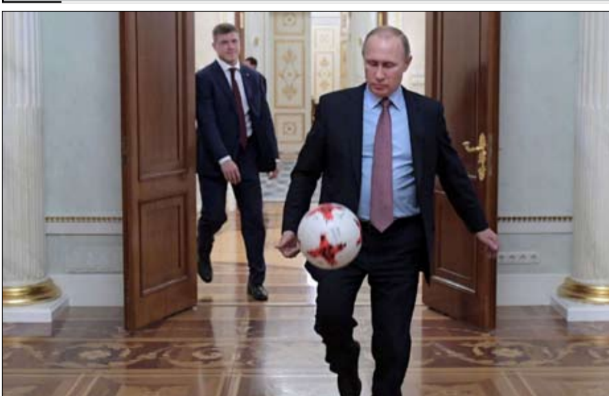
كأس العالم رهان بوتين