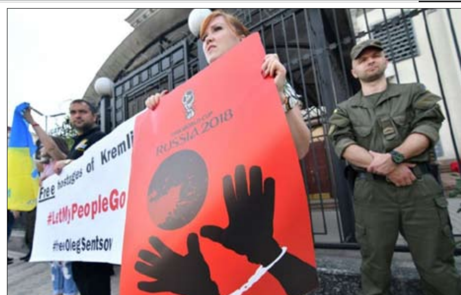
التظاهرات الرياضية العالمية سلاح ذو حدين