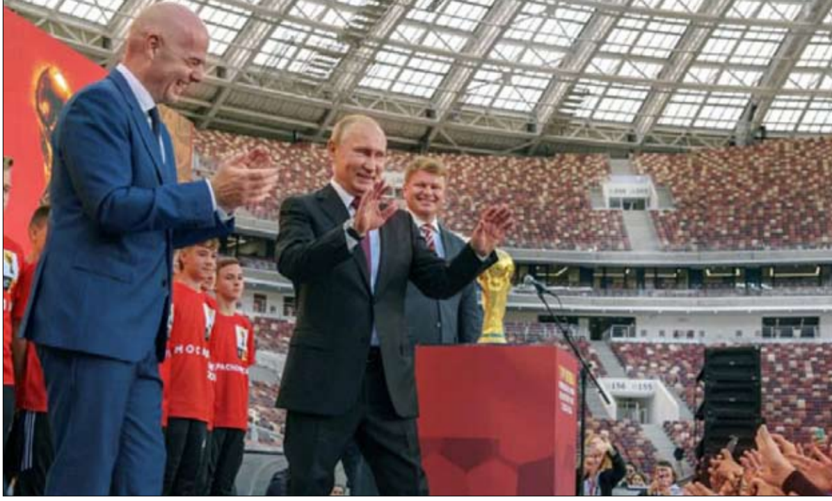
الرياضة من اسلحة القوة الناعمة الروسية