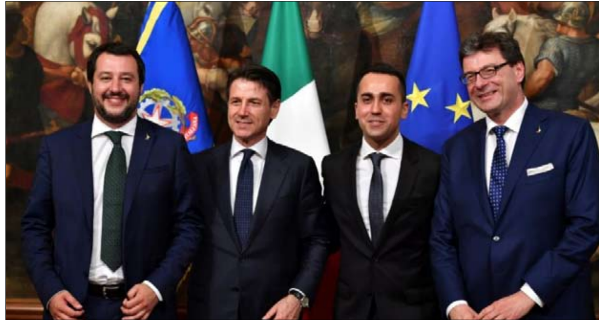
اليمين المتطرف يفلق حدود ايطاليا

اصيب عشرة شرطيين اسرائيليين بجروح في صدامات مع مستوطنين اثناء إخلاء بؤرة استيطانية في الضفة الغربية المحتلة من تلك التي تصنفها اسرايل بالعشوائية، بحسب ما أعلنت الشرطة. وفي نظر القانون الدولي كل المستوطنات الاسرائيلية غير قانونية لكن اسرايل تفرق بين المستوطنات التي ترخص لها وتلك التي تقام بلا ترخيص اي العشوائية. وكانت المحكمة العليا قررت في شباط/فبراير 2017 ان قسما من مستوينة نابوا الغربية في شمال الضفة الغربية المحتلة، يجب ان يزال لأنه بني على املاك فلسطينية خاصة. وقال المتحدث باسم الشرطة ميكي روزنفلد ان 11 عنصرا اصيبوا "بجروح طفيفة" اثناء عملية الإخلاء الاحد عشرة منازل في المستوينة. وتم توقيف ستة اشخاص اثناء العملية التي ستواصل خلال النهار. واعلنت منظمة مؤيدة للاستيطان اجلاء 40 شابا من المنطقة اصيب احدهم بجروح طفيفة. وكانت الشرطة طردت الثلاثاء المستوطنين من 15 منزلا في بؤرة استيطانية اخرى شمال الخليل بالضفة الغربية المحتلة. ويعيش في الضفة الغربية والقدس الشرقية المحتلتين نحو ثلاثة ملايين فلسطيني واكثر من 600 الف مستوطن.