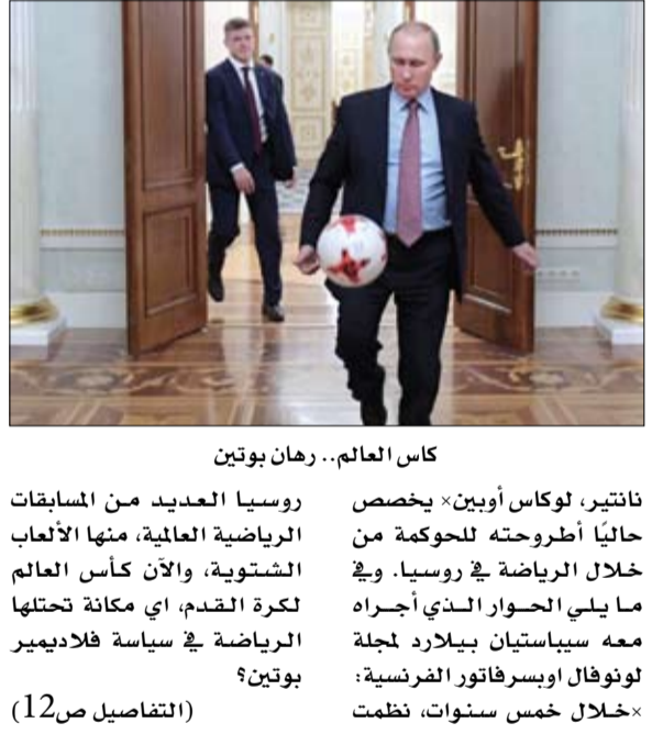
كأس العالم.. رهان بوتين

.. الفجر - خيرة الشيباني: تحتضن روسيا هذه الأيام، ولأول مرة في التاريخ، كأس العالم لكرة القدم، واحد من أكثر الأحداث الرياضية شعبية في العالم. مسابقة، بالنسبة لفلاديمير بوتين، يتجاوز رهايتها بوضوح إطار الرياضة. بعد أربع سنوات من الألعاب الأولمبية الشتوية المكلفة جداً في سوتشي، بذلت السلطة الروسية كل ما في وسعها ليكون كأس العالم هذا فرصة أخرى لإظهار عظمة روسيا. وهكذا سيكلف تنظيم المسابقة ما يقارب 10 مليار يورو للدولة، وهو مبلغ قياسي. لماذا تراهن روسيا على الرياضة بهذا الحجم؟ يبحث في الجغرافيا السياسية في جامعة ثانتر، لوكاس أوبين» يخصص حالياً أطروحته للحكومة من أجل كأس روسيا. وفي ما يلي الحوار الذي أجراه معه سيباستيان بيلارد لمجلة لئونفال اوبسرفاتور الفرنسية: «خلال خمس سنوات، نظمت روسيا العديد من المسابقات الرياضية العالمية، منها الألعاب الشتوية، ولأن كأس العالم لكرة القدم، أي مكانة تحتلها الرياضة في سياسة فلاديمير بوتين؟ (التفاصيل ص12)