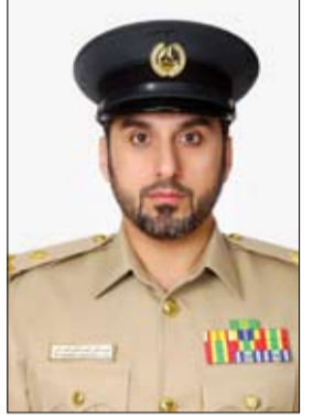
•• دبي - الفجر:

وتقدم خدمات علاجية تتماشى مع رؤية القيادة. وأضافت أن اللجنة الطبية في شرطة دبي تلقت خلال الأشهر الثلاثة الأولى فقط من هذا العام نحو 1156 طلب من موظفي شرطة دبي للعلاج خارج الدولة، ومنها شراء معدات وأجهزة طبية، ومنها تعويضات مالية، وأخرى لتحمل تكاليف العلاج، موضحة أنه تمت الموافقة على إرسال 54 مصاباً بالسرطان للعلاج خارج الدولة، و37 حالة تعاني من أصابات المفاصل والعظام، و5 حالات قلب وسرايين، و4 حالات أمراض باطنية، و4 حالات أعصاب، و6 حالات عيون، بالإضافة إلى حالات أخرى كالآلذ والاذن والحنجرة وأمراض النساء والأمراض التناسلية. وذكرت الدكتورة ليلي أن اللجنة الطبية تعمل وفق نظام إداري يصف الحالات والمستفيدين من الخدمات الطبية بشرطة دبي، سواء كانوا الموظفين أنفسهم أو أسرهم، حيث استفاد خلال الربع الأول من العام 2018 من قرارات اللجنة الطبية نحو 39 موظفاً، و12 زوجة، و6 أبناء، و14 ابنة، و13 أياً، و25 أمماً، بالإضافة إلى 5 موظفين متقاعدين. وأشارت إلى أن اللجنة أرسلت الحالات التي يتطلب علاجها خارج الدولة إلى مراكز متخصصة في 8 دول من مختلف دول العالم، كاليابان والولايات المتحدة الأمريكية، والمملكة المتحدة، وألمانيا، وإسبانيا، وسنغافورة، وتايلاند، والهند، مؤكدة أن اللجنة الطبية طلعت وقامت بدراسة 149 حالة من الأمراض