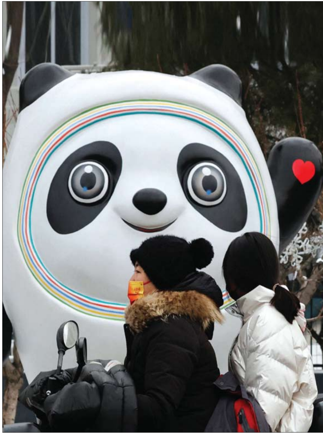
فتاتان تركبان دراجة بخارية كهربائية وتمران أمام مجسم تنميمة بكين الأولمبية الشتوية بينج دوين دوين 2022، في بكين.

ولكنها بشكل عام غنية بالخضروات والفواكه والبقوليات والمكسرات والفاصوليا والحبوب والأسماك والدهون غير المشبعة مثل زيت الزيتون.