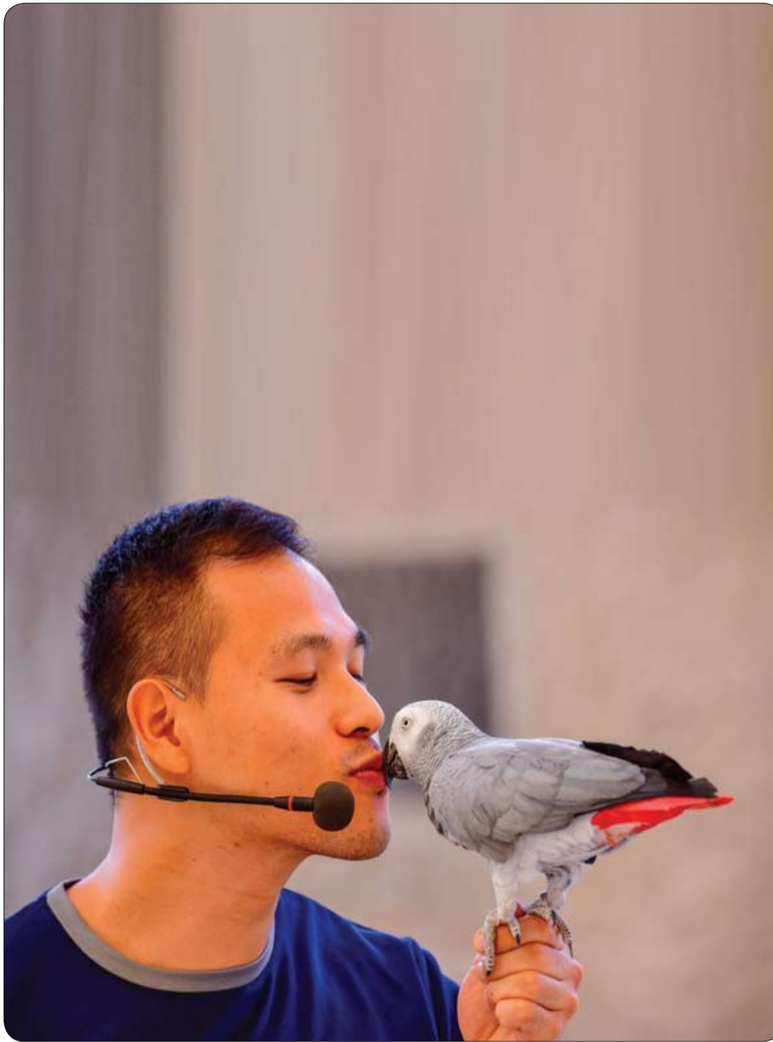
مدرب يقبل ببغاءه خلال عرض في حديقة سفاري دبي.