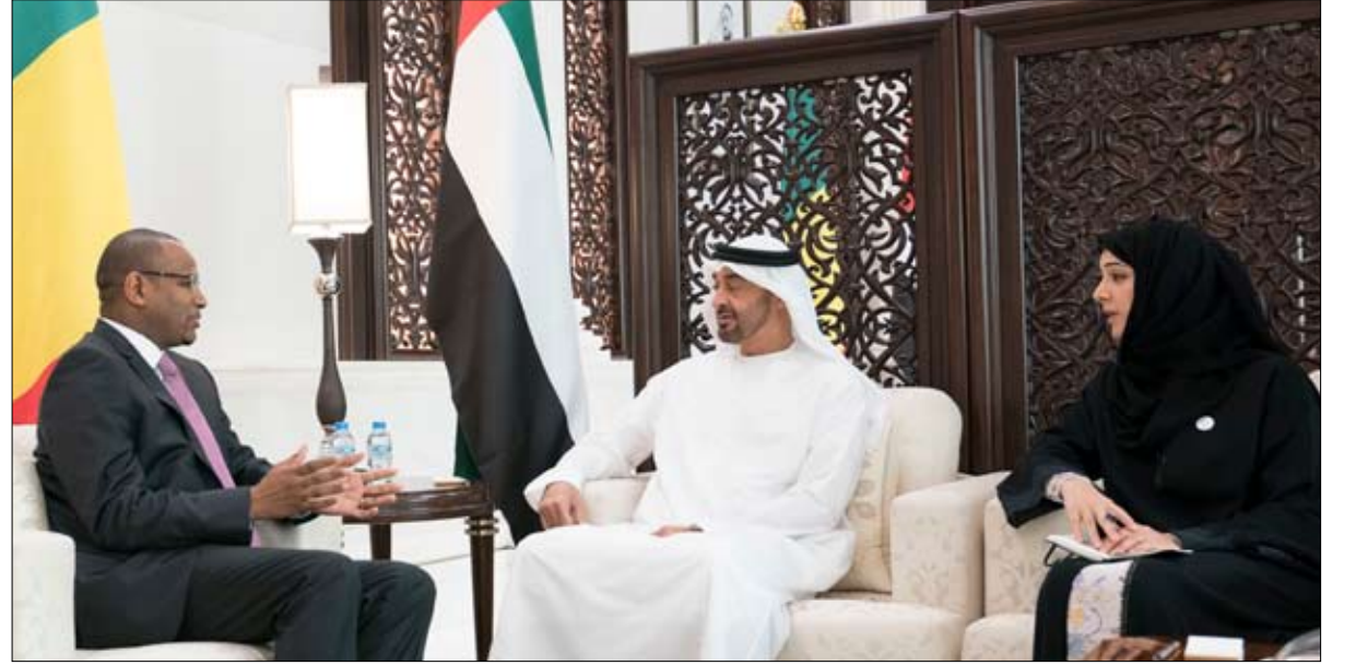
بحث مع رئيس وزراء مالي علاقات الصداقة والتعاون والمستجدات الإقليمية والدولية