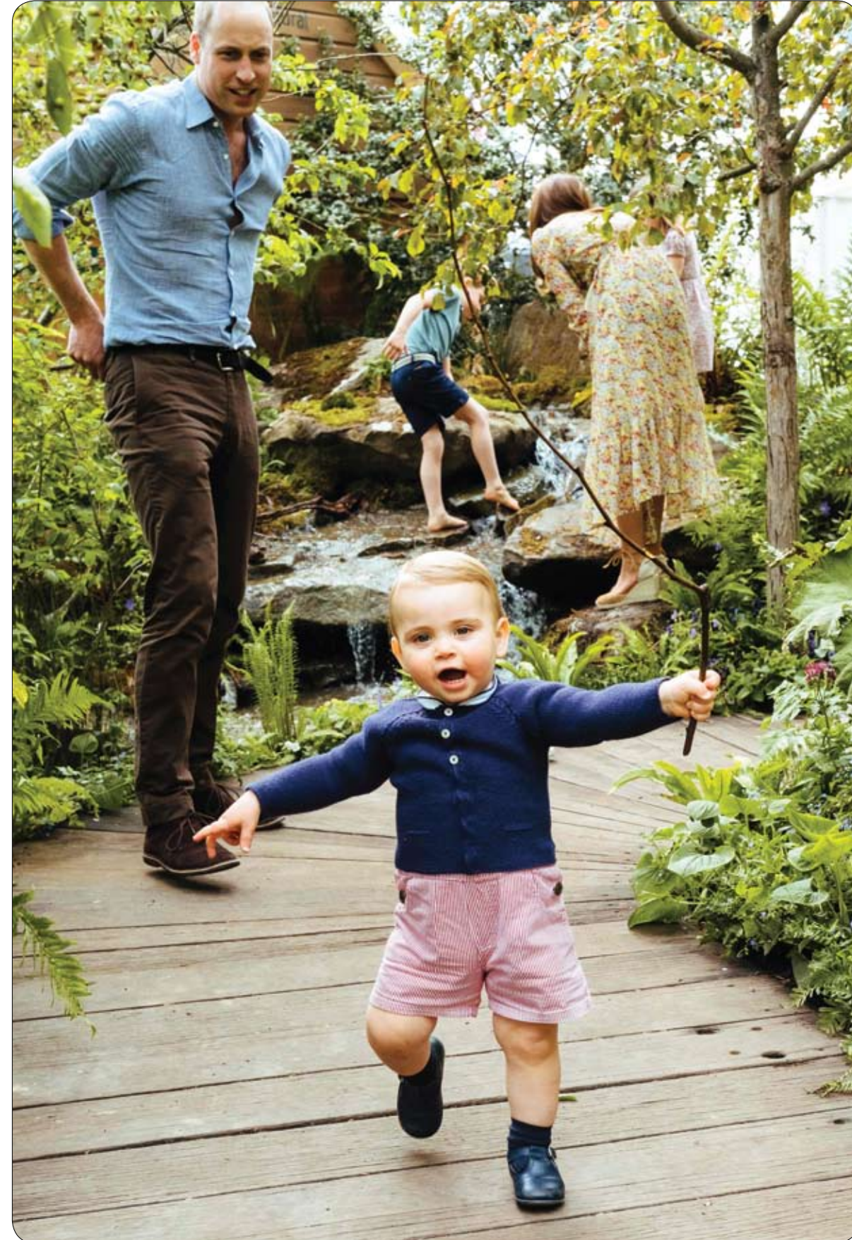
الأمير وليام ، دوق كامبريدج يراقب الأمير لويس بينما تتابع زوجته كاترين ابنتهما الأمير جورج في حديقة الطبيعة بلندن.

سجل ثمانيني بريطاني رقماً قياسياً عالمياً دخل به سجل غينيس للأرقام القياسية، من خلال قطع مسافة 1000 ميل خلال 17 يوماً فقط على دراجته الهوائية. ولطالما كان الفيزيائي النووي السابق ألكس ميناري نشيطاً ولا يخشى من خوض التحديات القاسية.