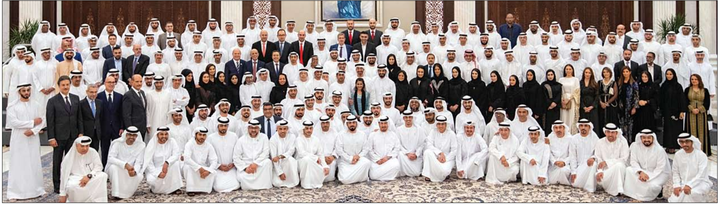
محمد بن زايد خلال لقائه القيادات الإعلامية ورؤساء تحرير الصحف المحلية وكبار مسؤولي المؤسسات الإعلامية العربية والعالمية العاملة في الدولة

يومية - سياسية - مستقلة www.alfajrnews.ae