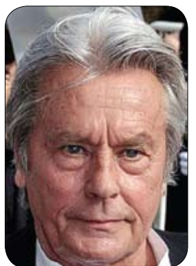
تكريم ألان ديولون في كان

رشق سكان قرية هندية أنثى فيل بالحجارة، أثناء وضعها لمولودها، مما أشعل غضبها ودفعها للهجوم عليهم، لتسقط قتيل واحد على الأقل. وفي التفاصيل أن بعض السكان المحليين في قرية أنجاسولي قاموا برشق أنثى الفيل بالحجارة خلال وضعها لمولودها، مما أثار غضبها الشديد، لتندفع بجسدها تجاههم وتدهس أحدهم حتى الموت، وفقاً لصحيفة "ديلي ميل" البريطانية. وأظهرت لقطات فيديو أنثى الفيل، بعد الحادثة، وهي تحاول جر مولودها، بينما كان غير قادر على النهوض. وكشفت اللقطات أن أنثى الفيل ظلت تحرس الفيل الصغير، بينما يحاول الناس الاقتراب منه، ويعتقد أن الأم أرادت نقله إلى الغابة، لكنها بقيت المهينة.. وهذه السعفة الذهبية المنحوت من أجل مسيرتي وليست لشبه آخر وهذا هو سبب سعادت وسروري ورضائي.