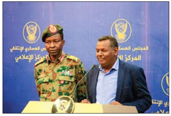
ممثلا العسكريين والمدنيين خلال مؤتمر صحفي في الخرطوم

والتوافق السياسي، وإعادة التازح واللاجئين. وأكدت القوى السودانية على أهمية التأسيس للتنمية المتوازنة والمستدامة وتحسين الاقتصاد وتعطيل العطالة، وتجويد الخدمات التعليمية والصحية، واستشراف المستقبل. وقالت، «تستمر اعصاماتنا حتى تحقيق أهدافنا كاملة».