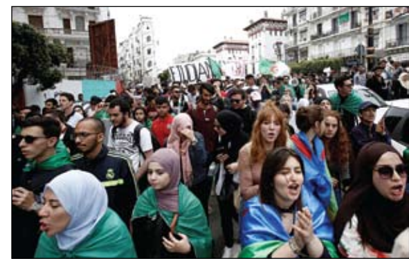
جزائريون يواصلون التظاهر في العاصمة

وقال مصدر قضائي وكالة فرانس برس إن 14 منهم لا يزالون موظفين حاليا في الوزارة بينما أقال البقية من مناصبهم. وتتهم أنقرة غولن وأتباعه بتدبير الانقلاب الفاشل الذي هدف