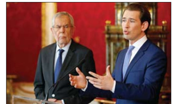
المستشار النمساوي يعلن إقالة وزير الداخلية ويجواره رئيس الجمهورية

أعلن المستشار النمساوي المحافظ سيلاستيان كورتز الاثنين إقالة وزير الداخلية هيربرت كيكل الذي ينتمي إلى حزب الحرية اليميني المتطرف إثر تسريب شريط مصور تسبب بفضيحة مدوية لهذا الحزب، الأمر الذي قد يدفع جميع وزراء إلى الاستقالة من الحكومة. وقال كورتز في مؤتمر صحافي «بالتوافق مع رئيس الجمهورية، اقترحت عليه إقالة وزير الداخلية كيكل.