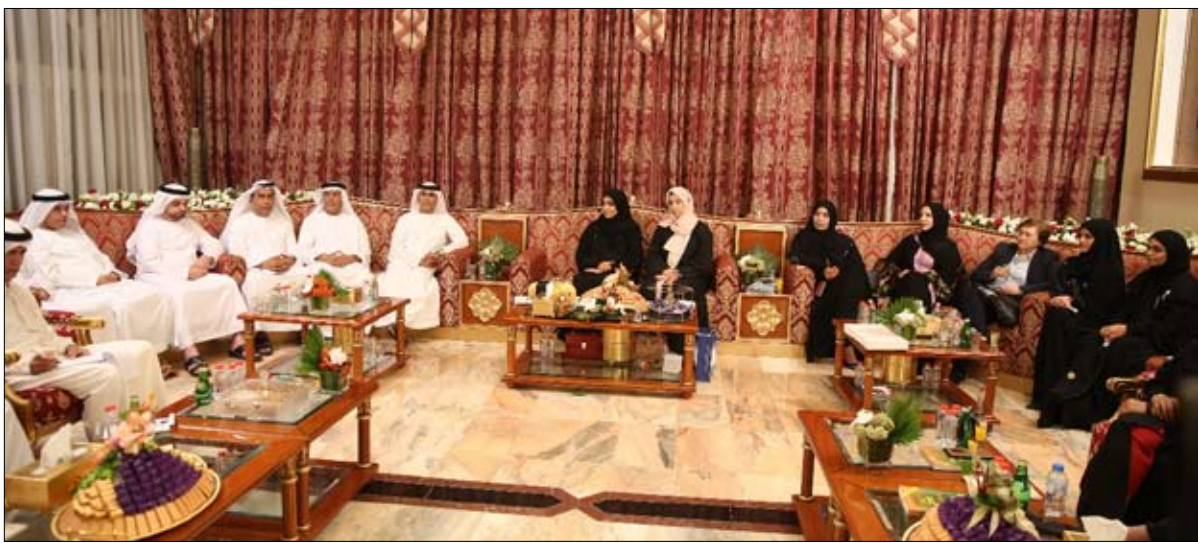
مجلس سالم بن سلطان في رأس الخيمة: «التسامح الإماراتي» قاد لتحقيق أحلام الإمارات

تحت إشراف وزارة التربية والتعليم، وبالتعاون مع مجلس الشارقة للتعليم وتطبيق 10 مناهج دراسية متنوعة بما فيها المدارس الخاصة والعامة بالحافلات المدرسية، وتجهيز السائقين أثناء القيادة وما يترتب عليه من مشاكل تتعلق على توفير الأمان لأبنائهم، بادترع عدد كبير من إدارات المدارس الخاصة بالشارقة، بتعميم استبيانات تقييمية على أولياء الأمور لقياس مدى جودة حافلاتها المدرسية، ومدى التزامها بالمواعيد المحددة للذهاب وإياب الطلبة من وإلى المدرسة، ومركزة على معرفة ما إذا كانت جميع مقاعد الحافلة ممتلئة من عدمه، وما إذا كان الطلبة المسجلين بالحافلة تلقوا تدريبات وشرح توضيحي لقواعد الأمن والسلامة داخل الحافلة من قبل المتخصصين أم لا. كذلك اهتمت الاستبيانات بضرورة ذكر إذا كان الطلبة يتلقون مساعدة دائمة داخل الحافلة أم لا، مؤكداً على كافة الطلبة إلى تحرير اقتراحاتهم التي يرونها مناسبة من وجهة نظرهم لتحسين خدمات الحافلات. وفيما يخص الاشتراطات التي يجب توافرها في سائقي الحافلات المدرسية، فقد حددت مواصفات الإمارات من