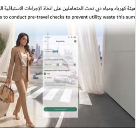
هيئة كهرباء ومياه دبي تحت المتعاملين على اتخاذ الإجراءات الاستباقية اللازمة قبل سفرهم لتجنب الهدر DEWA urges Dubai households to conduct pre-travel checks to prevent utility waste this summer

دعت هيئة كهرباء ومياه دبي، المتعاملين من القطاع السكني، إلى اتخاذ الإجراءات الاستباقية اللازمة قبل سفرهم، للحفاظ على كفاءة استهلاك الكهرباء والمياه حتى أثناء غيابهم وضمان التدخل المبكر والحد من الهدر في كل الأوقات. وأكدت الهيئة، في إطار حملتها الصيفية السنوية تحت شعار "استمتع بأجواء مستدامة هذا