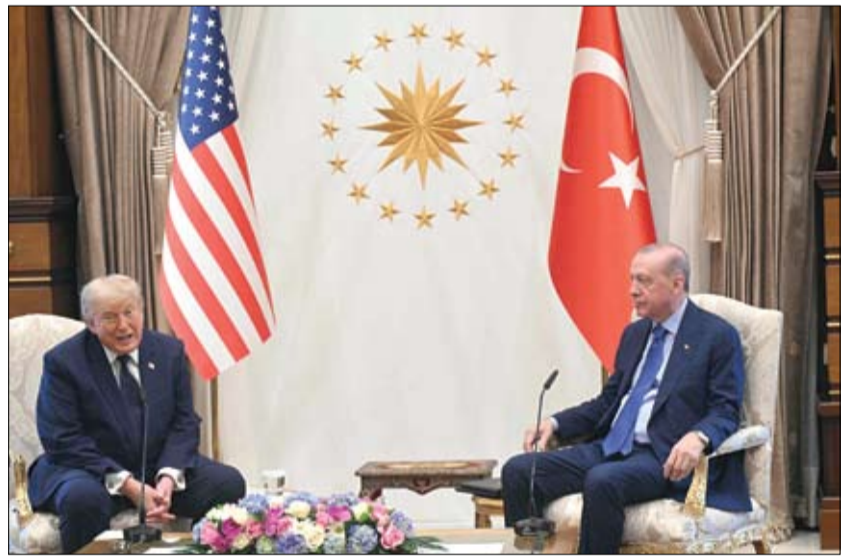
الرئيس التركي خلال استقباله نظيره الأمريكي بيل قمة الناتو في أنقرة

وأضاف روث: الدول الحلفاء تستثمر أكثر من 40 مليار دولار في قدرات مكافحة الطائرات المسيرة على مدار الخمسة أعوام المقبلة بالإضافة إلى التخطيط لتعزيز التدريب التشغيلي للجنود.