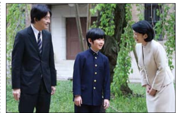
الامير هيساهيتو بين والديه