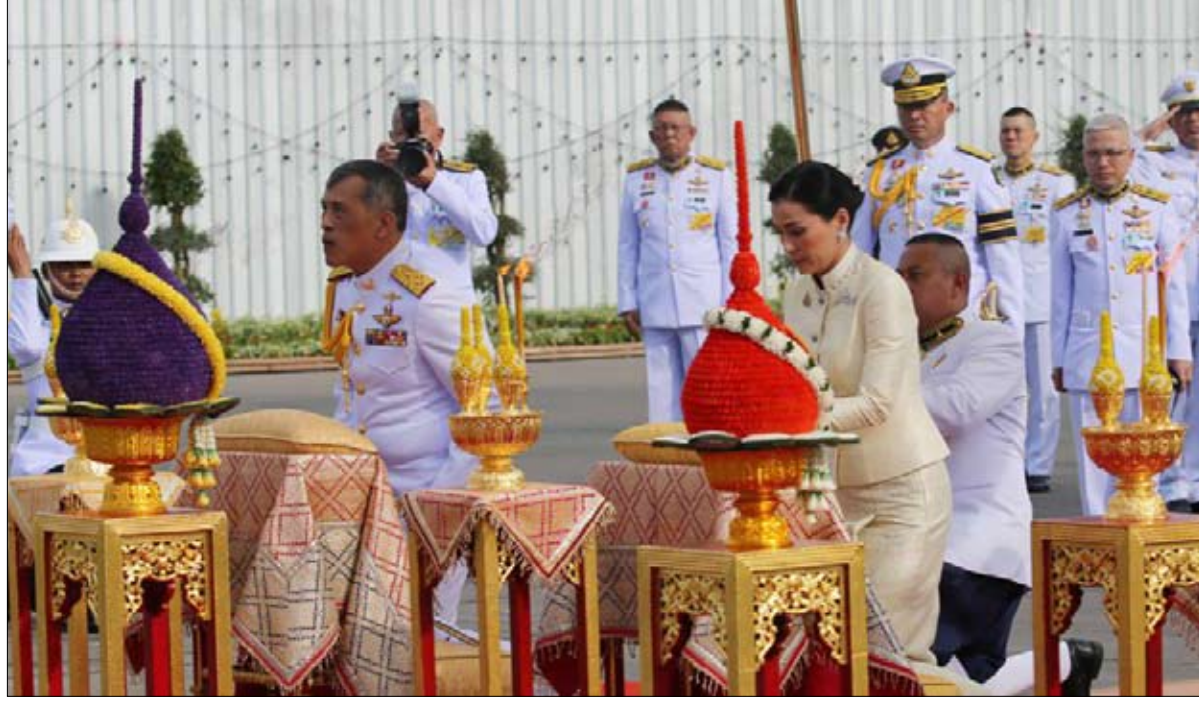
من مضيئة طيران الى ملكة