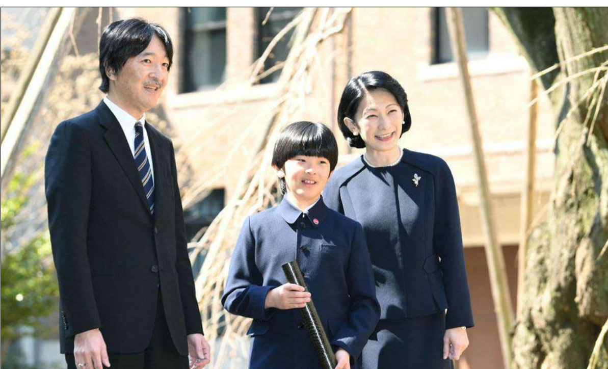
الأمير هيساهيتو يتحصل على دبلوم المدرسة الابتدائية