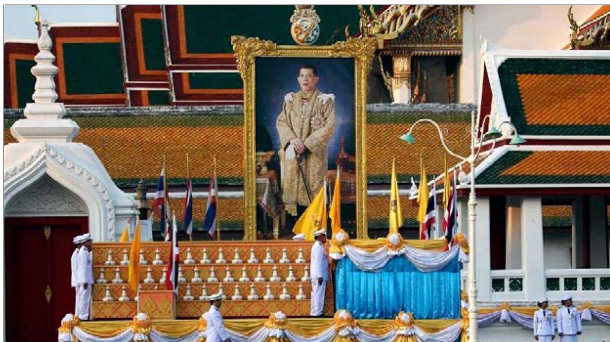
صورة للملك في مدخل القصر