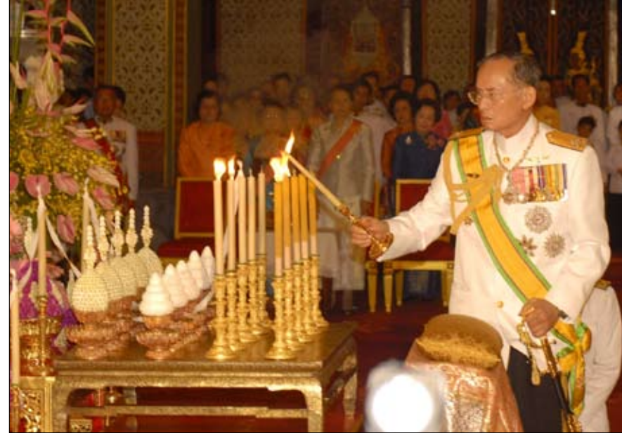
والده المحبوب بوميبول أدولياديج

سعى الحاكم الجديد إلى تعزيز سلطته. خصوصا عن طريق تعديل مواد معينة من الدستور، من أجل أن يكون قادرا على إصدار أوامر ملكية دون الحاجة إلى توقيع البرلمان. وقد نقل أيضا أصول مكتب التاج باسمه، وهي تقدر بأكثر من 30 مليار يورو. ويقول باتريك جوري