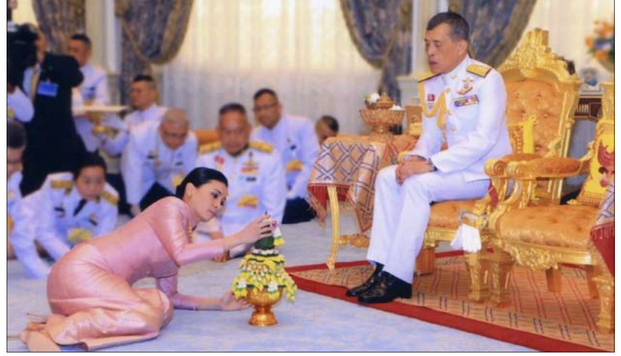
من مراسم زواج الملك