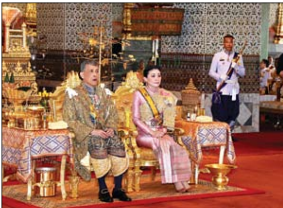
ملك تالاند الجديد عقب توجيهه وبيجوارته زوجته الملكة سوثيدا تيدجاي

•• بغداد-وكالات: أعلنت الاستخبارات العراقية، أمس السبت، إحباط مخطط إرهابي، كان يرمي لإعادة تشكيل خلايا جديدة لتنظيم «داعش» الإرهابي في العراق. وذكر بيان صادر عن الاستخبارات العراقية، أنه بعد متابعة دقيقة استمرت لعدة شهور قيادات داعش الإرهابية الداخلة من سوريا لغرض إعادة تنظيم صفوفها وتنفيذ عمليات إرهابية لزعزعة الأمن في محافظة نينوى، تمكنت «خلية الصقور الاستخبارية» بفرقيها الفني والتكتيكي من إحباط مخطط داعش الإرهابي المدعو عبدالغفور عبداللهم كرموش والذي يشغل منصب (أمني ولاية الجزيرة)، من خلال نصب كمين له في شمال تلعفر. وأضاف البيان: «اضطر أحد مراقبي كرموش إلى تجميع نفسه. وقد تم تنفيذ العملية بإسناد من استخبارات الفرقة الخامسة عشر للجيش العراقي، وعمليات الحشد الشعبي في نينوى». واختتم «الإرهابي المنوه عنه هو المسؤول عن قتل العشرات من الأبرياء من أبناء مدينتي الموصل وتلعفر».