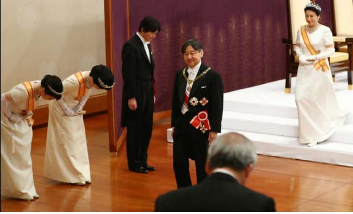
هيراهايتو.. إمبراطور اللحظة وماذا بعد

•• الفجر - داميان دوران - ترجمة خيرة الشيباني بالنسبة لداعي السلالة الإمبراطورية اليابانية، تم في 6 سبتمبر 2006 إنقاذ عرش الأحقوان - مؤقتاً على الأقل. في ذلك اليوم، بعد سنوات من الانتظار والنقاش، جاء الأمير فوميهيتو، شقيق الإمبراطور الجديد ناروهيتو،