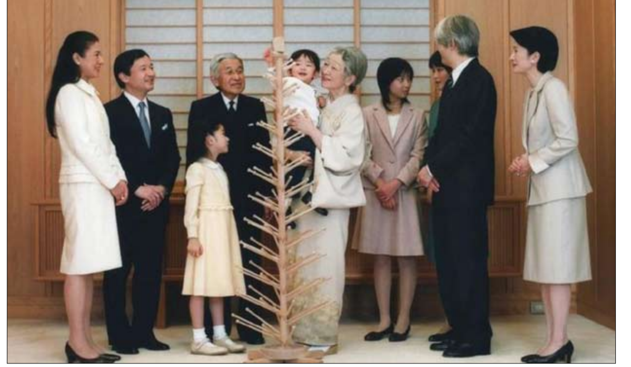
الأسرة الإمبراطورية في صورة جماعية