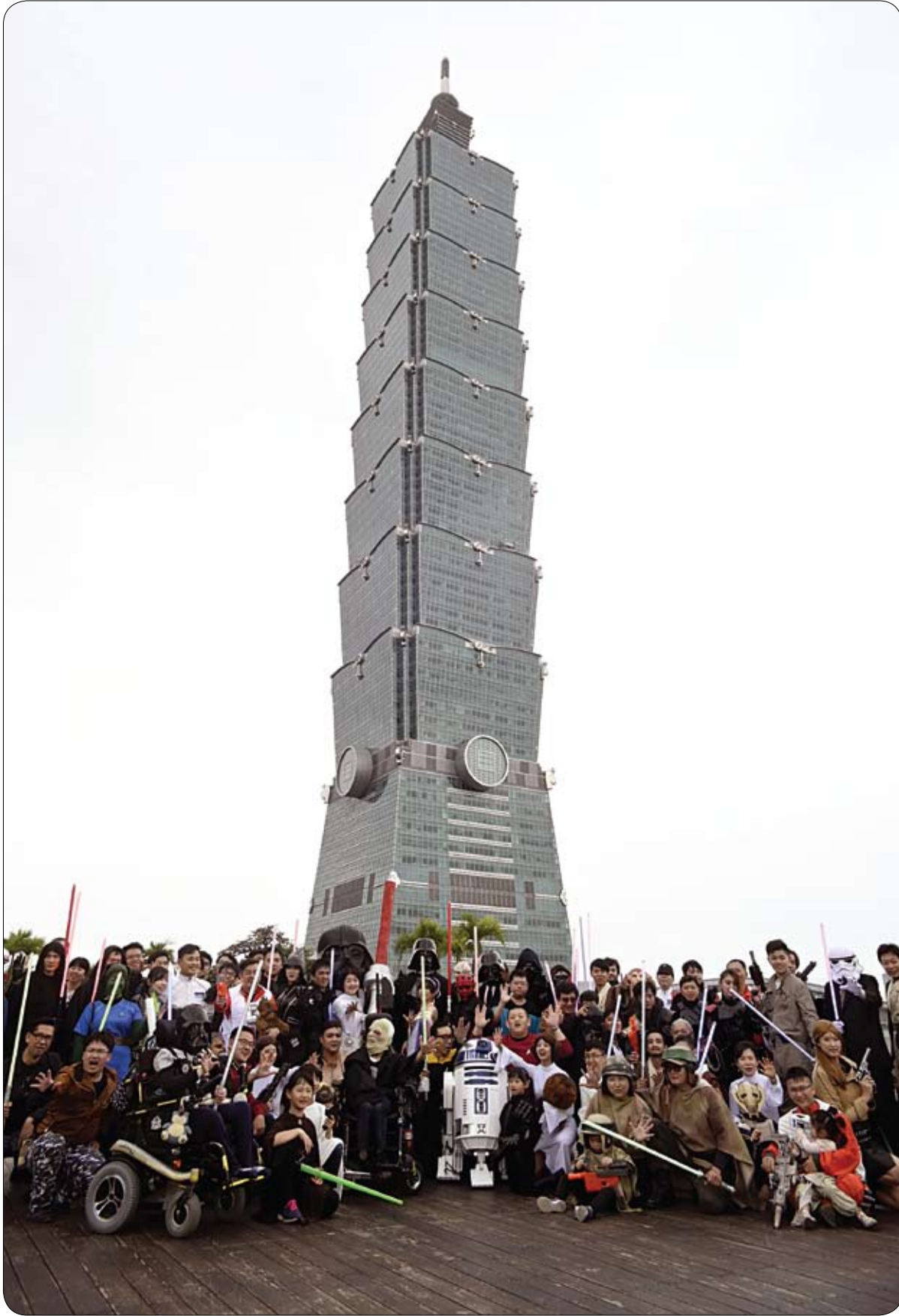
مشجعو حرب النجوم يلتقطون صورة جماعية أمام مبنى تايبيه 101.

قررت شركة "ستاربكس" الأمريكية سحب أكثر من ربع مليون مكبس قهوة يدوي بيع منذ أكثر من عامين، بعد تلقي تقارير بشأن تحللها أثناء الاستخدام، مما تسبب في جروح لبعض مستخدميها. وأوضحت صحيفة "وول ستريت جورنال" الأمريكية، أن الشركة التي تمتلك آلاف المقاهي حول العالم، تهدف إلى سحب ما يقرب من 263 ألفا من مكابس القهوة. وتشمل عملية السحب 231 ألف قطعة وحدة في الولايات المتحدة و33 ألفا في كندا، بيعت في الفترة بين عامي 2016 و2019. وستحتل "ستاربكس" خسارة تقدر بنحو 5.3 مليون دولار إذا تم إرجاع جميع المكابس المصنوعة في البرتغال، حيث تم بيع الواحد منها مقابل حوالي 20 دولارا. ووفقا لـ "وول ستريت جورنال"، تنظم هيئة الصحة الكندية عمليات السحب، بالتنسيق مع اللجنة الأمريكية لمراقبة المنتجات الاستهلاكية وسلسلة "ستاربكس". وكانت هيئة الصحة الكندية ولجنة حماية المستهلك في الولايات المتحدة أعلنتا أن القبط البلاستيكي الذي يعلو الآلة قد يتحطم عندما يضغط المستخدم على المكس، مما يجعل التضييق المعدني مكشوقا، وبالتالي والحلويات.