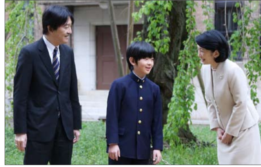
الأمير هيساهيتو بين والديه

تتقاسم الأسرة الحاكمة نفس مصير بلدها، الذي يعاني من انهيار ديموغرافي