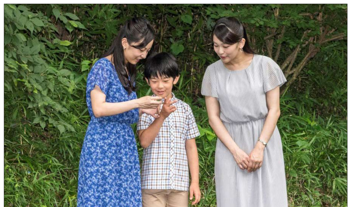
الأمير مع أخته.. النساء ممنوعات من العرش