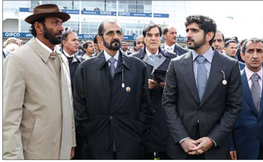
محمد بن راشد خلال مشاهدته سباق 2000 غينيز الإنجليزي للخيل

اعتبر ذلك الأمر «خطأ أحمر» العسكري السوداني» يرفض أغلبية مدنية» بالمجلس السيادي •• الخرطوم-وكالات: قال عضو المجلس العسكري الانتقالي في السودان، امس السبت، إن الجيش لن يقبل بأغلبية مدنية في مجلس مؤقت لتقاسم السلطة، معتبرا ذلك الأمر «خطأ أحمر». وقال الفريق صلاح عبد الخالق، إن المجلس يمكن أن يقبل بتمثيل متساو للمدنيين والعسكريين، لكنه لن يقبل بأغلبية مدنية في المجلس السيادي، تعليقا على مطالب قوى الحرية والتغيير. وكانت قوى الحرية والتغيير قدمت وثيقة دستورية للمجلس العسكري الانتقالي، قالت إنها تشكل رؤية متكاملة حول صلاحيات ومهام المؤسسات خلال الفترة الانتقالية. ومن أبرز البنود التي تضمنتها الوثيقة، وقف العمل بدستور 2005 الانتقالي، وتحديد فترة انتقالية لمدة 4 سنوات، وتشكيل مجلس سيادي مشترك من المدنيين والمجلس العسكري لإدارة شؤون البلاد، وتشكيل مجلس تشريعي انتقالي يتألف من عدد 120 إلى 150 عضوا. وقالت قوى إعلان الحرية والتغيير، الجمعة، إنها في انتظار رد المجلس العسكري على الوثيقة الدستورية والتي سيحدد على ضوءها ملامح المرحلة المقبلة. وأوضح أمجد فريد الناطق الرسمي باسم تجمع المهنيين في مؤتمر صحفي، أن هناك بوادر إيجابية من المجلس العسكري الانتقالي، وقد كان رد على وثيقة الإعلان الدستوري إيجابيا، وفق ما نقلت وكالة السودان للأنباء «سونا». وشدد فريد على الاستمرار في مواصلة الاعتصام وعدم إزالة المتاريس حتى تتحقق المطالب ويتم تسليم السلطة للمدنيين.