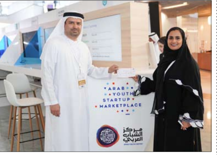
مشاركة 100 رائد أعمال من 18 دولة عربية