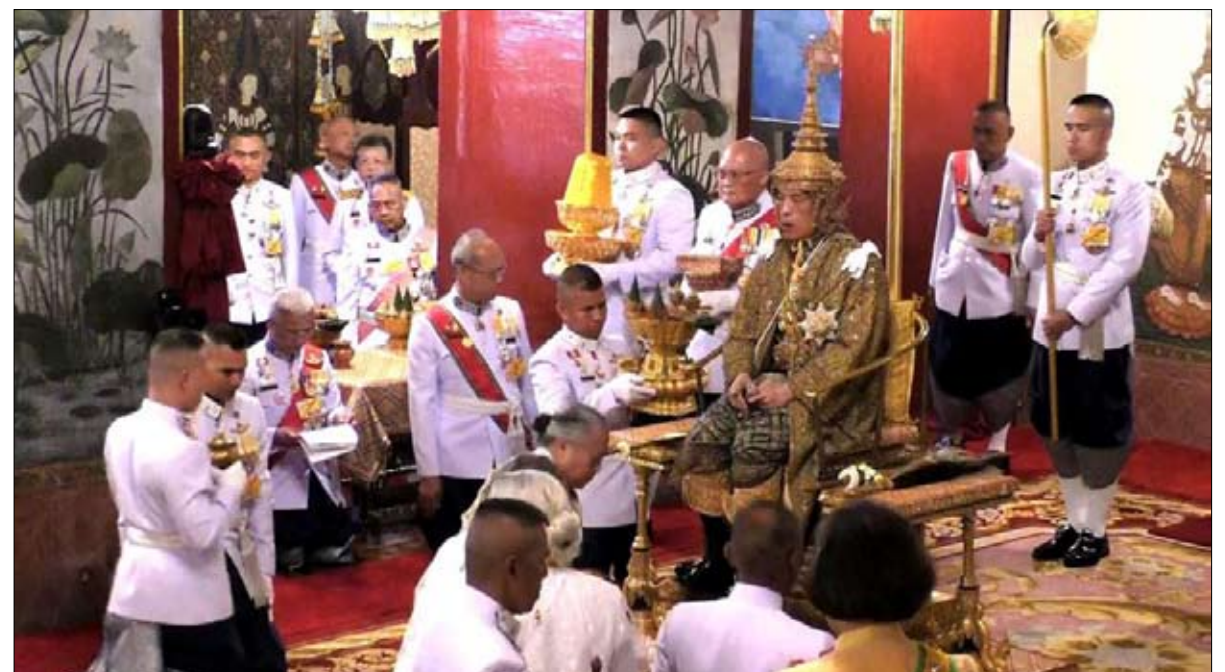
ملك يمارس السياسة