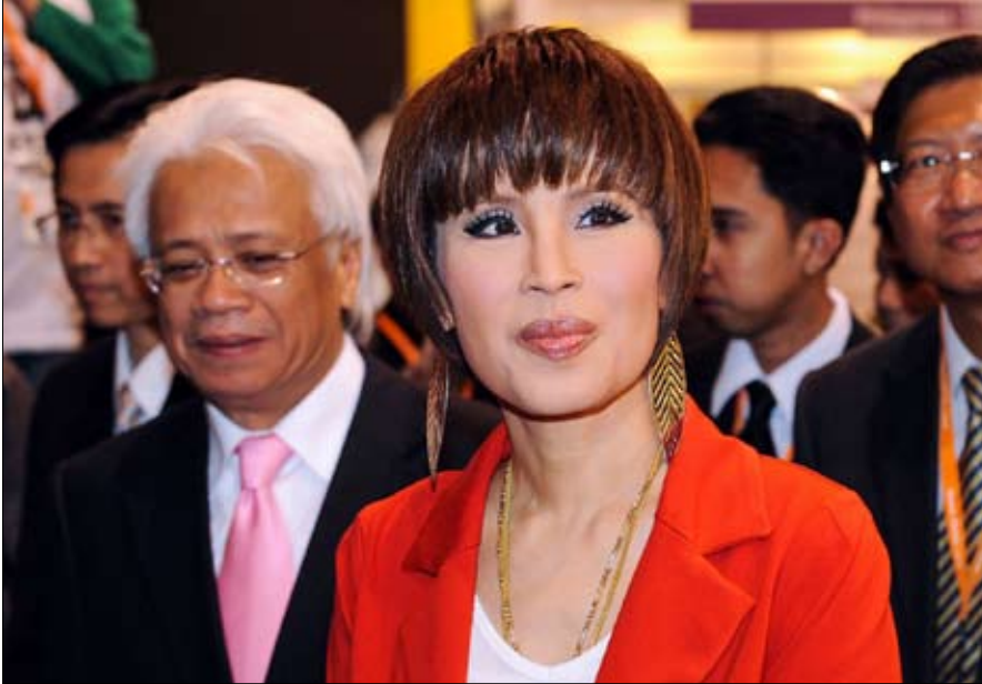
شقيقته ممنوعة من تزعم حزب معارض

وفي الانتظار، يوظف كل نقله لتجنب ذلك. في الحالة الراهنة للتشريعات والثقافة التايلندية، لا يمكن تصور وجود معارضة مباشرة لرغبة صاغها الملك بوضوح.