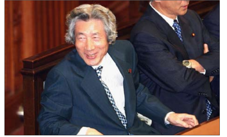
جونيشيرو كوزومي.. سعى لتولي العرش امرأة

لا تعتلي المرأة العرش، ويتم استبعادها من الأسرة إذا تزوجت من عامة الناس