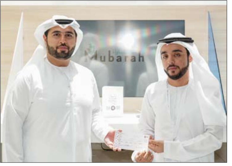
مشاركة 100 رائد أعمال من 18 دولة عربية