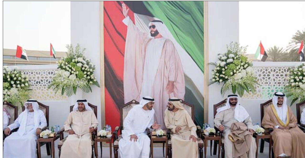
محمد بن راشد ومحمد بن زايد خلال حضورهما حفل زفاف نجل جمعة بن أحمد البواردي الفلاسي

• دبي - محسن راشد: في سابقة لم يشهدها الميدان التربوي من قبل، أتمت وزارة التربية والتعليم إجراء امتحان إعادة للطلبة الراشدين في امتحانات نهاية الفصل الدراسي الأول، على أن يكون الامتحان خلال الفصل الدراسي الجاري، ويبدأ الأحد 11 من مارس المقبل لمدة 5 أيام تنتهي الخميس 15 مارس، فيما امتحان إعادة الذي عهدهت وزارة التربية عليه مع نهاية العام الدراسي وبعد نتائج امتحانات نهاية العام الدراسي، ولم يسبق أن عقدت امتحانات إعادة للفصول الدراسية الأولى أو الثانية، ويستهدف الامتحان إعادة الذي أقرته وزارة التربية الطلاب الذين لم يحالفهم الحظ بالنجاح في امتحانات الفصل الدراسي الأول لصفوف العاشر والحادي عشر والثاني عشر في 5 مواد هي الرياضيات والفيزياء، والعلوم الصحية، والكيمياء، والاحياء، حيث شهدت هذه المواد الخمس معدلات رسوب كبيرة لم يشهدها الميدان التربوي من قبل لآلاف الطلاب والطالبات. (التفاصيل ص 5)