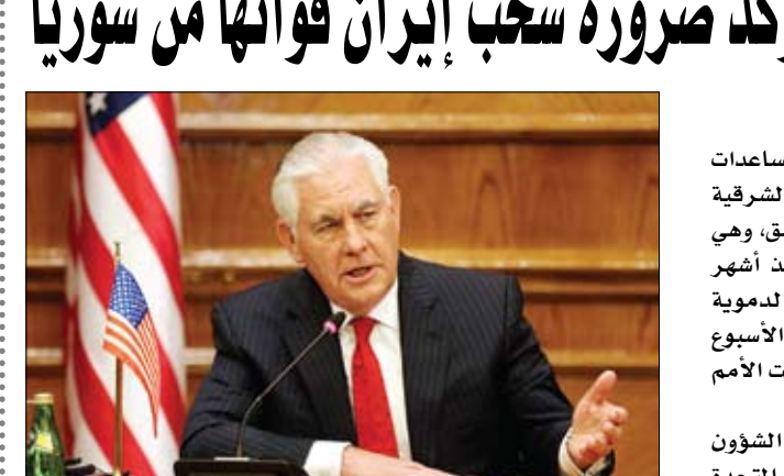
وزير الخارجية الأمريكي خلال مؤتمر صحفي في عمان

• عواصم-وكالات: دخلت امس قافلة مساعدات إنسانية إلى الغوطة الشرقية المحاصرة قرب دمشق، وهي الأولى من نوعها منذ أشهر وتأتي بعد الغارات الجوية التي استهدفت المنطقة الأسبوع الماضي، وفق ما أعلنت الأمم المتحدة. وأفاد مكتب تنسيق الشؤون الإنسانية التابع للأمم المتحدة في سوريا في تقريرة على موقع تويتر: عبرت أول قافلة مشتركة بين وكالات الأمم المتحدة والهلال الأحمر العربي السوري لهذا العام خطوط النزاع باتجاه النشائية في الغوطة الشرقية موضحا أنها تقل مواد غذائية ومستلزمات صحية 7200 شخص محاصرين. من جهة أخرى، أكد وزير الخارجية الأميركي، ريكس تيلرسون، امس أن على إيران أن تسحب ميليشياتها من سوريا. وقال خلال مؤتمر صحافي مع نظيره الأردني أيمن الصفدي من عمان، قبيل لقائه الملك الأردني: إن بلاده قلقة تجاه الاشتباك الأخير بين إسرائيل وإيران في سوريا. وأضاف: الحل في سوريا يجب أن يكون وفق القرار 2254 وجنيف. كما شكر الأردن على استقبال الكثير من النازحين السوريين. وفي الموضوع اللبناني، أكد