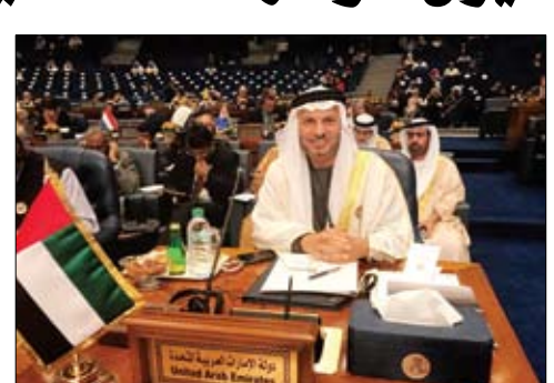
قرقاش خلال ترؤسه وفد الدولة لمؤتمر الكويت لإعادة إعمار العراق

• عواصم-وام-وكالات: أعلن معالي الدكتور أنور بن محمد قرقاش وزير الدولة للشؤون الخارجية تقديم دولة الإمارات لدعم جديد بقيمة 500 مليون دولار للمساهمة في الجهد الدولي لإعادة إعمار العراق. وأوضح معاليه - في كلمته خلال مشاركته على رأس وفد الدولة في أعمال مؤتمر الكويت الدولي لإعادة إعمار العراق - أن الدعم يشمل 250 مليون دولار أمريكي عبر صندوق أبوظبي للتنمية لمشاريع البنية التحتية و100 مليون دولار أمريكي لدعم الشركات الإماراتية في مشاريع قطاع الكهرباء في العراق و100 مليون دولار أمريكي لدعم وتحفيز الصادرات الإماراتية إلى العراق إضافة إلى 50 مليون دولار أمريكي لدعم عمليات الهلال الأحمر الإماراتي في جهودها الإنسانية ومشاريعها الخيرية في المناطق الأكثر تأثرا بإرهاب داعش. (التفاصيل ص 3)