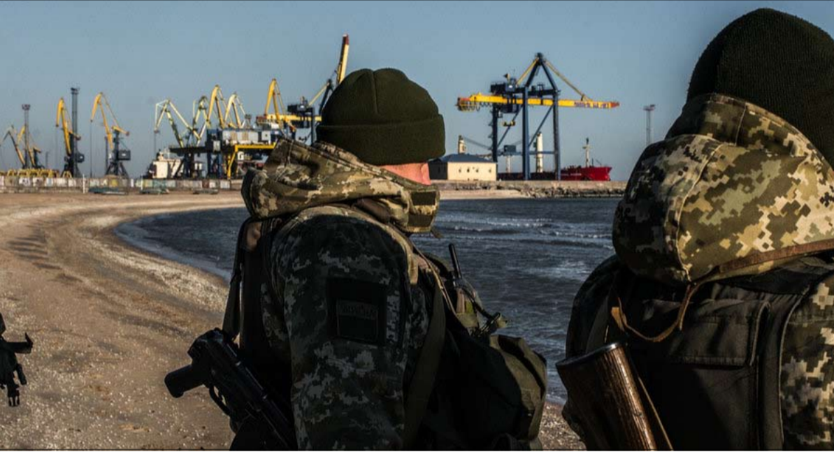
جنود اوكرانيون قرب ميناء ماريوبول

•• الفجر - تونس طالب الحزب الدستوري الحر أمس الأربعاء النيابة العمومية بفتح تحقيقات جديّة في تدوينات وتهديدات قال إنها منشورة للعموم بخصوص «مخطط تصفية رئيسة الحزب عبير موسى جسدياً» محملاً أجهزة المؤسسة الأمنية مسؤولية حمايتها الجسدية في ظل ما لاغتيال الأستادة عبير موسى عند نقلها عبر الجهات في المدة الأخيرة. وأكد الحزب في بلاغ صادر عنه أمس أنّه «يقدم معركة طاحنة ضد الأخطبوط الجمعياتي