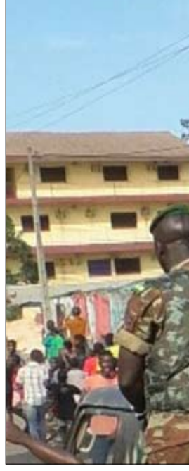
جنود اوكرانيون قرب ميناء ماريوبول

•• واجادوجو-ريوترز في المرة السابقة التي حاول فيها جنود متمردون قلب نظام الحكم في بوركنينا فاسو عام 2015 خرج مارسيل تنكاوونو مع آلاف المحتجين إلى الشوارع للإطاحة بالجنرال العسكري. وخلال أيام أعادت القوات الموالية للرئيس إلى السلطة. وفي الأسابيع الماضية خرج تنكاوونو إلى الشوارع مرة أخرى لكن خروجه هذه المرة كان للترحيب بالانقلاب العسكري الذي أطاح برئيس البلاد المنتخب روش كالبوري. قال تنكاوونو وهو من القيادات المدنية في بيته خارج العاصمة واجادوجو «منذ التسعينات حدثت موجة من الديمقراطية عبر غرب أفريقيا. لكن الديمقراطية خذلت الناس... لا بد أن تكون واضحاً. نحن نحتاج نظاماً عسكرياً. ويعكس هذا التحول في موقفه خيبة الظن في منطقة الساحل بغرب أفريقيا حيث أخفقت الحكومات المنتخبة في احتواء عنف المتشدين المتنامي والذي أسفر خلال العقد الأخير عن سقوط آلاف القتلى وتشريد الملايين. فقد شجع الغضب الشعبي الجيوش في مالي وغينيا وبوركينا فاسو على أن تتولى دفة الأمور بنفسها فوعدت أربعة انقلابات خلال 18 شهراً لتبدد ما تحقق من مكاسب ديمقراطية كانت سبباً في تخلص المنطقة من وصمة «حزام الانقلابات» الأفريقي التي لازمتها. كما أضعف وهو الفساد الثقة بالحكام المدنيين وأثار مخاوف الشركاء الدوليين ومنهم فرنسا