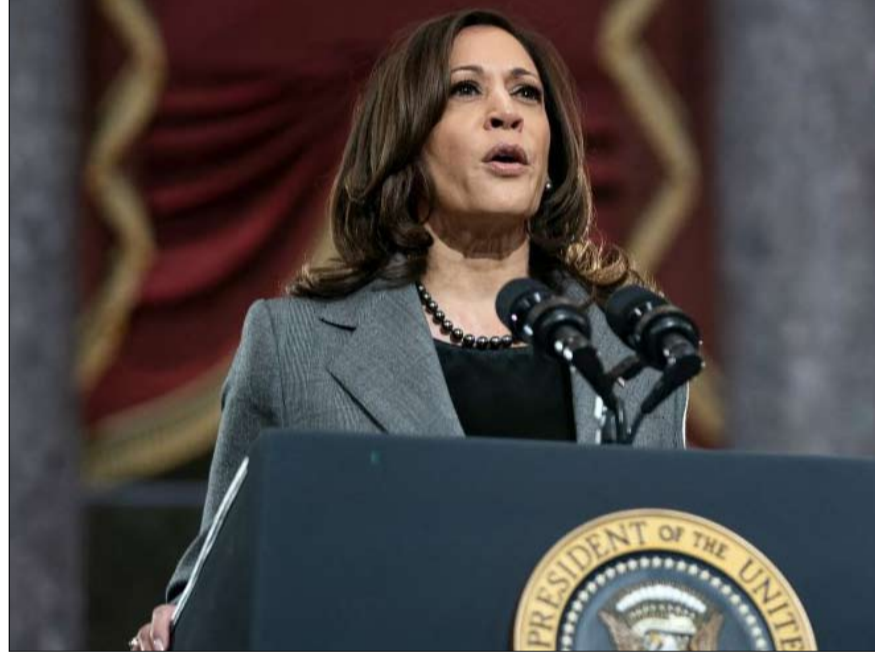
نائب الرئيس الأمريكي كامالا هاريس تلقي خطاباً في مبنى الكابيتول الأمريكي