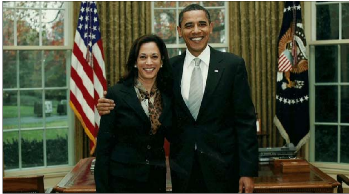
تنتمي كامالا إلى جيل أوباما

ومع ذلك، من الصعب استنتاج أي شيء من هذه الأرقام قبل ثلاث سنوات من القداس الانتخابي المقبل، خاصة أن المهام الموكلة إلى نائب الرئيس غالباً ما تكون ثانوية. ويبدو أنها تعاني على وجه الخصوص من تراجع شعبية الرئيس المتعثر مؤخراً في مفاوضات لا تنتهي في الكونغرس، وحملته الصحافية مسؤولة الانسحاب من أفغانستان. كما تم انتقاد بعض ملاحظاتها، سيما خلال رحلتها إلى غواتيمالا التي طبقت خلالها من مهاجري أمريكا الوسطى "عدم القدوم إلى الولايات المتحدة".