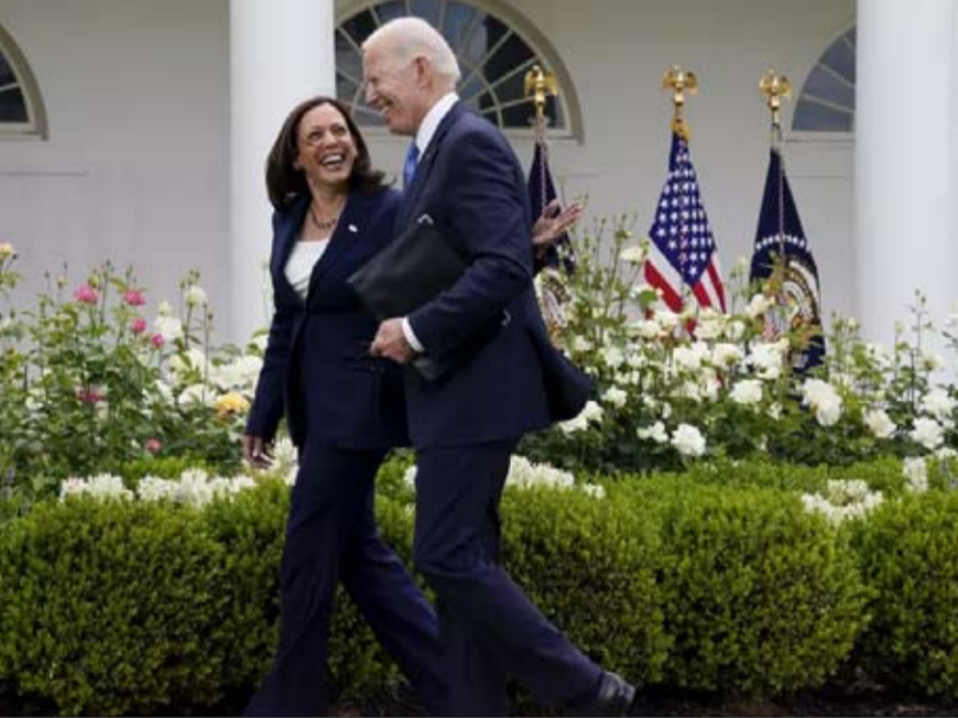
هل هي خليفة بايدن المهيبة