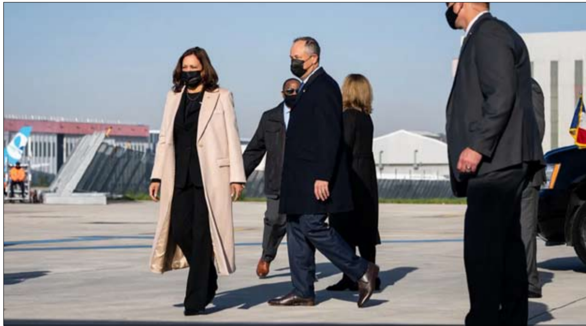
كامالا هاريس عند وصولها إلى مطار أورلي في 9 نوفمبر