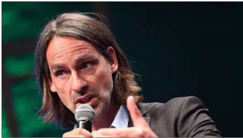
الفيلسوف ريتشارد دي بريشت

لا مصلحة له في استمرار هذه الحرب، وإطلاق النار. وأنه سيعمل على تكييف استراتيجيته وفقاً لذلك. ويتضمن هذا أيضاً، على المستوى الدولي، إرادة ضمان ظروف وقف إطلاق النار ونتائج مفاوضات السلام، وأن الذي قد يتطلب التزاماً كبيراً. وكلما طال أمد الحرب، أصبح الضغط الدولي ضرورياً لتحريض الطرفين المعارضين على الرغبة في التفاوض. يجب على الغرب أن يفعل كل ما في وسعه لإقناع الحكومتين الروسية والأوكرانية بوقف الأعمال العدائية. يجب دمج العقوبات الاقتصادية والدعم العسكري في استراتيجية سياسية تهدف إلى التهينة التدريجية من أجل تحقيق وقف