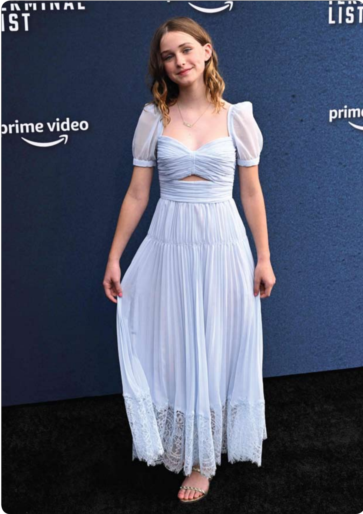
الممثلة الأمريكية أرلو ميرتزل لدى وصولها لحضور العرض الأول لفيلم The Terminal List في مسرح نقابة المخرجين الأمريكيين في لوس أنجلوس

شغلت صورة التقطتها عدسة المصور عبد الكريم الماجد لحظة الغروب فوق العاصمة السعودية الرياض، العديد من السعوديين على مواقع التواصل الاجتماعي. وأظهرت تلك "اللقطه الساحرة" غيمة تشكلت على هيئة طفل بدت وكأنه يجلس على ظهر طير، ليحلقا معاً في السماء. وقال المصور عبد الكريم الماجد إنه التقط عدداً من الصور ومقاطع الفيديو عندما كان يسيرته على طريق القصيم، ذاهباً لقضاء الإجازة في محافظة ثاقف. وعن مشهد الغيمة، أوضح أنه كان ينوي أن يحتفظ بالصورة كذكري إلا أن أصدقاءه اقترحوا عليه نشرها لجمالها، مبيناً أنه لم يتوقع تفاعل نشطاء التواصل الاجتماعي مع الصورة.