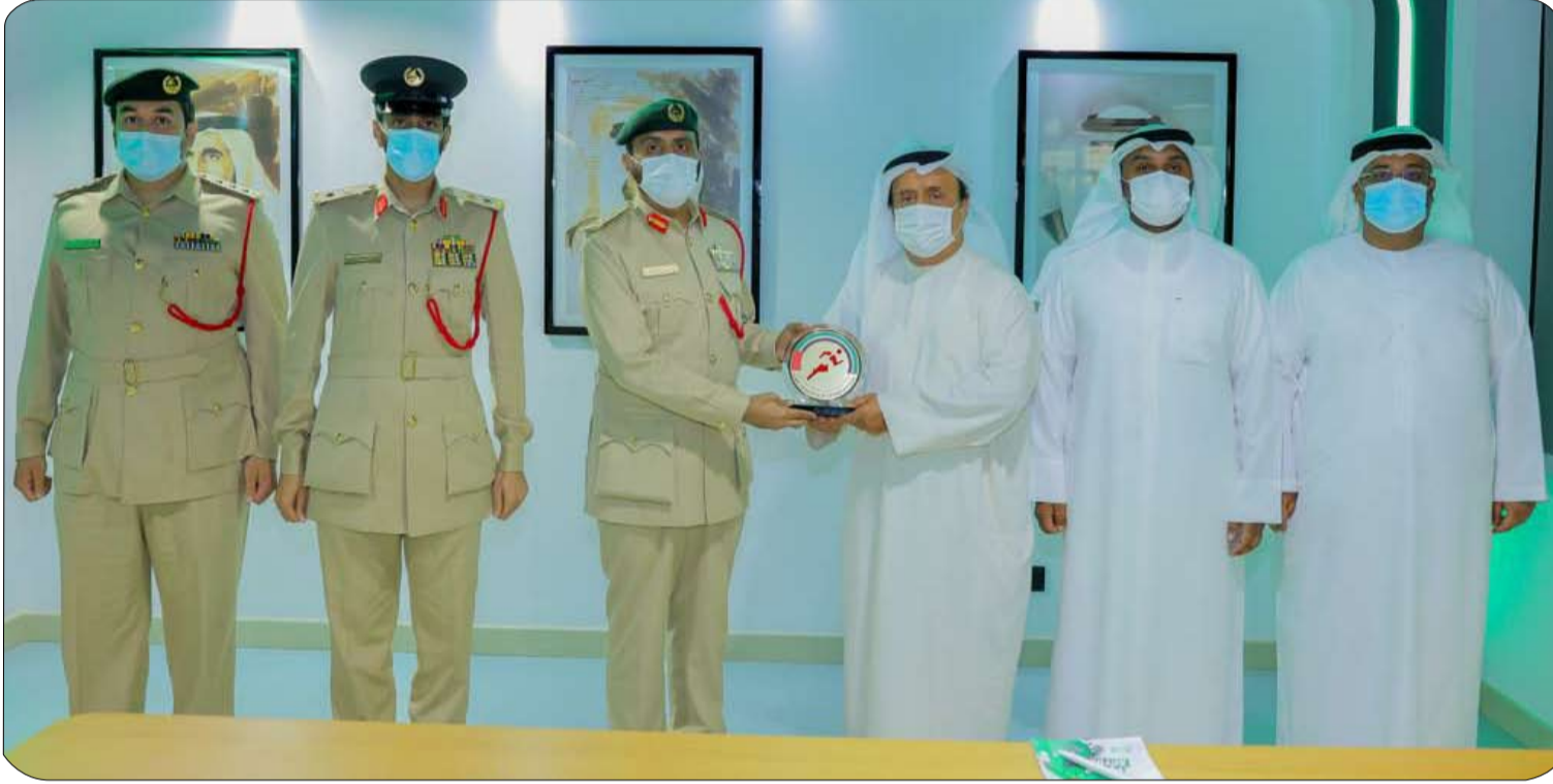
والتقدير والامتنان إلى معالي الفريق صاحبي خلفان تميم، التي ترقى لتمثيله. وتوجه الدكتور محمد المر بال شكر المرجوة لدعم صفوف منتخب الإمارات لألعاب القوى بالمواهب

الوطنية لرعاية الموهوبين والمبدعين في شتى المجالات، ترجمة لرؤية القيادة الرشيدة في ريادة البرامج الهادفة لاكتشاف المواهب ورعايتها وفق أفضل الممارسات العالمية. وأضاف: "اتحاد ألعاب القوى يسعى لتنفيذ العديد من الخطط الداعمة للتطور الرياضي، والشراكات مع الهيئات والمؤسسات الوطنية من شأنها تحقيق جودة التوجهات في هذا الصدد، هناك خطوات جيدة، ونقف على مسافة واحدة من جميع الأندية للوصول إلى المحصلة المطلوبة، ونرجو أن نتنجح في تحقيق أهدافنا الاستراتيجية، وفق منظومة متكاملة، وبرامج متنوعة وتعاون بناء وإيجابي بين الجميع، لن ندخر جهداً في مضاعفة الجهود حتى نرتقي بهذه اللعبة إلى أفضل ما يمكن أن تبلغه لعكس الصورة المشرفة عن الوطن الغالي".