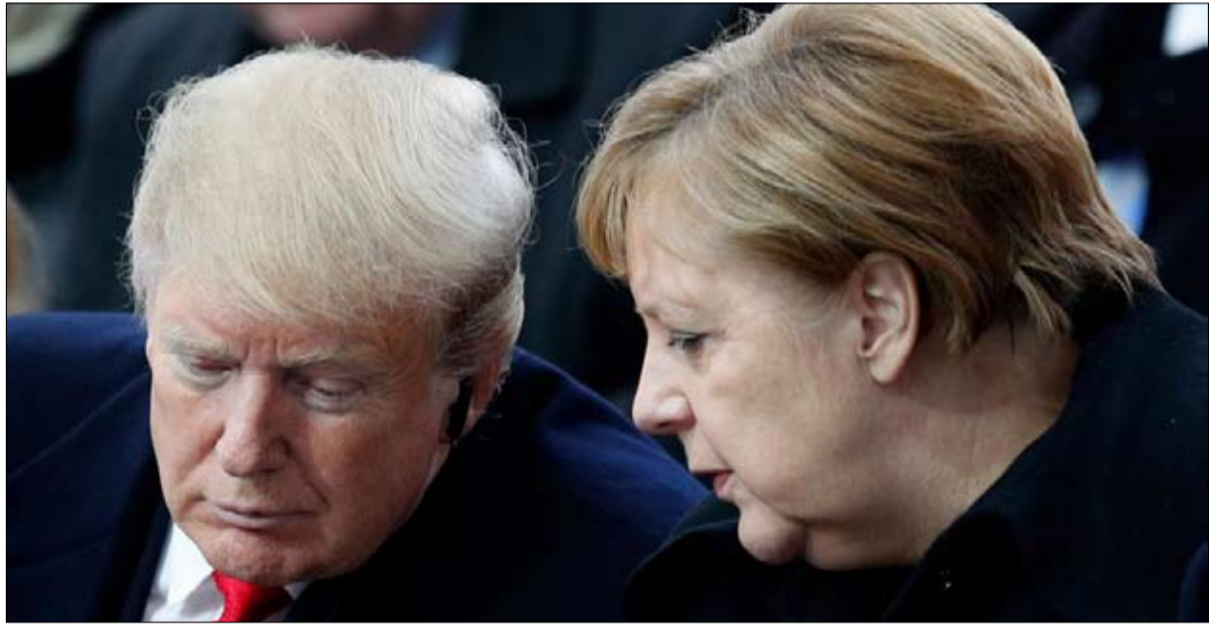
المستشارة ميركل والديناصور ترامب في لحظة همس

مشاركة في المسؤولية عن مصائب أوكرانيا. في غضون أربع سنوات، قدم روبرت أوبراين، الرئيس السابق دونالد ترامب على المستشار 30573 ادعاء كاذبا أو الامتيا السابقة، ويعتبرها مضللا.