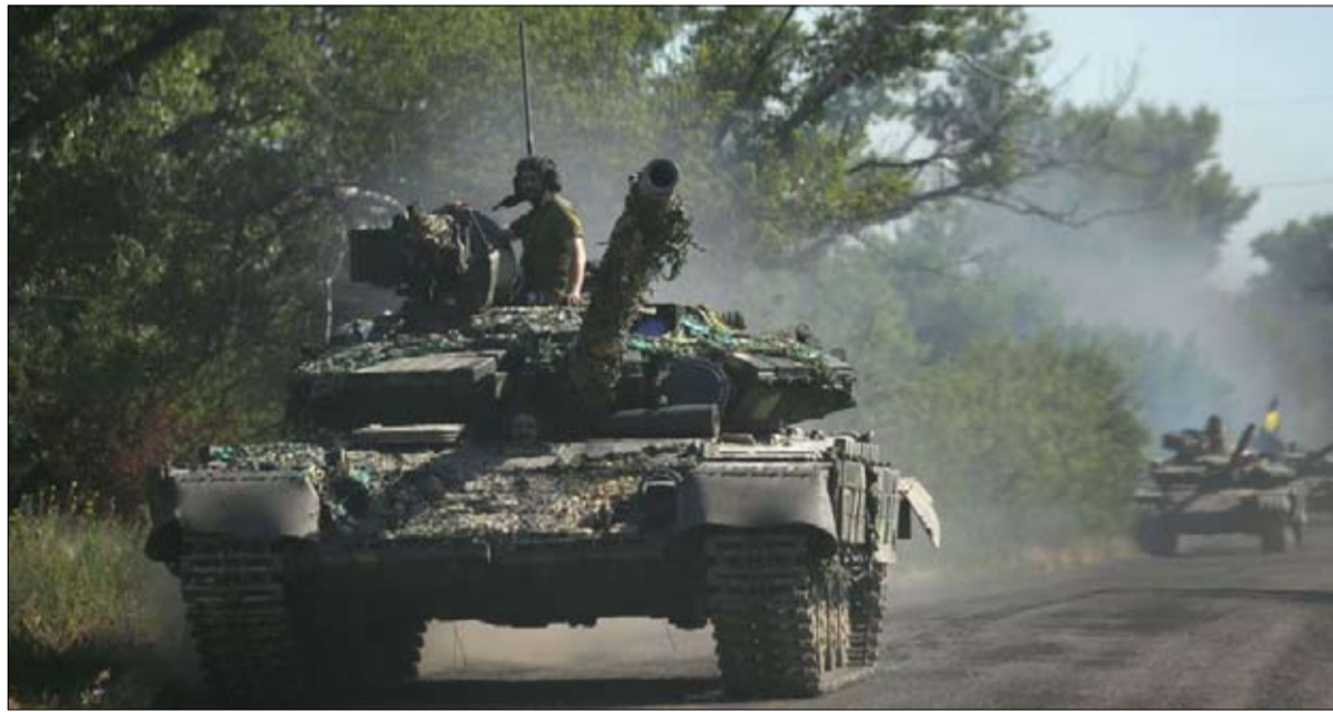
الديابات الأوكرانية في دونباس

إلى حل تفاوضي في أوكرانيا. نشرت شخصيات الاخيرة، في صحيفة دي تساييت الأسبوعية، مثل الكاتبة جولي زيه، والفيلسوف المشهور رسالة مفتوحة قلقة من مخاطر التصعيد - بما دعيت إحدى وعشرون شخصية، مثل الكاتبة هذه دعوة جديدة من شخصيات ألمانية تدعو إلى بذل قصارى جهدها للتوصل إلى حل تفاوضي. «...» إعلامياريشارد دي بريشت، أو المستشار السابق لأنجيلا ميركل إريك فاد، نشرت في الأونة على المستوى العالمي.