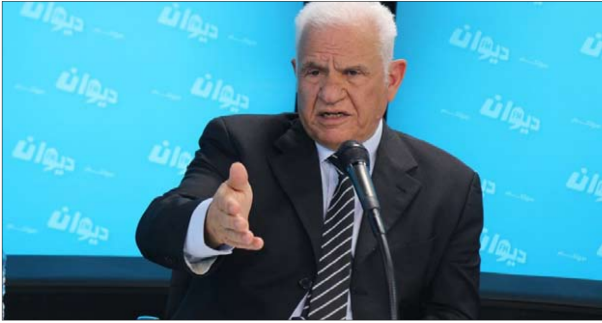
الصادق شعبان يدعو إلى تأخير الاستفتاء لأسابيع