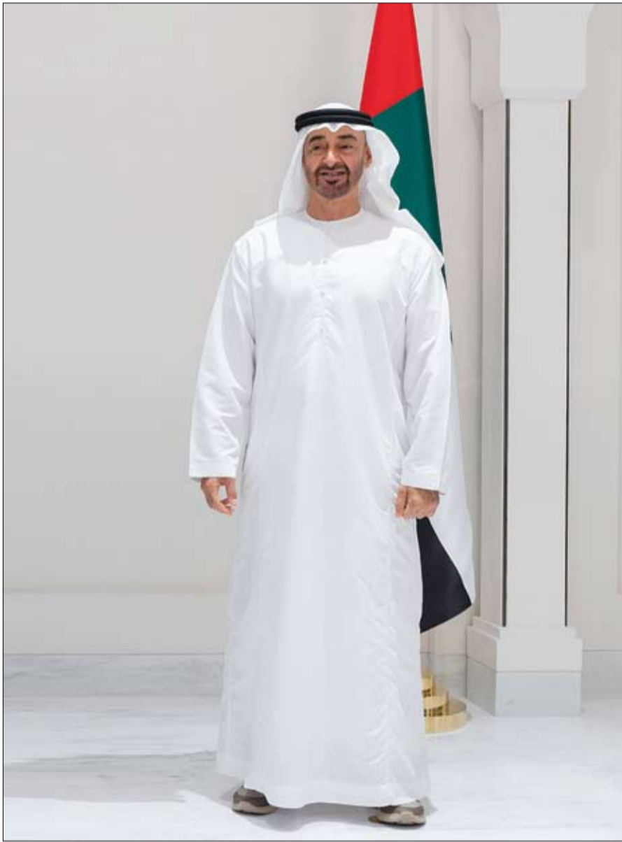
العمل رب أسرة مواطنة.

- مخصص للمتعتل الباحث عن العمل.. - يمتد هذا المخصص لمدة 6 شهور، وتبلغ قيمتها 5000 درهم شهرياً لكل مستحق بغض النظر عن عمره، ويهدف هذا المخصص إلى تمكين العاطلين عن العمل مادياً خلال فترة بحثهم عن وظيفة.