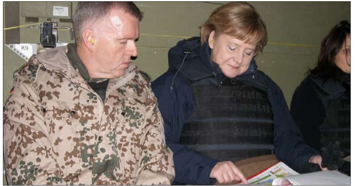
المستشار السابق لأنجيلا ميركل إريك فاد

الحالي. إن بدء المفاوضات ليس مبرراً لجرائم الحرب. نحن نشارك الرغبة في العدالة. ومع ذلك، فإن المفاوضات هي وسيلة ضرورية لمنع المزيد من المآلة محلياً، ومنع عواقب الحرب في جميع أنحاء العالم. فني مواجهة خطر الكوارث الإنسانية ومواجهة خطر التصعيد الواضح. يجب أن نجد نقطة انطلاق في أقرب وقت ممكن لاستعادة الاستقرار. ووجه تعليق الأعمال العدائية سيوفر الوقت والفرصة لذلك. إن أهمية الهدف تفرض أن نرفع هذا التحدي. يجب أن نضع كل ما في وسعنا للسماح بوقف سريع لإطلاق النار وبدء مفاوضات السلام - والامتثال عن أي شيء يتعارض مع هذا الهدف.