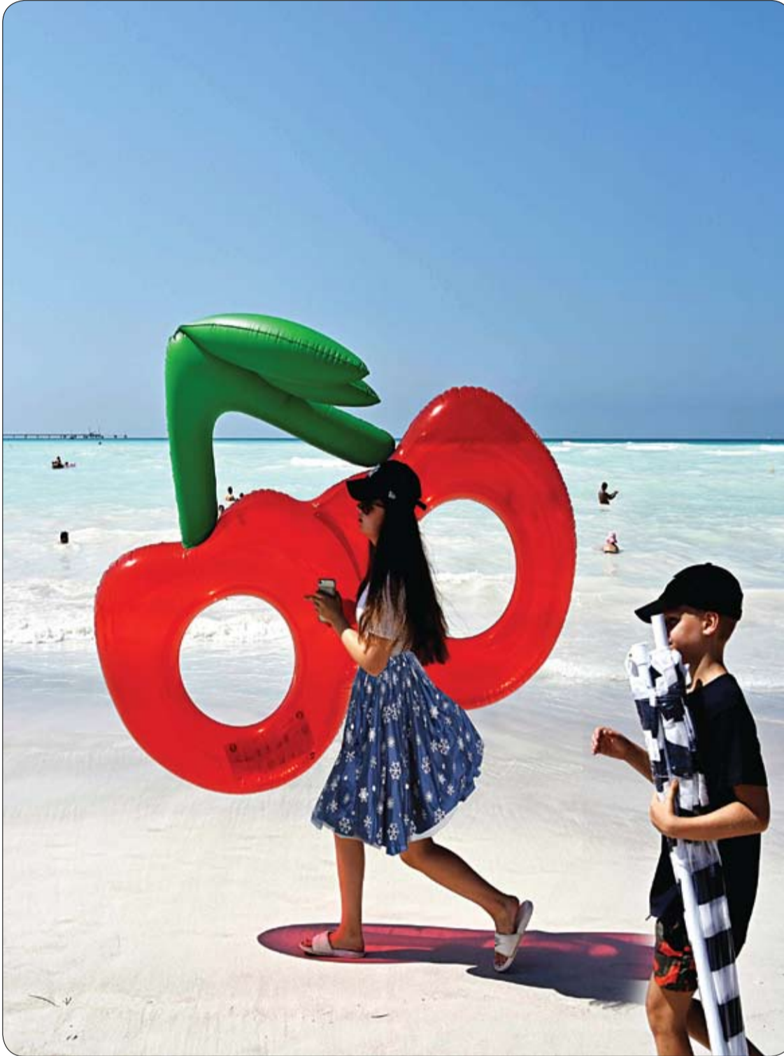
فتاة تحمل بالوناً قابلاً للنفخ وهي تمشي على شاطئ الرمال البيضاء في منطقة توسكانا بوسط إيطاليا.