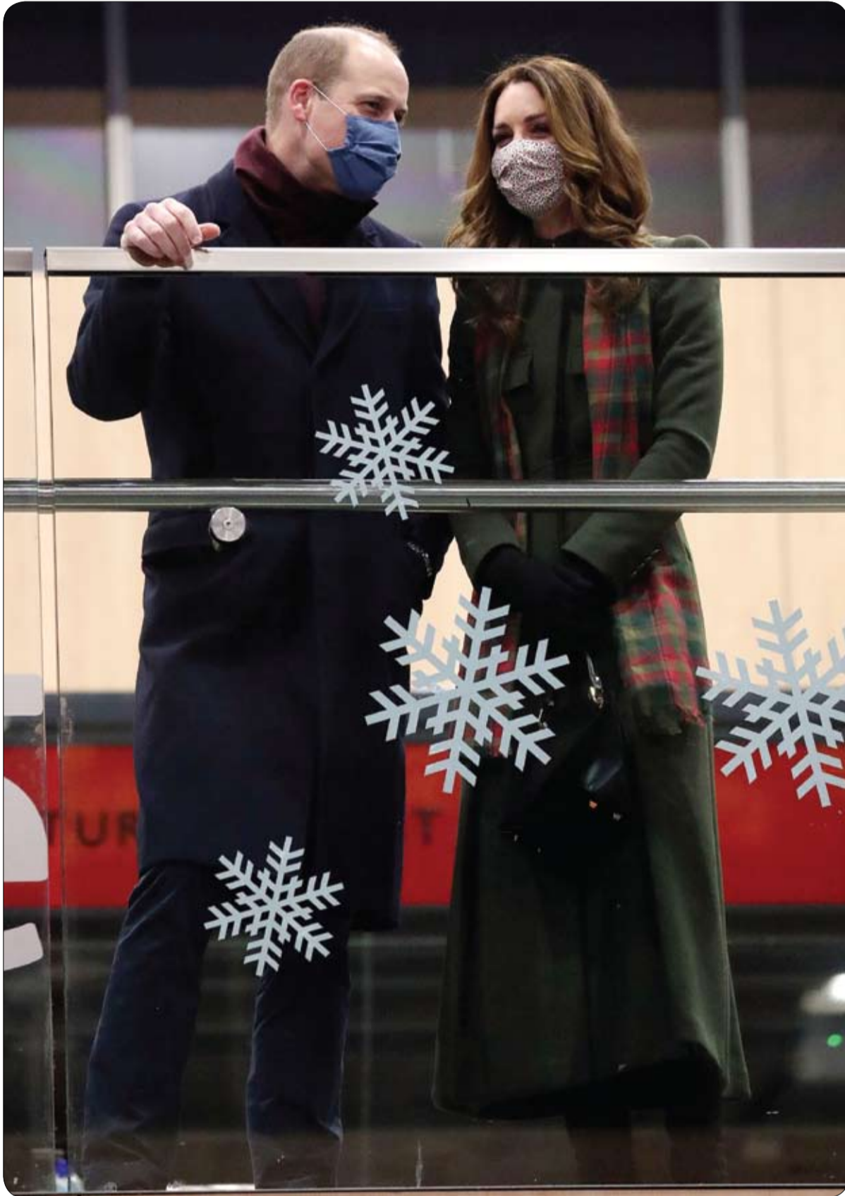
الأمير وليام وكاترين، دوقة كامبريدج، ينظران من الشرفة في محطة يوستون بلندن، بينما يشرعان للقيام بجولة لمدة ثلاثة أيام على متن القطار الملكي لشكر موظفي الخطوط الأمامية والعاملين في المجتمع في المملكة المتحدة.

وفي حديث لقناة "تي إن" التلفزيونية، أوضح باكي: "تعرض مارادونا لسقوط يوم الأربعاء قبل وفاته، لقد تعرض لضربة، سقط للمرضى لضربة، ولم يتم نقله للمستشفى لإجراء أشعة مقطعية أرنين مغناطيسي".