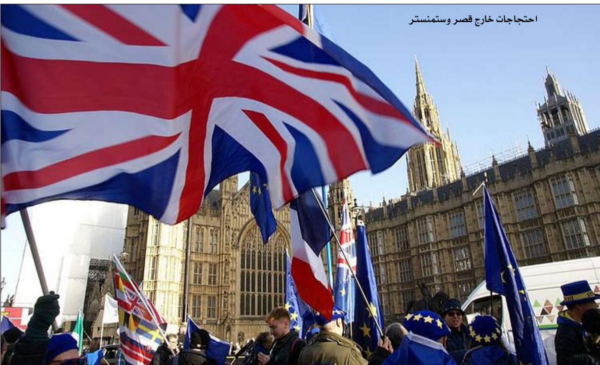
احتجاجات خارج قصر وستمنستر

ببيع بحرية، ولكن دون الاضطرار إلى الامتناع للمعايير المعنية. هذا غير مقبول، وإذا استمر البريطانيون في إصرارهم، فسيقوم الاتحاد الأوروبي بحظر الواردات غير المتمثلة، وتحديد التعريفات والحصص. وتتعلق الحالة الثالثة بتسوية المنازعات: تطلبا قالت