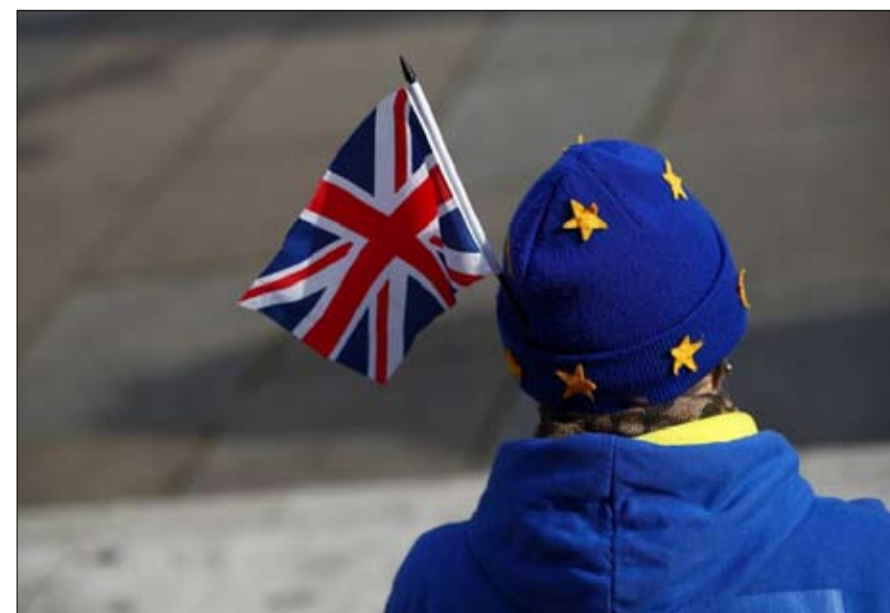
البريكسيت جرح لا يندمل