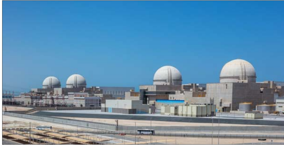
ويبينما تمضي دولة الإمارات قدماً لتحقيق المزيد من الإنجازات في الأعوام الـ50 المقبلة ستوفر محطات بركة الأربع عند تشغيلها 25 في المائة من احتياجات الدولة من الطاقة الكهربائية لدعم التقدم والتنمية المستدامة للقطود القادمة وما بعدها. وبهذا الصدد قال سعادة محمد

أعلنت مؤسسة الإمارات للطاقة النووية عن نجاح شركة نواة للطاقة التابعة لها والمسؤولة عن تشغيل وصيانة محطات بركة للطاقة النووية السلمية في تحقيق إنجاز جديد تمثل بوصول مفاعل المحطة الأولى في بركة إلى 100 في المائة من طاقتها الإنتاجية في خطوة تمهد للتشغيل التجاري في بداية العام 2021. ويعني هذا الإنجاز أن المحطة الأولى في بركة تنتج 1400 ميغافاط وهو ما يجعلها أكبر مصدر منفرد لإنتاج الطاقة الكهربائية في دولة الإمارات. وأصبحت محطات بركة أكبر مصدر لكهرباء الحمل الأساسي الصديقة للبيئة في دولة الإمارات، والقادرة على توفير إمدادات ثابتة وموثوقة ومستدامة من الطاقة على مدار الساعة، حيث يسهم هذا الإنجاز في تسريع عملية خفض البصمة الكربونية لقطاع الطاقة ودعم جهود الدولة في تنويع محفظتها من مصادر الطاقة خلال المرحلة الانتقالية إلى مصادر الطاقة الصديقة للبيئة. وتحقق هذا الإنجاز الاستثنائي بعد أيام قليلة من الاحتفال باليوم الوطني 49 ل ليقدم مثالا ملموساً على تقدم الدولة الكبير في تطوير قطاع أمن ومستدام للطاقة، ومستقبل مزدهر للدولة.