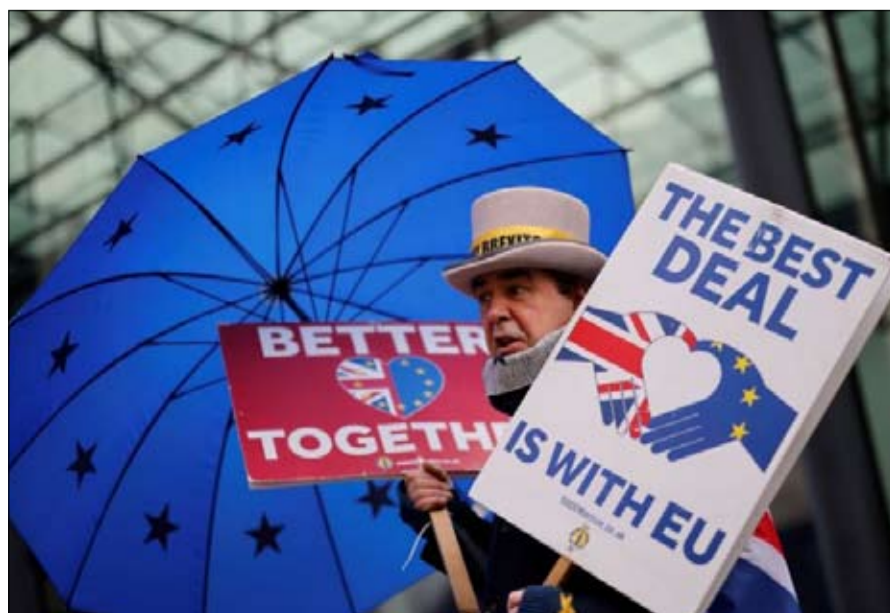
ثلاثة ملفات تبحث عن حلول