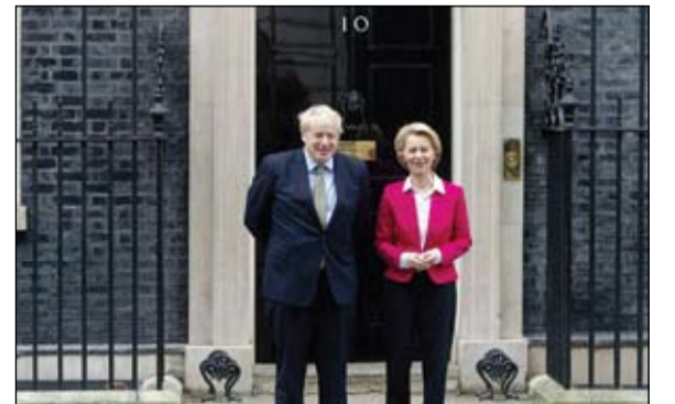
جونسون والاتحاد... طلاق معلق

كما تحدث الجيش الوطني في بيان، عن شحود متزايدة للميليشيات المسلحة في العاصمة طرابلس ومدينة مصراتة وعمليات نقل ميليشيات وأسلحة ومعدات عسكرية باتجاه خطوط التماس غرب سرت والجفرة بما يوحي بتصعيد عسكري. وتبعاً لذلك، أصدرت القيادة العامة للجيش الوطني، تعليمات وأوامر إلى كافة وحدات قوات الجيش حتى تكون على درجة عالية من الحيطة والحذر وعدم الانجرار وراء الاستفزازات التي يمكن أن تؤدي إلى تصعيد الموقف العسكري، وفق البيان. إلى ذلك جدد الجيش الوطني التزامه وتمسكه التام