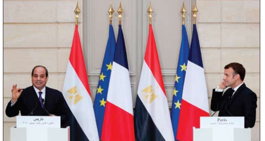
الرئيسان المصري والفرنسي خلال مؤتمرهما الصحفي في باريس

باريس-وكالات: قال الرئيس الفرنسي، إيمانويل ماكرون، ونظيره المصري، عبد الفتاح السيسي، إنهما أجريا محادثات بشأن التعاون الثنائي الوثيق بين باريس والقاهرة، كما بحثا عددا من القضايا الإقليمية الأخرى، وسط توافق كبير في المواقف. وأوضح ماكرون، خلال مؤتمر صحفي بالعاصمة باريس، أن خلال زيارة الرئيس السيسي، أن فرنسا ومصر اتفقتا على المضي قدما بعلاقاتها الثنائية، على مختلف المستويات. ووصف التعاون العسكري والأمني بين فرنسا ومصر بالمثالي، مؤكدا أن البلدين يعملان على مكافحة الإرهاب الذي ضربهما معا. وأورد الرئيس الفرنسي أن اتصالات سيجري توقيعها، يومي الاثنين والثلاثاء، من أجل تعزيز التعاون مع مصر في عدد من المجالات. ودوليا، قال ماكرون إن فرنسا ترفض انتهاك سيادة الدول في شرق البحر المتوسط، في إشارة إلى المناكفات التي تقوم بها تركيا، رغم تحذيرات أوروبية