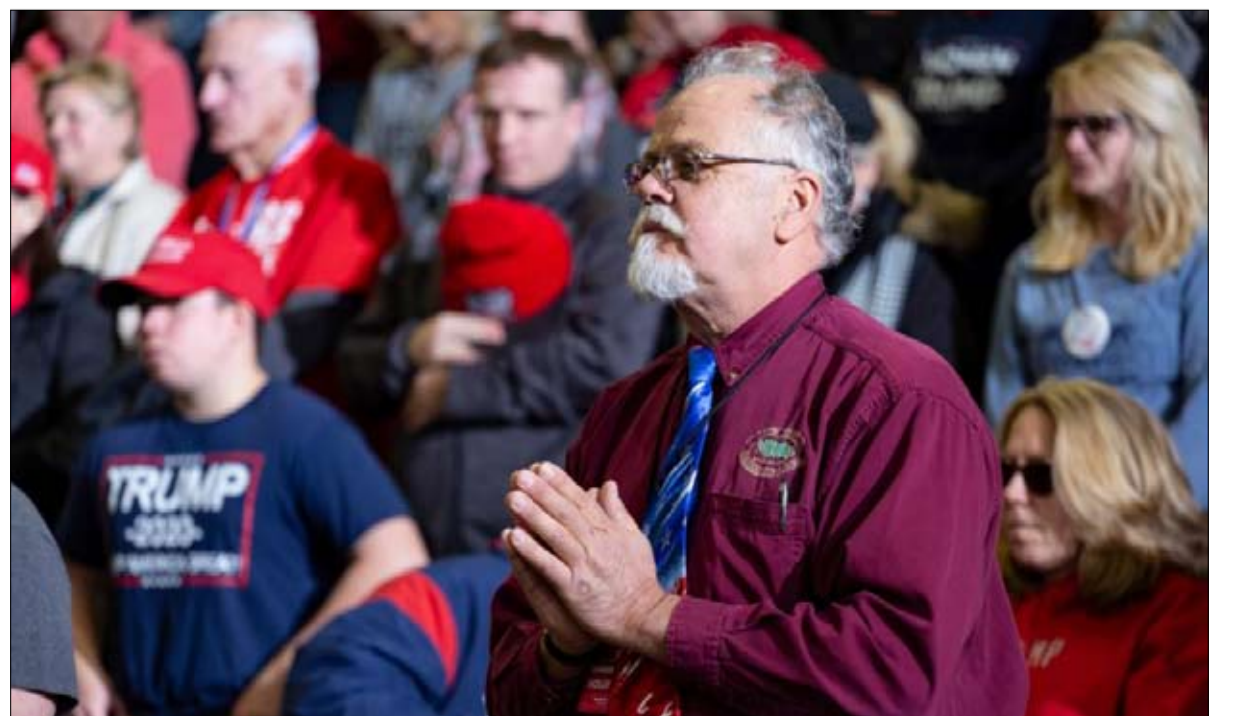
الصلوة من أجل ترامب خلال اجتماع

يفضلون دولة ذات غالبية مسيحية، في حين تؤيد المجموعات الأخرى التنوع الديني