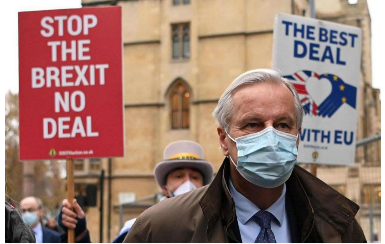
ميشيل بارنيهيه... قدمنا أقصى التنازلات