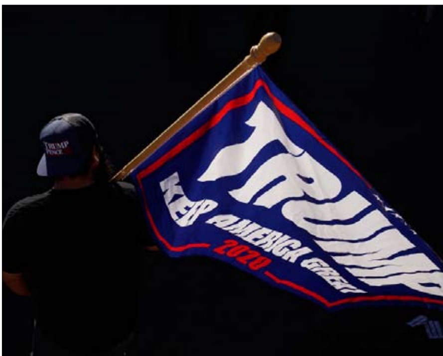
شعورهم بالتهديد يفسر ولاعهم للملياردير