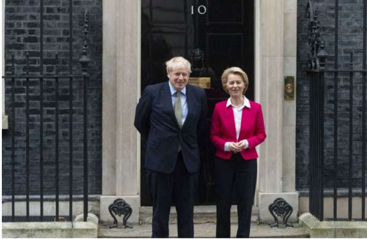
جونسون والاتحاد... طلاق معلق