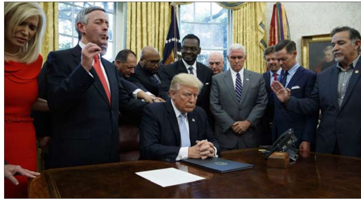
رجال الدين يصلون مع الرئيس ترامب في المكتب البيضاوي

بين 2009 و2019، شهد البروتستانت الإنجيليين البيض انخفاضاً في نسبتهم من السكان الأمريكيين من 21 بالمائة إلى 18 بالمائة، بينما انخفض غير المنتسبين إلى دين من 15 إلى 28 بالمائة في نفس الوقت (مركز بيو للأبحاث). بشكل عام، انخفض عدد السكان المسيحيين بالكامل من 77 بالمائة إلى 65 بالمائة. وحدث هذا التطور من خلال عملية استبدال الأجيال من الأقدم إلى الأصغر من الأجيال الأربعة الحالية، وتمثل نسبة المسيحيين، على التوالي، 84 بالمائة و76 بالمائة و67 بالمائة و49 بالمائة من أفراد هذه الأجيال، بينما يمثل غير المنتسبين 10 بالمائة و17 بالمائة و25 بالمائة و40 بالمائة. وبين 2009 و2019، مر عدد المسيحيين من 178 إلى 167 مليوناً، بينما انخفض عدد غير المنتسبين من 39 إلى 68 مليوناً. وصوت السكان الذين يتزايد عددهم بسرعة بنسبة الثلثين لصالح بايدن.