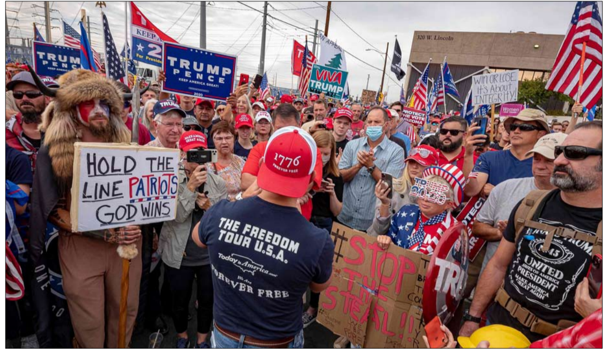
الإنجيليون من أكثر انصار ترامب

الشعور القوي بالتعرض للتهديد يفسر دعمهم غير المشروط والعنيف لدونالد ترامب