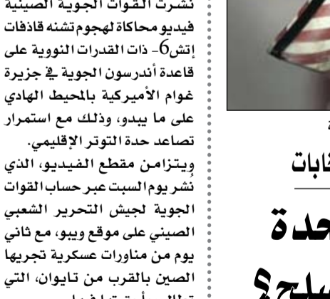
السلاح بياع كالخبز في الولايات المتحدة

بكين-وكالات: نشرت القوات الجوية الصينية فيديو محاكاة لهجوم تشنه قاذفات إن-6 ذات القدرات النووية على قاعدة أندرسون الجوية في جزيرة غوام الأميركية بالمحيط الهادي على ما يبدو، وذلك مع استمرار تصاعد حدة التوتر الإقليمي. ويتزامن مقطع الفيديو، الذي نشر يوم السبت عبر حساب القوات الجوية لجيش التحرير الشعبي الصيني على موقع ويبو، مع ثاني يوم من مناورات عسكرية تجريها الصين بالقرب من تايوان، التي تطالب باحققتها فيها. وتضم جزيرة غوام منشآت عسكرية أميركية كبرى، بما فيها القاعدة الجوية التي سيكون لها دور مهم في الرد على أي صراع تشهده منطقة آسيا والمحيط الهادي. ويظهر مقطع الفيديو، ومدته دقيقتان و15 ثانية، قاذفات إن-6 وهي تقف على قاعدة جوية صحراوية. وفي منتصف الطريق، يظهر طيار وهو يضغط على زر لإطلاق صاروخ نحو مدرج ساحلي للطائرات لم يتم الكشف عن اسمه لكنه يشبه قاعدة أندرسون.