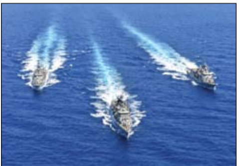
ممارسات تركيا في شرق المتوسط تثير قلق أوروبا

عقوبات واسعة ضد قطاعات بأكملها في الاقتصاد التركي، واستيق وزير الخارجية القبرصي، نيكوس كريستودوليدس، الاجتماع بالمطالبة برفض عقوبات على تركيا بشكل فوري، لمواجهة أعمالها غير القانونية في مياه شرق المتوسط. وقال في تصريحات صحفية إن تركيا اختارت التصعيد تجاه بلاده، باتخاذ قرار بتجميد عمل سفينة التفتيش يافوز في المنطقة الاقتصادية الخالصة التابعة لقبرص. وأضاف الوزير القبرصي أن أنقرة كشفت من وراء هذه الخطوة عن نواياها الحقيقية على حد تعبيره، في إشارة إلى الاستفزازات التركية المتواصلة في شرق المتوسط، والتي أثارت غضب دول عدة. وفي السياق ذاته، سافر وزير الخارجية اليوناني نيكوس ديندياس إلى بروكسل لحضور الاجتماع. وذكر وسائل إعلام يونانية أن الاجتماع الأوروبي سناقش العدوان التركي على اليونان وقبرص، إلى جانب ملفات أخرى. وقال ديندياس في تصريحات صحفية: لا يمكن أن تقول أنك مستعد للجلوس على الطاولة وفي نفس الوقت تنتهك السيادة والحقوق السيادية لحاورك، في إشارة إلى حديث أنقرة عن فتح المجال للدبلوماسية.