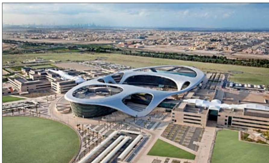
مؤشرات أداء تمت معيارتها بشكل مناسب يتيح للطلبة والأكاديميين وغيرهم المغامرة بين عدة جامعات عالمية بطرق أكثر شمولاً وتوازناً.

أوقات الأزمات. من جهته قال سعادة يونس آل ناصر مساعد المدير العام لديي الذكية إن دبي الذكية تسعى بشكل مستمر وضمن رؤيتها الاستراتيجية إلى تسخير التكنولوجيا في تصميم خدمات من شأنها تسهيل حياة الناس والسماح لهم بأداء معاملاتهم