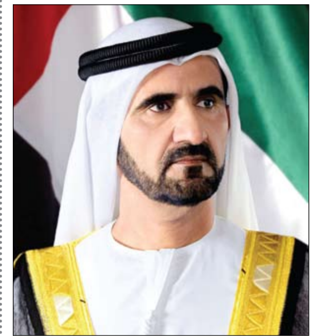
سعي دولة الإمارات إلى الريادة العالمية، ووضع بصمة في مجال استكشاف الفضاء، في شراكة مهمة، تعكس المكانة الدولية التي وصلت إليها الإمارات في قطاع

ديبي-الفجر- وام: بارك صاحب السمو الشيخ محمد بن راشد آل مكتوم نائب رئيس الدولة رئيس مجلس الوزراء حاكم دبي رعاه الله توقيع اتفاقية تعاون مع ناسا.. وقال في تغريدة على حساب سموه الشخصي (في تويتر): باركنا اليوم توقيع اتفاقية مع وكالة الفضاء الأمريكية ناسا @NASA لتدريب رواد فضاء إماراتيين لإدارة مهام مستقبلية في محطة الفضاء الدولية ومهام السير الفضائي خارج المحطة space walks.. والبقاء لمدد طويلة في محطة الفضاء الدولية، بالتعاون الدولي في مجال الفضاء جزء أساسي من استراتيجيتنا وقد أعلن مركز محمد بن راشد للفضاء ووكالة الفضاء الأمريكية «ناسا» عن توقيع اتفاقية لتدريب رواد الفضاء الإماراتيين في الولايات المتحدة الأمريكية. يأتي ذلك في إطار