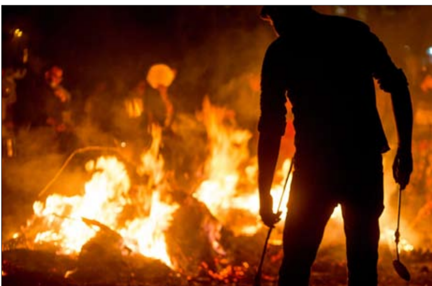
مواجهات قد تتحول الى حريق شامل

ويصرف النظر عن هذه الاشتباكات الأخيرة (التي، مع ذلك، لم تشمل مجموعات منظمة وكانت بعيدة كل البعد عن تشكيل حركات تمرد)، نادراً ما عكست تلك الأحداث الماضية التخندق الذي يقسم الأحزاب السياسية في البلاد. وهذا هو أحد الأسباب التي تجعل نزاعات اليوم مختلفة وربما أكثر خطورة. هناك اختلاف آخر وخطر آخر، يتمثل في هيمنة شبكات تلفزيون الكابل ووسائل التواصل الاجتماعي، التي تضخم وتنشر موجات الصدمة. الحوادث التي كان من الممكن أن تظل محلية في الماضي، تنتشر بسرعة على المستويين الوطني أو العالمي، مما يدفع آخرين إلى الانضمام إليها. بعد جريمة القتل المزدوجة التي