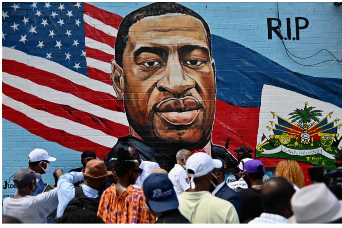
انقسام مجتمعي وسياسي