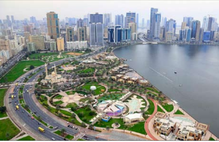
الذي كان حصنا عتيقا ومقرا لأسرة النعيمي منذ أوائل القرن التاسع عشر.

وهي تتراءى سواحل الإمارات أمام الناظرين مجسدة الرؤية المهمة التي نجتحت في أحداث التحول المنشود.. وباتت الإنجازات تكبر لتواصل الإمارات مسيرتها الحضارية تحول المستقبل.