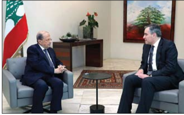
عون وأديب... مشاورات لم تسفر عن حكومة ترضي الجميع

وزراء شيعية، من بينهم وزير المال... الدستور اللبناني لا ينص على تخصيص أي وزارة لأي طائفة، مقترحا أن يتم إلغاء التوزيع الطائفي للوزارات السيادية. بدوره قال رئيس الوزراء اللبناني المكلف، مصطفى أديب، الاثنين، إن بلاده لا تملك ترف إهدار الوقت وسط كم الأزمات غير المسبوقة، مطالبا بالإسراع في تشكيل حكومة جديدة، تضطلع بمهمة إخراج البلاد من أسوأ أزمة تعيشها منذ نهاية الحرب الأهلية. اللبنانية، مع إصرار الثنائي الشيعي ممثلا بحزب الله وحليفته حركة أمل بزعامة رئيس البرلمان نبيه بري، على تسمية وزرائهم، والتمسك بحقيبة وزارة المالية، الأمر الذي يعارضه أديب. ويصر رئيس الوزراء اللبناني المكلف، على تشكيل حكومة بمهمة محددة، بناء على ما التزمت القوى السياسية به أمام الرئيس الفرنسي إيمانويل ماكرون. وفي هذا خلافا قد طفت إلى السطح وعرقلت جهود تشكيل الحكومة