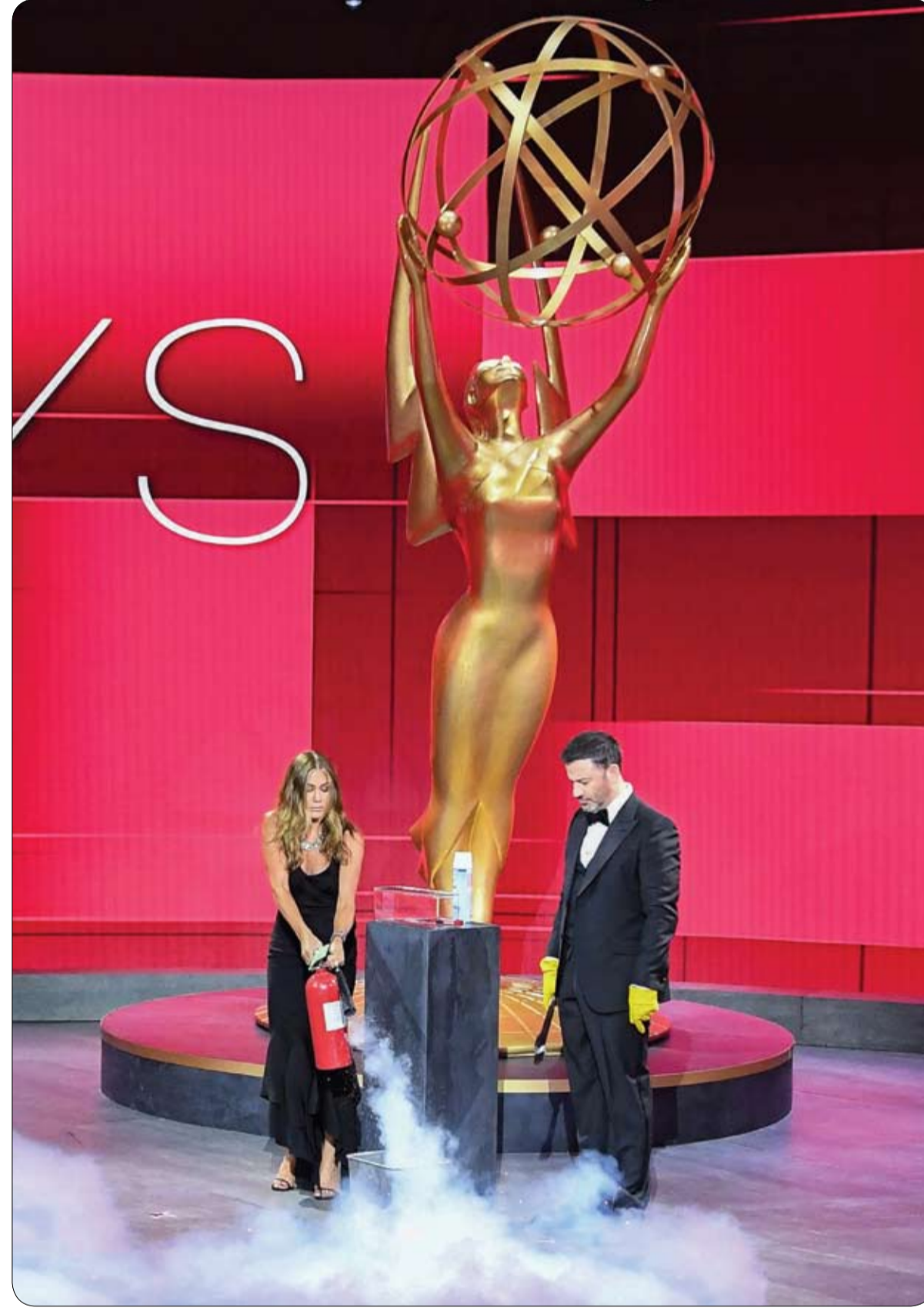
المستضيف جيمي كيميل يشاهد الممثلة جينيفر أنيستون وهي تحمّد اللهب من سلة الاقتراع في مركز Staples خلال حفل توزيع جوائز إيمي الـ 72 في كاليفورنيا.

توتني تاغ (45 عاماً) هو السائح الصيني الوحيد في المجموعة، وهو رجل أعمال يعيش في كاليفورنيا ويعمل في تجارة السلع الاستهلاكية.