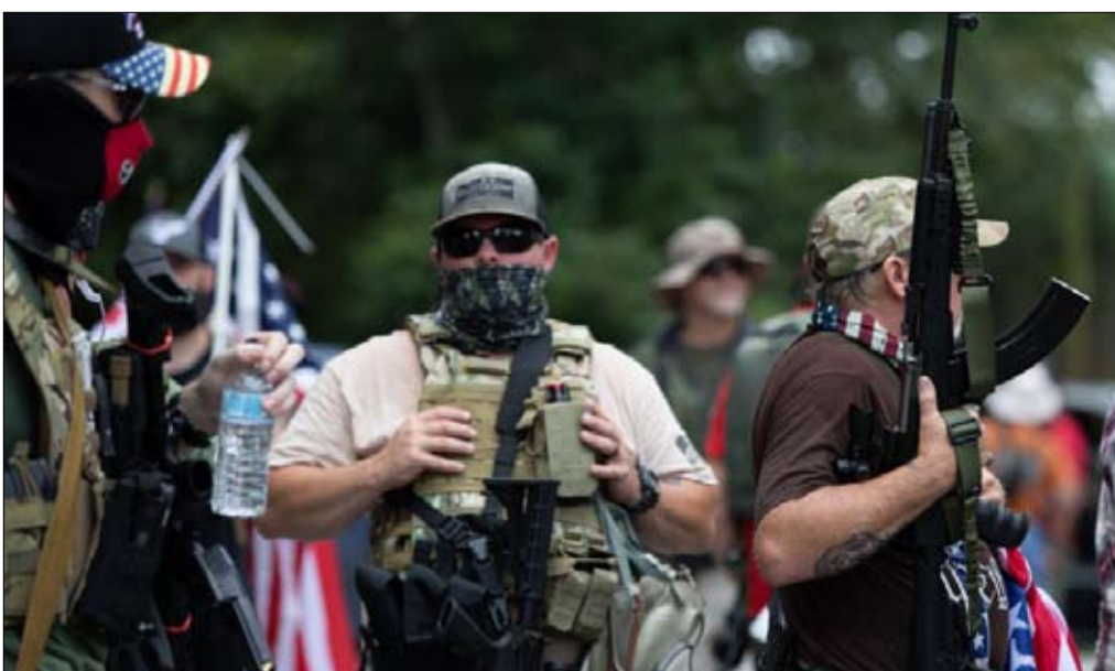
عناصر ميليشيات يمينية متطرفة ومسلحون من العنصريين البيض في جورجيا