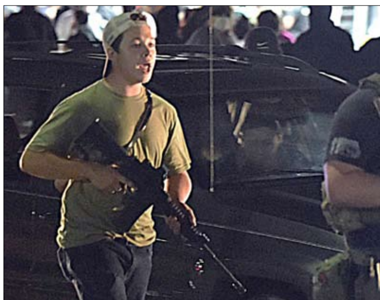
كابل ريتنهاوس... نموذج لليمين المتطرف