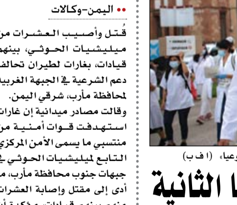
طبيب وطبيبة يحملان لافتة احتجاج في برشلونة كتب عليها: نحن نعمل 88 ساعة اسبوعيا،