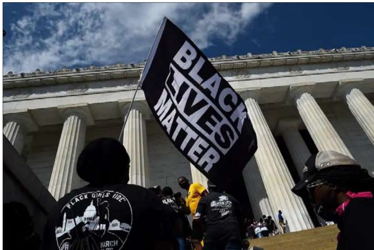
اليسار في مسيرات احتجاجية

التي أشعلت النار في الاحتجاجات (المشروعة).