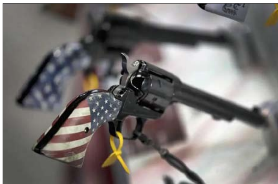
السلاح يباع كالخبز في الولايات المتحدة