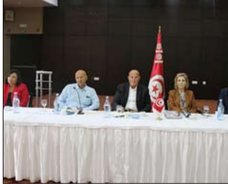
المشاركين في الحزب الجديد

الجديدة ستسعى إلى المحافظة على ارتداء تونس وما تركه الباجي قائد السبسي.