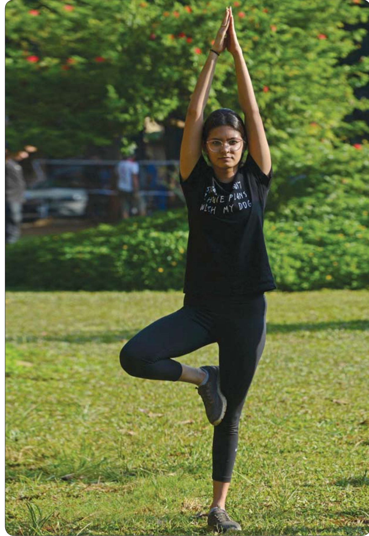
هتاة تمارس رياضة اليوجا قبل اليوم العالمي لليوجا بحديقة عامة في مومباي.

محاولة للإثارة ولفت أنظار الجمهور. أحدثت اللواقح ذات الصلة تتعلق بظهور ندى عادل بطليقة مخرج الإعلانات والمغني تميم يونس، في فيديو على "إنستغرام"، وهي تبكي معلنة تعرضها للاغتصاب الزوجي، ومشيرة أنها ظلت لفترة تتجنب التحدث في موضوع الاغتصاب الزوجي على الرغم من تلقي طلبات عديدة بتناول هذه القضية. وقالت إنها تعرضت بشكل شخصي للاغتصاب الزوجي وأنها منزعجة من عدم توافر قانون في مصر لحماية الزوجة، كما أن هناك بعض الشيوخ الذين يداهون عن هذا النوع من الاغتصاب، مضيفة أنها ظلت عاما كاملا لا تستطيع مواجهة زوجها، وعندما قامت بذلك طلب منها ضربه لكي تتحسن حالتها. أعلن الرئيس الأميركي جو بايدن وزوجته جيل أمس الأول السبت نفوق كليهما "تشامب"، معتبرين أن الحيوان، وهو من نوع الراعي الألماني، "جعل كل شيء أفضل" عندما كان بجانبهما. وكان الكلب البالغ 13 عاما عانى تراجعا في قوته" خلال الأشهر الأخيرة، على ما أفاد الرئيس وزوجته، قبل نفوقه. وكان انتقال "تشامب" والكلب الآخر للزوجين "ميجور" بمثابة عودة للكلاب إلى البيت الأبيض بعد أربع سنوات من رحيل "بو" و"ساني"، رفيقي عائلة الرئيس السابق باراك أوباما. وبالتالي قطع الرئيس السابق دونالد ترامب تقليدا قديما بتبنيته كامل ولايته في واشنطن من دون حيوان أليف. وقال بايدن وزوجته في بيان عن كليهما "كان يحرس على أن يكون حيثما نكون، وكان يجعل كل شيء أفضل بوجوده بجوارنا". أما "ميجور"، الكلب الآخر لآل بايدن، وهو أول حيوان رئاسي أليف يأتي من مأوى للحيوانات، فأثار ضجة أكبر من رفيقه النافق منذ بداية ولاية بايدن. فقد عض "ميجور" اثنين من موظفي البيت الأبيض بظارق أسابع، إلى درجة أن صاحبه أرسله لتابعة دورات تدريب لمساعدته على التكيف مع حياته في البيت الأبيض.