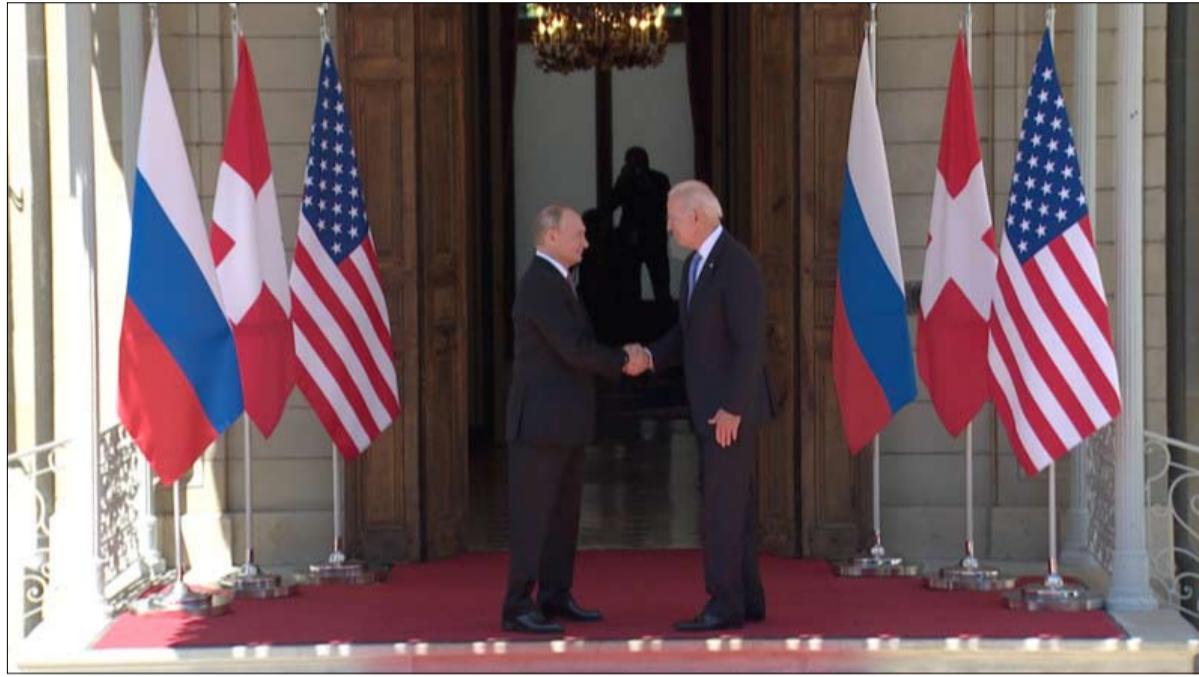
عائدات اقتصادية مثل هذه القمم

قال مسؤول كبير إن موظفين تايوانيين يعملون في مكتب تمثيل الجزيرة في هونغ كونج سيغادرون المدينة التي تديرها الصين بدءاً من أمس الأحد بعدما طلبت الحكومة هناك من مسؤوليها التوقيع على وثيقة تدعم مطالبة بكين بالسيادة على تايوان. وياتت هونغ كونج الخاضعة للحكم الصيني نقطة خلاف أخرى بين تاييه وبكين لا سيما بعد أن انتقدت تايوان قانون الأمن الذي فرضته بكين على هونغ