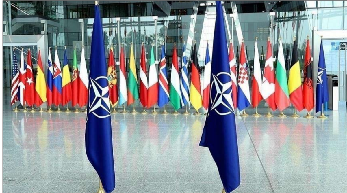
إعادة ترتيب البيت الأطلسي