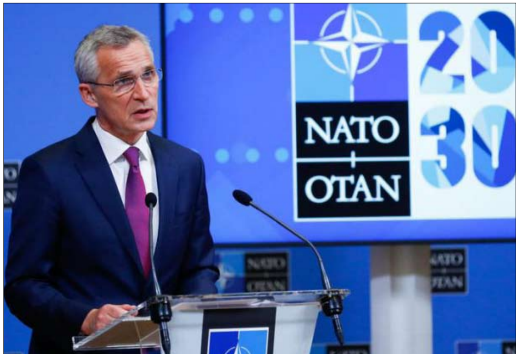
الأمين العام لحلف الناتو ينس ستولتنبرغ يعقد مؤتمراً صحفياً في مقر الحلف في بروكسل

يقع مركز المواجهة الجيوسياسية العالمية الآن في آسيا ولم يعد في أوروبا