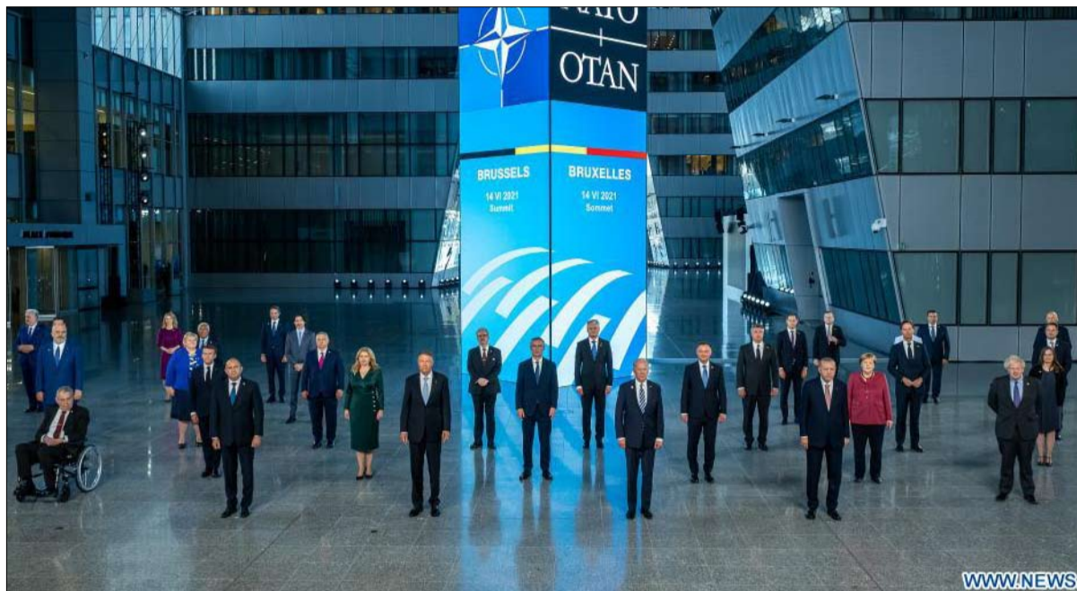
متحدون ضد الصين