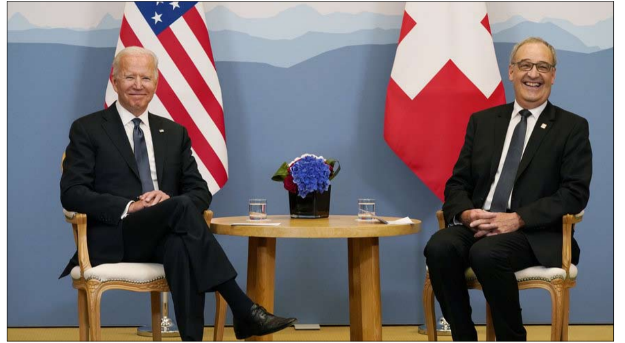
الرئيس السويسري يستفيد من لقاء بايدن