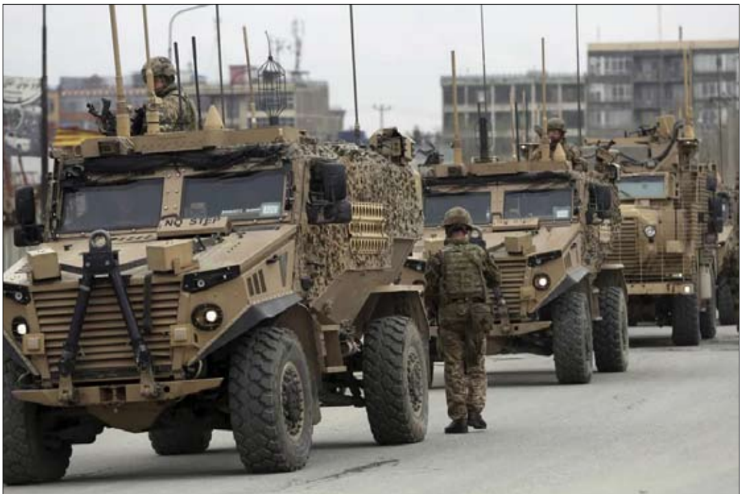
انسحاب الأطلسي من أفغانستان

يقع مركز المواجهة الجيوسياسية العالمية الآن في آسيا ولم يعد في أوروبا