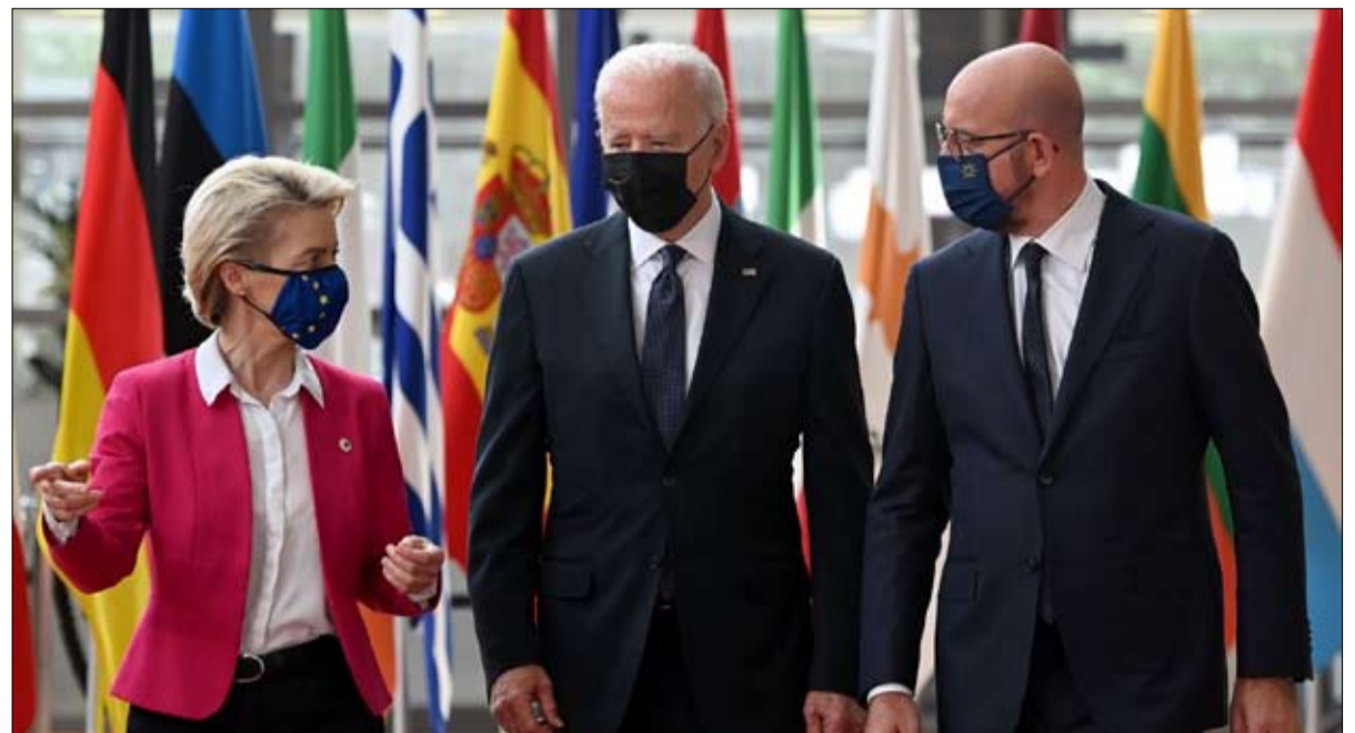
أوروبا تصطف وراء الولايات المتحدة