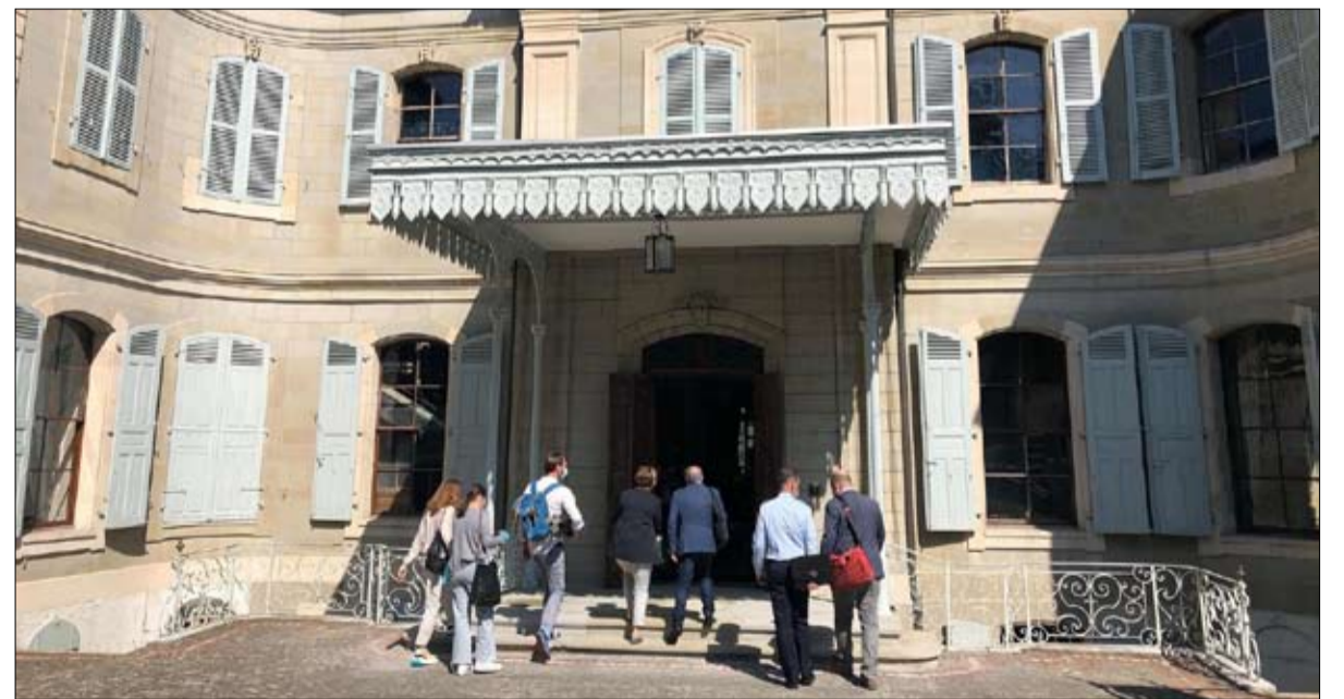
المقر الذي احتضن قمة بايدن-بوتن

يكنج جماع الميليشيات الموالية له من تنفيذ هجمات على أهداف أمريكية في العراق، وكذلك كف المتطرفين الحوثيين عن إطلاق الصواريخ على السعودية. ومع ذلك، فإن عداوة واحدة ستبقى. وأياً كان الرئيس الإيراني فإنه سيحافظ على حيال إسرائيل، الذي هو مبدأ أساسي للجمهورية الإسلامية. وقد لا يعود بنيتامان نتانياهو إلى رئاسة الوزراء، لكن ثمة إجماع لدى السياسيين الإسرائيليين على أن إيران تمثل خطراً واضحاً وداخلياً على إسرائيل. وهذا يعني أن الائتلاف الحكومي الجديد بقيادة نفتالي بينيت سيواصل حملته العسكرية المنخفضة ضد إيران ووكلائها من الميليشيات في سوريا. وكذلك الجهود لتدمير البرنامج النووي الإيراني. لكن إذا تحسنت العلاقات الأمريكية-الإيرانية، فإن الولايات المتحدة ستضغط على إسرائيل للحد من الأذى من الضربات ضد إيران. لكن كل الرهانات تستقبط في حال لم تتوصل مفاوضات فيينا إلى اتفاق. عندما ستواصل إيران تخصيص الأورانيوم بنسب أعلى، مما سيغير إسرائيل على مواصلة -أو حتى تكثيف- هجماتها. أما السعودية ودولة الإمارات فقد تواصلان الحوار مع إيران، لكن التطبيع سيكون عملية صعبة دون دعم واشنطن. كذلك ستزيد هجمات الميليشيات الموالية لإيران على أهداف أمريكية في العراق، مما سيؤدي في حرجة موقف الحكومة في بغداد.