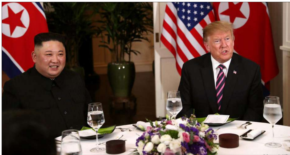
ترامب وكيم جونج أون في قمتهم الثانية في فينتام