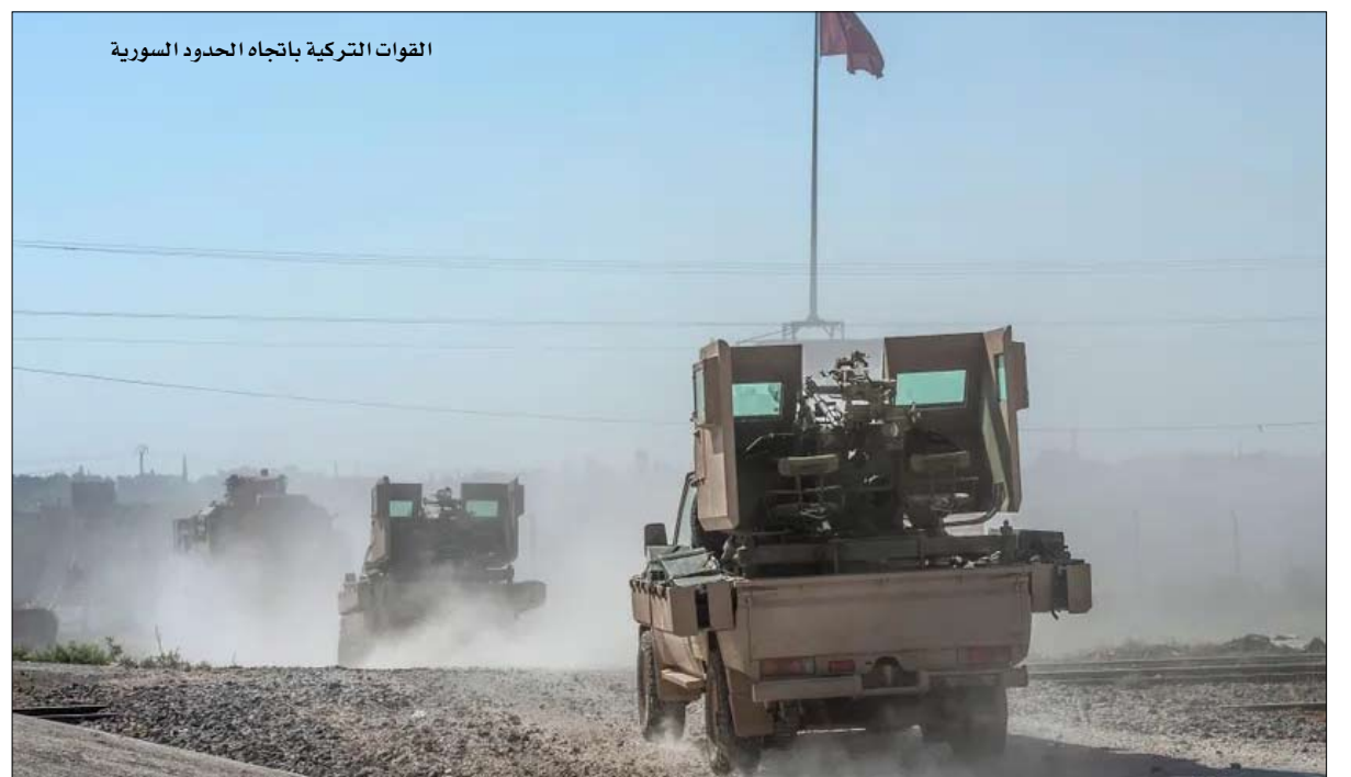
القوات التركية باتجاه الحدود السورية