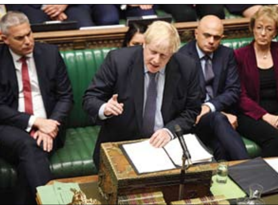
جونسون يتحدث أمام مجلس العموم البريطاني

قرر مجلس العموم البريطاني، أمس السبت، إرجاء التصويت على اتفاق الخروج من الاتحاد الأوروبي (بريكت)، بينما أكد رئيس الوزراء بوريس جونسون أنه لن يفاوض الأوروبيين على تأجيل جديد. وصوت مجلس العموم على إلزام الحكومة بتמיד موعده البريكت، لكن جونسون قال إنه لن يطلب من الاتحاد الأوروبي إرجاء بريكت. وبأغلبية 322 صوتا مقابل 306 وافق النواب على التعديل الذي قدمه النائب أوليفر ليتوين