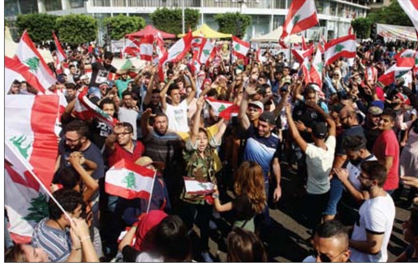
لبنانيون يرفعون أعلام بلادهم خلال احتجاجهم على الأوضاع الاقتصادية

صور جنوبي لبنان، حيث أقدم مسلحون من الحركة على فض تحركات شعبية، مطلقين النار على المتظاهرين من المدنيين، فأوقعوا إصابات في صفوفهم. وأطلق محتجون هتافات منددة برئيس مجلس النواب نبيه بري، متهمين إياه بالتورط في سرقات وصفقات. وأحرق المتظاهرون منتجعا في صور يقولون إن ملكيته تعود إلى زوجة بري. ودعا الناشطون الجيش والقوى الأمنية إلى الكف عن استخدام العنف المرط في التظاهرات، كما عبروا عن غضبهم من كلام زعيم ميليشيات حزب الله اللبناني حسن نصر الله الذي بدأ وكأنه يهدد الحراك ويقال من أهميته.