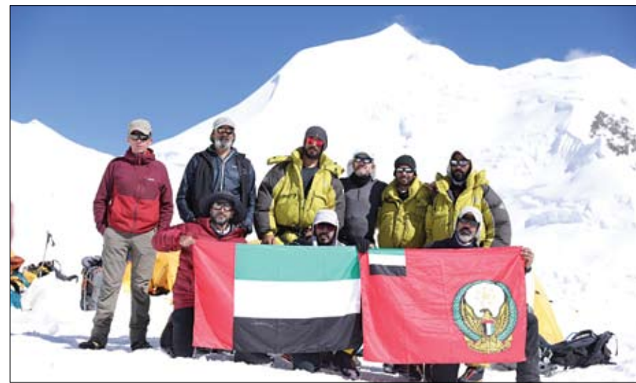
والسير بعكس اتجاه الرياح حتى الوصول الى القمة بعد حوالي تسع ساعات من انطلاقهم من ثمانية تحت الصفر لكن ثلاثة من أعضاء الفريق أصروا على تحدي الظروف المناخية القاسية والصقيع الناتج عن الانخفاض الشديد في درجات الحرارة والتي وصلت لأقل من 25 درجة