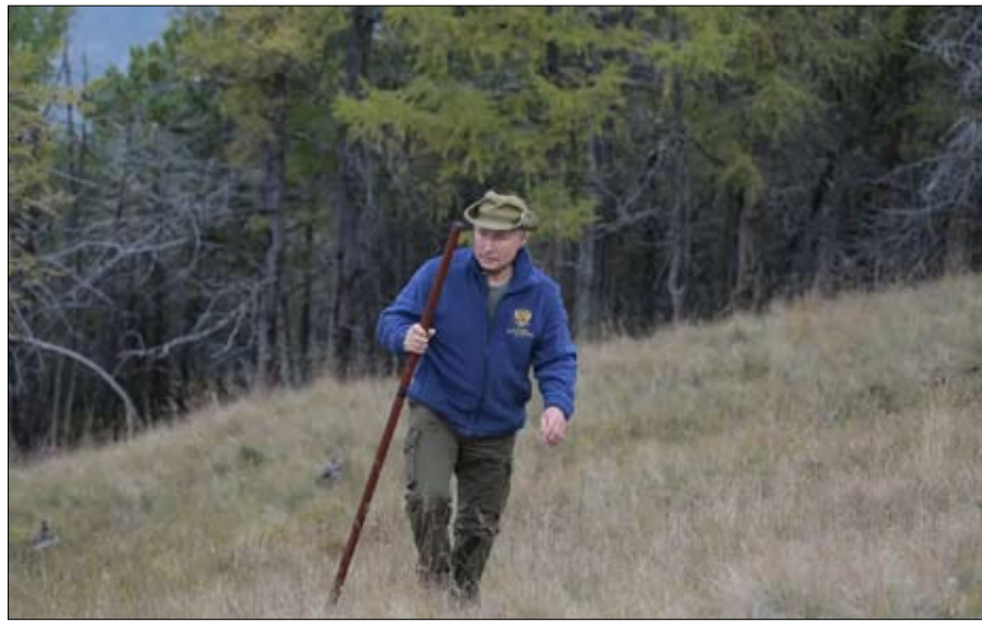
بوتين... قنص الفرص

اليه سيريل بريت، في حوار مع موقع أتلنتيكو رفيع المستوى وأكاديمي. بعد التدريس في مدرسة المعلمين العليا، وجامعة نيويورك، وجامعة موسكو، وفي البوليتكنيك، يدرس حاليا في جامعة العلوم السياسية. كما أنه مؤسس، بمعبة فلوران بارمنتيه، مدونة أوراسيا بروسبكتيف.