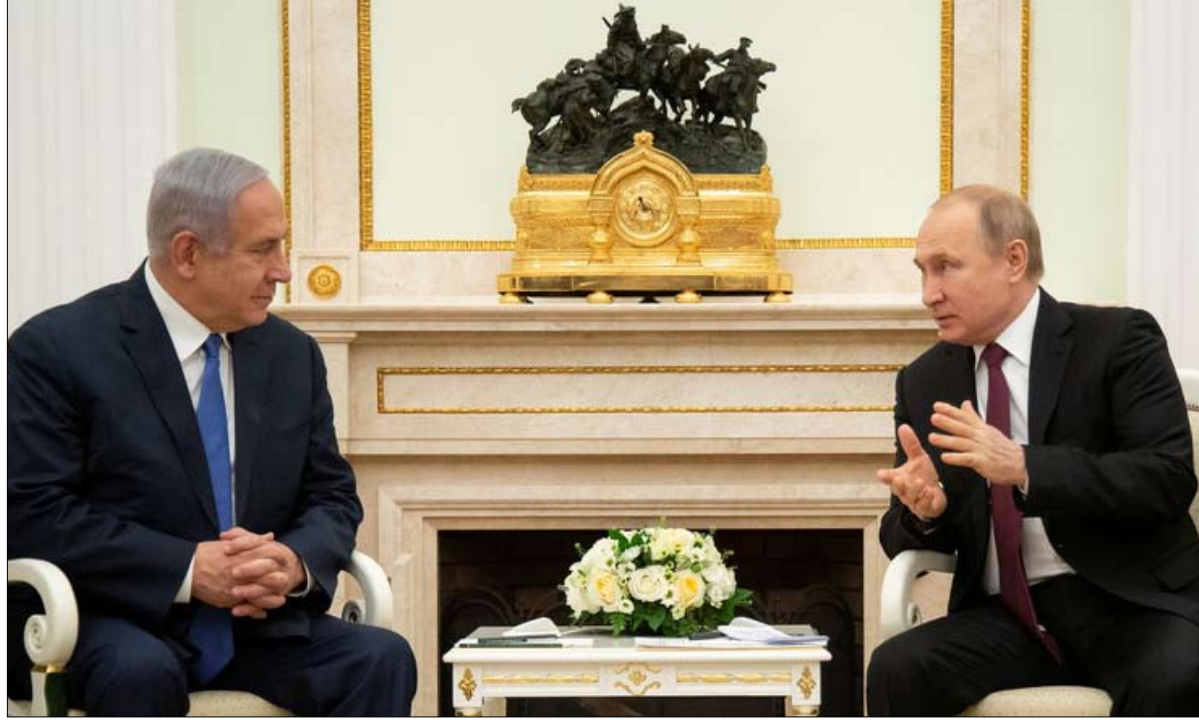
تحالفات مع الأضداد