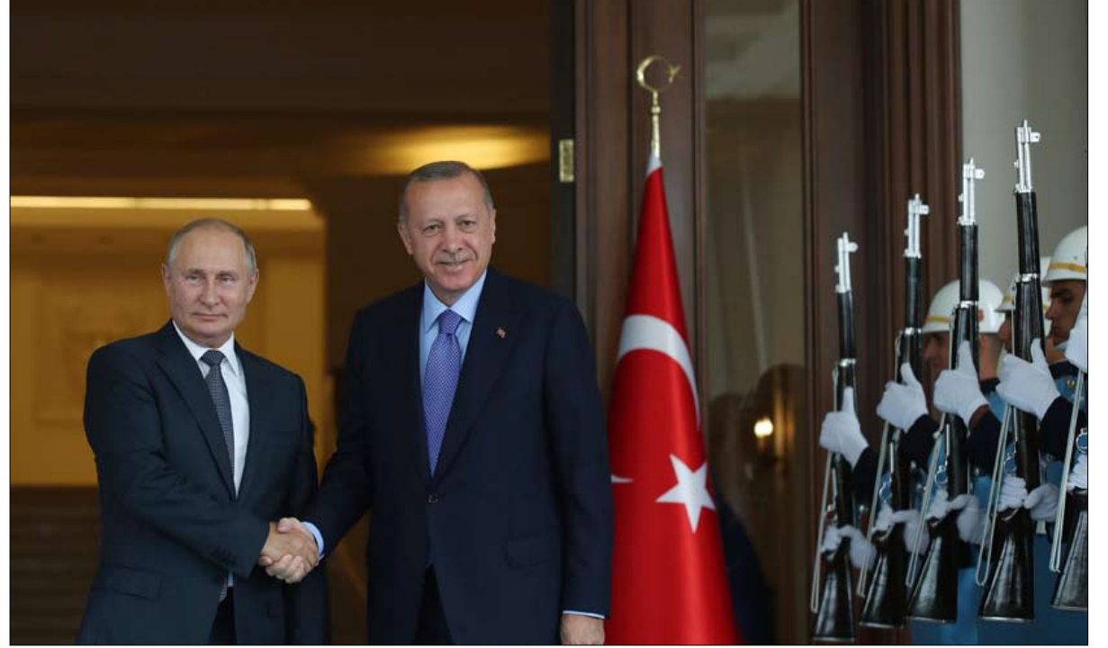
بوتين على كرسيين.. تركيا وسوريا