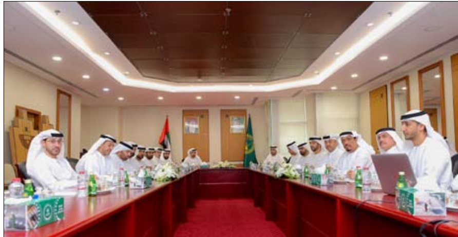
كما ناقش المجلس عدداً من المواضيع الأخرى المتعلقة بالإجراءات المتخذة

ضبط المروجين والمهربين، وتعزيز التعاون الدولي في مجال مكافحة