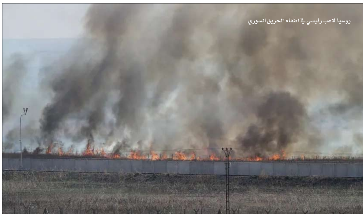
روسيا لاعب رئيسي في إطفاء الحريق السوري