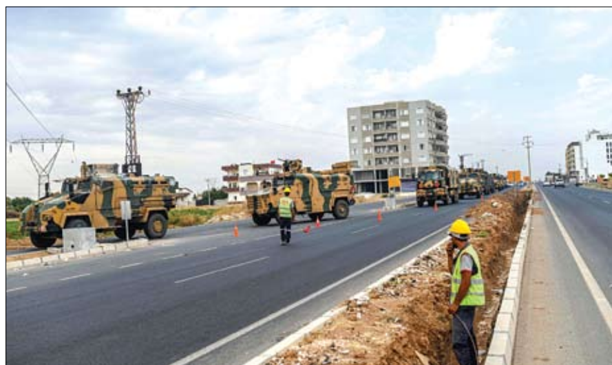
موكب من التعزيزات العسكرية التركية لتصعيد العدوان على مدينة تل أبيض

من أتقرة في طريقها لاقتحام مدن سورية ومنها رأس العين. وكتب يتجه المزيد من المقاتلين، بمن فيهم دواعش سابقون، إلى الحدود السورية التركية هنا الصباح استعدادا لهجمات جديدة على البلدات الحدودية رغم وقف إطلاق النار المعلن عنه... سوف يستمر المعتدون في الهجوم ما لم يكن هناك ضامن. وكتب يتجه المزيد من المقاتلين، بمن فيهم دواعش سابقون، إلى الحدود السورية التركية هنا الصباح استعدادا لهجمات جديدة على البلدات الحدودية رغم وقف إطلاق النار المعلن عنه... سوف يستمر المعتدون في الهجوم ما لم يكن هناك ضامن.