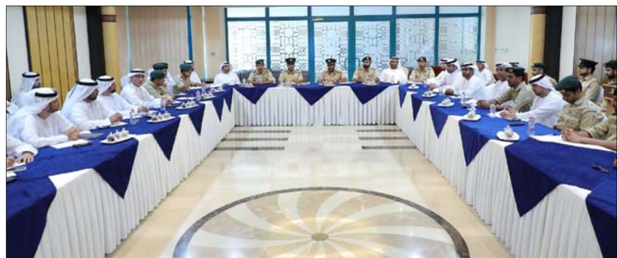
المختلفة التي تسعى إلى تسليط الضوء على فعالياتاتها في مكان الحدث الرئيسي ببرج خليفة

الذي يتضمن عروض الإضاءة والألعاب النارية معلناً بداية عام جديد بحلة جديدة بحضور مئات الآلاف وملايين المشاهدين. وأضاف أن شرطة دبي سخرت كافة إمكانياتها وتقنياتها الذكية إلى جانب العمل الميداني لرجال الشرطة من أجل العمل على تأمين الفعاليات مع مختلف الشركاء الاستراتيجيين، مؤكداً على أهمية العمل الجاد والتنسيق المستمر بين جميع الفرق في لجنة تأمين الفعاليات، وسرعة تجهيز كل جهة لخطتها الأمنية بهدف دراستها ووضع خطة تأمين وتنظيم متكاملة ورفعها لسعادة القائد العام