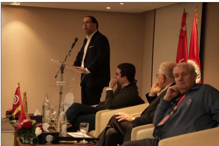
تحيا تونس يلتحق بركب المقاطعين

أعلنت إدارة الإعلام التابعة لرئيس الحكومة المكلف الحبيب الجملي سيعقد ندوة صحفية في ساعة متأخرة من مساء أمس أو اليوم الثلاثاء لإطلاق الرأي العام على آخر مستجدات مشاورات تشكيل الحكومة المقبلة. وقد توجه رئيس الحكومة المكلف الحبيب الجملي عشية امس إلى القصر الرئاسي بقرطاج بدعوة من رئيس الجمهورية قيس سعيد لحضور اجتماع طارئ دعي إليه أيضا زهير المغزاوي عن حركة الشعب ومحمد عيو عن التيار الديمقراطي ويوسف الشاهد عن حركة تحيا تونس وراشد الغنوشي عن حركة النهضة او من يمثلها وذلك للوقوف على العقبات والعثرات التي حالت دون اتفاق الرباعي. ويأتي هذا الاجتماع في إطار تقريب وجهات النظر وبحث المقترحات والتوافقات الممكنة من أجل حلحلة أزمة تشكيل الحكومة الجديدة.