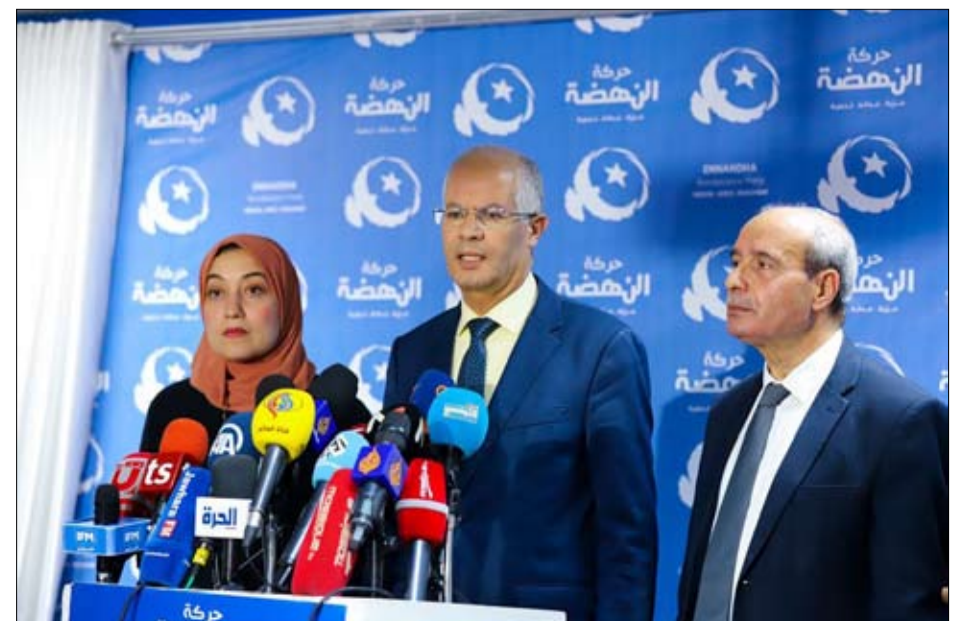
الندوة الصحفية لحركة النهضة