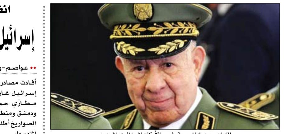
اللواء سعيد شنقريحة رئيس الأركان الجزائري الجديد

أفادت مصادر متعددة، فجر أمس، بشأن إسرائيل غارات على سوريا، استهدفت مطاري حماة والبيفر العسكريين ودمشق ومنطقة السيدة زينب، مؤكدة أن الصواريخ أطلقت من بارجات إسرائيلية في المتوسط. بدوره، أكد المرصد السوري لحقوق الإنسان، سماع دوي ثلاثة انفجارات هزت مناطق العاصمة دمشق وريفها، ناجمة عن تصدى الدفاعات الجوية التابعة للنظام لصواريخ يعتقد أنها إسرائيلية، طالت مواقع لقوات النظام والمليشيات الإيرانية في محيط العاصمة دمشق. كما أوضح أن الضربات الصاروخية الإسرائيلية أدت إلى مقتل 3 أشخاص على الأقل من جنسيات غير سورية، يرجح أنهم من الجنسية الإيرانية وقتلوا بسقوط أحد الصواريخ على المنطقة الواقعة بين السيدة زينب وعقربا جنوب العاصمة دمشق. هذا وأفادت وسائل إعلام النظام السوري أن الدفاعات الجوية السورية تصدت لصواريخ معادية قادمة من إسرائيل،