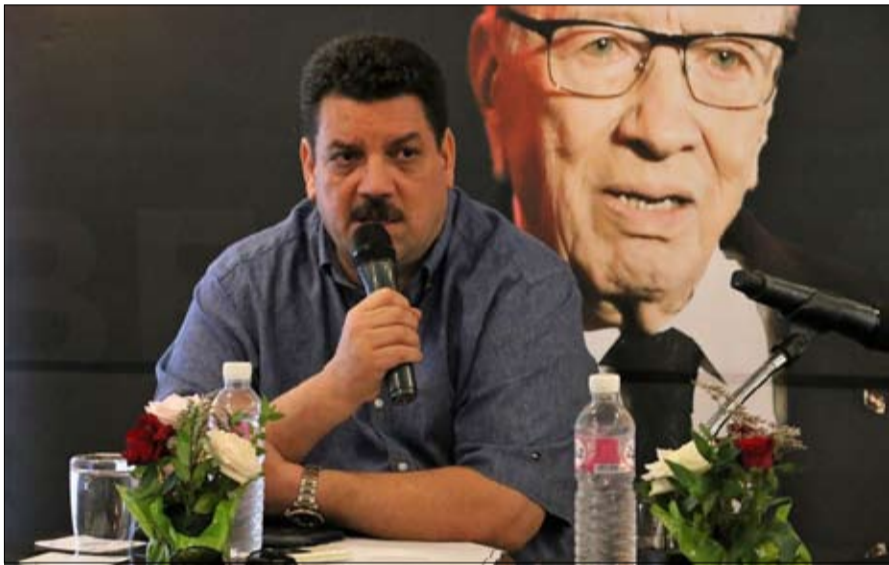
النداء يدعو الى استبعاد الأحزاب

على البلاد. ودعا التيار إلى أن "تشكل الحكومة في أقرب وقت" متمنيا لها ولرئيس الحكومة المكلف التوفيق في مهامها، معلنا أنه سيعمل على أن يكون معارضا نزيهة وجدية ومسؤولة.