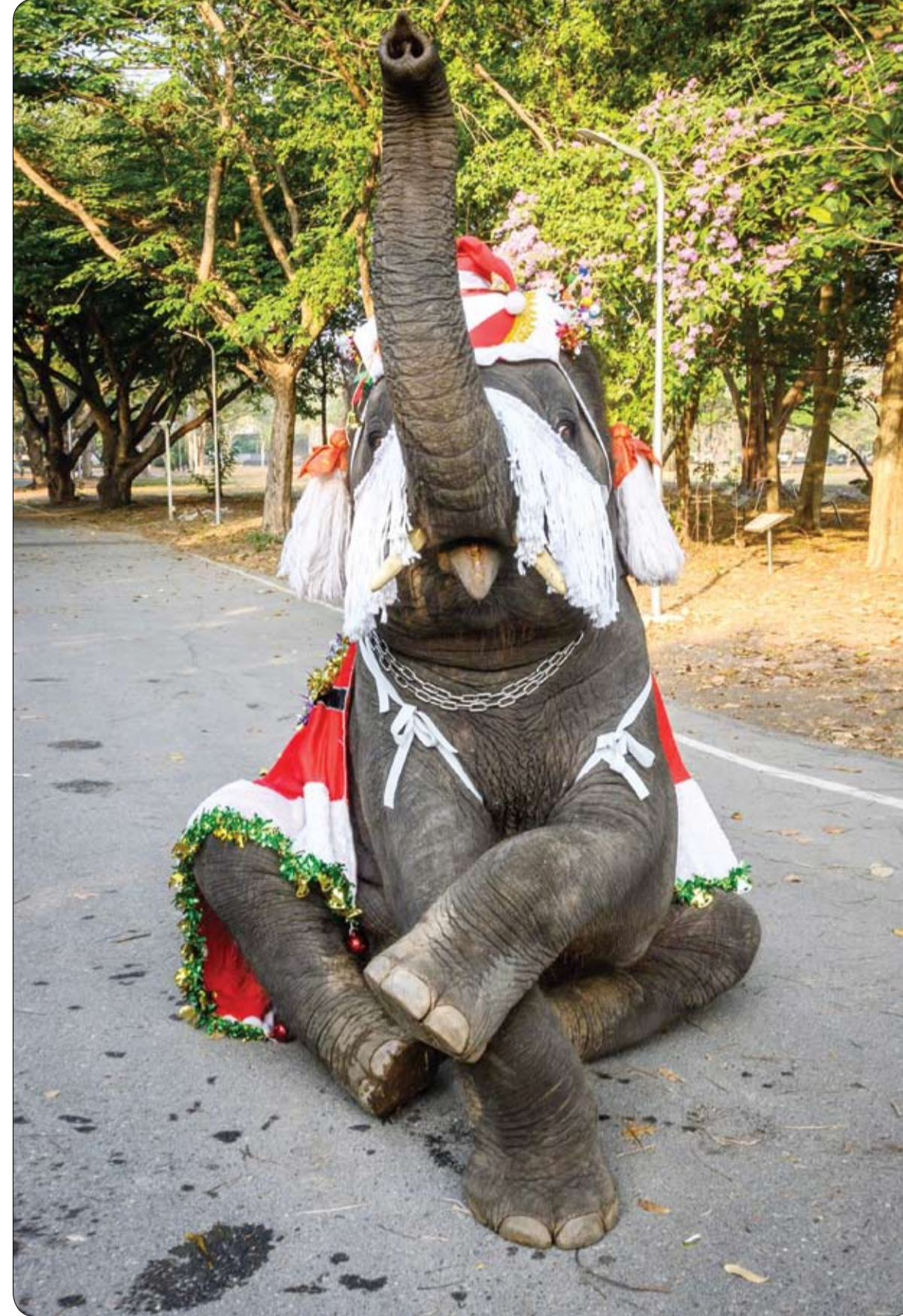
فيل يرتدي زي سانتا كلوز ويؤدي عرضا قبل تقديم هدية لأطفال المدارس خلال احتفالات عيد الميلاد في أيوتايا بتايلاند.

عمل مجموعة من المهندسين من جامعة ستانفورد الأمريكية، على تصميم مدهش لسيارة تعمل بتقنية القيادة الذاتية، وتميز بقدرتها على "التفحيط" على مضمار السباق بشكل ذاتي. وأدخل المصممون برنامجاً خاصاً يدعى برنامج ديوربان، على السيارة الجديدة التي تحمل العديد من المميزات، مثل السرعة الفائقة وإمكانية الالتفاف والدوران بشكل احترافي وأمن، والتوقف فجأة بحركة سريعة. وتعد هذه السيارة العجيبة، الأولى من نوعها على مستوى العالم، وهي مستوحاة من فيلم "باك تو ذا فويوتشر" الذي ظهرت فيه سيارات ذاتية القيادة فائقة السرعة في شوارع المدن.