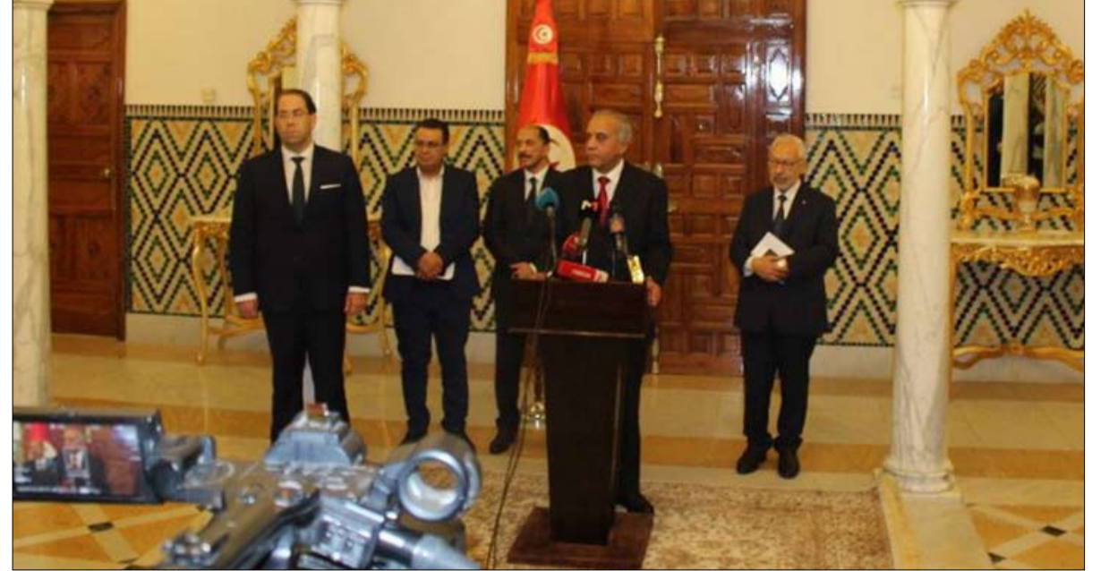
وافترقنا قبل ان نبدا الطريق