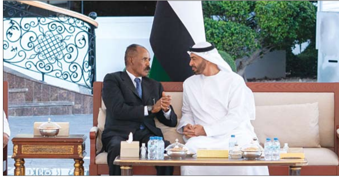
محمد بن زايد خلال استقباله رئيس إريتريا

ووجه البيان كلمة إلى كبار مسؤولي الأمن والاستخبارات الإيرانية بالقول إن التلفزيون الحكومي يظهر يومياً الاحتجاجات في الدول الأخرى لكنكم لا تترددون بالقتل أو القمع أو السجن إزاء احتجاجات البلاد السلمية. وشد على أن احتجاجات المعلمين واضراباتهم سلمية وهي تتزامن حالياً مع امتحانات الطلبة، مضيفاً أن حركة المعلمين اليوم تنمو أكثر من أي وقت مضى لتحقيق العدالة والحرية والقضاء على التمييز والفقر.