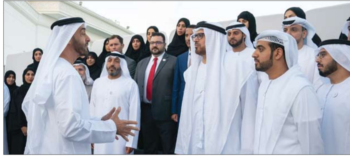
الشيخ طحنون بن محمد آل نهيان و سمو الشيخ سعيد بن زايد آل نهيان ممثل الحاكم في منطقة العين والشيخ عيسى بن زايد آل نهيان وسمو الشيخ نهيان بن زايد آل نهيان رئيس مجلس أمناء مؤسسة زايد بن سلطان آل نهيان للأعمال

الخيرية والإنسانية و سمو الشيخ منصور بن زايد آل نهيان نائب رئيس مجلس الوزراء وزير شؤون الرئاسة وسمو الشيخ حامد بن زايد آل نهيان عضو المجلس التنفيذي وسمو الشيخ عبدالله بن زايد آل نهيان وزير الخارجية والتعاون الدولي وسمو الشيخ ذياب بن محمد بن زايد آل نهيان رئيس ديوان ولي عهد أبوظبي وعدد من الشيوخ والمسؤولين. يذكر أن البرنامج يستهدف تدريب المشاركين على مهارات جديدة تساعدهم على نشر ثقافة التسامح في المجتمع فيما تركز المساقات العلمية على ما تتطلبه كل مهارة من أسس وأدوات تقنية تدرب المتحقيين بالبرنامج على