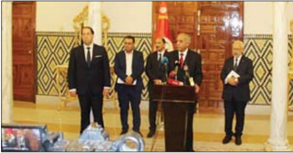
وافترقنا... قبل ان نبدأ الطريق

أعلنت حركة طالبان أمس مسؤوليتها عن هجوم قتل فيه جندي أميركي في أفغانستان، مؤكدة أن عددا من العسكريين الأميركيين والأفغان أيضا جرحوا في هذا الهجوم. وفي رسالة عبر تطبيق واتساب إلى وكالة فرانس برس، قال الناطق باسم الحركة ذبيح الله مجاهد إن المتمردين قاموا بتفجير آية أميركية في شار دارا في إقليم قندوز بشمال أفغانستان، في وقت متأخر من الأحد. وجاءت رسالة طالبان بعد إعلان الجيش الأميركي مقتل أحد عسكرييه خلال مهمة في أفغانستان. وقال مسؤول أميركي إن الجندي قتل في انفجار مخزن للأسلحة كان يتفقد. وأضاف المسؤول الذي طلب عدم كشف هويته لم يحدث ذلك نتيجة هجوم كما يؤكد العدو.