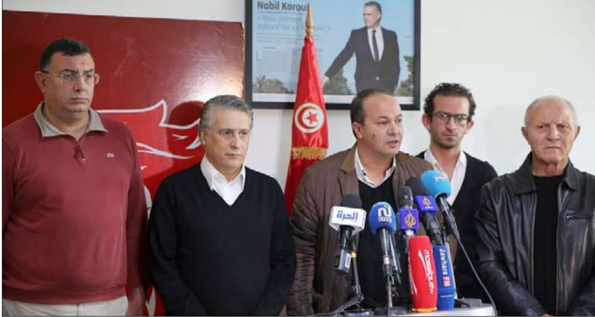
قلب تونس على الخط ويشترط