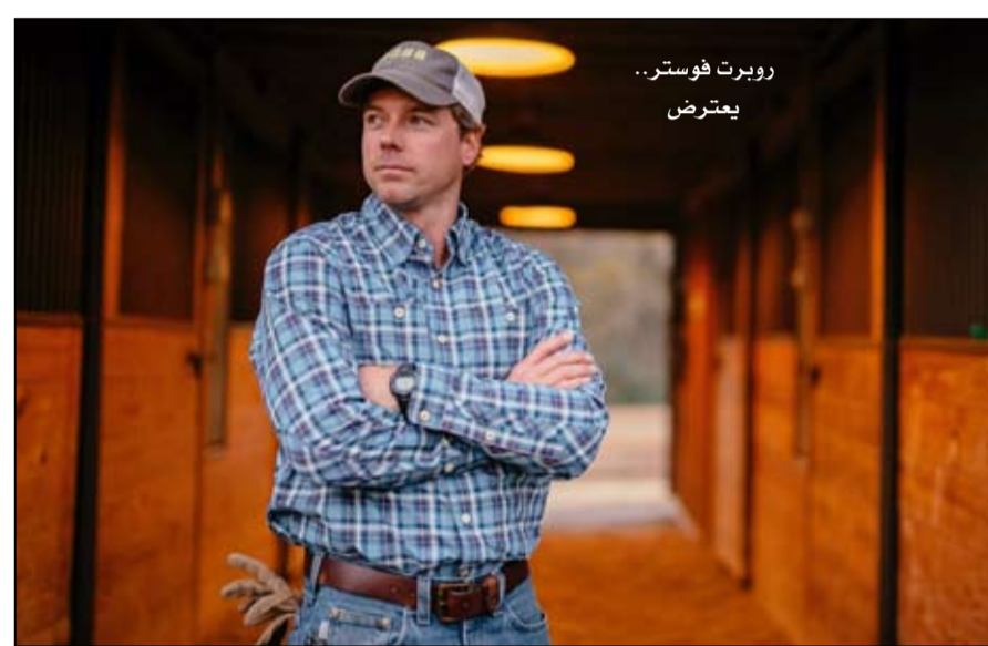
روبرت فوستر... يعترض

ميسيبي، بيل والر، أنه من "المنطق السليم" أن يرفض المرء الانسداد بامرأة ليست زوجته، "أعتقد أنه في هذه الأيام، المظاهر مهمة، والشفافية مهمة. هذه القاعدة، المستوحاة من النص ببلي غراهام، يتبعها أيضا نائب الرئيس الأمريكي مايك بينس. عام 2016، لخصت صحيفة إنديانا، التي كان حاكما لها، مقاربتة: «خلال السنوات الاثنتي عشرة التي قضاها في الكونغرس، كان لدى بنس قواعد لتفادي إغراءات الخيانة الزوجية، أو حتى شائعات عن وجود مخالفات. ومن بين قواعده: طلب أن يكون المساعدون الذين يعملون في وقت متأخر إلى جانبه، من الرجال، ولم يتناول طعامه بمفرده مع امرأة بخلاف زوجته، ولم يذهب إلى حفلة حيث يتم تقديم المشروبات الكحولية، إذا لم تصحبه كارين.»