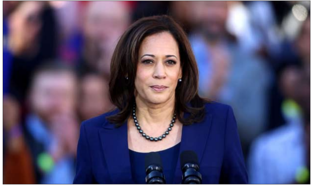
البيضاء يفضلون ترامب على كامالا هاريس