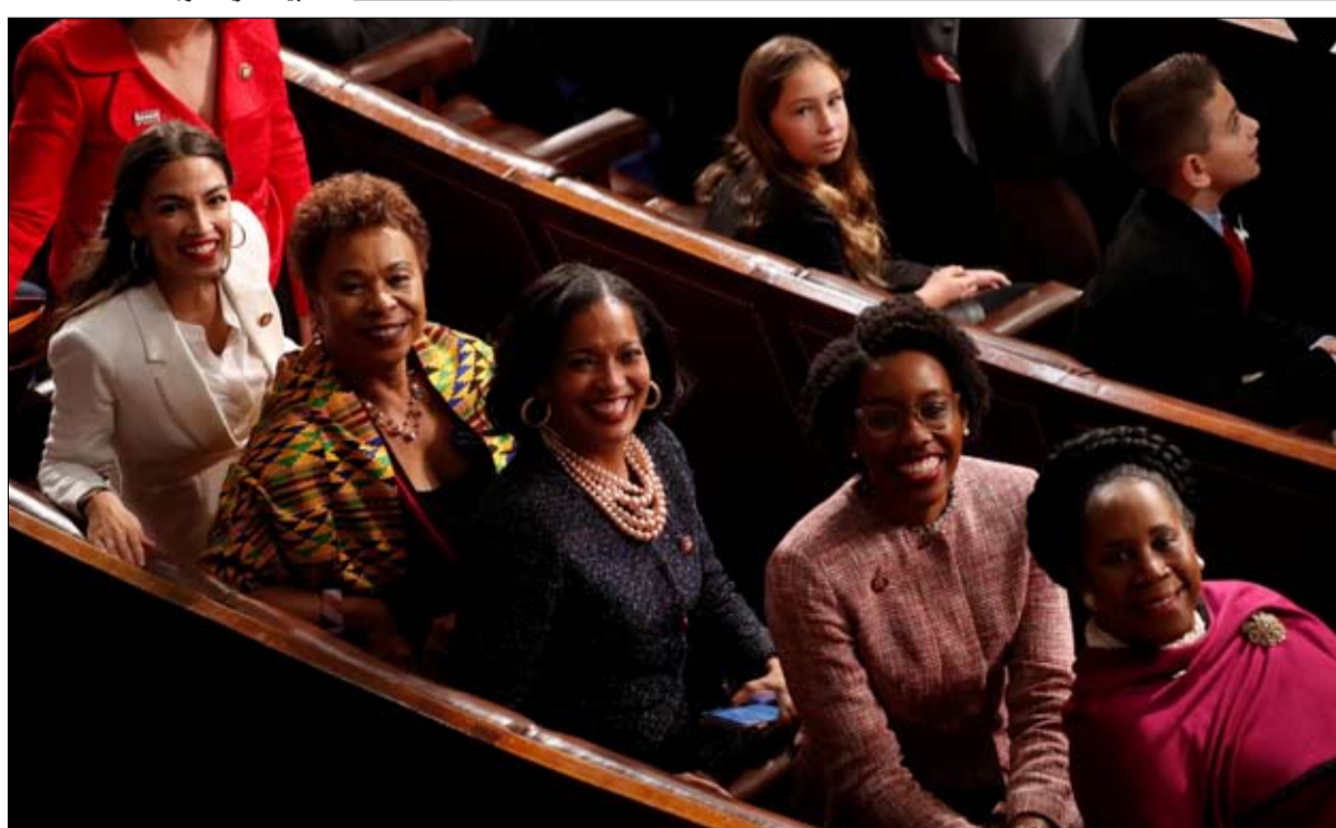
كورنتين تقود جوقة الديمقراطيات ضد ترامب