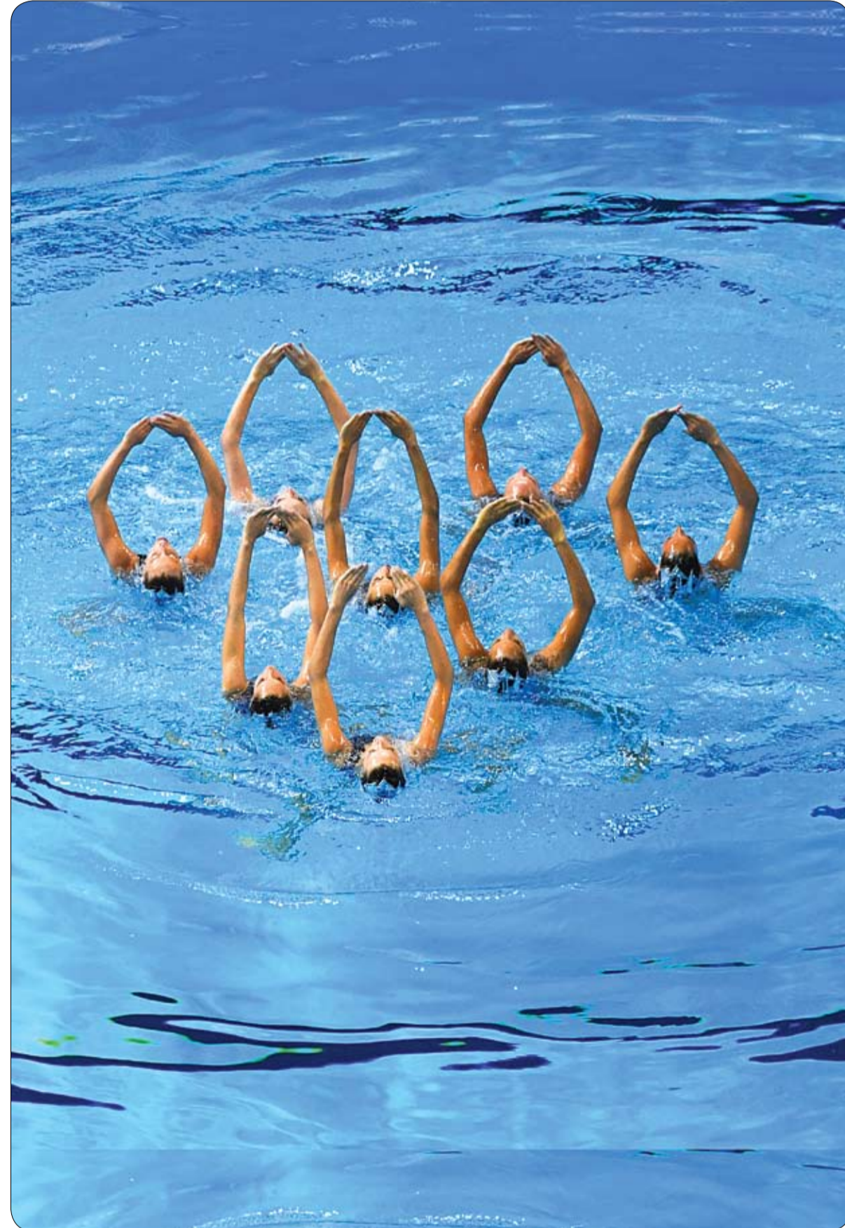
يتنافس فريق الولايات المتحدة الأمريكية في نهائي السباحة الإيقاعية خلال بطولة العالم 2019 للألعاب الرياضية في غوانغجو.