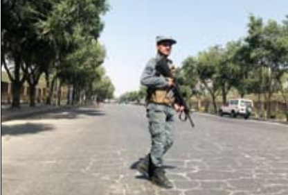
جندي أفغاني في موقع الانفجار بكابول

•• الفجر - خيرة الشيباني: روبرت فوستر، المرشح الجمهوري لمنصب حاكم ولاية ميسيسيبي، صنع الحدث وسقط اسمه مؤخرا بعد رفضه أن تقضي الصحفية لاريسون كامبل حملته الانتخابية. وكان يُفترض أن توابك المراسلة يوماً كاملاً من نشاطه خلال تنقلاته في حملته، ولكن في بعض الحالات كانا عليهما ان يكونا على انفراد. (التفاصيل ص12)