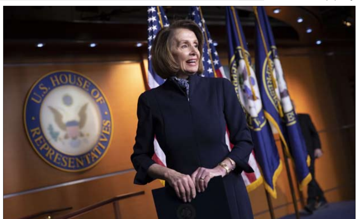
نانسي بيلوسي انقسام في صفوف الديمقراطيين