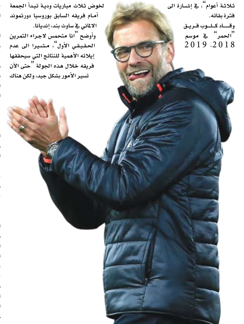
وقاد كلوب فريق "الحمير" في موسم 2018-2019

أكد المدرب الألماني يورغن كلوب التزامه الاستمرار مدرباً لفريق ليفربول الإنجليزي للأعوام الثلاثة المتبقية من عقده "على أقل تقدير"، وذلك مع انطلاق بطل أوروبا في كرة القدم، في جولة تحضيرية للموسم الجديد في الولايات المتحدة. وأبدى كلوب استغرابه لسؤاله من قبل الصحفيين عن تقارير تشير لإمكانية رحيله مع نهاية عقده في 2022، قائلاً "لا أعتقد أنه يتم طرح هذا السؤال على العديد من الناس قبل ثلاثة أعوام من انتهاء عقدهم. وأضاف "سرى، ماذا علينا أن نفكر بهذا؟ على أقل تقدير ثلاثة أعوام - هذه هي الإجابة، على الأقل ثلاثة أعوام"، في إشارة إلى فترة بقائه.