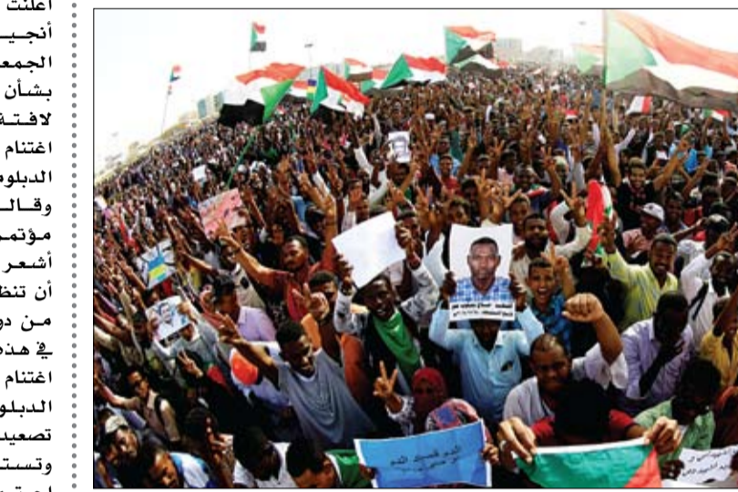
طلاب سودانيون يحملون صوراً لشهداء الاحتجاجات في الخرطوم

عضو مدني يتوافق عليه. واتفق الطرفان على أن يتم تشكيل حكومة كفاءات مدنية فيما تم إرجاء تشكيل المجلس التشريعي لما بعد تشكيل الحكومة السودانية كما اتفق الجانبان على تشكيل لجنة تحقيق وطنية مستقلة بشأن أحداث العنف منذ 11 أبريل الماضي. من جهة أخرى، قال المبعوث الأفريقي إلى السودان، محمد حسن ولد لبات، أمس إنه سيلتقي ممثلي الحركات المسلحة السودانية لدعم الاتفاق بين قوى الحرية والتغيير والمجلس العسكري. وأوضح ولد لبات أنه سيتوجه إلى العاصمة الإثيوبية، أديس أبابا، من أجل لقاء ممثلي هذه الحركات، سعياً لأخذ مطالبها بعين الاعتبار وحشد دعم أوسع للاتفاق النهائي. ويجري وفد من التحالف المعارض