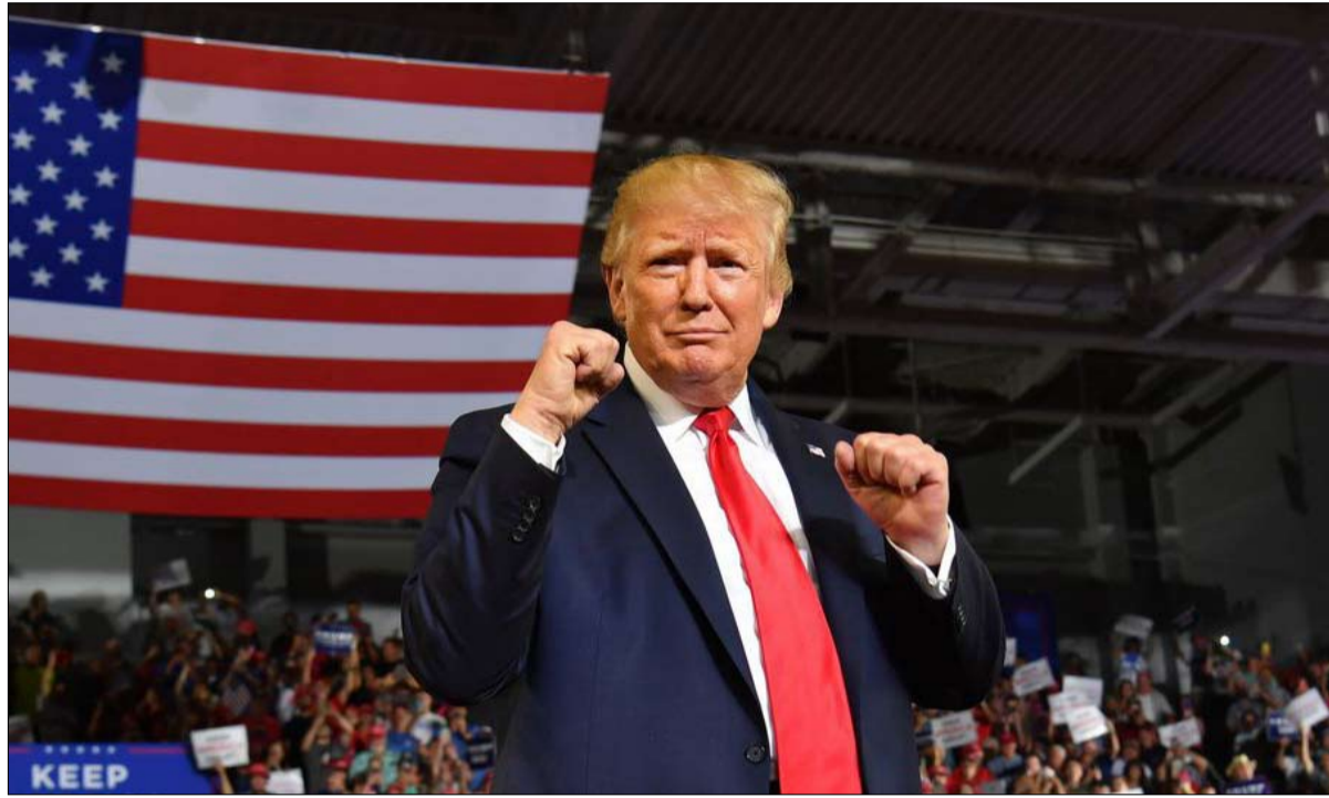
ترامب استراتيجياً ملاكم