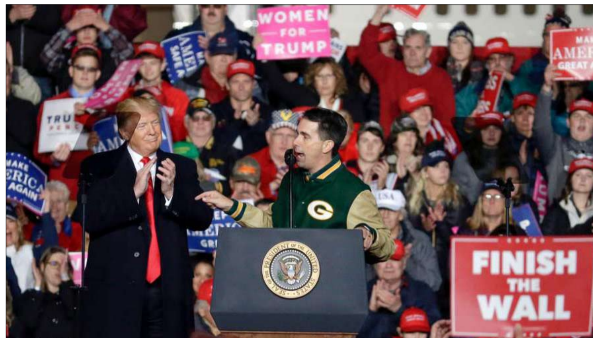
هدف ترامب تعبئة البيض والذكور منهم

النظر عن الإخفاق النسبي لسياسة الهجرة، خاصة حول جداره على الحدود المكسيكية، الذي لم يتمكن من بنائه. لقد تسببت هذه الحركة، في بداية العام، في إغلاق استمر عدة أسابيع للإدارة الأمريكية، مما أجبر البلاد على التراجع، وكان أطول إغلاق في تاريخ البلاد. تهديدات عديدة من طرف ترامب ... كانت حصيلتها هزيلة على الأرض. إنه يصطدم إما باليمين،