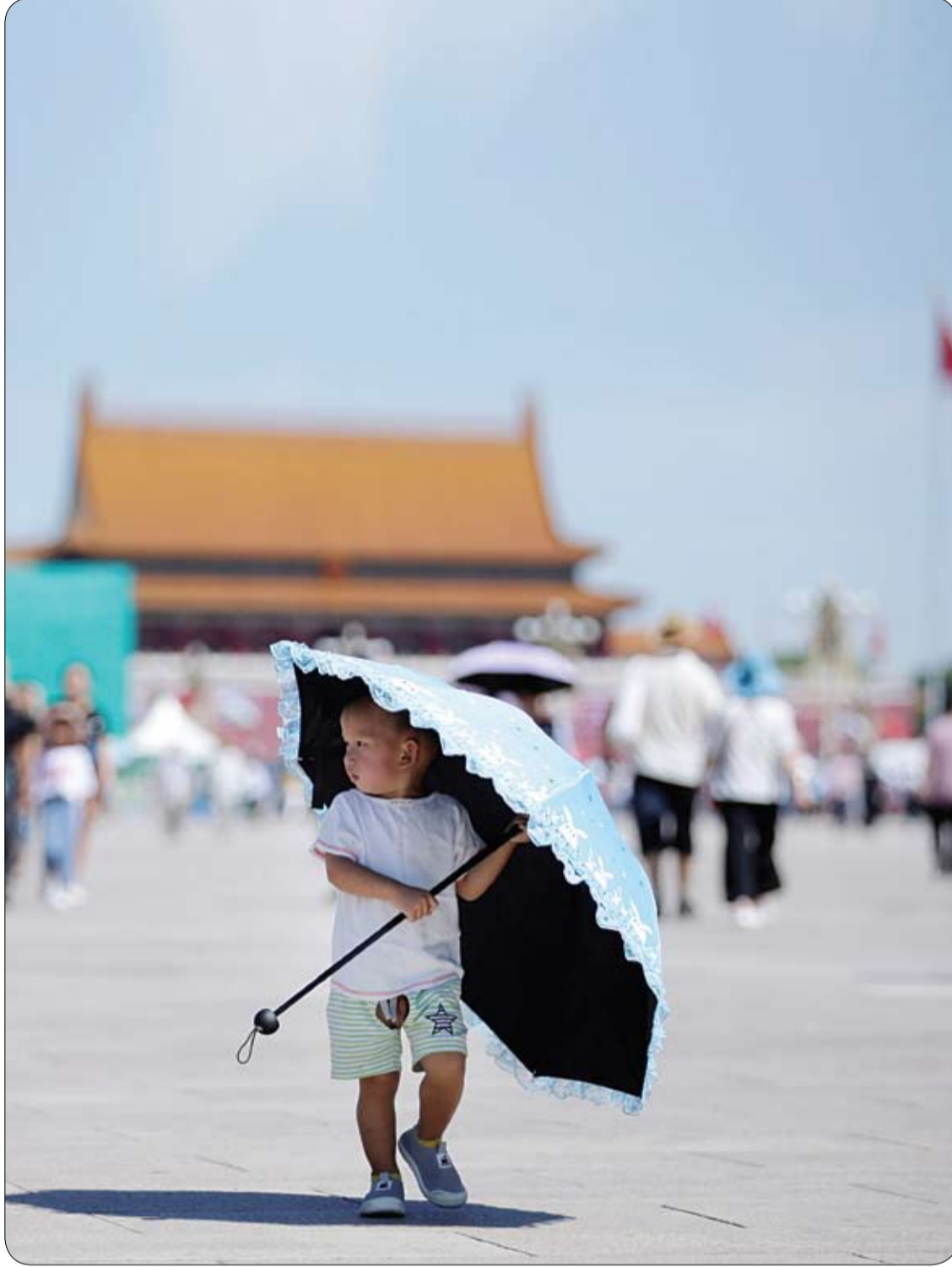
طفل يحمل مظلة في ميدان تيانانمن، في العاصمة الصينية بكين.

ولكشف العلاقة بين الشاي الأخضر والسمنة، راقب الفريق مجموعتين من الفئران الذكور التي تغذت على نظام غذاء غني بالدهون يقود إلى السمنة، لكن تناولت الأولى الشاي الأخضر ضمن نظامها الغذائي، في حين لم تتناول الثانية الشاي الأخضر. وبعد انتهاء فترة المتابعة -التي استمرت ثمانية أسابيع- قام الباحثون بقياس وزن أنسجة الجسم والدهون ومقاومة الجسم للأنسولين لدى المجموعتين، وعوامل أخرى شملت التهابات الأنسجة الدهنية والأمعاء، وتكوين ميكروبات الأمعاء النافعة، والتي من المعروف أنها تساهم في الوقاية من مجموعة متنوعة من الأمراض الالتهابية والمناعية. ووجد الباحثون أن الفئران التي تتغذى على نظام غذائي غني بالدهون وشربت الشاي الأخضر اكتسبت وزنا وكتلة دهنية أقل بنحو 20%، وكانت أقل مقاومة للأنسولين من الفئران التي تتغذى على نظام غذائي مماثل ولم تشرب الشاي الأخضر.