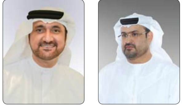
بهدف تعزيز المشاركة الفاعلة للشباب في انتخابات المجلس الوطني الاتحادي 2019