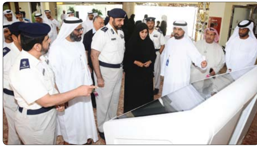
المرأة رمز التسامح