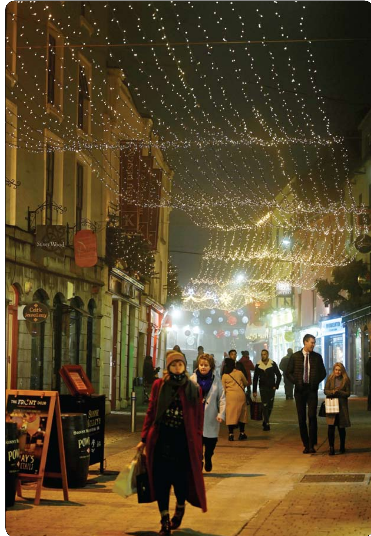
أضواء عيد الميلاد تزين أحد الشوارع بينما المتسوقون يسرون في وسط المدينة في غالواي، إيرلندا.

وتراجعت الإصابات مؤخرا منذ بلغت ذروتها في سبتمبر، رغم موسم المهرجانات المزدهم الشهر الماضي، الذي رافقه ازدهامات كبيرة في الأسواق والشوارع.