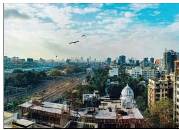
تم تحديد مدينتين... مومباي وتشنغو

اعتبر رئيس الوزراء البريطاني بوريس جونسون أمس أن مواقف لندن والاتحاد الأوروبي في المحادثات حول مرحلة ما بعد بريكت، لا تزال متباعدة جداً، وذلك قبل توجهه إلى بروكسل هذا الأسبوع لمحاولة حلحلة المفاوضات المتعثرة. وقال رئيس الوزراء المحافظ الذي يقترض أن يلتقي في الأيام المقبلة رئيسة المفوضية الأوروبية أورسولا فون دير لاين، أنا متفائل جداً، لكن يجب أن أكون صادقاً معكم، الوضع في هذه اللحظة حاسم. يجب أن يفهم أصدقائنا أن المملكة المتحدة غادرت الاتحاد الأوروبي لتتمسك بسيطرة ديموقراطية. لا تزال بعيدين عن ذلك. وأضاف بيبدو ذلك صعباً جداً في الوقت الراهن. سنبذل قصارى جهدنا. ومند انفصالها الرسمي عن الاتحاد الأوروبي في 31 كانون الثاني يناير، لا تزال المملكة المتحدة تطبق القواعد الأوروبية. أما خروجها الفعلي من السوق الموحد والاتحاد الجمركي فسيحصل في 31 كانون الأول ديسمبر الحالي. في نهاية الفترة الانتقالية.