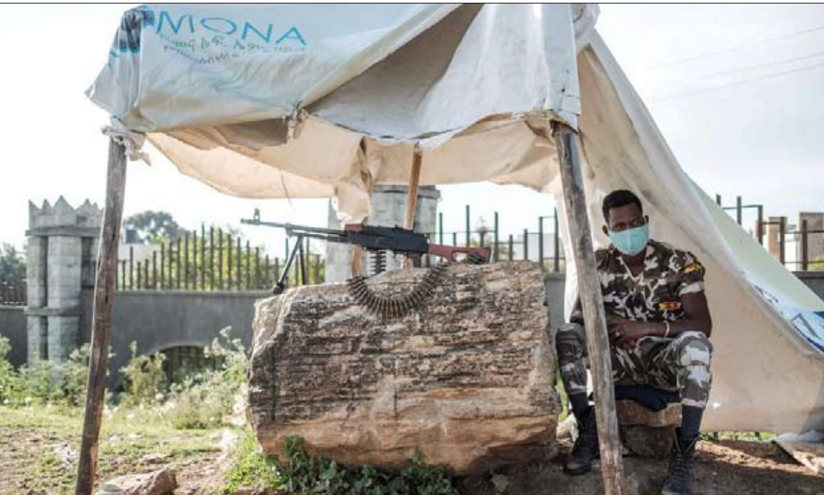
نقطة تفتيش في العاصمة ميكيي

للوهلة الأولى، يصعب فهم شراسة السلطة المركزية الإثيوبية بقيادة رئيس الوزراء الحائز على جائزة نوبل للسلام عام 2019 لاستعادته السلام بين إثيوبيا وإريتريا. ومع ذلك، فإن الأسباب التي تشرح نشأة هذا الصراع هي إلى حد كبير نتيجة وصوله إلى السلطة ومعها المجموعة العرقية التي يجسدها. ولئن كانت إثيوبيا اليوم، منذ دستور 1994، دولة اتحادية