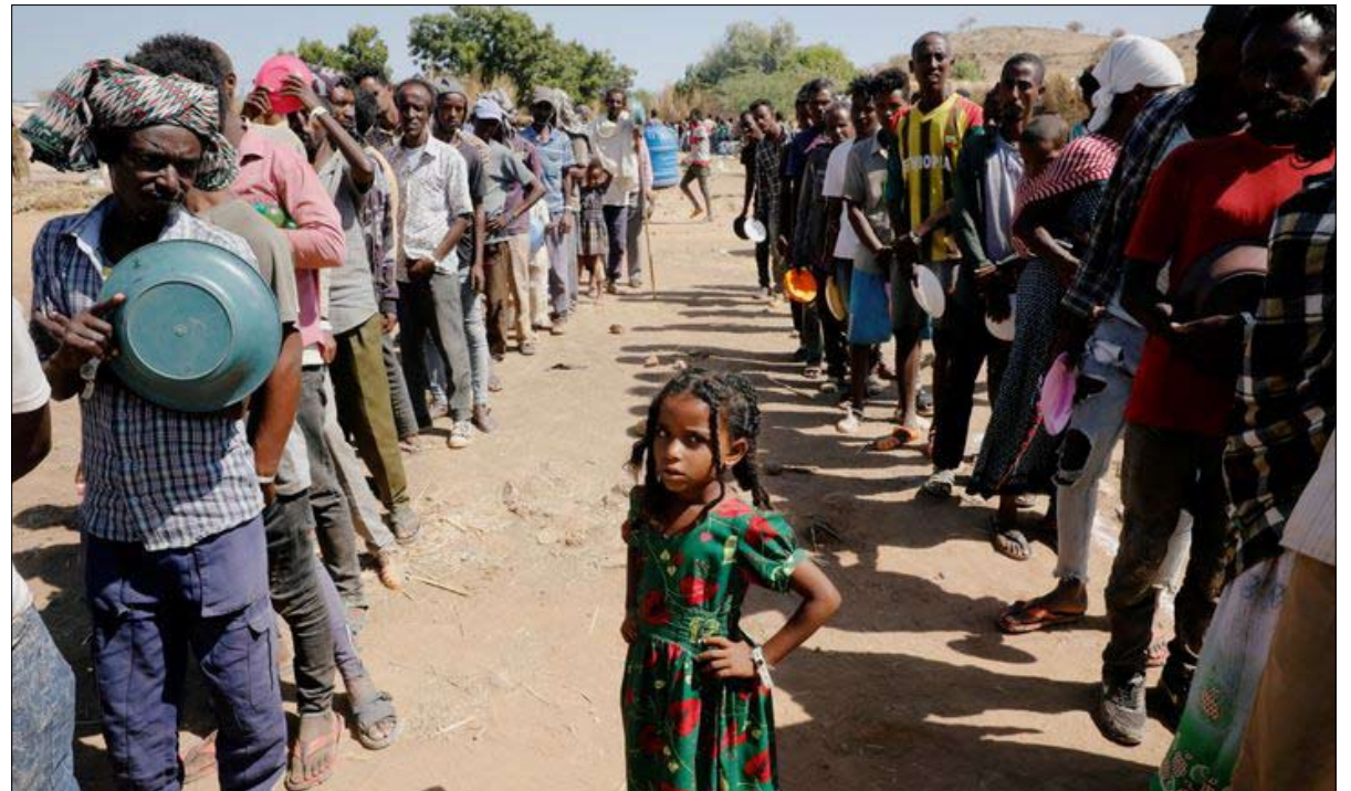
لاجئون في السودان

من الصحافيين والسياسيين والمثقفين مسجونون بناء على تهم واهية بشكل غريب. يحكم القضاة الموالون للحكومة بما يناقض قرارات المحاكم التركية العليا ومن ضمنها المحكمة الدستورية، وبما يناقض قرارات المحكمة الأوروبية لحقوق الإنسان إن القضاة الذين يجرون على إصدار أحكام «غير مرغوب بها» يواجهون غالباً عقوبات تأديبية. ليس صدفة أن تضع منظمة فريدوم هاوس تركيا في لائحة الدول «غير الحرة» سنة 2020 إلى جانب دول مثل أفغانستان وأنغولا وبيلاروسيا وبيروناي وفطر إيران وليبيا وكوريا الشمالية وغيرها. وفقاً لشروع العدالة العالمية، تحل تركيا في المرتبة 107 من أصل 128 دولة في مجال حكم القانون. وبحسب منظمة مراسلون بلا حدود، تحتل تركيا المرتبة 154 من أصل 180، وهي أسوأ من مراتب باكستان والكونغو وبنغلادش. وعود أردوغان الإصلاحية هي إشكالية بشكل كبير: ليست حقيقية، كما أنها قليلة جداً ومتأخرة جداً. بعد أيام قليلة على إطلاق حملته الإصلاحية، رفض الدعوات لإطلاق سجينين هما سياسي كردي وناشط حقوقي. يقول المحلل السياسي البارز ومدير شركة كوندرا للأبحاث بكر أعديدر: «صمد برنامج أردوغان للإصلاح تسعة أيام فقط». يرى بكدل أن أردوغان في مأزق خطير: هو يريد أن تعانق دولته كأي ديموقراطية في العالم الثالث بينما يأمل في جذب الاستثمار الغربي بالكميات والشروط نفسها التي تتمتع بها ديموقراطية غربية. «هذا لن يحدث»، يحزم الكاتب.