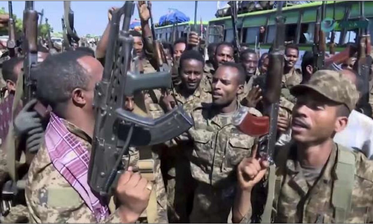
المئات قتلوا والآلاف شردوا في الصراع