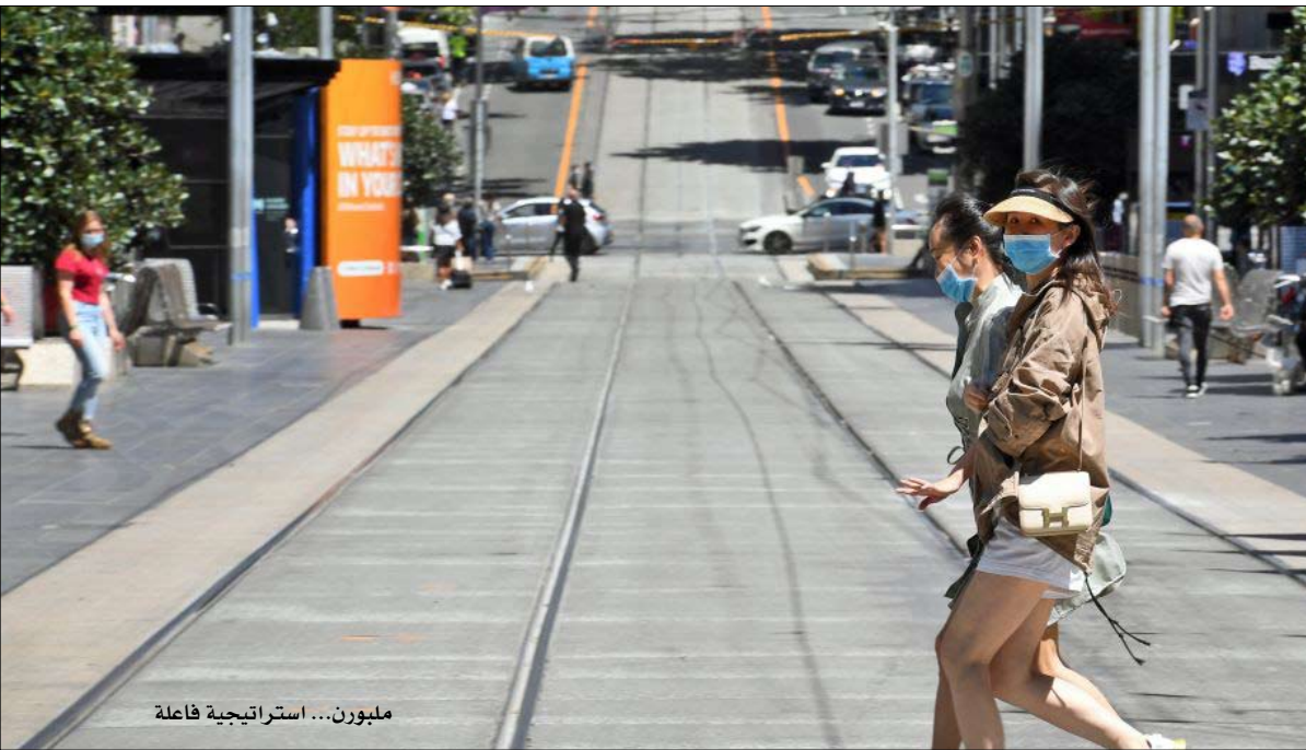
ملبورن... استراتيجية فاعلة