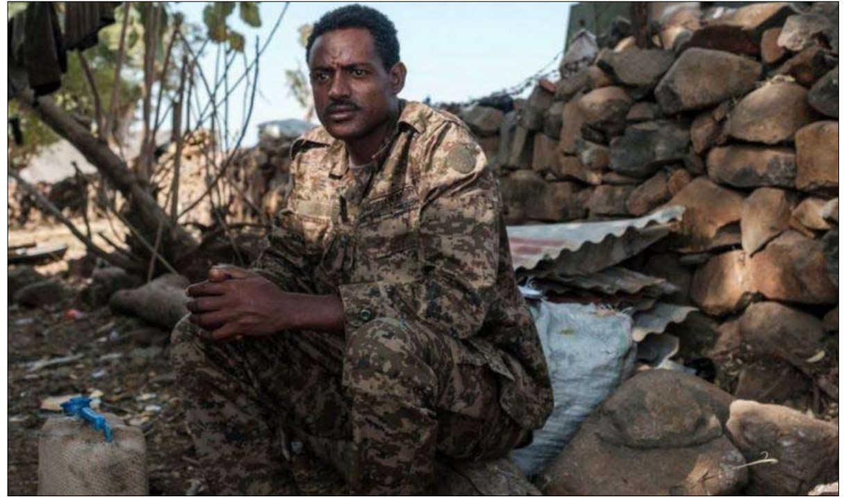
القوات الفيدرالية تقاوت جبهة تحرير شعب تيغراي