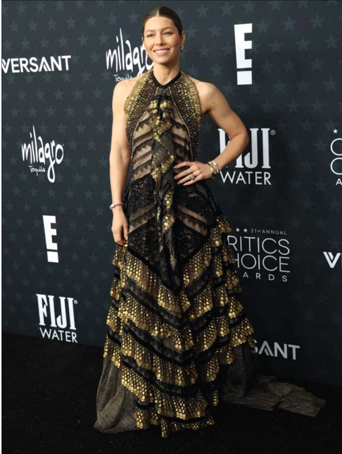
الممثلة الأمريكية جيسिका بيل لدى حضورها حفل توزيع جوائز اختيار النقاد السنوي الـ31 في باركر هانغار، كاليفورنيا.