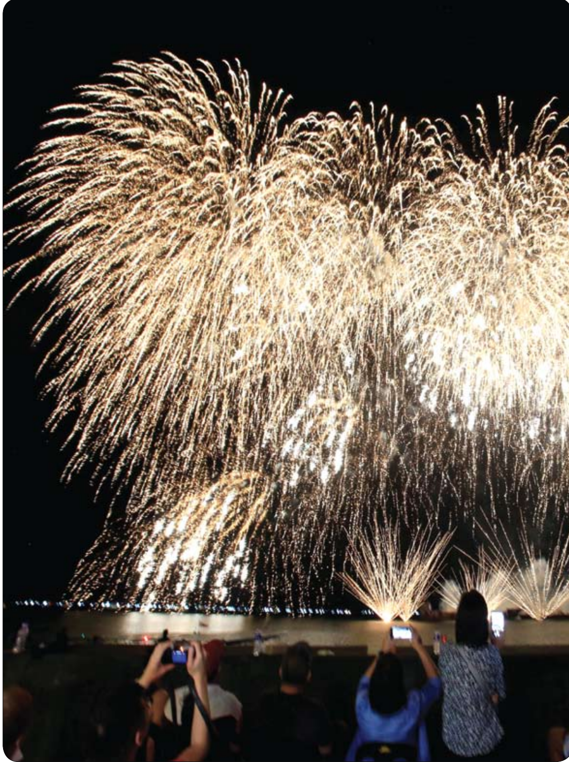
عرض الألعاب النارية يونغ فنج في تايوان يضيء السماء خلال المسابقة الفلبينية الدولية بايموزيكال في مدينة باساي بالفلبين.

الشعور المستمر بالتعب والضعف أمر شائع بين الناس الذين لديهم نمط حياة مزدحم بالعمل، كما يمكن أن يكون عرضاً من أعراض نقص التغذية والإجهاد؛ لكن التعب الذي يؤثر بشكل واضح على المهام اليومية يمكن أن يشير إلى وجود أنواع معينة من السرطان بما فيها سرطان الرئة.