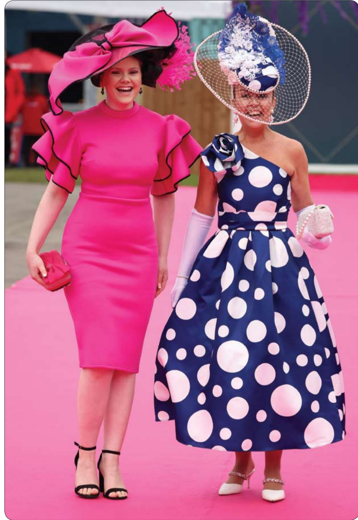
سيدتان تحضران المهرجان الوطني الكبير لسباق الخيل 2023 في مضمار آينرتي، ليفربول، بريطانيا

أعلنت الحكومة اليابانية أمس الجمعة أنها وافقت على خطة منيرة للتحول لبناء أول كازينو في البلاد سيفتتح في أوساكا (غرب) في 2029 بهدف جذب السياح بعد خلافات استمرت سنوات. وكان المسؤولون المحليون في أوساكا وناغازاكي (جنوب غرب) يسعون للحصول على موافقة لبناء منتجعات متكاملة، تشمل كازينوهات للقمار ومراكز للمؤتمرات وفنادق ومطاعم ومسارح وأماكن أخرى للترفيه.