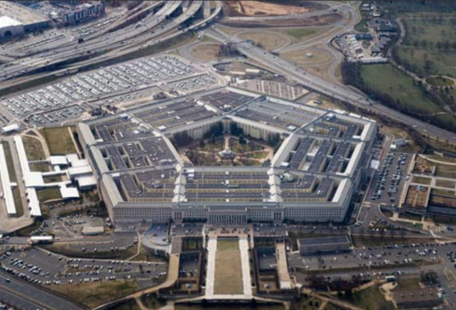
في جهاز الاستخبارات التابع لقواته وخلص إلى أن الوثائق سرّبت بصورة متعمدة.

وقال بريغوجين: "اليوم كنت ذاهبا إلى اجتماع حول الوثائق الأميركية المسربة، بما في ذلك مع ممثلي المخابرات من شركة فاغتر، والمحليلين المختصين بالشأن الأميركي. واستخلصنا الاستنتاجات التالية، هذه الوثيقة هي آخر تحذير أميركي، ونسربت عمدا لطرح أسئلة معينة. وأعتقد أن هؤلاء الزملاء الذين شاركوا في الاجتماع معي سوف يقدمون تفاصيل أكثر عن ذلك في المستقبل القريب"، بحسب ما نقل موقع "روسيا اليوم". وكانت صحيفة "نيويورك تايمز" ذكرت في وقت سابق، ونقلت عن ممثل البنتاغون، أن وزارة الدفاع الأميركية تحقق في تسريب وثائق سرية للبنتاغون تصف حالة الجيش الأوكرائي وخطط الولايات المتحدة و"النااتو" لدعم القوات الأوكرائية، مشيرة إلى أن الوثائق، المؤرخة في أوائل مارس، وُزعت في "قنوات تلغرام الروسية الموالية للحكومة". وُزِعَ أنها يمكن الحصول على أكثر من 100 وثيقة على الإنترنت، وتقدر الأضرار الناجمة عما حدث بأنها كبيرة.