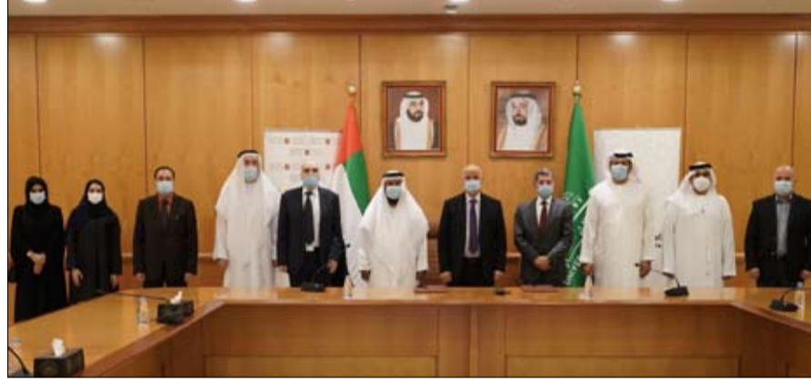
الشارقة-الفضج: وقعت جامعة الشارقة ووزارة العدل ممثلة بمحكمة الشارقة الاتحادية التشريعية مذكرة تفاهم، وقعها عن الأستاذ الدكتور حميد مجول النعيمي، وعن محكمة الشارقة الاتحادية وقعتها رئيسها سعادة سالم علي الحوسني، وذلك بهدف تنمية قدرات طلبة كليات القانون والشريعة والدراسات الإسلامية بالندريين العملي، وتعزيز برامجهما من خلال دمج الجوانب النظرية بالندريين العملية القائمة.

المرموقة على المستوى الإقليمي والدولي وذلك طبقاً لأحدث التصنيفات العالمية الصادرة مؤخراً، وهذا بفضل التوجهات والدمج المتابعة المستمرة لرئيسها صاحب السمو الشيخ الدكتور سلطان بن محمد القاسمي عضو المجلس الأعلى حاكم الشارقة، (حفظه الله تعالى ورعاه)، وأكد أن توقيع مذكرة تفاهم مع محكمة الشارقة للاتحادية التشريعية يأتي في إطار حرص الوزارة على تحقيق الأهداف الاستراتيجية للوزارة ومد جسور التعاون مع كافة الجهات والمؤسسات الأكاديمية النظرية من خلال التدريب العملي