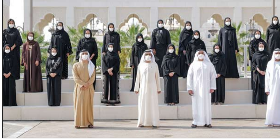
محمد بن راشد خلال تكريم الدفعة الأولى من الرؤساء التنفيذيين للتصميم الحكومي

وفي خطاب ألقاه في معقله بمدينة ويلمنغتون، قال بايدن هذا موقف متطرف للغاية لم نشهده من قبل. موقف رفض احترام إرادة الشعب، ورفض احترام سيادة القانون، ورفض احترام دستورنا.