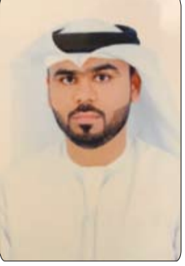
عن المنتخبات الإحاطة بمستوى لاعبي «الهواة» .

المعطيات المرتبطة بالتطور الفني الجيد على صعيد العناصر الشابة في معظم الأندية لكن المشكلة أن المسافة شاسعة بين الحلم والواقع لعدم توافر الظروف المرتبطة بهذا الأمر بسبب عدم وجود متابعة حقيقية لمباريات الدوري أو حتى نقلها عبر القنوات الرياضية حتى تتسنى للمسؤولين