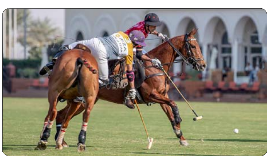
كانت طوق النجاة لفريق الذئاب وتشهد البطولة اليوم الأربعاء مباراتين الأولى تجمع بين فريقتي ليحطف بها الفوز.