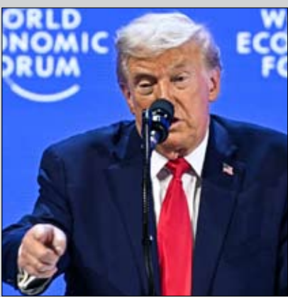
ترامب يهدد بالاستيلاء على غرينلاند بالقوة

هذا التجمع الاقتصادي الكبير في 19 يناير-كانون الثاني، كان دونالد ترامب يهدد بالاستيلاء على غرينلاند بالقوة أو بالإقناع. وفي ظل حالة من التوتر الشديد، بدت الدول الأعضاء في الاتحاد الأوروبي مشلولة أمام احتمال توجيهه المزيد من الضربات من الرئيس الأمريكي، الذي أساء معاملة حلفائه بلا هوادة منذ عودته إلى البيت الأبيض.