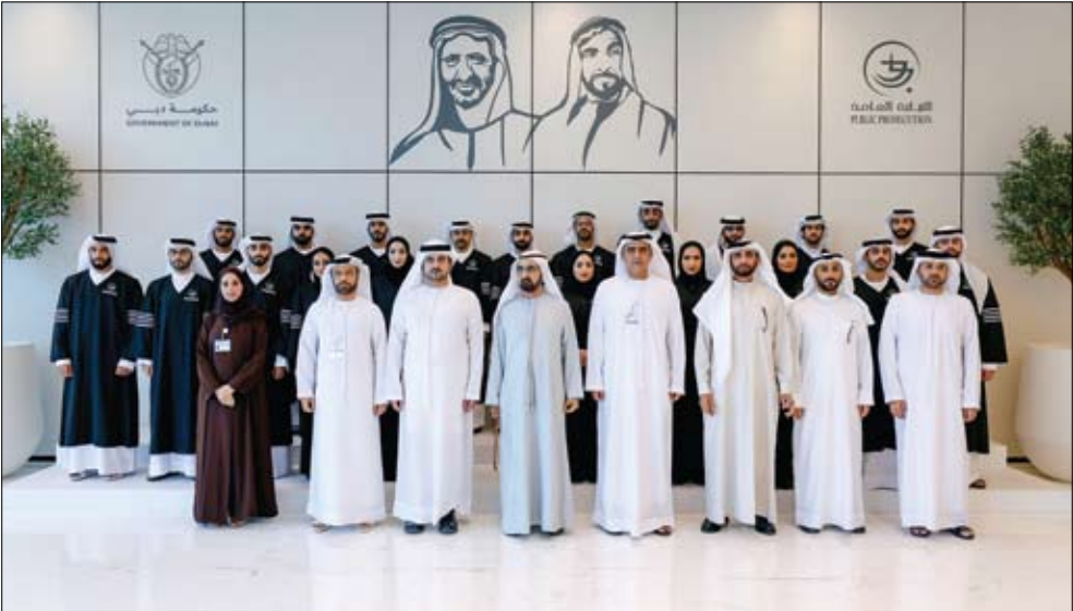
محمد بن راشد في صورة تذكارية مع أعضاء النيابة العامة الجدد في دبي

اعتمد سمو الشيخ منصور بن زايد آل نهيان، نائب رئيس الدولة، نائب رئيس مجلس الوزراء، رئيس ديوان الرئاسة، الخطة الاستراتيجية لمكتب المؤسس، وما تشمله من توجهات ومبادرات تهدف إلى صون إرث المغفور له الشيخ زايد بن سلطان آل نهيان، طيب الله ثراه، وتوثيقه وتفعيله، بما يواكب الأولويات