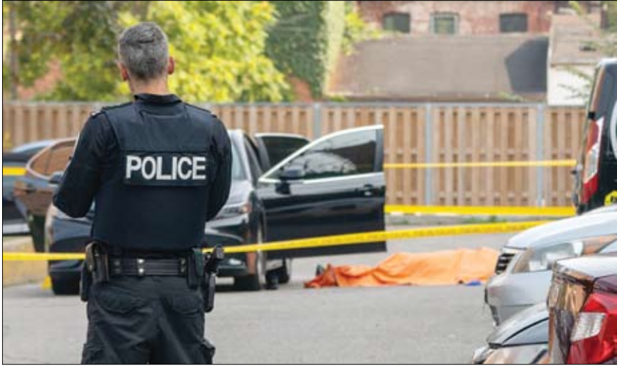
عناصر الشرطة الكندية تعالين موقع إطلاق النار (وام)

استهدف مدرسة ثانوية ومبنى سكني في بلدة تامبيلر ريدج سكشيا في مقاطعة كولومبيا البريطانية. وقالت الشرطة، في بيان رسمي أمس، إن الحادث بدأ