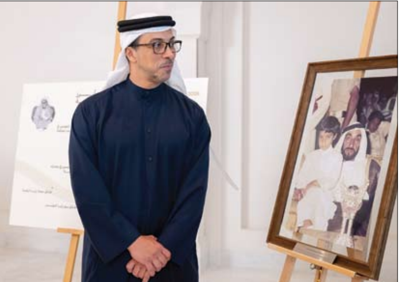
منصور بن زايد خلال العرض التقديمي حول دور المكتب في إثراء المعرفة بسيرة الشيخ زايد

يومية - سياسية - مستقلة www.alfajrnews.ae