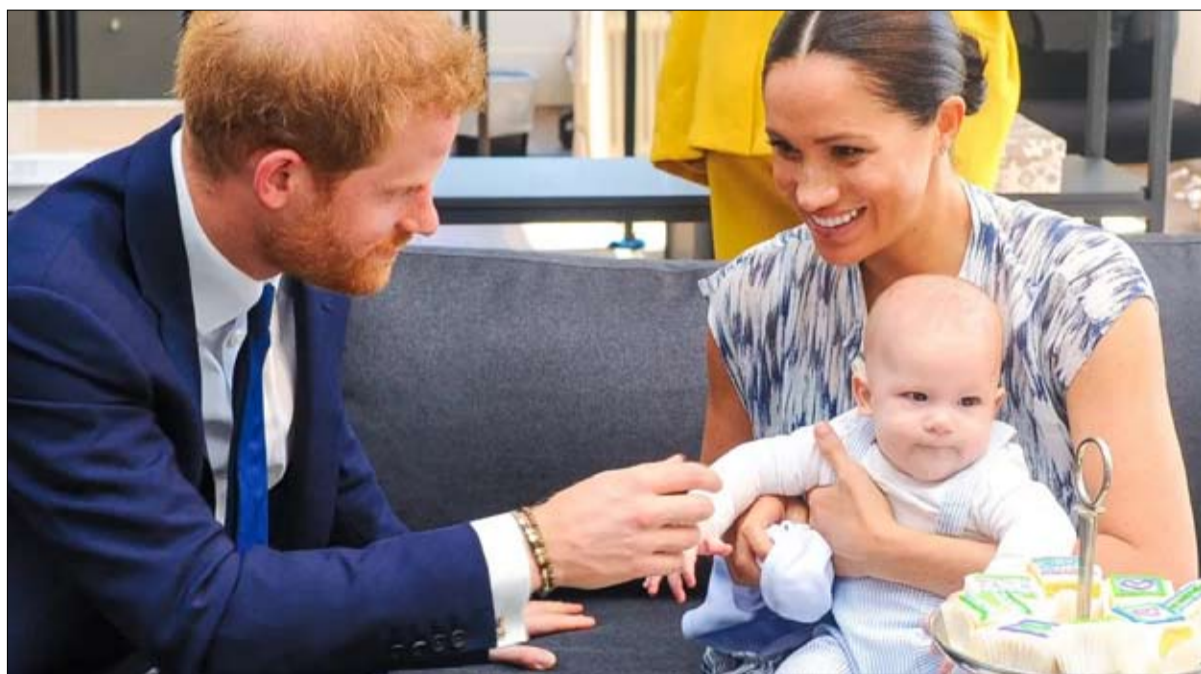
هاري الاولوية لحياته الخاصة

لأن الهدف الكامل من الحرب غير التامثالية لإيران والتي تعتمد على الوكلاء كي تتمكن من نفي تورطها في الهجوم هو ضمان الرد ونجاح النظام معا. والدخول في حرب تقليدية مع الولايات المتحدة يهدد هذا الهدف، وأظهرت شركتا إيران، روسيا والصين، عدم اهتمام بمساعدة النظام بعد الغارة الأمريكية وهو مكسب آخر للاغتيال.