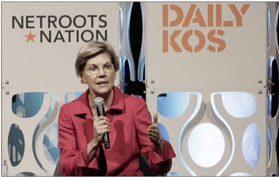
وارن لم تستد من أزمة العجوز الصحية