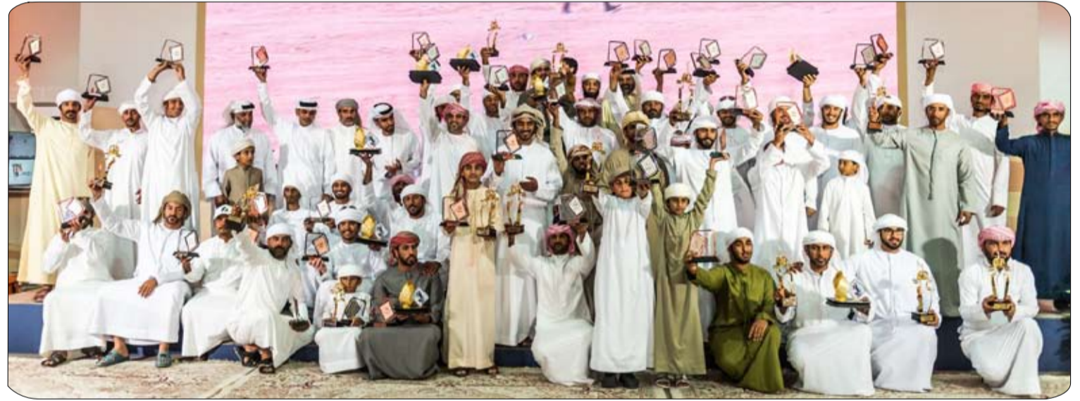
8 أشواط في منافسات الناشئين اليوم