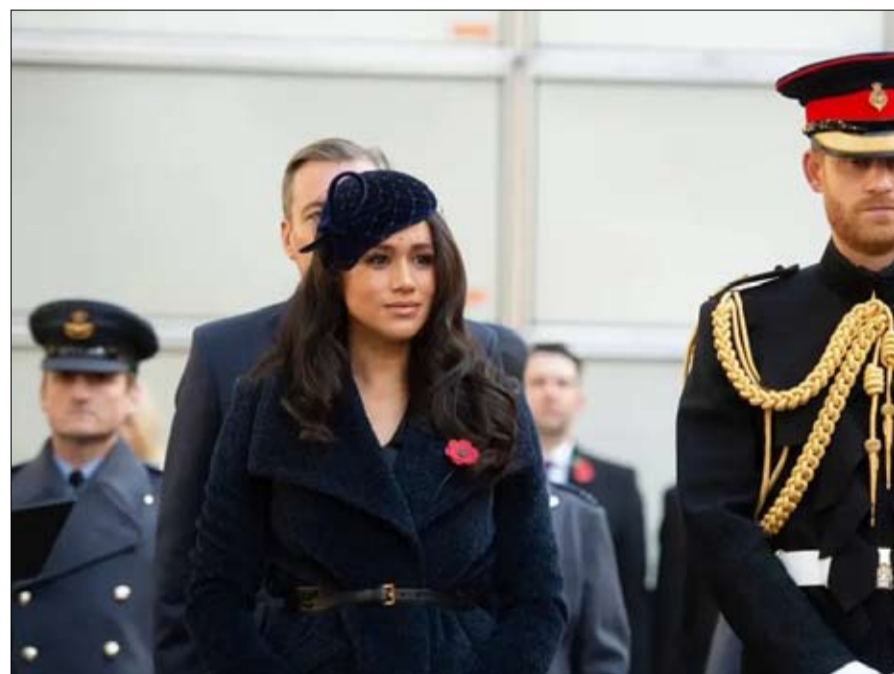
الادوار الرسمية لم تعد تعنيهما