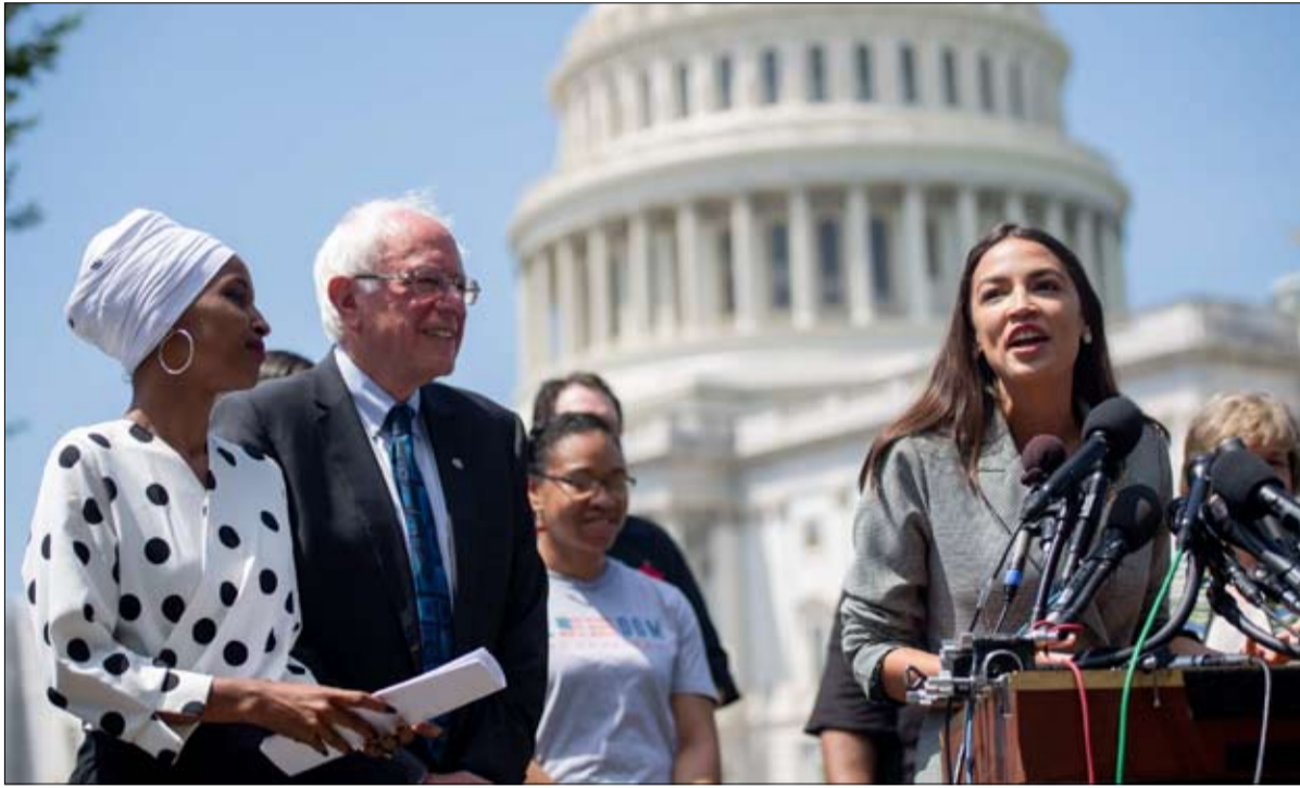
الكسندريا أوكاسيو كورتيز سند ضخم لبييرني