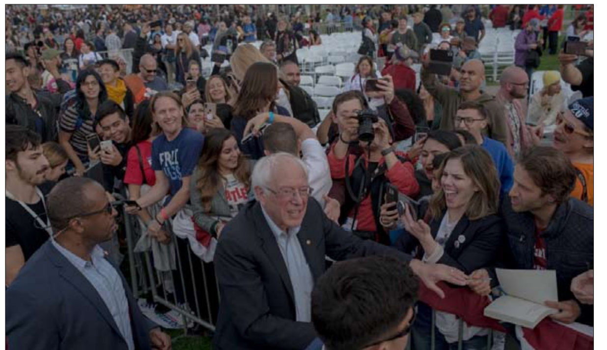
عودة قوية بعد أزمة قلبية