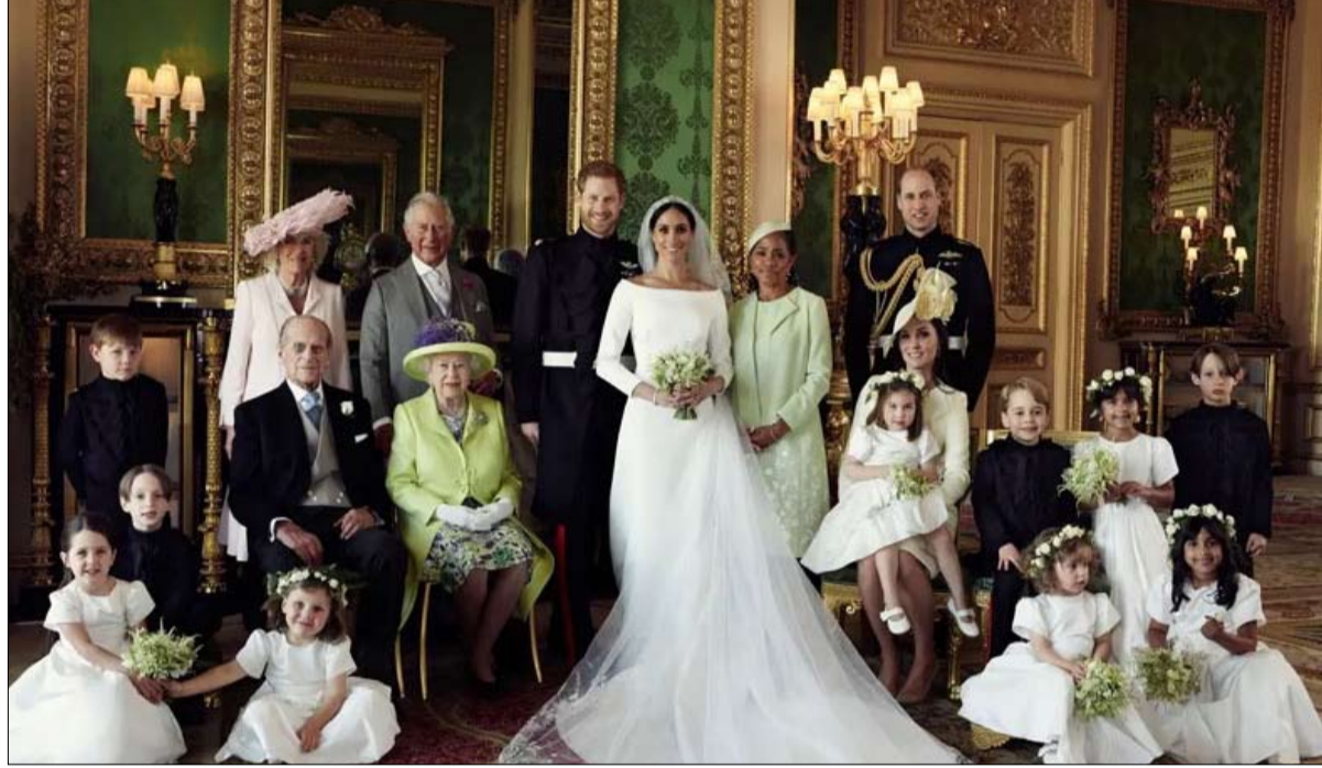
العائلة المالكة البريطانية تتصنع

1 - سابقة في تاريخ العائلة المالكة قدم في الداخل، وأخرى في الخارج، يرغب الأمير هاري وزوجته ميغان التحلي عن دور عضو مهم في العائلة المالكة، كما يخططان لتقسيم وقتهم بين المملكة المتحدة وأمريكا الشمالية. وهذا تشكيل جديد تماماً لأحد أفراد العائلة المالكة. ففي الماضي، لئن تخلى آخرون عن