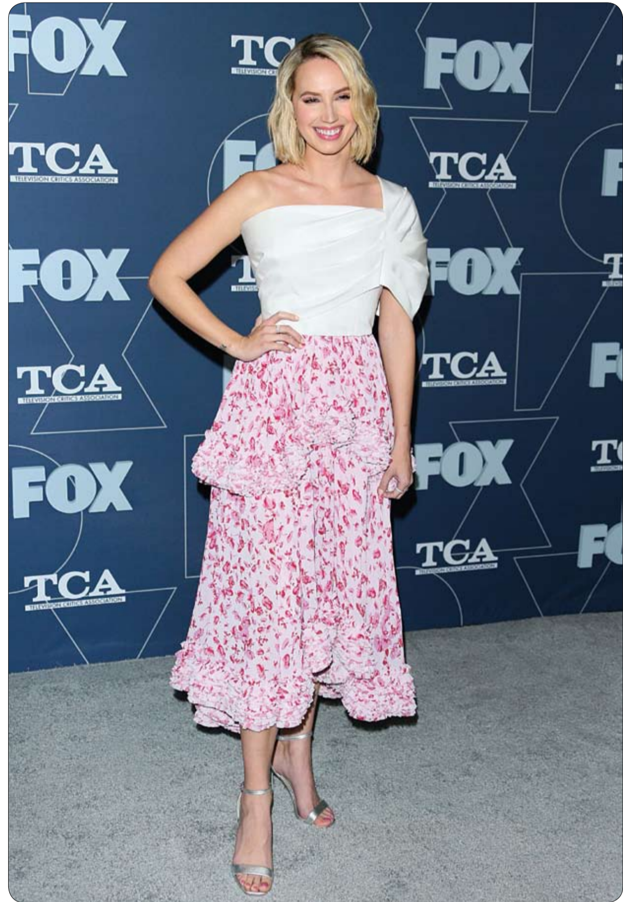
الممثلة مولي ماوكوك لدى وصولها لحضور حفل توزيع جوائز Fox Winter TCA 2020 All-Star Party في باسادينا، كاليفورنيا. ا ف ب

أظهرت نتائج دراسة جديدة نتائج مثيرة عن علاقة التدخين بالاكتئاب، وقالت إن السجائر تؤثر على الصحة النفسية إلى جانب أضرارها المعروفة والتي تسبب الجسم. ولقبت نتائج الدراسة التي نشرتها دورية "بلوس وان" الطبية الانتباه إلى أن التدخين يثير مشاعر وانفعالات سلبية، إلى جانب أنه يرفع مستوى الأوكسدة ويزيد السموم في الجسم والدماغ، وهو ما يشكل بيئة خصبة لأعراض الاكتئاب.