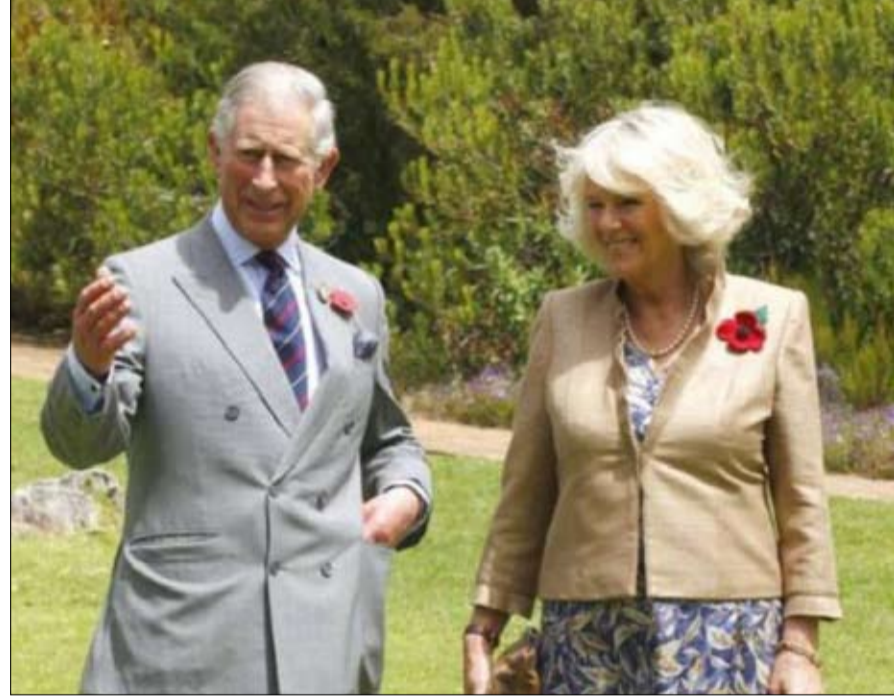
اي موقف للأمير تشارلز من خطوة هاري؟

استغلال النوايا الدبلوماسية الحسنة عند الغربيين. لقد كان سليمان رجل إيران الذي لا غنى عنه وفقا لريفرز، جندي وجاسوس بارز بلا رحمة بنى ومول وعذى شبكة رعب دولية للتعويض عن ضعف إيران العسكرية التقليدية. بعد جلاء غير الاغتيال، ستظل إيران ضعيفة من القوة العسكرية التقليدية لكن من دون مخططاتها الاستراتيجية الأقوى. غير أنها ستظل معتمدة على الإطار الاستراتيجي الذي بناه سليمان. مهزلة.. بالنسبة إلى التوقيت الذي تساهل عنه بعض المحللين في الإعلام، يشرح ريفرز أن قتله أتى في وقت رهيب بالنسبة إلى النظام. يلاحظ الباحث في مركز كارنيغي كريم ساجادبوير أن النظام يشن العديد من حروب الكوالة ويواجه اضطرابات شاملة في الداخل ويعاني اقتصاديا من حملة الضغط الأقصى. أما الادعاء الذي يقول إن قتل سليمان ساعد إيران عبر توحيد شعبها وتشجيت انتباهه عن هذه المسائل، فهذا ما تحاول السلطات الإيرانية جاهدة أن تظهره. لكن فكرة أنه كان محبوبا عالميا هي مهزلة. وبعد اغتيال سليمان، ستصبح الصراعات الشخصية والتوترات الدينية والاحتكاكات الإثنية بين ضمن وكلائه حملا أيضا على طهران. احتمالات الحرب الشاملة.. يرى ريفرز أن الحرب الشاملة غير محتملة