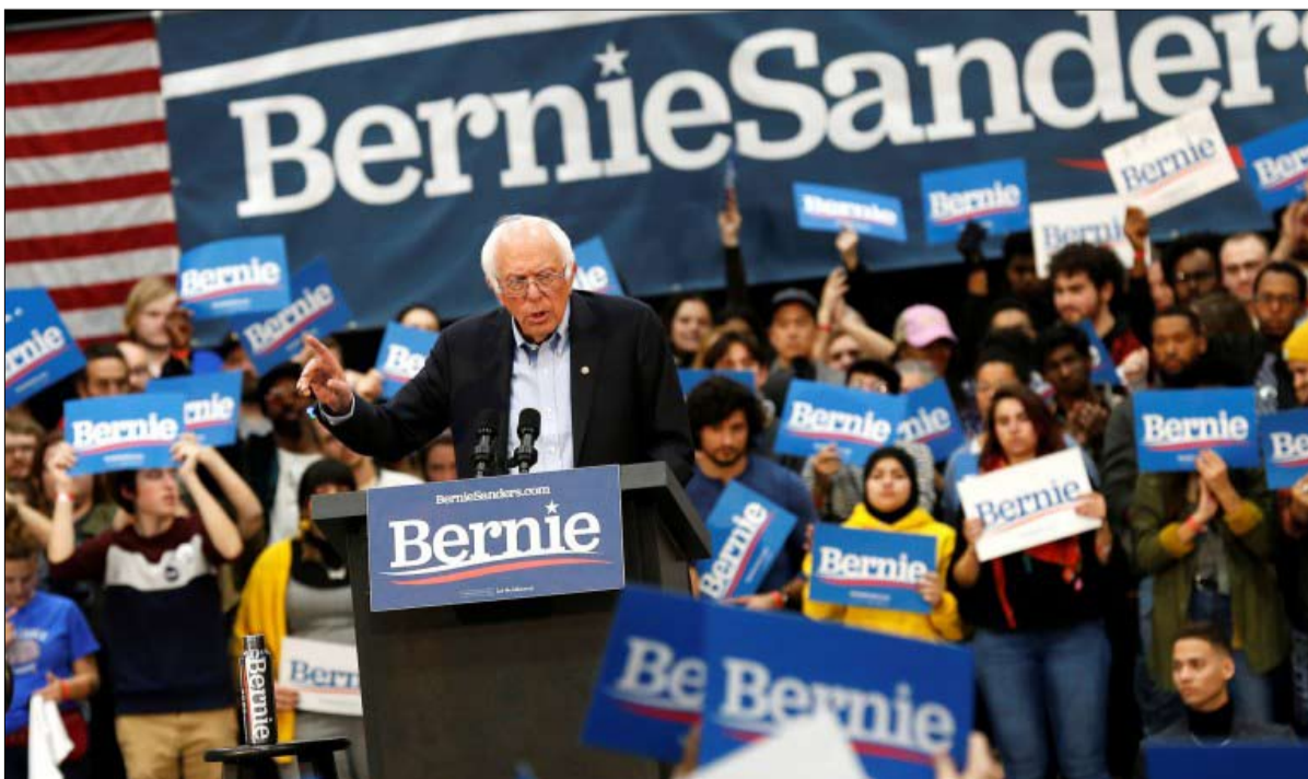
شعبية كبيرة في صفوف الشباب

يحتل ساندرز مركز الصدارة في أيوا ونيو هامبشاير، أول ولايتين تصوتان في مطلع فبراير