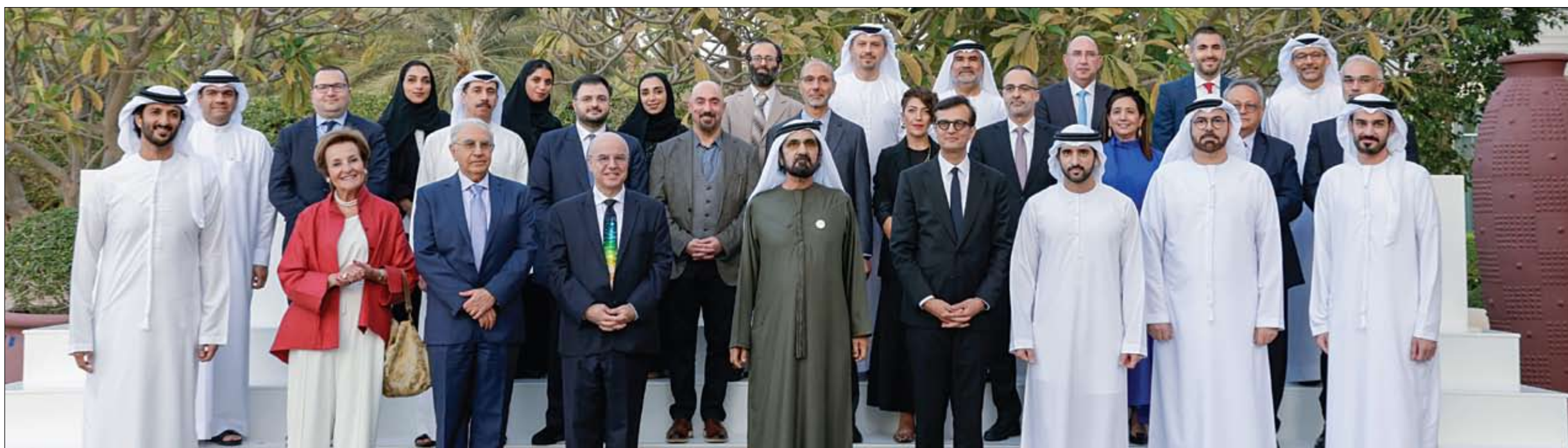
التقى رؤساء وأعضاء لجان «نوابغ العرب»