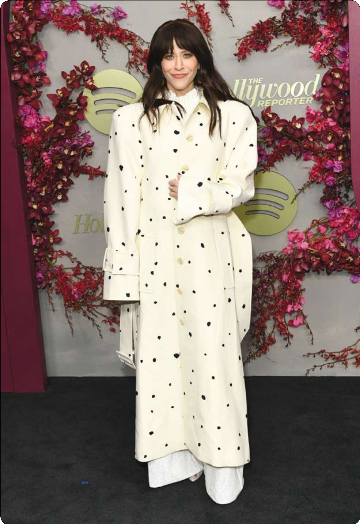
الممثلة الأمريكية جاكى تون لدى حضورها حفل توزيع جوائز غولدن غلوب في لوس أنجلوس.

توفيت كلوديت كولفن، الناشطة الأميركية السوداء التي رفضت عندما كانت تبلغ 15 عاماً التحلي عن مقعدها في حافلة في ألاباما لامرأة بيضاء، عن 86 عاماً، وفق ما أعلنت مؤسستها. وقالت مؤسستها إن كولفن "ترك وراها إرثاً من الشجاعة التي ساهمت في تغيير مسار التاريخ الأميركي". وكانت كولفن تدرس تاريخ السود في آذار-مارس 1955، عندما تم توقيفها بعدما رفضت التحلي عن مقعدها لامرأة بيضاء في حافلة في مونتغومري. وقالت كولفن لصحفيين في باريس في نيسان-أبريل 2023 "بقيت جالسة لأن السيدة كان بإمكانها أن تجلس في المقعد المقابل لقعدي" مضيفة "لكنها رفضت ذلك لأنه... ليس من المفترض أن تجلس شخص أبيض قرب زنجي".