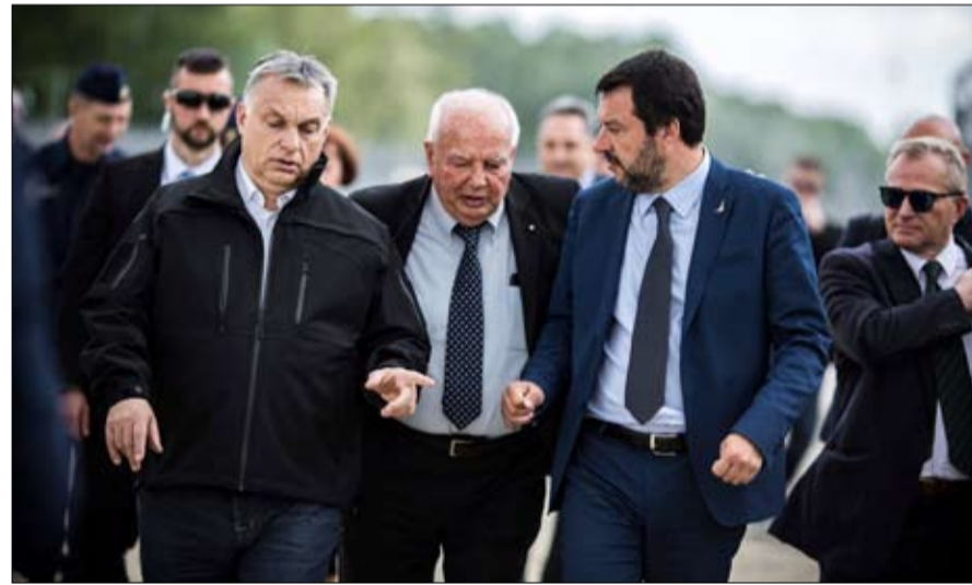
سالفيني وأوربان جبهة الازعاج الأوروبي

يتمثل الرهان في فهم مكانة أوروبا في عالم يتطور بشكل يختلف عن صورتها على الاتحاد الأوروبي القطع مع عدم التسييس إذا أراد مقعداً بين اللاعبين الدوليين الرئيسيين