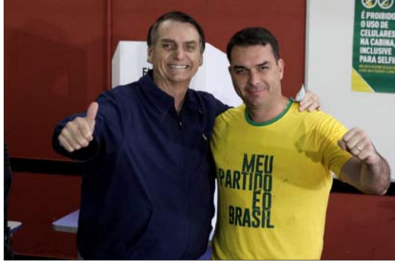
فلافيو بولسونارو وشبهات فساد