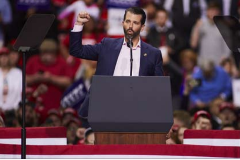
دونالد ترامب جونيور نسخة من ابيه