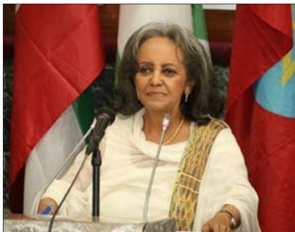
ساهر ورق زودي رئيسة إثيوبيا

وعقب احتجاجات مستمرة أطاح الجيش السوداني بالرئيس عمر البشير في 11 أبريل "نيسان" الماضي، ويعاني السودان من أزمة اقتصادية طاحنة، ويحتاج لذلك إلى مساعدة الخارج.