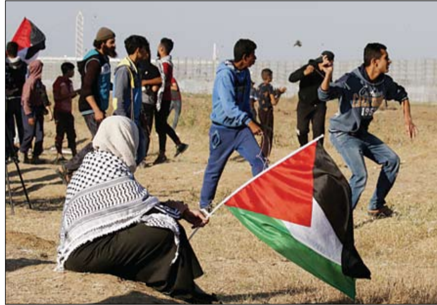
امرأة تحمل العلم الفلسطيني بينما يواجه الشبان قوات الاحتلال بالحجارة في غزة

وقمعت الاحتفال الإسرائيلي للمتظاهرين الفلسطينيين خلال مسيرات العودة شرقي قطاع غزة أمس مما أدى إلى إصابة 30 شخصاً بجراح مختلفة. وبحسب وزارة الصحة بغزة أصيب مسعف برصاص الاحتلال في الرأس أثناء تاديبته عمله الانساني شرق خان يونس. فب الوقت ذاته أدى حوالي مئة وثمانين ألف مصال الصلاة في المسجد الأقصى في الجمعة الأولى من شهر رمضان، وسط