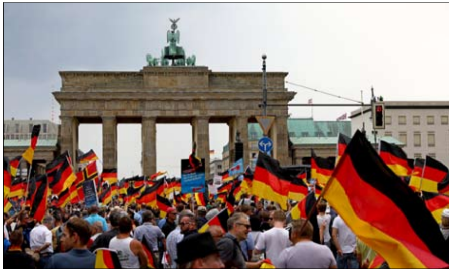
اليمن المتطرف يبعث في ألمانيا

يتمثل الرهان في تأكيد الشرح وتعميقه داخل أوروبا، وإنما في فهم مكانتها في عالم يتطور بشكل يختلف عن صورتها. ولتحقيق ذلك، يجب فعلاً توفير الحماية بشكل فعال ضد مختلف أشكال التدخل الخارجي دون أن ننسب إليه الاحتجاج الاجتماعي والانقسامات السياسية الحالية، التي هي نتاج أظلمتنا المفتوحة، وعملية تنسب للوزن الجيواقتصادي لأوروبا على الساحة الدولية. ويجب بالخصوص، أن نفهم أن الاتحاد الأوروبي، الذي بُنى على دولة القانون والإفراط في التنظيم، سيتعين عليه أن يقطع مع "عدم التسييس"، علامته التجارية، إذا أراد أن يكون قادراً على الوجود في وجه اللاعبين الدوليين الرئيسيين.