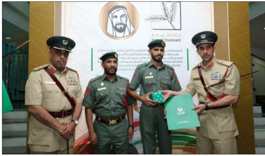
العنور عليها. وتقدم السائح بالشكر إلى شرطة دبي على سرعة الاستجابة لبلاغه وحرصهم على إيساعده باستعادة بجديته واهتمام كبيرين.

●● الشارقة-الفسج: بحضور عدد من الوزراء، وممثلي المؤسسات الثقافية، ونخبة من كبار المثقفين والناشرين العالميين، توجت إدارة معرض تورينو الدولي للكتاب 2019 إمارة الشارقة رسمياً ضيف شرف الدورة الـ 48 من المعرض الذي يقام خلال الفترة من خلال الفترة من 9 وحتى 13 مايو الجاري. جاء ذلك خلال حفل افتتاح المعرض الذي أقيم على أرض المعارض بمدينة تورينو وتحدث خلاله الشيخ فاهم القاسمي، رئيس دائرة العلاقات الحكومية، ورئيس وفد الإمارة المشارك في المعرض، بحضور سعادة ألبيرتو بونيسولي، وزير الثقافة الإيطالي، وسيرجيو شيمبارينو، رئيس إقليم بييمونتي، وكيارا أبيندينو، عمدة مدينة تورينو، وجوليو بينينو، رئيس معرض تورينو الدولي للكتاب، وعدد من الشخصيات الدبلوماسية وممثلي الهيئات والمؤسسات الثقافية. وضم وفد الشارقة الذي ترأسه الشيخ فاهم القاسمي، رئيس دائرة العلاقات الحكومية بالشارقة، رئيس وفد الإمارة المشارك في المعرض، كلاً من سعادة أحمد العامري، رئيس هيئة الشارقة للكتاب، وسعادة الدكتور حبيب الصايغ، الأمين العام للاتحاد العام للأدباء والكتاب العرب، رئيس مجلس إدارة اتحاد كتاب وأدباء الإمارات، وسعادة عبدالله العويس، رئيس دائرة الثقافة بالشارقة، وسعادة عبد العزيز المسلم، رئيس معهد الشارقة للتراث، وسعادة راشد الكوس، المدير التنفيذي لجمعية