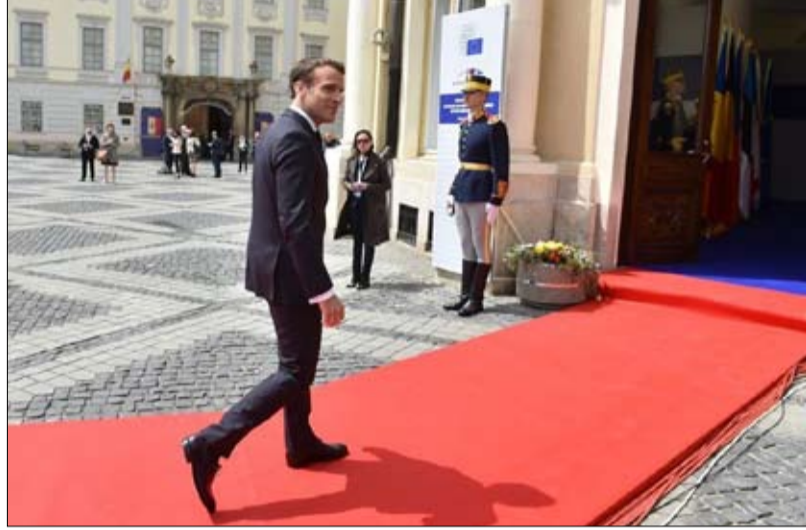
ماكرون وحواجز النهوض الأوروبي

جدي جداً" بعدما أطلقت بيونغ يانغ صاروخين بعد ساعات من وصول الوفد الأميركي إلى سيول. وقال ترامب لصحافيين "كانت صواريخ صغيرة، صواريخ قصيرة المدى. ما من أحد راضٍ عما حصل"، مضيفاً أن "العلاقة مع كوريا الشمالية" مستمرة وسنرى. أعلم أنهم يريدون التفاوض، يتحدثون عن التفاوض، لكنني لا أعتقد أنهم مستعدون للتفاوض". وقال الرئيس الكوري الجنوبي مون جاي-ان من جهته، إن التصرف الأخير لبيونغ يانغ ينطوي على "احتجاج وهو بمثابة ضغط لتوجيه المباحثات النووية في المنحى الذي تريده". وقال في مقابلة في الذكرى الثانية لتوحيه السلطة "يبدو أن الشمال مستاء بشدة من أن قمة هانوي انتهت بدون اتفاق". وأضاف "مهما كانت نوايا كوريا الشمالية، نحذر من أنها قد تجعل المفاوضات أكثر صعوبة". والتقى بيغون نظيره الكوري الجنوبي لي دو-هون إلى مائدة الفطور الخميس.