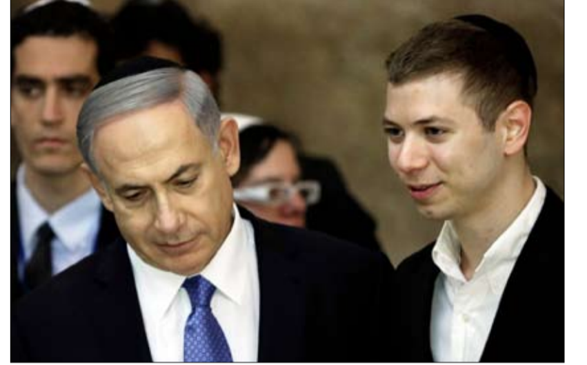
يائير ووالده الاناء بما فيه يرشح

على غرار زعيم المعارضة البريطانية، تومي كوربين ملتزم جداً بالقضية الفلسطينية يمارس أبناء الرئيس جاير بولسونارو سلطة موازية غير مسبقة في البرازيل