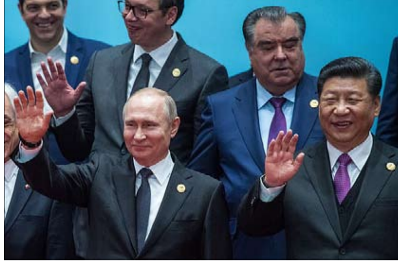
أوروبا خصومة مع بوتين وتزايد نفوذ الصين