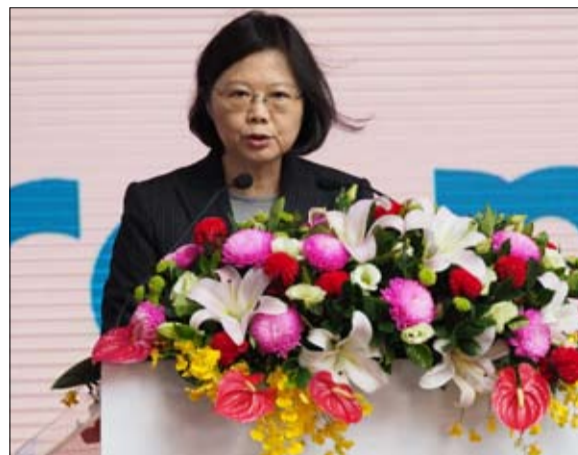
تساي انغ وين زعيمة تايوان