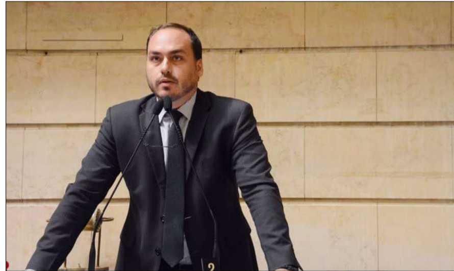
كارلوس الاطاحة برئيس الحكومة

غير ان كارلوس ليس الابن الوحيد للرئيس الذي يثير الجدل حوله. لكن تم اجبار السناتور فلافيو، 37 عاماً، على الانحياز للمعارضة بسبب معاملات مشبوهة سمّت بداية الولاية الرئاسية، فإن إدواردو، الابن الثالث، 34 عاماً، ناشط أيضاً على وسائل التواصل الاجتماعي. وفي الأونة الأخيرة، أشار جدلا حول إطلاق سراح لولا الذي سُمح له بالشاركة في جنازة ضحيته: