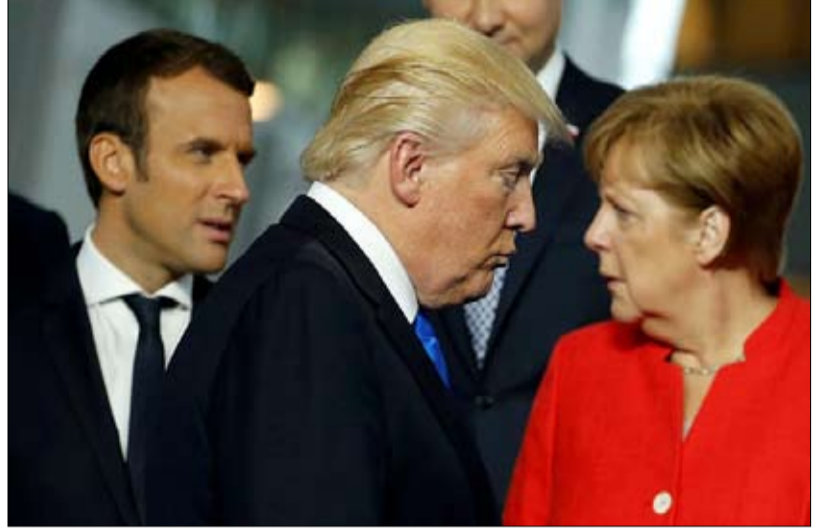
ساعات علاقة أوروبا بأمريكا