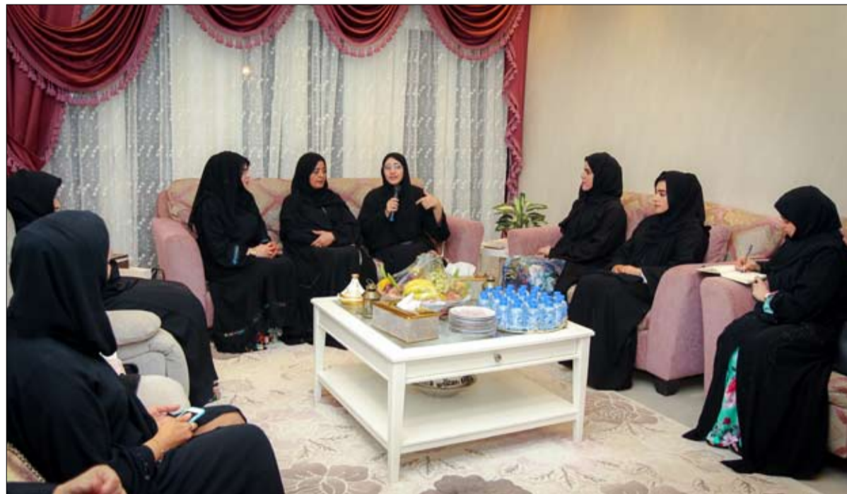
ناقش المجلس موضوع «الابتزاز الإلكتروني» وجهود شرطة أبوظبي في التعامل الأمني مع قضايا الابتزاز الإلكتروني، والتصدي للجريمة حيث تشكل هذه الجرائم خطراً يورق المجتمع وأجمعت المشاركات والحاضرات الدولي والمحلي على حد سواء.