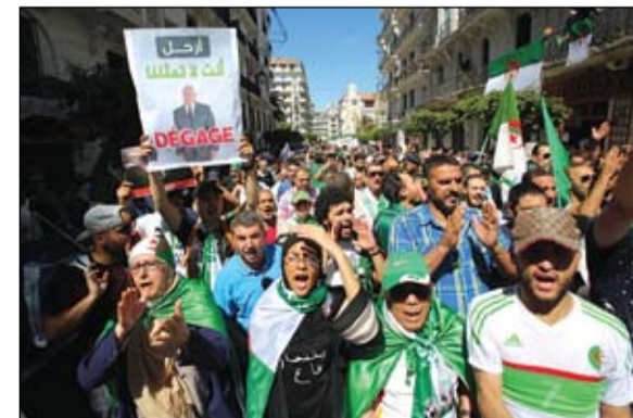
مظاهرات حاشدة في الجزائر العاصمة ضد رموز النظام السابق

وذلك بعد تخليه عن الرئيس السابق عبد العزيز بوتفليقة ما دفعه للاستقالة بعد عشرين عاماً في الحكم. غير أنه كان يوم أمس كما يوم الجمعة الماضي موضع استهداف بشكل خاص من المتظاهرين الذين هتفوا بالجمهورية ماهيس (ليست ثكنة، والجيش الرابع من تموز يوليو.