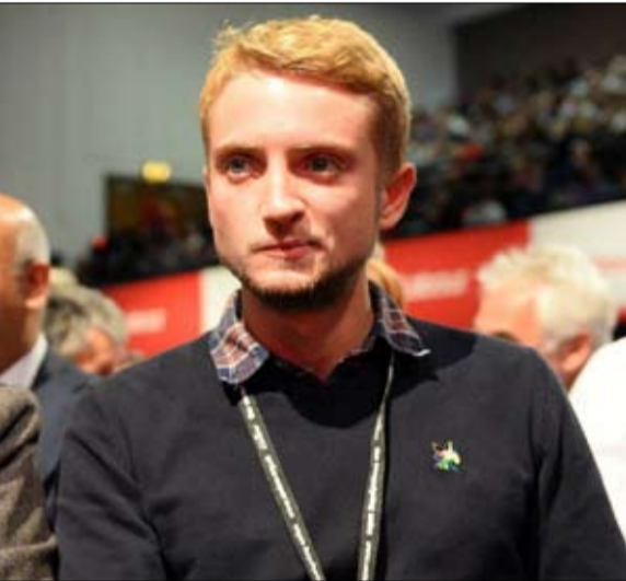
تومي كوربين نصير للقضية الفلسطينية

يمينا أكثر من والده، يعبر يائير نتنياهو عن آرائه على الشبكات الاجتماعية بدون فلتر - يستخدم دونالد ترامب جونيور الشبكات الاجتماعية لاستفزاز خصومه ومهاجمة وسائل الإعلام