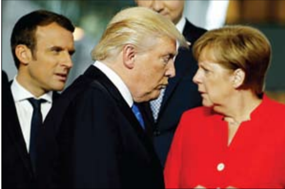
ساعات علاقة أوروبا بامريكا

ذكر الإعلام الرسمي في كوريا الشمالية، أمس الجمعة، أن الزعيم كيم جونج أون أمر الجيش بتعزيز قدراته الضاربة، ووجه بإطلاق صواريخ جديدة، في ظل تنامي التوترات بسبب الاختبارات الصاروخية التي تظهر على ما يبدو تجهيزات نظام صاروخي متطور جديد. وجاءت أمراً دعوة كيم إلى «تأهب قتالي كامل» في أعقاب إعلان الولايات المتحدة أنها احتجزت سفينة شحن تابعة لكوريا الشمالية لأنها تنقل الفحم بصورة غير قانونية. ويأتي تصاعد التوتر في ظل تعثر المحادثات بعدما انهارت القمة الثانية بين كيم والرئيس الأمريكي دونالد ترامب بسبب المطالب الأمريكية بنزع السلاح النووي لبيونغ يانغ ومطالب كيم بتخفيف العقوبات. وقالت وكالة الأنباء المركزية الكورية، شدد (كيم) على ضرورة تعزيز قدرات وحدات الدفاع في منطقة الجبهة، وعند الجبهة الغربية، لتنفيذ مهام قتالية والبقاء في حالة تأهب قتالي كامل لمواجهة أي وضع طارئ».