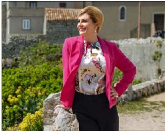
كوليندا غرابريكيتاروفيتش الكرواتية

لئن تحتل الرئيسات الخوطوط الأمامية، فإن هذه الصور النمطية الجنسانية تطال جميع من يتم انتخابهن في البرلمان أو المجالس البلدية وغيرها من الهيئات أي جميع الناشطات سياسياً. إلى جانب نزغ الشرعية عنهن مؤسساتياً، فإن النساء السياسيات يصارعن باستمرار ضد التمييز العادي، من الشكائم الجنسية التي تلحقها حتى في الساحات الديمقراطية، إلى نقد الصوت أو أسلوب اللباس، مروراً بالاستخدام الطفولي لأسماهن. عن سليت الفرنسية