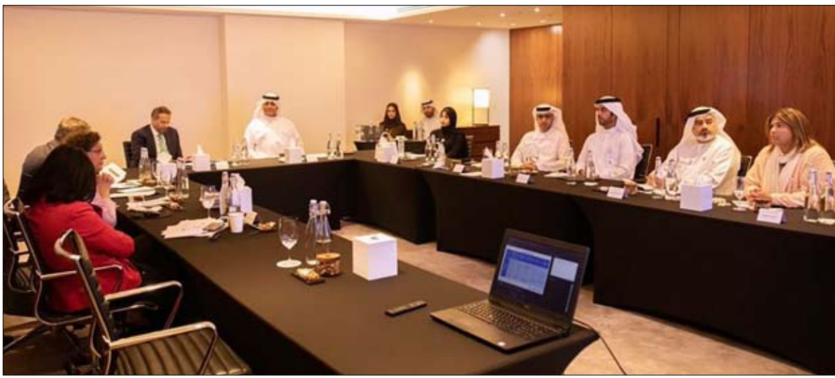
معمها. كما تتضمن برنامج الخلوّة التنظيمية زيارة وفد مكتب مفوضية الأمم المتحدة السامية لحقوق الإنسان للمقر الرئيسي والاطلاع على جهود تجهيز المبنى والمرافق المختلفة.

•• أبو ظبي-وام: عقدت الهيئة الوطنية لحقوق الإنسان الخلوّة التنظيمية الأولى مع مكتب مفوضية الأمم المتحدة السامية لحقوق الإنسان خلال الفترة من 9 إلى 11 أكتوبر 2022م في العاصمة أبوظبي، وذلك في إطار التعاون المشترك وبناء القدرات في المجالات المختلفة لحقوق الإنسان. وتناولت الخلوّة التنظيمية على مدار ثلاثة أيام الرؤى الاستراتيجية للعمل الحقوقي وفق مبادئ باريس، والتعرف على النظام الدولي لحقوق الإنسان وآليات عمله وما يصدر عن آلياته من توصيات وملاحظات ختامية، وكذلك التعرف على أهم الممارسات الحقوقية الفضلى من خلال الآليات الوطنية والإقليمية وفق المعايير الدولية لحقوق الإنسان. وتناولت جلسات اليوم الأول الآليات والأدوات المتعلقة بالنظام الدولي لحقوق الإنسان، وآليات تنفيذ مبادئ باريس في عمل المؤسسات الوطنية لحقوق الإنسان، والتعرف على التحالف العالمي للمؤسسات الوطنية لحقوق الإنسان والشبكات الإقليمية ذات الصلة واللجنة الفرعية للإعتماد. كما تناولت جلسات اليوم الثاني الأنشطة الأساسية والبرامج والتعاون الدولي لحقوق الإنسان.