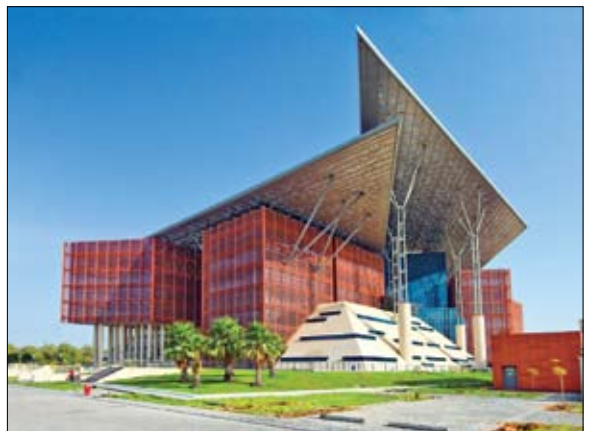
المرسوم، صدر قرار رئيس دائرة القضاء رقم 6 لسنة 2019 بشأن الخبراء الأجانب في المحاكم.

أنجزت مبادرة "مليار وجبة"، الحملة الأكبر في المنطقة لتوفير الدعم الغذائي في 50 دولة ضمن أربع قارات، توزيع أكثر من 2.5 مليون وجبة في سبع دول آسيوية بالتعاون مع مؤسسة محمد بن راشد آل مكتوم للأعمال الخيرية والإنسانية التي تولت عمليات التوزيع والتنسيق مع الجمعيات الخيرية في الدول المشمولة. ووفرت مبادرة "مليار وجبة" التي تنظمها مبادرات محمد بن راشد آل مكتوم العالمية، الدعم الغذائي للأفراد والأسر المتعففة في عدد من مدن وآسر الهند، وباكستان، وطاجيكستان، وقرغيزستان، وكازاخستان، والفلبين، وكمبوديا بصيغة طرود غذائية وتمويينية تحتوي على المواد الغذائية الأساسية المطلوبة لإعداد وجبات مغذية لأسابيع عدة يستفيد منها حوالي 75.000 شخص. وفيما وزعت مبادرة "مليار وجبة" 1.537.500 وجبة في مختلف مدن وقرى وأرياف الهند، جرى توزيع 800.000 وجبة بالتساوي بين أربع دول، وواقع 200.000 وجبة لكل دولة، وشملت باكستان؛ في مناطق كشمير، وياغ، وجرب دوتيه،