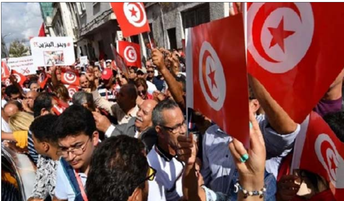
مسيرة الدستوري الحر

تونس أفريقيا للأنباء أن منع المتظاهرين على مستوى نهج غانا من التقدم في اتجاه شارع الحبيب بورقيبة بالعاصمة تم بناء على استشارة للنيابة العمومية التي أسدت تعليماتها بالزمهم بالمسار المرخص فيه. وأكد قائلا «بعد استشارة النيابة العمومية وإعلامها بمحاولة المتظاهرين المتواجدين على مستوى نهج غانا، التقدم نحو شارع الحبيب بورقيبة، أسدت تعليماتها بعدم السماح لهم بالمروء والالتزام بالمسار المرخص لهم فيه»، وشدد على أنه قد تم تأمين المتظاهرين في ظروف عادية. يشار إلى أن آلاف من أنصار قوتين متنافستين من المعارضة التونسية، الدستوري الحر وما يسمى بجبهة الخلاص، واحدة من أكبر الاحتجاجات حتى الآن ضد الرئيس سعيد، السبت 15 أكتوبر، ندوا فيها بتحركاته لتعزيز سلطته السياسية في ظل تصاعد الغضب الشعبي بسبب نقص الوقود والغذاء.