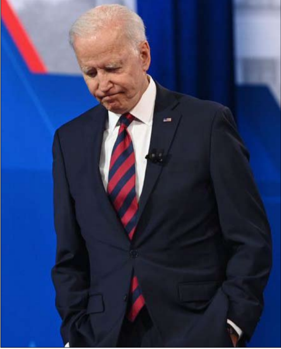
بايدن أخطأ العنوان

آخر في هذا المنطق. من الممكن أن يزعم الأمريكيون، في استطلاعات الرأي، أنهم يفضلون سياسة خارجية لصالح المصالح الوطنية وتساعد على تحسين مستوى معيشتهم، لكنهم يميلون إلى الحكم على قادتهم بقسوة إذا أساءت أفعالهم للبلاد بشكل كبير، أو فشلت في توفير الحماية المناسبة لهم. واتضح أن ما هو مطلوب لتفادي كل هذه المزالق، هو بالضبط ما يعتبره العديد من الناخبين بعيداً تماماً عن الدفاع عن مصالحهم المباشرة. هذا لا يعني أن على القادة الأمريكيين تجاهل الرأي العام أو الانخراط في مغامرة عسكرية مثل تلك التي أضغمت موقف البلاد في العقود الأخيرة.