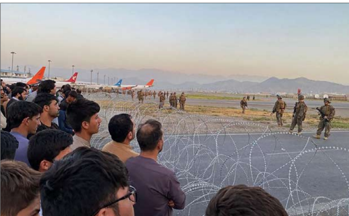
هزيمة امريكية اخلاقية