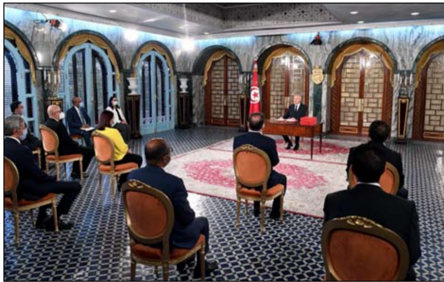
سعيد يواصل الهجوم

الرأي العام باعتبار أنها ملفات تستهدف أمن البلاد وأمن رئيس الجمهورية.