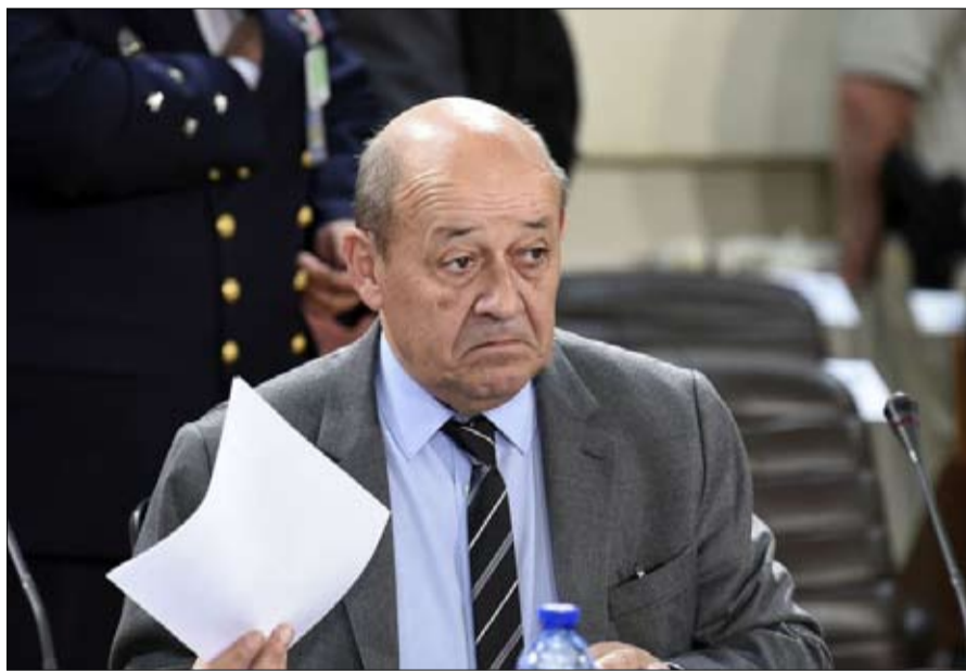
وضع جان إيف لودريان شروط الإبقاء على التمثيل الدبلوماسي الفرنسي

- أرصدة البنك المركزي التي تمتلكها الحكومة الأفغانية في الولايات المتحدة لن تتاح لطالبان