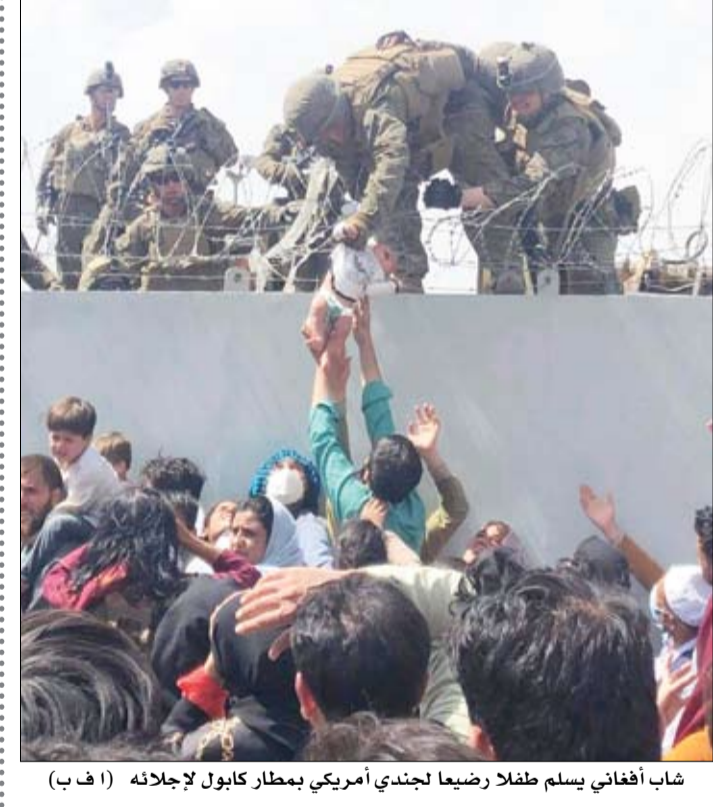
شاب أفغاني يسلم طفلا رضيعا لجندي أمريكي بمطار كابول لإجلائه

عواصم-وكالات: فيما تعيش أفغانستان حالة من الفوضى بعد سيطرة حركة طالبان على معظم أرجاء البلاد ومحاوله فرار الآلاف عبر رحلات الإجلاء، اجتمع رئيس البلاد السابق حامد كرزاي، ورئيس المجلس الأعلى للمصالحة الوطنية الأفغانية عبدالله عبدالله، مع القائم بأعمال حاكم كابل المعين من حركة طالبان لبحث الأمن في العاصمة. وقال مكتب رئيس المصالحة الوطنية في بيان، إن الاجتماع كان مع عبد الرحمن منصور، وناقشا أولوية حماية أرواح وممتلكات وكرامة الأفغان في كابل. هذا وقالت أورسولا فون دير لاين رئيسة المفوضية الأوروبية السبت إن الاتحاد الأوروبي لم يعترف بحركة طالبان ولا يجري محادثات سياسية معها وذلك بعد أسبوع من سيطرة طالبان على أفغانستان. وأكدت حركة طالبان سيطرتها السريعة على أفغانستان يوم الأحد ودخلت العاصمة كابول دون إطلاق رصاصة واحدة. وأدلت رئيسة النزاع التفاوضية للاتحاد بالتصريحات بعد زيارتها مركز استقبال في مدريد لموظفين أفغان لدى مؤسسات تابعة