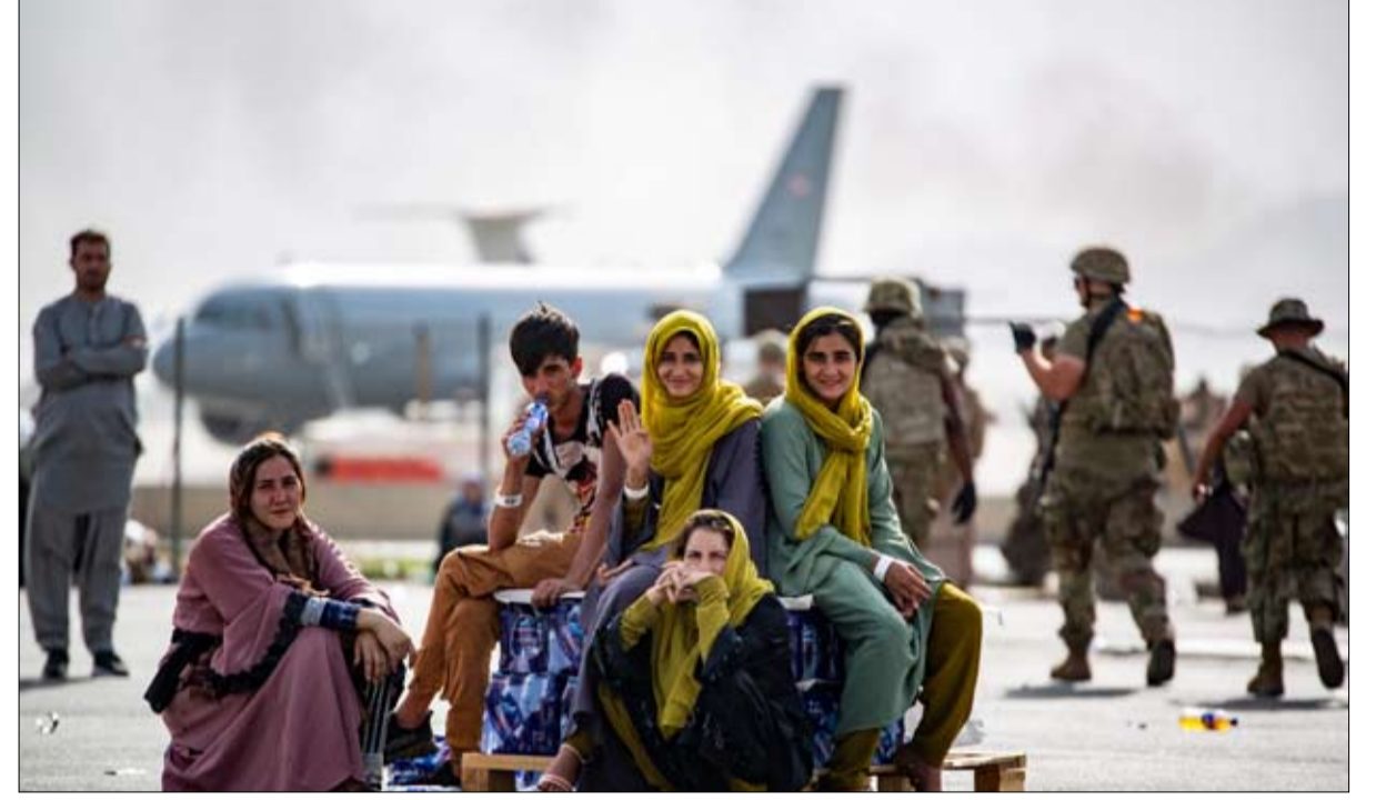
كارثة تستجلب في تاريخ بايدين

هناك مظاهرات ضد ارتداء الكمامات في المدارس أكثر من المظاهرات ضد التخلي عن كابول القضايا الدولية في الولايات المتحدة، سرعان ما تترك مكانها للمخاوف المحلية