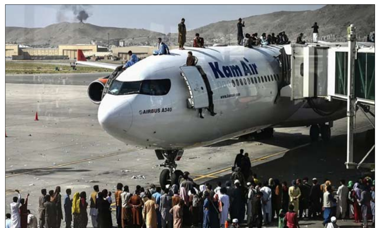
كارثة بكل المقاييس