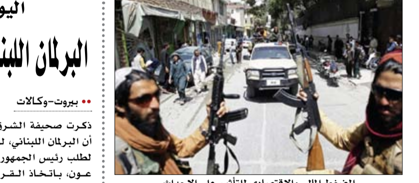
الضغط المالي والاقتصادي للتأثير على الأحداث

البرلمان اللبناني يطالب عون بتشكيل الحكومة قبل أي قرارات بيروت-وكالات: ذكرت صحيفة الشرق الأوسط أن البرلمان اللبناني، لم يستجب لطلب رئيس الجمهورية ميشال عون، باتخاذ القرار المناسب على خلفية رفع الدعم عن المحروقات، بل تحدها بالرد على رسالته بمطالبتها بتشكيل حكومة جديدة، والإسراع بتوزيع البطاقة التمويلية وتحرير السوق من الاحتكار. وأكدت الصحيفة بحسب مصادر تحدثت لها أن ثمة اتجاه لدى البرلمان نبيه بري لتحريك قريبا لمواجهة موضوع الوكالات الحصرية، بعد كلامه أمس عن كسر الاحتكارات. وقالت مصادر نيابية إن تحركاً ما قد يحصل قريباً سيأخذ طابعاً تشريعياً لمعالجة موضوع الوكالات الحصرية المعطاة للشركات فيما خص الدواء والنفط وغيرهما. وتعترت الجولة الـ12 من مباحثات تشكيل الحكومة اللبنانية إثر رد البرلمان الذي عون، حيث لم يُعقد اللقاء الذي كان مقرراً أمس، حسب ما أعلنت الرئاسة اللبنانية، مع الرئيس المكلف تشكيل الحكومة. هذا وحذرت منظمة الأمم المتحدة للطفولة والأمومة اليونيسف من حدوث نقص حاد في المياه خلال الأيام المقبلة في لبنان، مما سيفاقم من الأزمات الحادة التي تعاني من البلاد. وقالت اليونيسف في بيان، السبت، ما لم يتم اتخاذ إجراءات عاجلة، سيواجه أكثر من أربعة ملايين شخص في جميع أنحاء لبنان، معظمهم من الأطفال والعائلات الأكثر هشاشة، احتمال تعرضهم لنقص حاد في المياه أو انقطاعها التام عن إمدادات المياه للصحة لشرب في الأيام المقبلة. وتابعت: في الشهر الماضي، حذرت