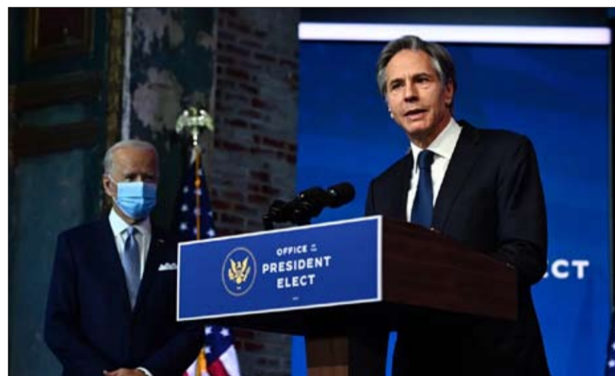
مقاربة دبلوماسية اثبتت فشلها

استاذ العلوم السياسية في جامعة جونز هوبكنز في بالتيمور. من مؤلفاته كتاب "الشعب ضد الديمقراطية،