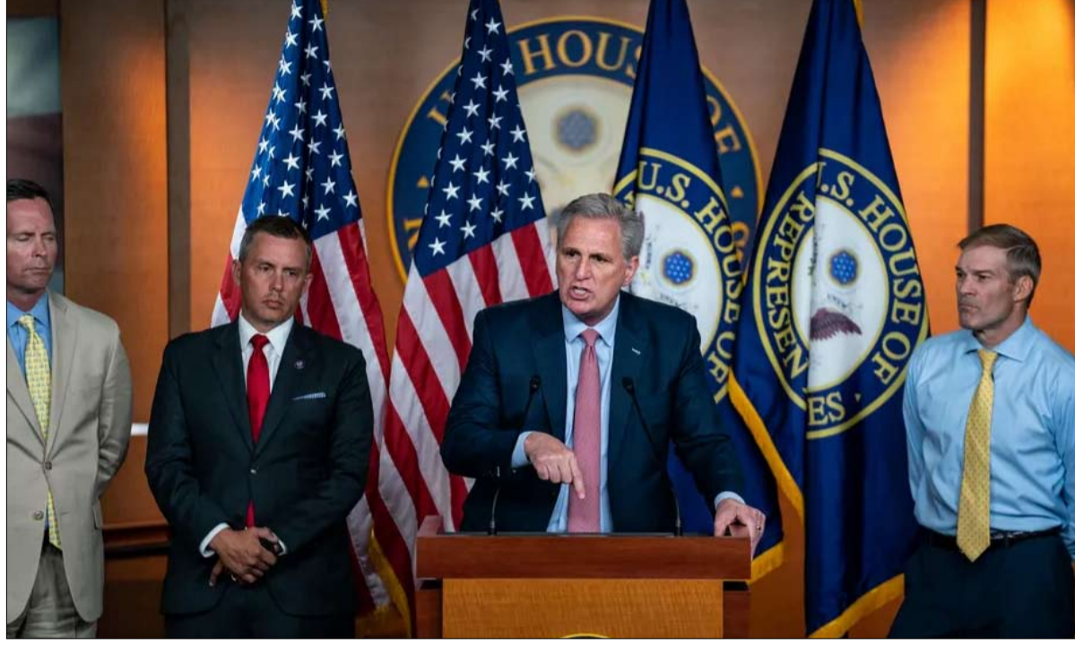
كيفن مكارش. الجمهوريون في هجوم كاسح