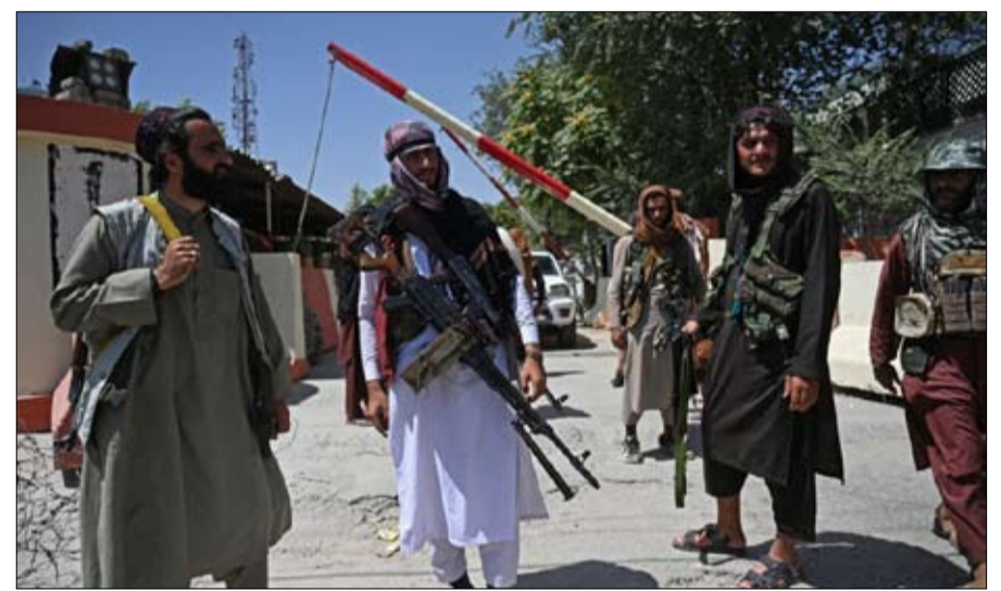
في المجلة طالبان والندامة

أبعد ما تكون عن كونها مجرد شعار، فإن فكرة "السياسة الخارجية للطبقة الوسطى"، شكلت بعمق السياسة الخارجية التي اتبعتها جو بايدن خلال الأشهر السبعة الأولى من رئاسته، وأدت إلى النجاحات الدولية الأولى لإدارته، مثل سلسلة الاتفاقيات التي تضمنت حذاً أدنى لعدل الضريبة للشركات العالمية الكبرى، وتفسر بعض الإجراءات التي قد تبدو مربكة، مثل محاولات الإدارة الأخيرة دفع أوبك لزيادة حصصها من إنتاج النفط. نعم، إنها تفسر أيضاً، تصميم بايدن على الخروج من