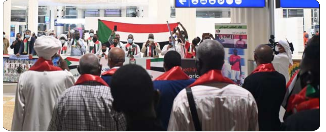
بعثة منتخب السودان تصل إلى أرض الدولة