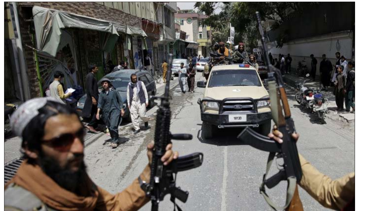
الضغط المالي والاقتصادي للتأثير على الأحداث

وكان لصور ظهر فيها يضحك خلف الرئيس فرانك فالتر شتاينماير وسط فيضان، تأثير كارثي على رجل لم يلق يوماً إجماعاً في حزبه السياسي.