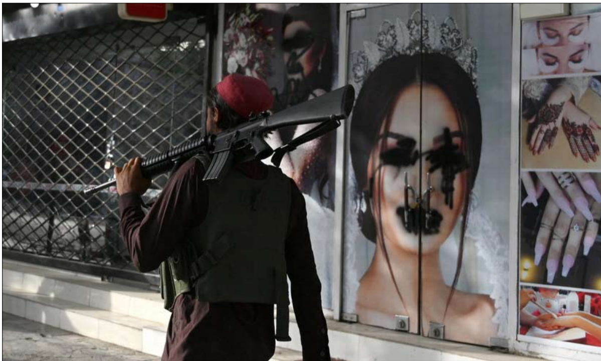
حقوق المرأة مطلب غربي أساسي

بالضرورة إلى المال لكي تحكم". عام 2020، بلغ الناتج المحلي الإجمالي لأفغانستان 19.81 مليار دولار بينما شكلت تدفقات المساعدات 42 فاصل 9 بالمائة من الناتج المحلي الإجمالي، وفقاً لبيانات البنك الدولي. وفي الساعات الأخيرة، جمّدت عدة دول المدفوعات فعلاً؛ أعلنت ألمانيا، وهي إحدى أكبر عشرة مانحين لأفغانستان، تعليق مساعداتها التنموية. وكان