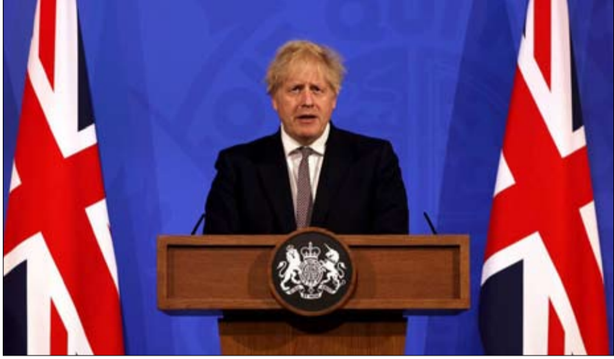
بوريس جونسون.. قمة السبع لاتخاذ موقف

وكانت الخطة المبدئية تقضي "بمواصلة بعثتنا الدبلوماسية في كابول بفريق صغير" لكنها تغيرت بسبب "تطور جديد" لم تحدده. وجمعت الفوضى مطار كابول في الأيام الأخيرة مع محاولة آلاف الأفغان الذين كانوا يحاولون باستماتة الفرار في الوقت الذي كان يسعى فيه أيضاً أشخاص من دول أخرى إلى المغادرة بعد انسحاب القوات الأمريكية والأجنبية الأخرى.