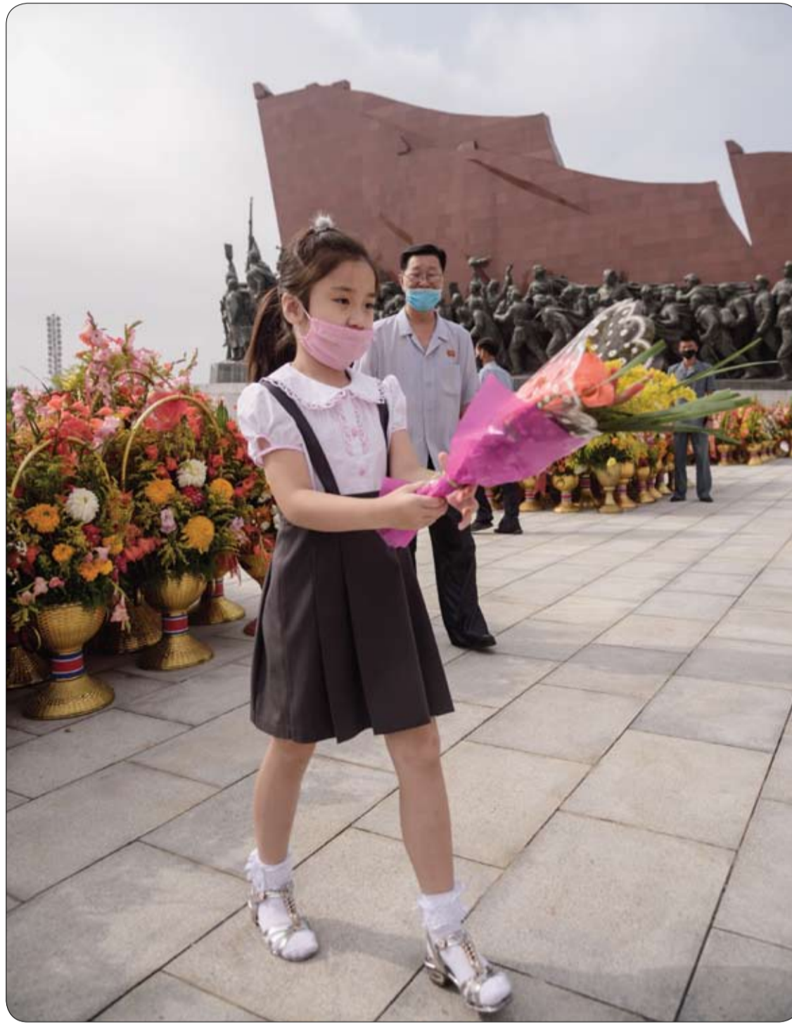
طفلة ترتدي قناع الوجه وتضع إكليلاً من الزهور أمام نصب الزعيم الكوري الشمالي الراحل كيم ايل سونغ وكيم جونغ ايل بمناسبة الذكرى 26 لوفاة كيم ايل سونغ، في بيونغ يانغ. (ا ف ب)

يمكن الاستفادة من كل ركن داخل غرفة النوم، مثلاً تخزين الملابس أو الأحذية أسفل السرير داخل إحدى الصناديق أو الأدراج أو حتى أكياس التخزين.