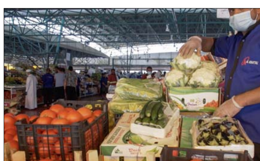
سوق أبوظبي للأوراق المالية يعزز خدماته الرقمية

سرعة الإنجاز في تقديم الخدمات من المزايا الأساسية التي توفرها الإمارة لهذا القطاع الحيوي. وتوزعت الرخص البالغ عددها 2,495 رخصة حسب المناطق الرئيسية في إمارة دبي، وكانت حصة الأسد لمنطقة بر دبي بإجمالي 1,522 رخصة، ومن ثم منطقة ديرة بـمجموع 961 رخصة، ومنطقة حتا بواقع 12 رخصة تجارية. وأوضح التقرير أن توزيع الرخص لأعلى عشر مناطق فرعية كان كالآتي: راس الخور الصناعية الثالثة، راس الخور، القرمود، بور سعيد، راس الخور الصناعية الثانية، الراس، المر، المركز التجاري الأول، الكرامة، وهو العنز