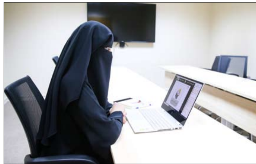
بمشاركة مؤسسات القطاع الخاص في الإمارة

يصل حجم سوق التجارة الإلكترونية في دولة الإمارات إلى 8.6 مليار دولار بحلول العام 2023. وشملت الجلسة الثانية من المنصة مناقشة كافة الأفكار والمقترحات التي قدمها المشاركين للخروج بتوصيات فعالة لتتنوع آليات دعم الأعمال التقليدية للتغلب على خطر الخروج من السوق، ومنها أهمية التوعية لأصحاب المشاريع والمستهلكين حول الاستفادة من التجارة الإلكترونية عبر سلسلة من الدورات وورش العمل الموجهة، وضرورة جذب منصات تجارة إلكترونية متخصصة للإمارة وأهمية وجود منصات مدعومة من الجهات الحكومية.