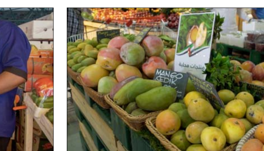
سوق أبوظبي للأوراق المالية يعزز خدماته الرقمية