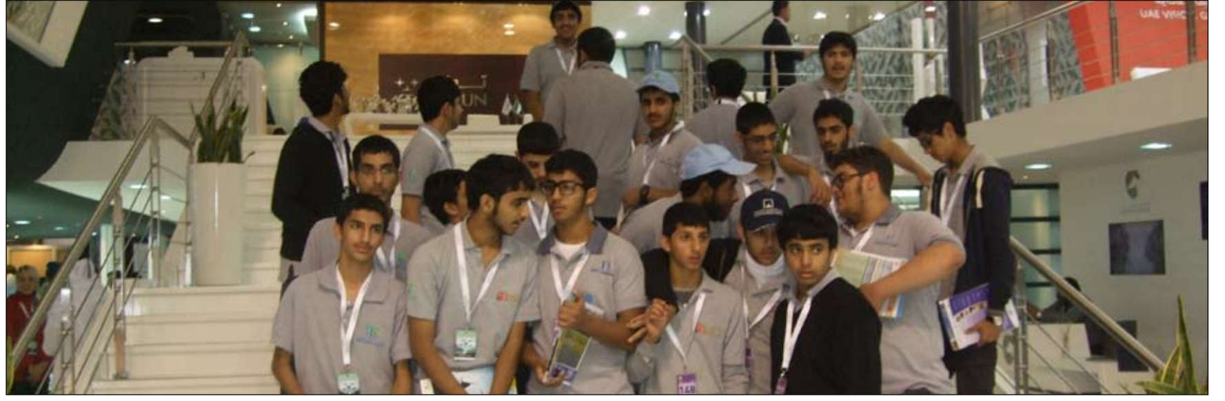
ومضات منيرة لإماراتنا الحبيبة