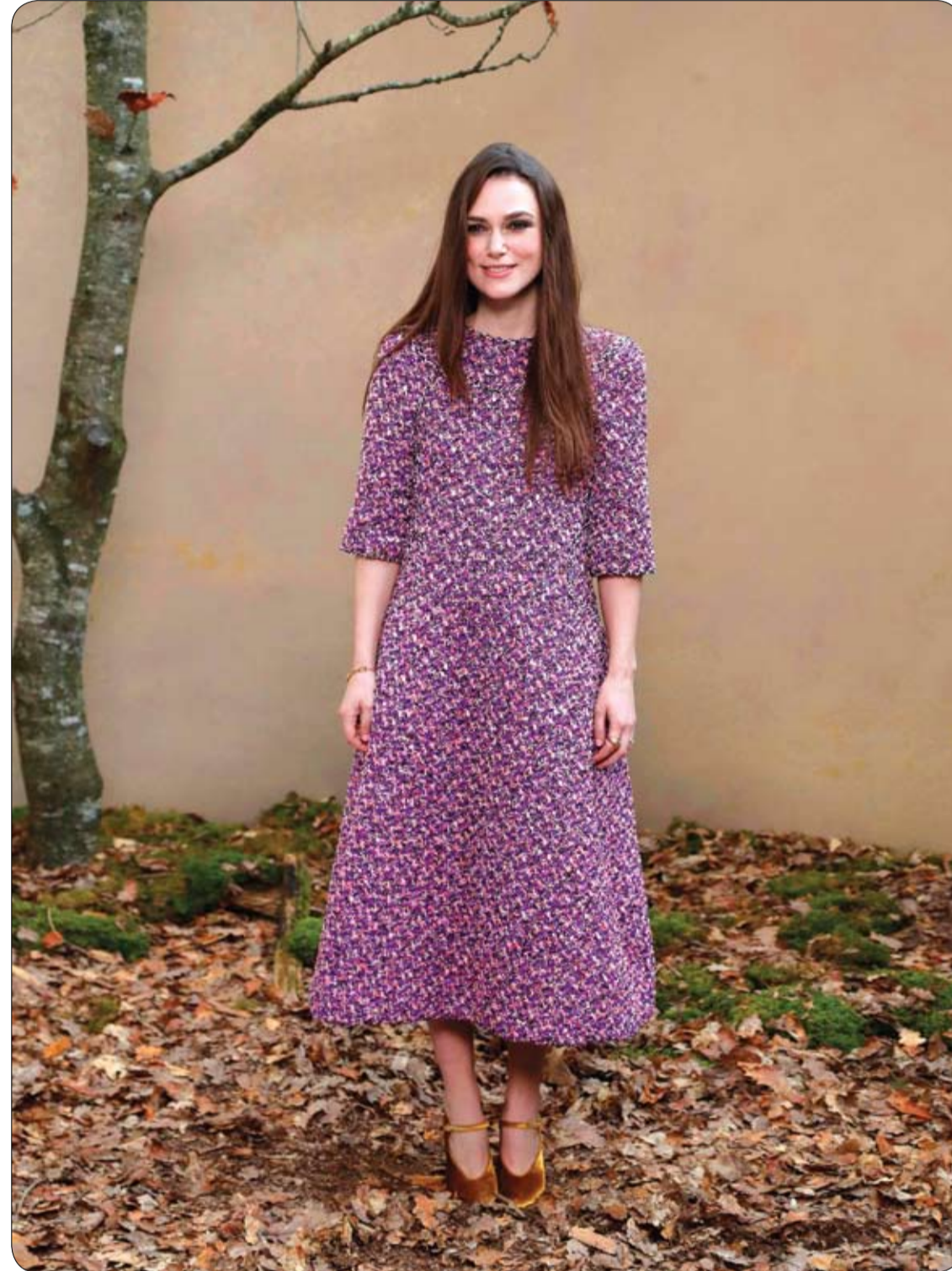
الممثلة البريطانية كيرا نايتلي تقف أمام عدسات المصورين قبل عرض أزياء شال لشتاء 2018-2019 في باريس.

استهلاك المشروبات الغازية بشكل يومي قد يرفع نسبة الإصابة بالسرطان، بحسب دراسة حديثة أجرتها جامعة ميلبورن الأسترالية. ونشرت محطة "تاين نيوز" الأسترالية الدراسة التي عاينت 3 آلاف حالة، ووجدت علاقة بين تناول مشروب غازي يومياً واحتمالية الإصابة بالسرطان. ووجد الباحثون أنه خلافاً لما هو متعارف عليه بأن المشروبات الغازية تساهم في السمنة التي بدورها قد تؤدي إلى الإصابة بالسرطان، فإن دور المشروبات الغازية بزيادة احتمالية الإصابة بالسرطان، غير متعلق بالسمنة. لكن الدراسة أظهرت أن المشروبات الغازية قليلة السكر، مثل كوكاكولا لايت أو بيبسي ديت، لم تظهر نفس الأعراض للإصابة بالسرطان. وتوصل الباحثون عبر دراسة حالات المصابين بسرطان الصدر والكبد والبروستات في فترتين بالتسعينيات والألفية الجديدة، لعلاقة مباشرة بين تناول المشروبات الغازية وهذه الأنواع من السرطان. ورجح أطباء مشرفون على الدراسة، أن يكون للتركيبات السكرية في المشروبات تأثير على الإصابة بالمرض الخبيث.