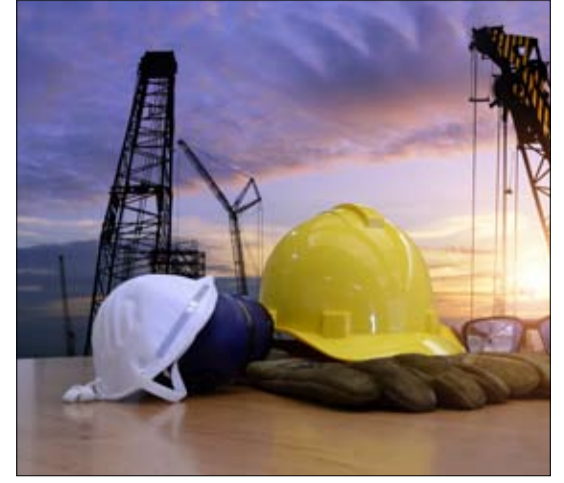
•• أبوظبي - الضجر:

احتفت بلدية مدينة أبوظبي ممثلة بإدارة البيئة والصحة والسلامة باليوم العالمي للصحة والسلامة المهنية، من خلال حرصها على تعزيز الوعي وترسيخ قيم المسؤولية، والحث على اتخاذ كافة الإجراءات الوقائية التي تضمن سلامة جميع العاملين في المواقع الإنشائية، حيث عبرت إدارة البيئة والصحة والسلامة عن تفاعلها مع هذه المناسبة العالمية من خلال تنظيم ورشة عمل توعوية في أحد المواقع الإنشائية بأبوظبي. وتأتي هذه الفعالية تأكيداً لحرص بلدية مدينة أبوظبي على تطبيق أفضل الممارسات العالمية في المواقع الإنشائية من حيث تنفيذ القوانين