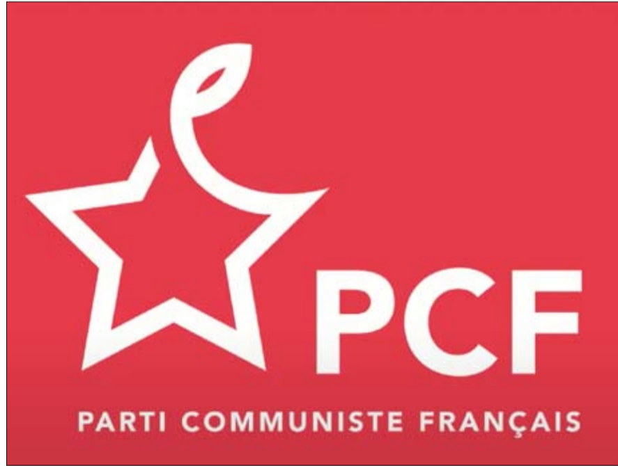
الشعار الجديد للحزب

يريد زعيم الحزب الشيوعي الفرنسي إعادة التأكيد على الاستمرارية التاريخية لحزبه