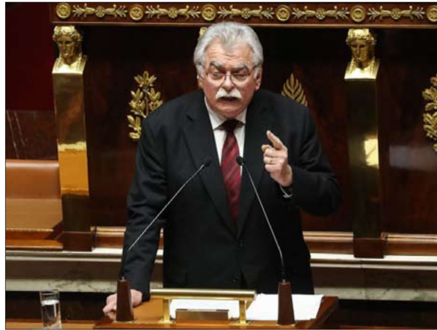
أندريه شاسيني والعودة إلى الأصول

لم تتمكن التيارات المعارضة للقيادة من التوصل إلى اتفاق، ويرتبط تعيين فابيان روسيل بسحب جميع ما يسمى بالقوائم الأرثوذكسية تقريباً - باستثناء القائمة الحالية "حيا الحزب الشيوعي الفرنسي"، ومجموعة من النشطاء من فال دو مارن. وقد أيد جناح "أحياء الحزب