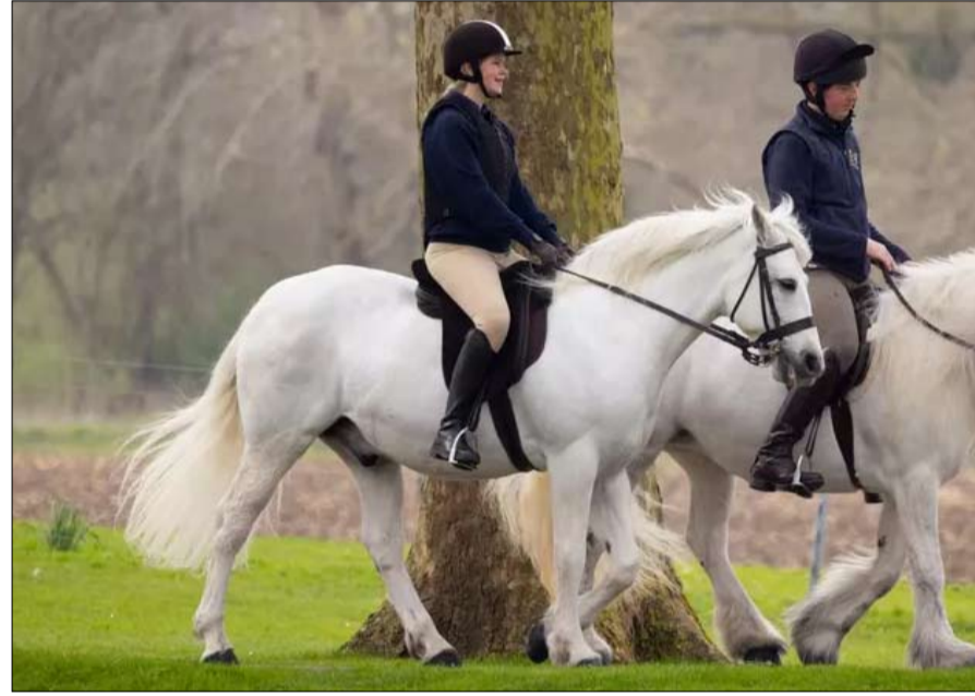
المهور من نصيب الليدي لويز