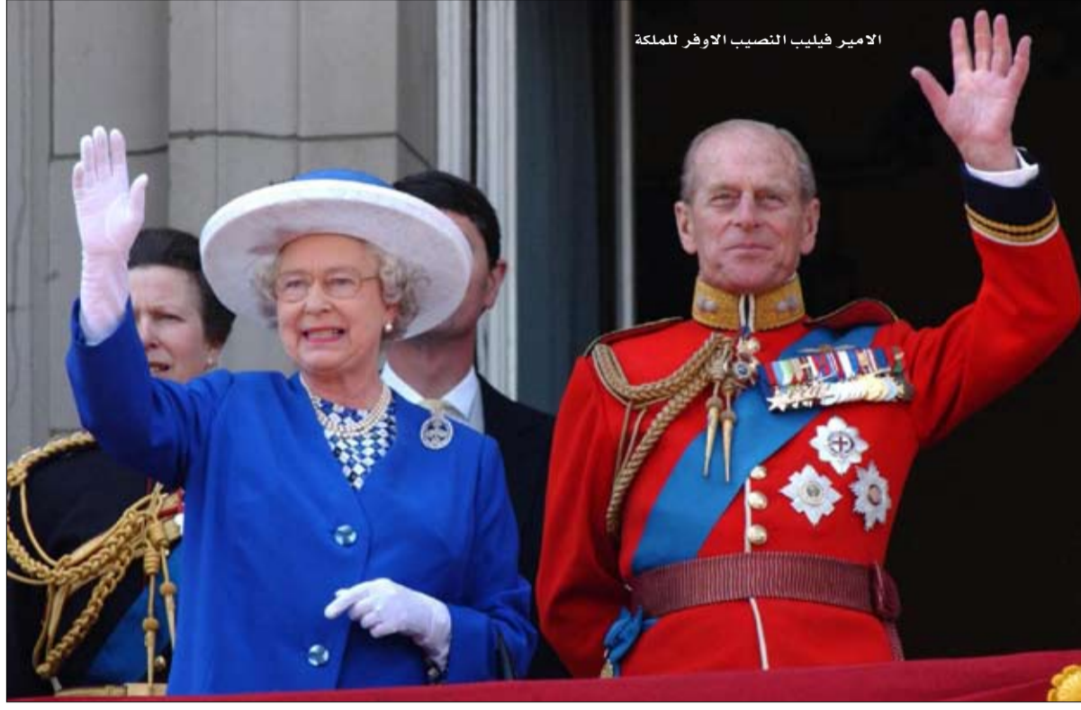
الأمير فيليب النصيب الأوفر للملكة

سجلت بريطانيا أول يوم من دون وفيات بفيروس كورونا منذ 30 تموز/يوليو الماضي بينما تواصل دول عدة تخفيف قيودها الصحية لمنع انتشار وباء كوفيد-19. لكن الوباء يتفاح في جنوب شرق آسيا. وشهد رؤساء منظمة الصحة العالمية ومنظمة التجارة العالمية و صندوق النقد الدولي والبنك الدولي على الحاجة إلى "تحرك عالمي" لضمان توزيع أكثر إنصافاً للقاحات على أمل دحر الفيروس. وفي هذا الإطار، منحت منظمة الصحة العالمية موافقتها الطارئة لاستخدام اللقاح الصيني سينوفاك مما يسمح بإدراجه في نظام "كوفاكس" لتوزيعه في البلدان الفقيرة.