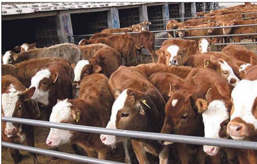
تصدير اللحوم يثير مشكلة داخلية