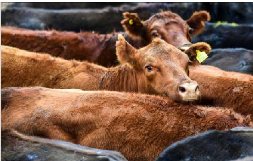
لم تعد الأرجنتين عملاق العالم في اللحوم الحمراء