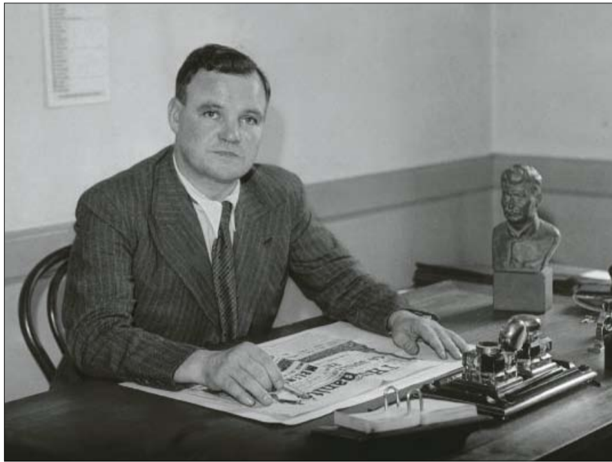
استعادة خطاب موريس ثوريز

متخصص في الأناكثية والشيوعية، من مؤلفاته، "الفضويون والحروب الاستعمارية"، و"القوائم السوداء للحزب الشيوعي الفرنسي"، و"قضية لومانيتيه".