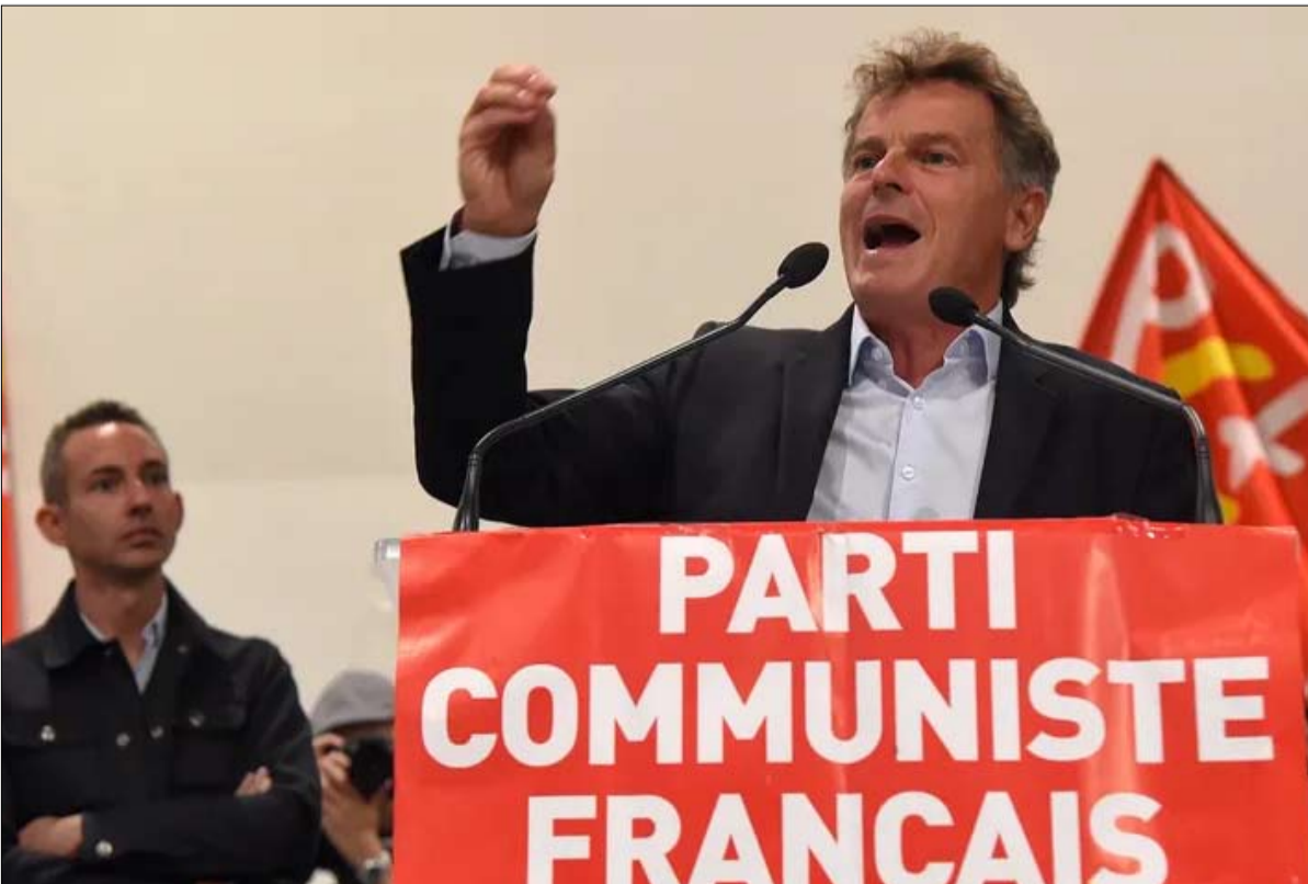
فابيان روسيل مرشح الحزب للرئاسة

دانييل روسيل وريث تقاليد ثوريز ومارشييه، الأمينان العامان الأكثر تأثيراً في تاريخ الحزب