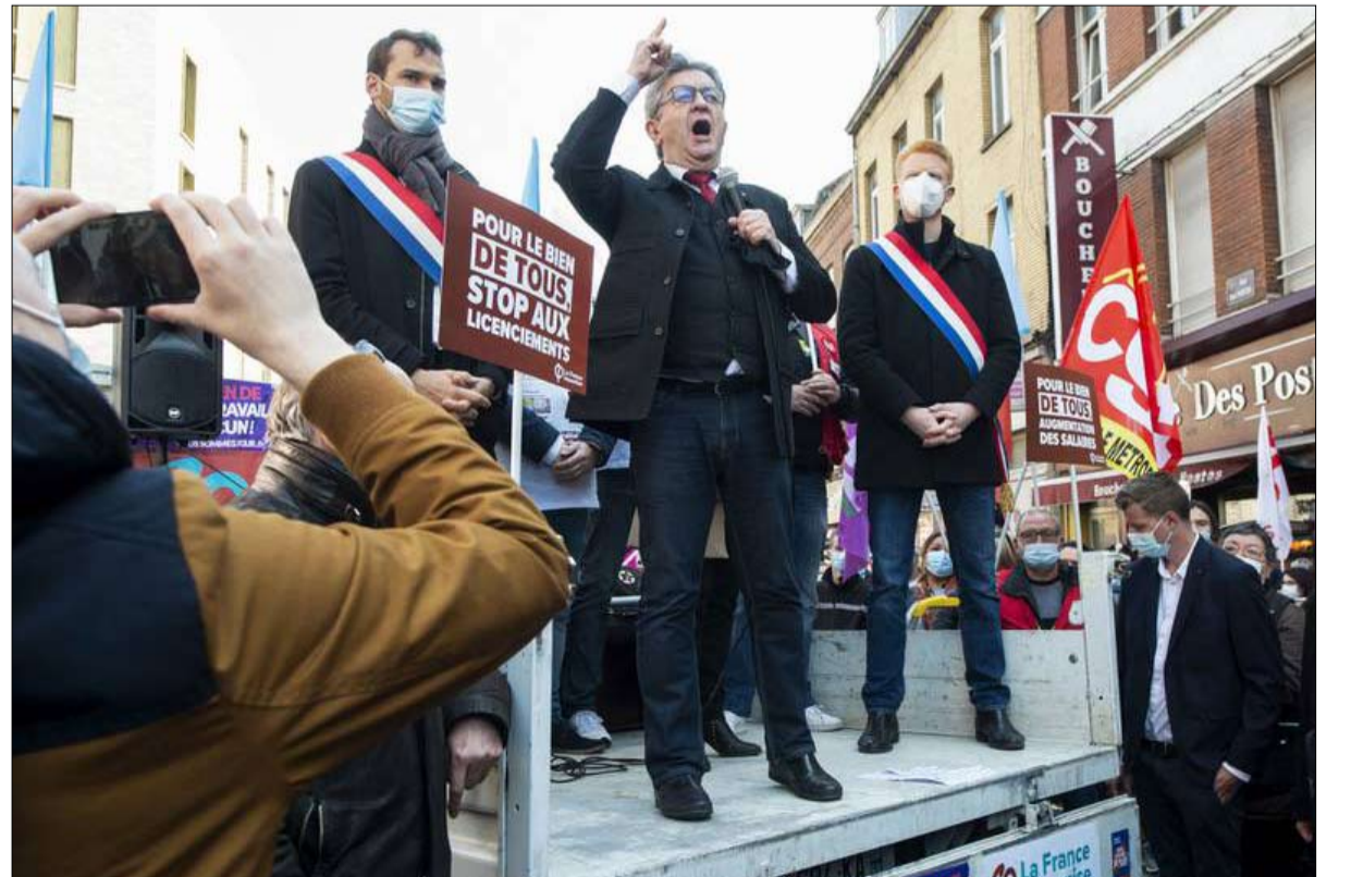
الابتعاد عن دعم جان لوك ميلينشون