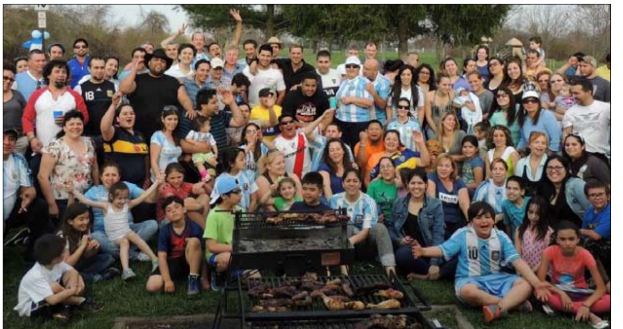
الأرجنتينيون من أكبر مستهلكي اللحوم في العالم

أخيراً، هل المنتج الرئيسي للنظام الغذائي الأرجنتيني باهظ الثمن كما هو الحال في فرنسا، مثلما أكد الرئيس فرنانديز؟ "هذا خطأ تماماً... اللحوم أرخص بكثير في الأرجنتين منها في فرنسا وحتى في الصين، بغض النظر عن طريقة الحساب، مشكلتنا هي الدخل المنخفض بحسب أوردونيز. من جهة أخرى، فإن العضلة بين اللحوم المراد تصديرها وتلك التي سيتم استهلاكها غير موجودة، لأننا هنا نحب القطع التي بها عظام، والمنتجات التي يتم تصديرها خالية من العظام". وتوضح الأسعار الحميمة للقطع الإحدى عشرة الأكثر شعبية الفرق، كيلوغرام اللحم المحروم بسعر 265 بيزو (2.30 يورو) أو لحم البقر المشوي 409 بيزو (3.60 يورو) "2" ولا ينبغي مع ذلك، أن نسيبنا هذا مستوى الحد الأدنى للأجور، الذي لا يصل إلى 30 ألف بيزو شهرياً (264 علامة ثروة هذا البلد، الذي كان يُعتبر حظيرة العالم بين نهاية القرن التاسع عشر وبداية القرن العشرين، فإن اللحوم الحمراء لا تتراجع فقط في الأرجنتين، فقد أضرت الوباء بتجارة الماشية، لصالح إنتاج الطيور.