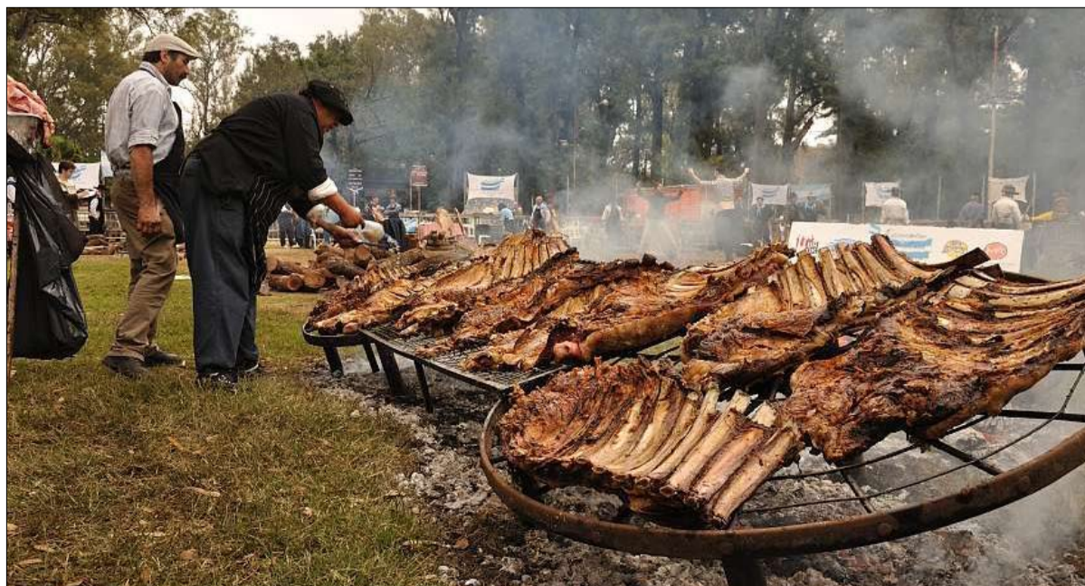
الأسادو احتفالية وثقافة كاملة