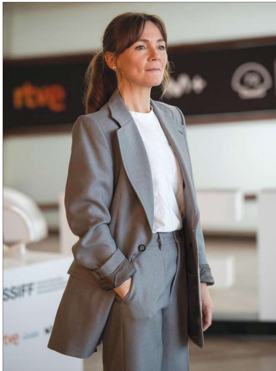
الممثلة الإسبانية ناغوري أزابورو تقف للترويج لسلسل Querer خلال مهرجان سان سيباستيان السينمائي شمال إسبانيا.

يشير سيرغي شكيبتين الأستاذ المشارك في قسم علم التغذية بجامعة التكنولوجيا الحيوية إلى أن الخبراء ينصحون دائما بتناول وجبة إفطار دسمة لأنها تسمح للجسم بحرق السعرات الحرارية. ويقول: "تعتمد هذه التوصية على بعض خصائص عمل الجهاز الهضمي في الجسم. بعد وجبة الفطور تدخل أولى العناصر الغذائية إلى مجرى الدم بكميات كبيرة إلى حد ما. ويحتاج الجسم إلى وقت لهضم الطعام وامتصاص العناصر الغذائية منه. فإذا كانت وجبة الفطور دسمة فسوف يهضمها الجسم خلال النهار. أي أن كمية الطعام ليست الأساس بل محتواه من السعرات الحرارية- حيث أن الجسم يحتاج إلى هضم وامتصاص الأطعمة الغذائية والدهنية إلى فترة أطول". ووفقا له، ينصح في وجبة الفطور تناول 40 بالمتة من إجمالي الأطعمة اليومية، لكي يستطيع الجسم "حرق" جميع السعرات الحرارية. أما الغداء فيجب أن يحتوي على 30 بالمتة والعشاء على 20 بالمتة، وال 10 بالمتة المتبقية هي للوجبات الخفيفة. ومن الأفضل في العشاء تناول أطعمة بروتينية خفيفة لأن هضمها وامتصاصها يتطلب وقتا أقل.