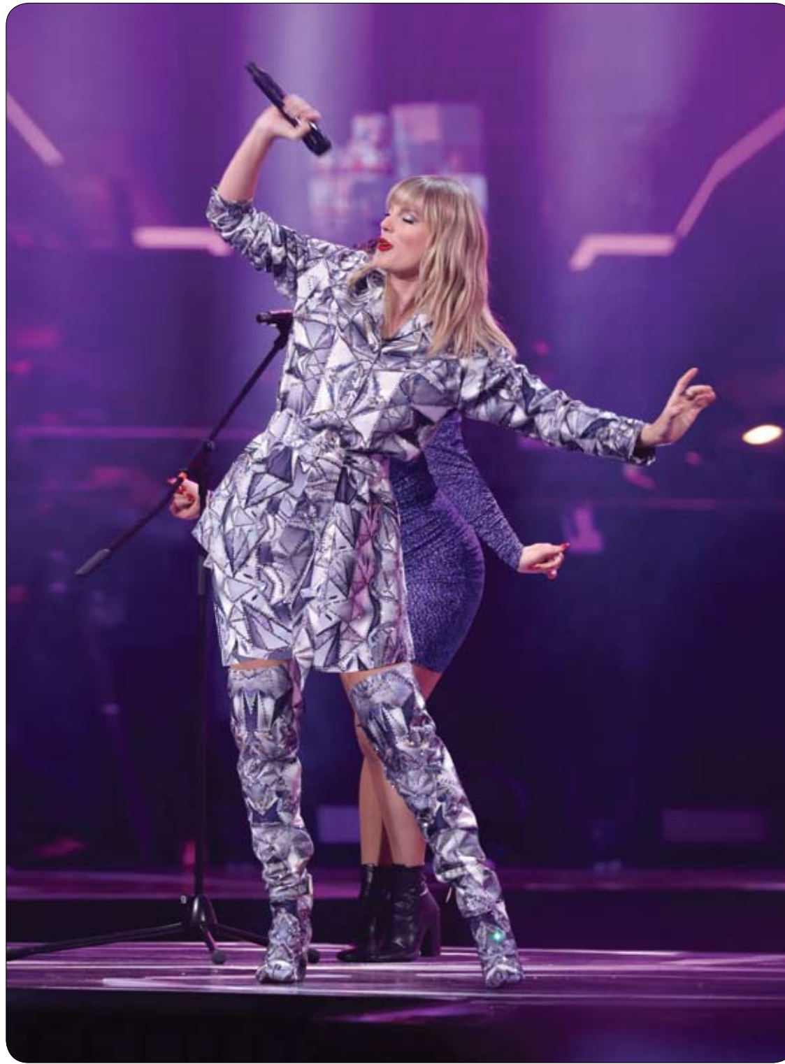
المغنية الأمريكية تايلور سويت في عرض احتفالي لمهرجان التسوق العالمي ليوم 11.11 في شنغهاي، الصين.

الصبغة الحمراء في الكرز تحد من الالتهابات والتورم وآلام المفاصل التي عادة ما تضايق الحامل، كما أن احتواء الكرز على البوتاسيوم يجعل الحامل تحتفظ بالماء، وتضيق ضغط الدم في الجسم، وبالتالي تمنع خطر تسمم الحمل. شرب كوب من عصير الكرز كل يوم يساعد الحامل على التغلب على اضطرابات النوم، وفيتامين "C" الموجود بداخله يقوي الأوعية الدموية، ويساعد على ضخ ما يكفي من الدم إلى الجنين.