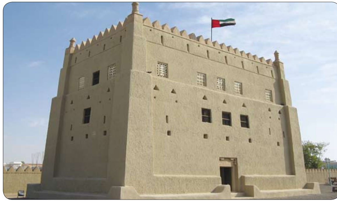
برعاية طحنون بن محمد