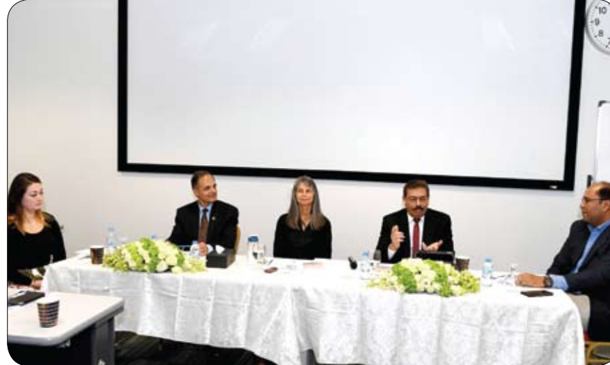
في إطار تعزيز الاستراتيجية الوطنية للتعليم العالي