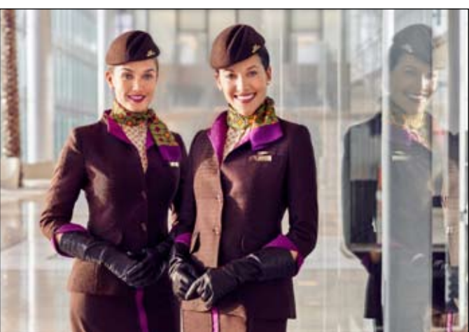
وما بعدهما، فسوف سيتم إعادة الحجز لهم على الرحلات التي تشغيلها الاتحاد للطيران.

2018. وسوف تسهم هذه الرحلات في توفير خيارات أوسع للمسافرين بين العاصمتين أبو ظبي وروما إلى جانب تعزيز خيارات الربط من وإلى الدولتين عبر العاصمة أبو ظبي. كما ستساعد رحلة المغادرة الصباحية من أبو ظبي ورحلة العودة وقت الظهيرة من روما في توفير خدمات ربط سلسة إلى مدن شهيرة في كل من أستراليا والصين واليابان وكوريا. وبفضل الرحلات الإضافية الجديدة، سوف ترتفع رحلات الاتحاد للطيران بين أبو ظبي ومديني روما وميلانو في إيطاليا من رحلتين إلى ثلاث رحلات يومياً. ويهده المناسبة، أفاد بيتر بومفارتنر،