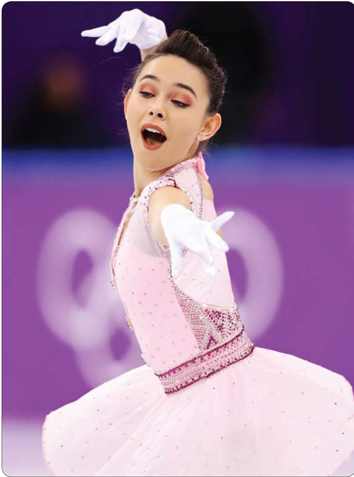
الأسترالية كايلاي كرين تؤدي عرضا خلال بطولة التزلج على الجليد بدورة الألعاب الأولمبية الشتوية في كوريا الجنوبية. (رويترز)

يوصي «العيادي»، بضرورة التوجه للطبيب بمجرد الشعور بطنين الأذن لأن تأخر العلاج أو إهماله يمكن أن يحوله إلى حالة مزمنة، مشيرًا إلى أن بعض الحالات يمكن أن تصاب بنوع من الفيروسات بعصب السمع، الأمر الذي يؤدي إلى طنين الأذن، وإذا تأخر العلاج عن 4 أيام أو أسبوع في هذه الحالة فإنه يؤدي إلى ضعف السمع. يضيف «العيادي»، أن علاج طنين الأذن يختلف حسب السبب، فإذا كان ناتجًا عن وجود شمع في الأذن الخارجية فإن إزالته وتنظيف الأذن يساعد في علاج الطنين، أما إذا كان ناتجًا عن وجود التهاب فيها فلا بد من تناول أدوية مضادة للالتهاب، وفي بعض الأحيان يمكن أن يحتاج المريض إلى تناول أدوية لزيادة تدفق الدم للأذن الداخلية.